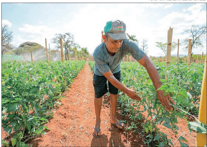
Decreto regulamenta a Lei nº 1.572/1997, que cria o Prat

Após publicar o decreto, o GDF trabalha numa portaria para definir todos os critérios de seleção, áreas e demais termos técnicos para que o programa