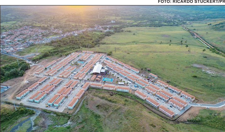
Faixa para a ‘classe média’ tinha sido cobrada por Lula em junho