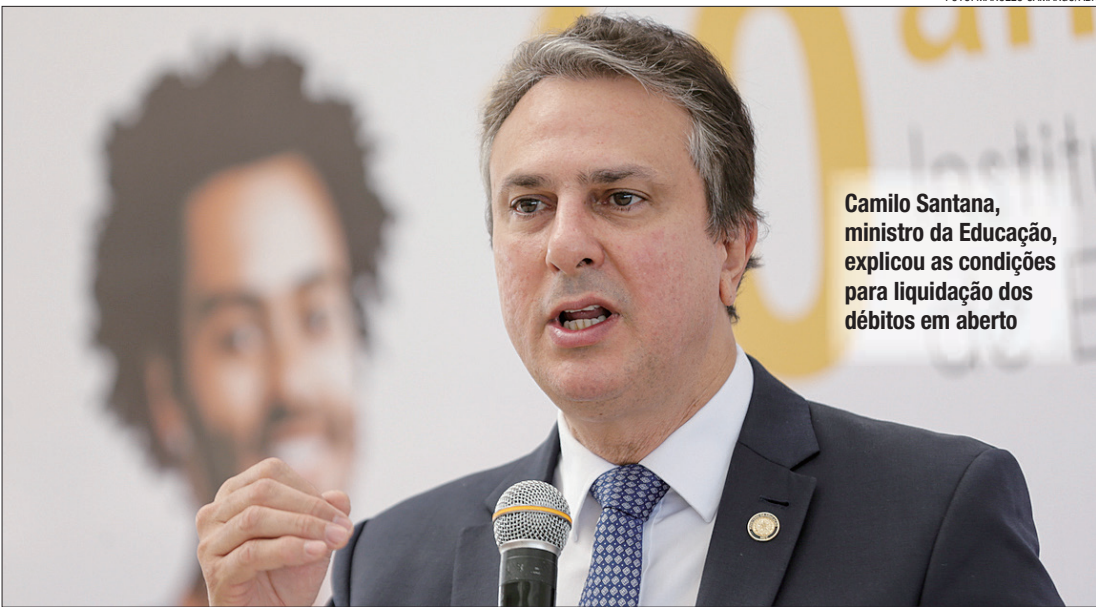
Camilo Santana, ministro da Educação, explicou as condições para liquidação dos débitos em aberto

A Caixa Econômica Federal e o Banco do Brasil começam, nesta terça-feira (7), a renegociar as dívidas de estudantes com o Fundo de Financiamento Estudantil (Fies). Os débitos em atraso poderão ter até 100% de desconto em juros e multas e, no caso de liquidação integral do contrato, o desconto chega a 99% do valor consolidado da dívida. Na semana passada, o presidente Luiz Inácio Lula da Silva sancionou lei que autoriza as renegociações. Nesta segunda-feira (6), o ministro da Educação, Camilo Santana, disse que a preocupação do presidente é dar celeridade aos procedimentos. “São mais de 1 milhão e 240 mil pessoas no Brasil que terão direito e o presidente tem chamado de Desenrola da Educação. Significa R$ 54 bilhões de dívidas desses brasileiros e brasileiras que muitas vezes estão com seu nome comprometido, o nome sujo, né, como se diz, no Serasa, e que terão oportunidade de renegociar suas dívidas. Inclusive, com condições muito favoráveis, podendo chegar até 99% do principal e 100% dos juros e multa, ou seja, a pessoa pode pagar 1% da dívida dependendo da condição que ela esteja”, disse após reunião com Lula, no Palácio do Planalto.