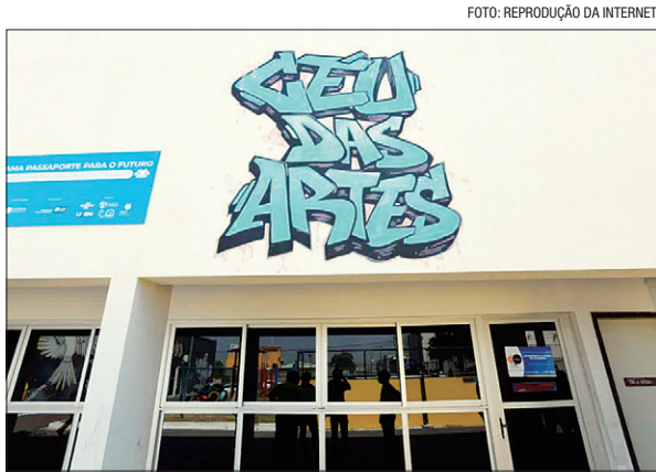
Objetivo é a garantia dos direitos de crianças e adolescentes

O chamamento público prevê parcerias com OSCs sem fins lucrativos e com experiência em execução de projetos sociais e qualificação social por um período de 12 meses. Os recursos destinados também estão previstos no edital.