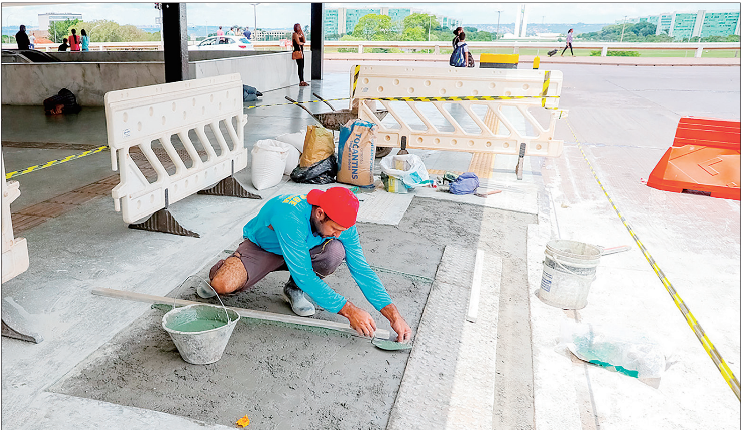
Todas as ações têm o objetivo de oferecer mais segurança às cerca de 700 mil pessoas que transitam diariamente pelo terminal