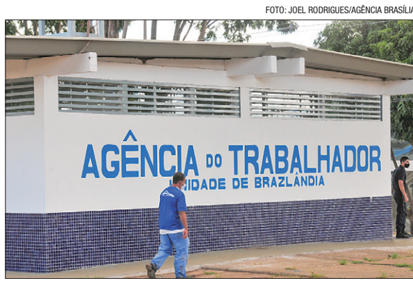
Interessado em uma vaga deve ir à Agência ou acessar o Sine Fácil

Os interessados podem cadastrar o currículo no aplicativo Sine Fácil ou ir a uma das 14 agências do trabalhador, das 8h às 17h, durante a semana. Mesmo que nenhuma das chances do dia seja atraente ao candidato, o cadastro vale para oportunidades futuras, já que o sistema cruza dados dos concorrentes com o perfil que as empresas procuram.