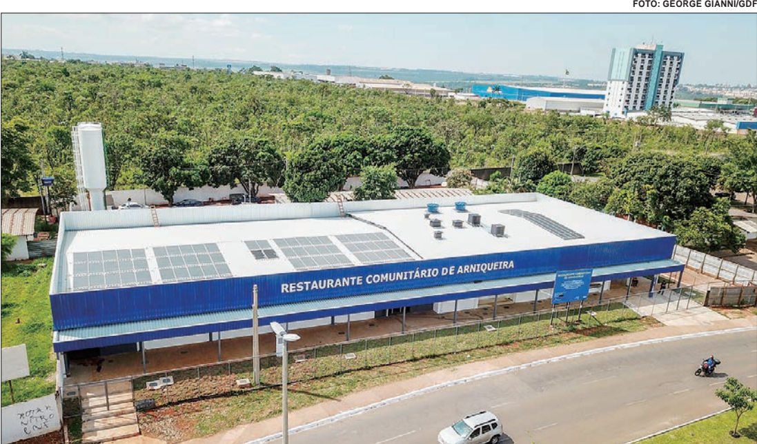
A 16ª unidade, localizada na Arniqueira, vai oferecer almoço a R$ 1 e café da manhã e jantar a R$ 0,50, cada

O governador Ibaneis Rocha (MDB) inaugurou, na manhã desta terça-feira (7/11), o Restaurante Comunitário de Arniqueira. A unidade tem capacidade para atender até 3,6 mil pessoas por dia, com café da manhã, almoço e jantar, ao custo total de R$ 2, todos os dias da semana. O governador do DF comemorou a entrega: “Sem dúvida nenhuma o Restaurante Comunitário é um excelente meio de distribuição de alimentação e garantia de segurança alimentar para a população. Essa inauguração nos deixa muito feliz. Aqui é uma região muito carente e muito necessária e nós temos um olhar bastante atencioso a essa região. A Secretaria de Desenvolvimento Social está trabalhando para garantir a segurança alimentar das famílias do Distrito Federal”. “Entregamos uma obra totalmente restaurada, com excelente cozinha, nutricionista e qualidade de alimentos para os moradores dessa região”, destacou o governador. Em relação ao desenvolvimento de Arniqueira, o governador reforçou: “Nós transformamos Arniqueira em uma cidade, e estamos trazendo todos os equipamentos para a região. Assinamos hoje uma