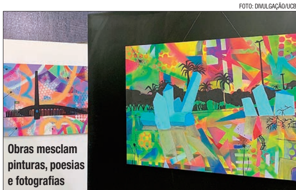
Obras mesclam pinturas, poesias e fotografias

A Biblioteca Central da UCB, localizada no campus Taguatinga, recebe todo mês uma nova exposição artística em seu espaço cultural. São pinturas, desenhos, esculturas, artesanato, maquetes, entre outras obras com o intuito de valorizar os artistas locais e expor a riqueza de suas produções. Acompanhe a programação do espaço por meio da página da biblioteca no Instagram @ucbbiblioteca.