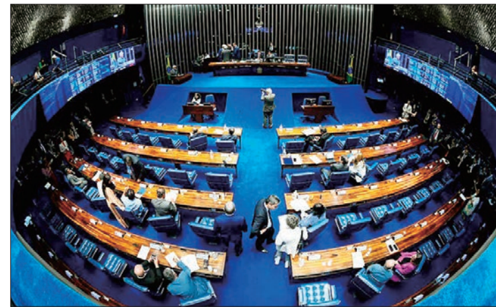
A audiência temático no Senado será nesta segunda (15), a partir das 14h