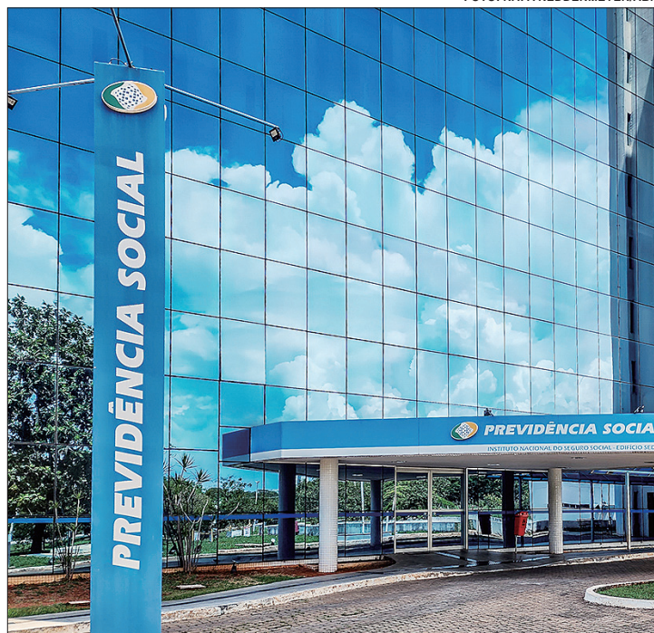
Meta do governo é reduzir o tempo médio de concessão para 30 dias

a gestão federal fez da diminuição do tempo médio uma promessa de governo. Desde o presidente do INSS, Alessandro Stefanutto, ao ministro da Previdência, Carlos Lupi, quadros governo divulgaram de maneira reiterada ações para perseguição desta meta.