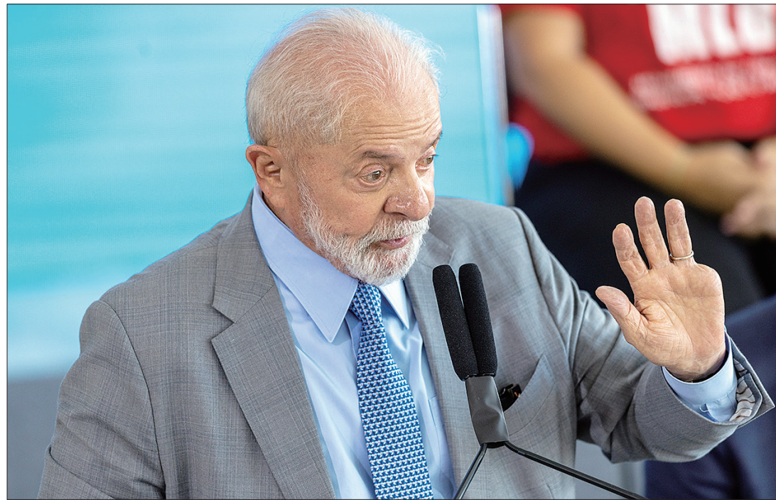
Dois vetos de Lula estão na mira: bloqueio de R$ 5,6 bilhões em emendas e veto parcial ao PL das "saidinhas"

A inclusão de um jabuti (jargão do Legislativo para um tema que não tem relação direta com o tema inicial da proposta) no projeto de lei do retorno do Seguro Obrigatório para Danos Pessoais por Veículos Automotores Terrestres (DPVAT) pode facilitar a negociação. O jabuti consiste na antecipação de espaço fiscal no Orçamento para uso a partir de