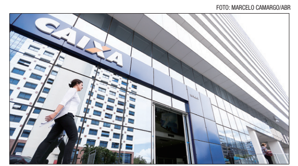
Ao todo, serão pagos cerca de R$ bilhões neste mês de abril

O valor do abono é proporcional ao período em que o empregado trabalhou com carteira assinada em 2022. Cada mês trabalhado equivale a um benefício de R$ 117,67, com períodos iguais ou superiores a 15 dias contados como mês cheio. Quem trabalhou 12 meses com carteira assinada receberá o salário mínimo cheio, de R$ 1.412.