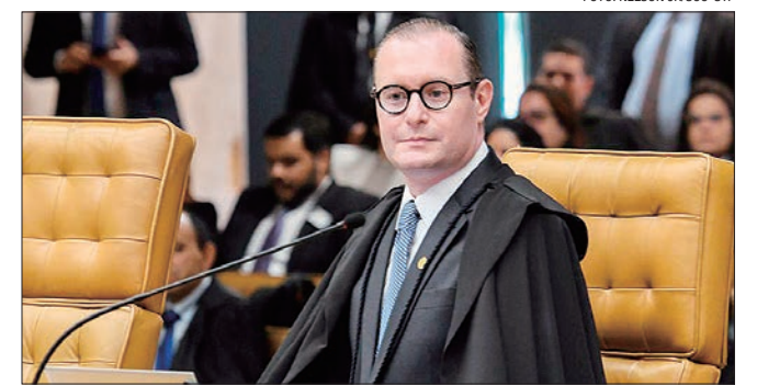
À época, Zanin, como advogado, fazia parte da equipe de defesa de Lula

O valor da multa foi fixado em R$ 70 mil, por corresponder ao dobro do valor desembolsado para impulsionar o conteúdo, que foi de R$ 35 mil.