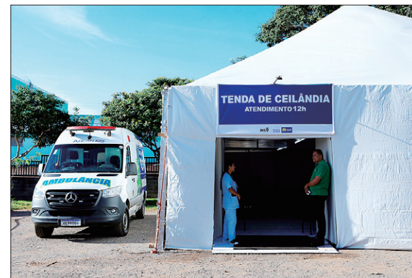
Estrutura de acolhimento irá atender diariamente, das 7h às 19h