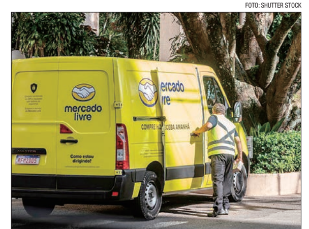
Compromisso da empresa é investir mais de R$ 23 bi no País

O setor de tecnologia no Brasil, área com see em Florianópolis, tem expectativa de contratação de 875 funcionários, elevando o número de pessoal para 4.500 até o final do ano.