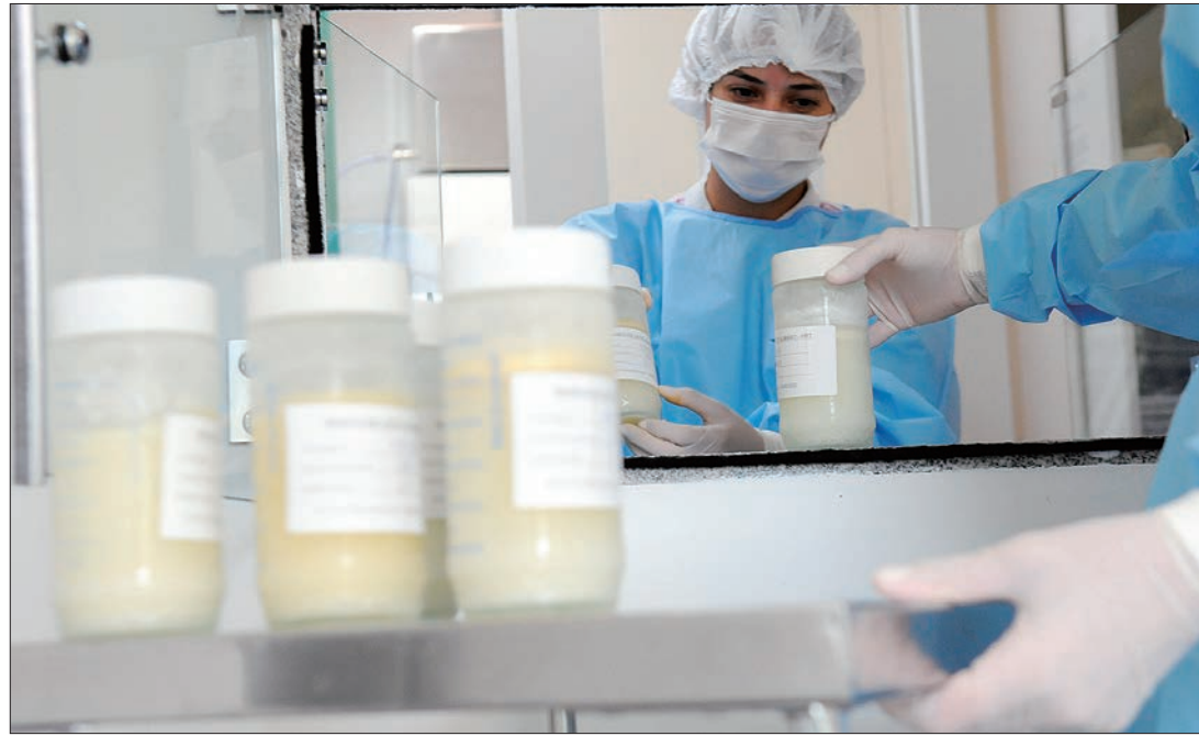
Competição é uma iniciativa da Rede Global de Bancos de Leite Humano, organização capitaneada pelo Brasil