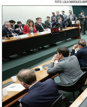
Proposta precisa ser aprovada pelo Congresso Nacional

Em 2027, o espaço reservado é de R$ 45,9 bilhões e, em 2028, de