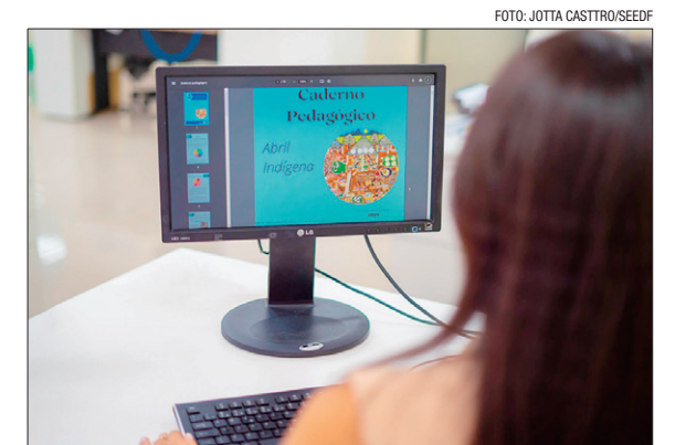
Material tem mapeamento dos indígenas matriculados na rede pública do DF

O caderno divulgado para todas as unidades escolares também fornece sugestões de materiais pedagógicos para o trabalho e valorização da história e cultura indígena, como livros, filmes, documentários, músicas e podcasts. O intuito é fortalecer as ações pedagógicas que contribuem na construção de uma escola plural.