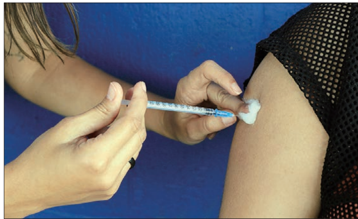
Evento será realizado no Setor Hoteleiro Sul, na quarta (17) e na quinta (18)

“O evento apresentará as ações e os resultados obtidos no Monitoramento Rápido de Vacinação e na estratégia de vacinação nas escolas, que é uma parceria da SES-DF com a Secretaria de Educação. A