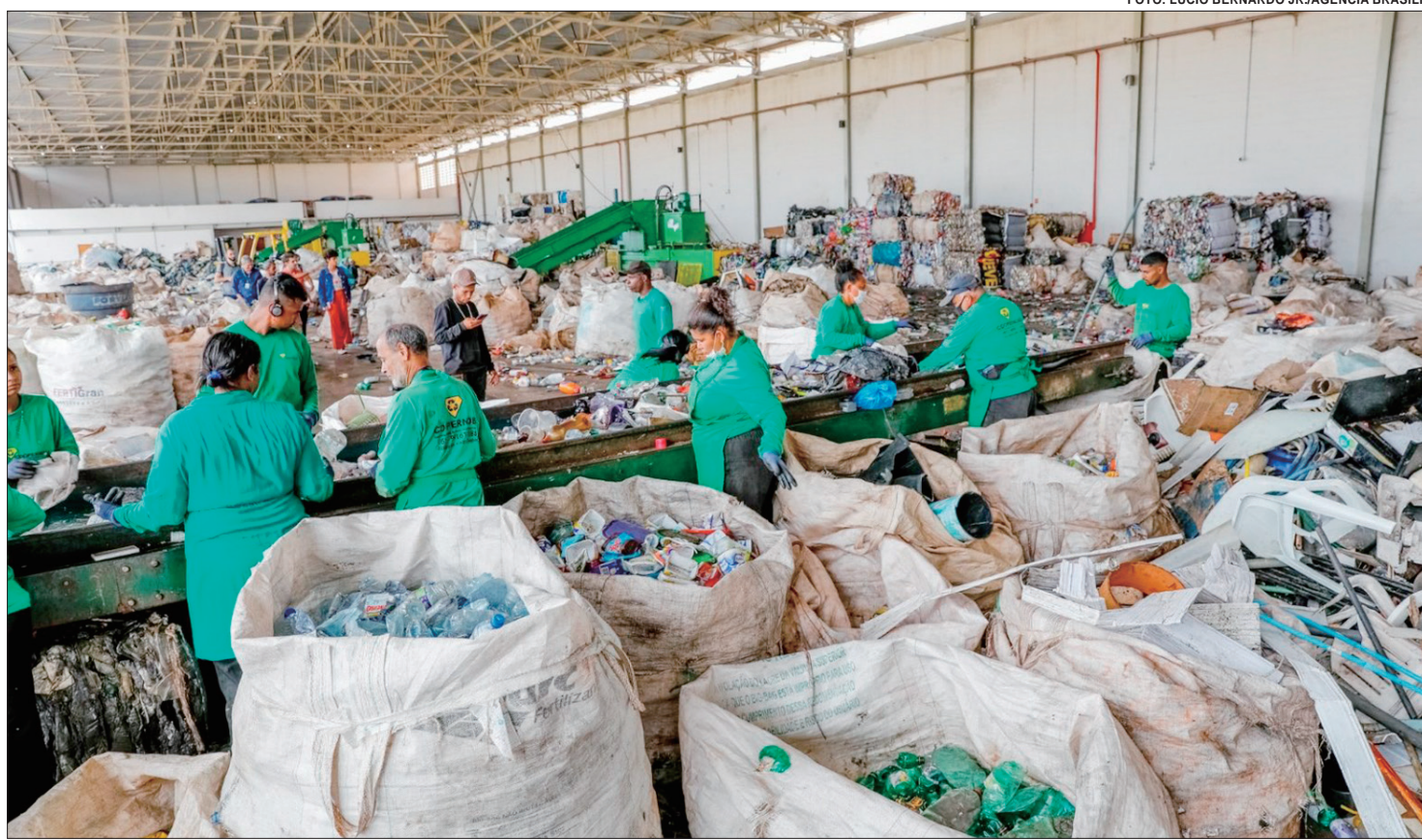
Proposta apresentada pelo GDF, por meio da Secretaria da Família e Juventude, institui a Política Distrital de Fortalecimento das Cooperativas de Catadores