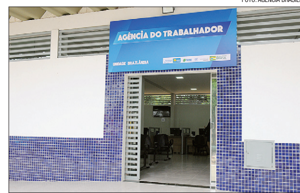
Interessado em uma vaga deve ir à Agência ou acessar o Sine Fácil