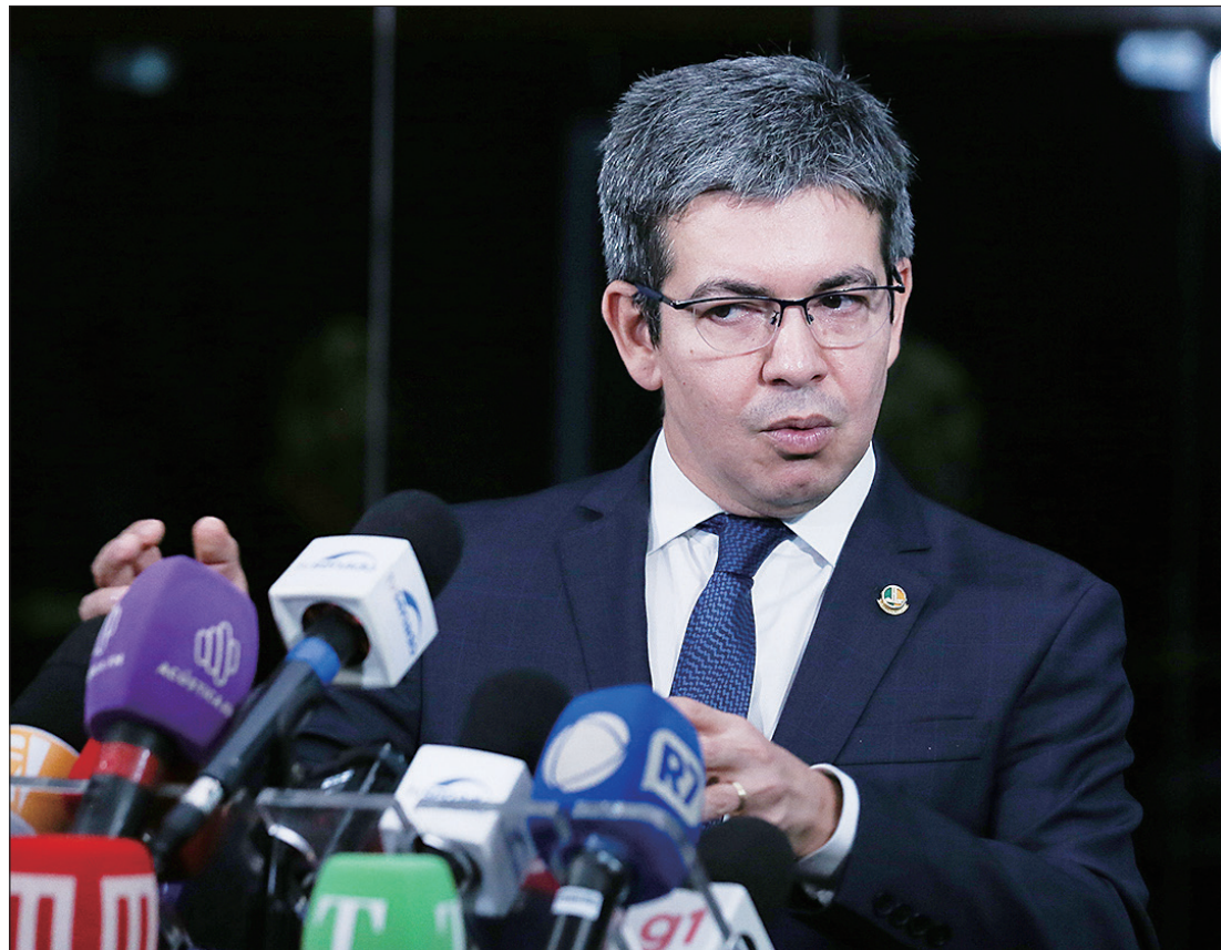
O senador Randolfe Rodrigues (sem partido-AP), líder do governo, confirmou o adiamento da sessão

Uma suposta solução já foi apresentada pelo governo, ainda que parcial. Mas, para muitos parlamentares, o ponto principal da primeira sessão de vetos de 2024 é exatamente analisar os vetos relacionados às leis orçamentárias. Assim, a sessão esperada para essa semana poderia