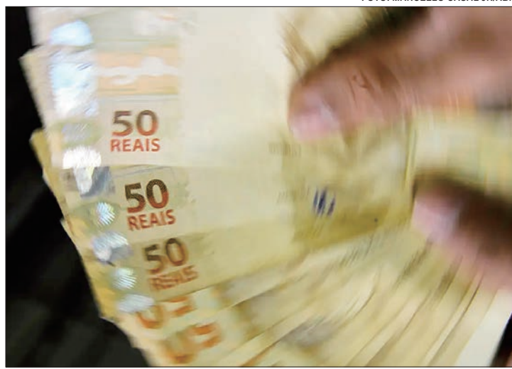
Previsão para 2026 é que o salário mínimo seja de R$ 1.582; e R$ 1.676 para 2027

O valor do mínimo tinha sido confirmado mais cedo pelo ministro da Fazenda, Fernando Haddad, em entrevista à emissora de televisão GloboNews. No entanto,