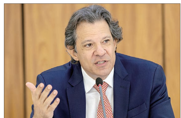
Haddad vem cobrando pacto entre os Poderes na gestão das contas públicas

O PLDO de 2025 propõe medidas de revisão de gastos no Instituto Nacional do Seguro Social (INSS) e nas indenizações do Programa de Garantia da Ativi-