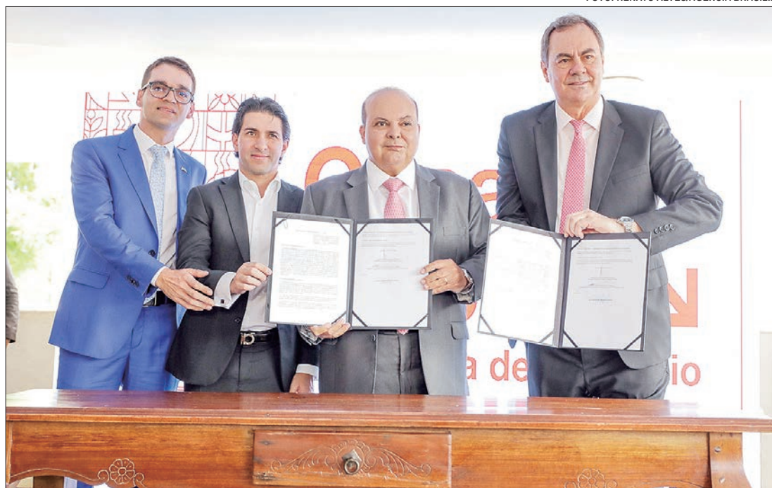
Ibaneis Rocha: “É uma grande entrega para o DF, fruto de mais uma parceria com o setor privado”

Ao assinar o acordo, previsto para durar inicialmente dois anos – podendo chegar a até dez –, o governador Ibaneis Rocha destacou a importância do espaço para a Praça dos Três Poderes, um dos cartões postais mais icônicos da capital.