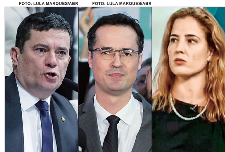
Trio atuou com objetivo de criar entidade “para atender interesses privados”

O senador Sergio Moro afirmou, por meio de nota, que todos os valores foram devolvidos