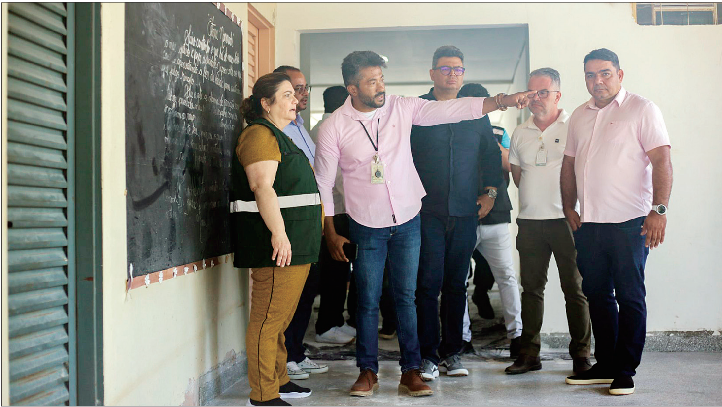
A unidade faz acompanhamento a mais de 300 pacientes e tem porta aberta a moradores de Planaltina, Arapoanga, Fercal, Sobradinho e Sobradinho II