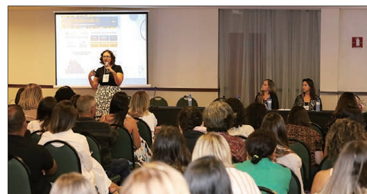
Razões do aumento de casos e importância da imunização foram reforçadas

Devido ao cenário de epidemia, a vacinação surge como uma forma de prevenção a longo prazo, conforme destacou a médica alergista e imunologista do Hospital da