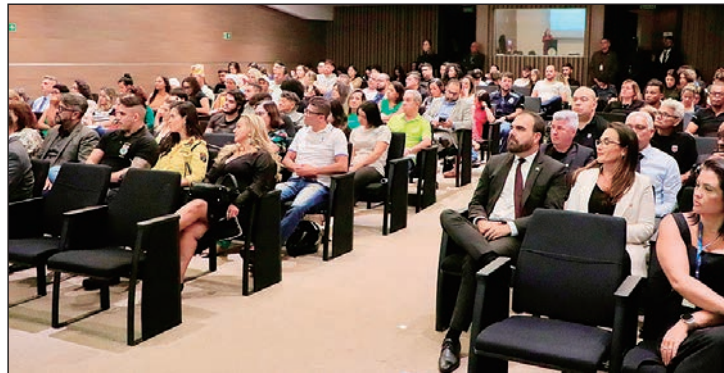
Objetivo do encontro é preparar lideranças para encaminhamento de vítimas

Durante o encontro, foram apresentados diferentes temas relativos à proteção da mulher e ao enfrentamento da violência doméstica aos participantes, entre representantes de instituições, alunos e professores da instituição de ensino.