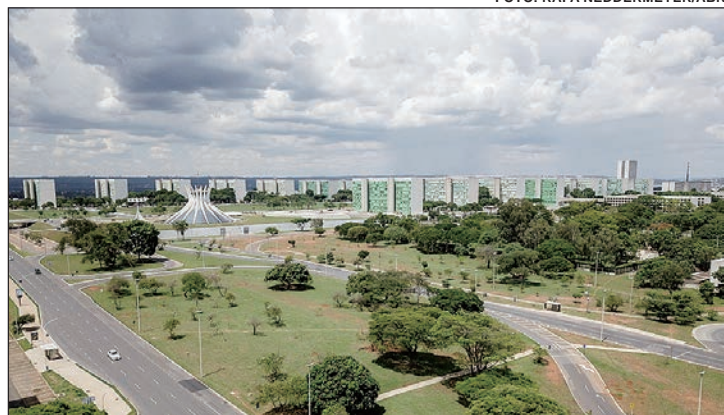
Cronograma prevê datas de liberação das duas parcelas do 13º salário

Como é padrão, os funcionários públicos recebem o adiantamento de 50% da Gratificação