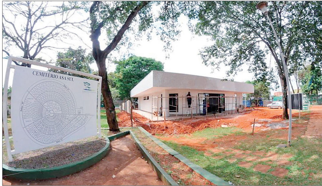
Nova estrutura amplia ações da Sejus quanto aos serviços funerários, além dos seis cemitérios da capital