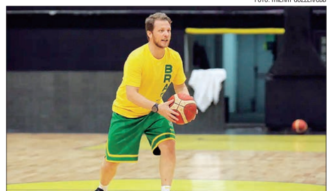
Técnicô sai quando faltam 100 dias para os Jogos de Paris