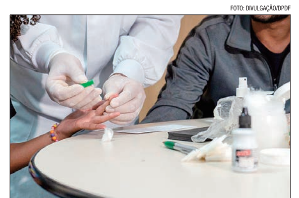
Unidade Móvel da DPDF ainda fará serviço jurídico e psicológico

O projeto Paternidade Responsável, desenvolvido pela Subsecretaria de Atividade Psicossocial da Defensoria Pública do Distrito Federal (Suap/DPDF), incentiva o reconhecimento voluntário da paternidade, proporcionando exames de DNA sem custos para os usuários, desde que consentido por ambas as partes.