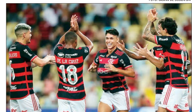
Partida aconteceu ontem (17) no estádio do Maracanã