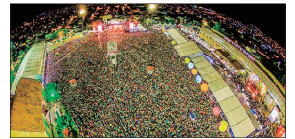
Calendário será montado a partir de informações das cidades

“São festas e eventos que marcam os diversos calendários municipais e que poderão atrair mais turistas, desenvolvendo, inclusive, regiões menos conhecidas deste nosso país, de dimensões continentais”, disse o relator.