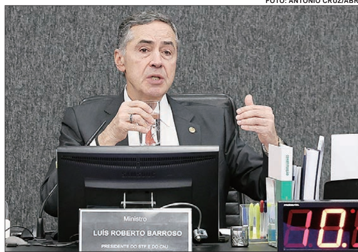
Aproximação de Barroso com o Legislativo visa distensionar o clima

O telefonema ocorreu logo após conversa entre o presidente da Câmara dos Deputados e o ministro Alexandre de Moraes.