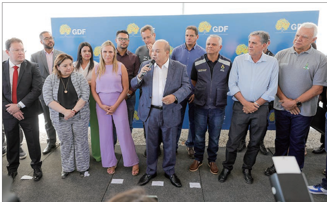
Governador Ibaneis Rocha: "Temos necessidade de ampliar nossa rede de serviços e é o que estamos fazendo"

A construção, que vai gerar 250 empregos diretos e cerca de 500 indiretos, será essencial para complementar a rede do Sistema Único de Saúde (SUS). Dados do Instituto de Pesquisa e Estatística do DF (IPEDF) apontam a necessidade da criação de leitos hospitalares na região, onde mais de 83% da população depende do SUS.