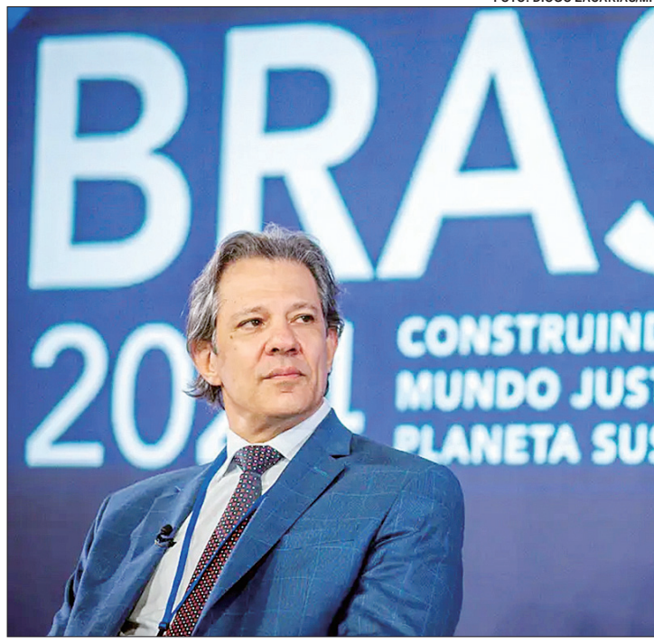
Até sexta, Haddad participa da reunião de primavera do FMI e do Banco Mundial

Apesar do aparentemente entrosamento, o ministro da Fazenda disse ser necessário que os países do G20 tratem o assunto como prioridade nos próximos anos. Segundo Haddad, é preciso haver coordenação internacional porque a taxa por apenas um país seria ineficaz e criaria