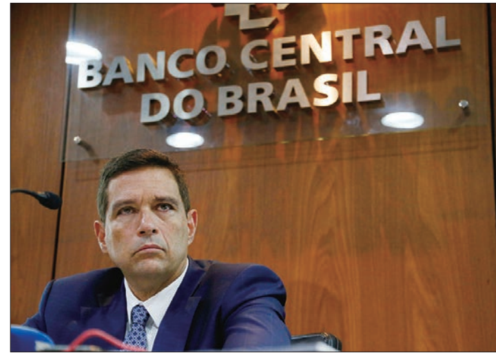
Em evento no FMI, Roberto Campos Neto diz que incerteza é bem maior agora

cou alta nos juros de curto prazo e uma onda de revisões para a taxa final de juros em 2024.