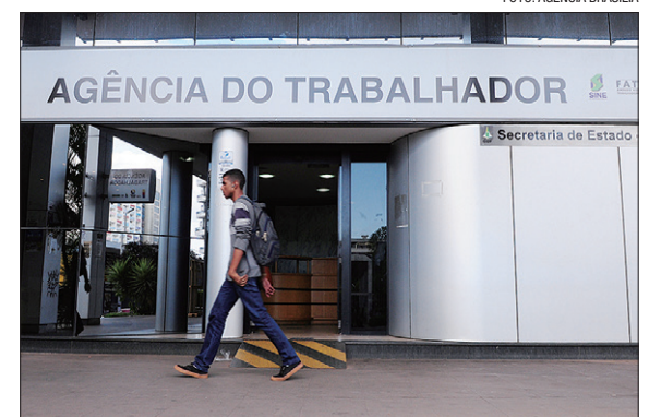
Interessado em uma vaga deve ir à Agência ou acessar o Sine Fácil