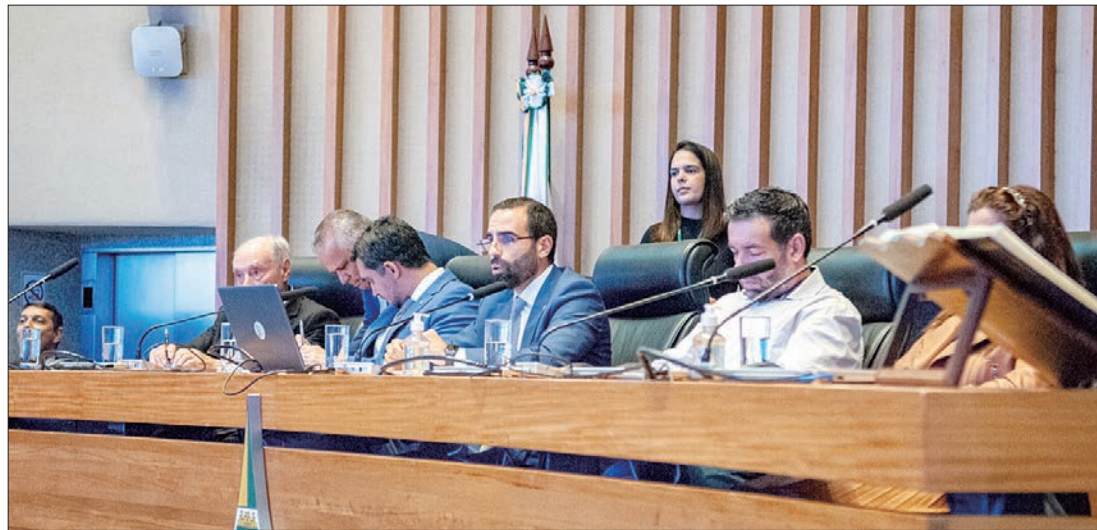
A comissão geral foi promovida pela Comissão de Constituição e Justiça sob a presidência do deputado Thiago Manzoni (PL)

A expectativa, de acordo com o liberal, é assegurar segurança jurídica “para que Brasília se desenvolva, cresça, com os cidadãos sabendo quais são as regras do jogo e os parâmetros válidos para esse desenvolvimento e crescimento”.