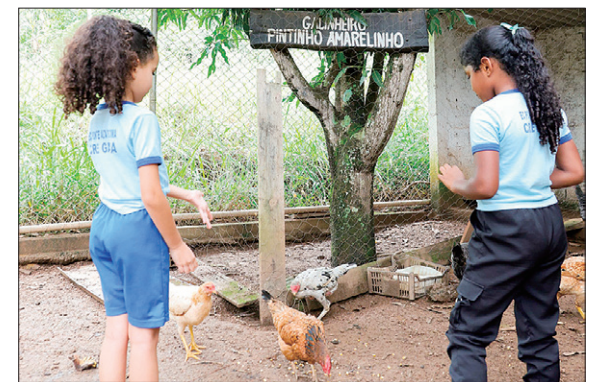
Servidores participam de ações voltadas para as escolas rurais