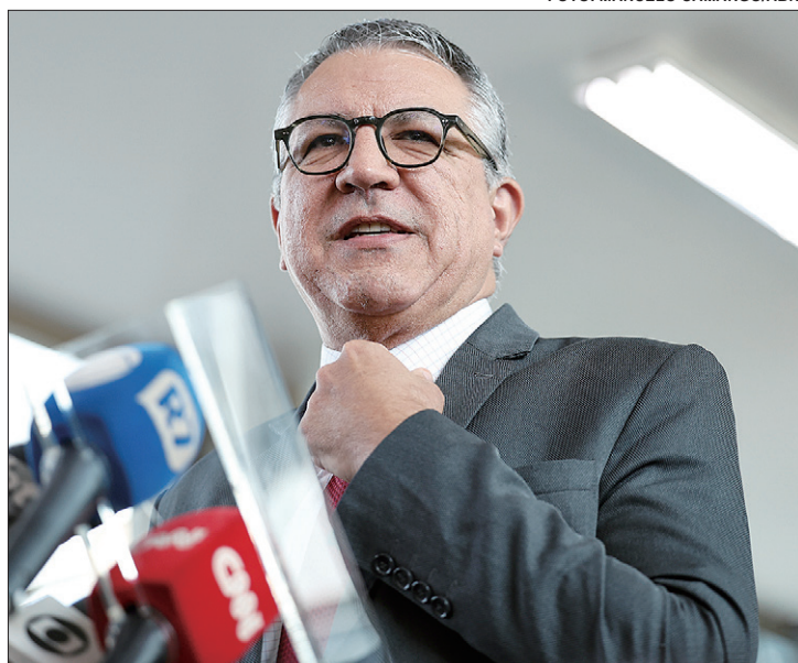
Após embate com Lira, governo devolve função a Alexandre Padilha

O Centrão articulou, no fim do ano passado, um modelo de comunicação direta entre