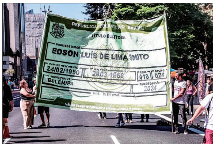
Dados do documento são de Edson Luís, estudante morto na ditadura

Essa é uma discussão importante de se fazer, segundo o sociólogo, com a juventude de