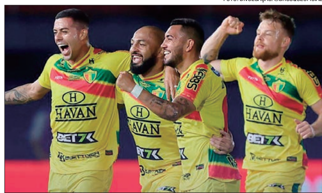
Atuando em casa, o Brusque iniciou a partida em vantagem