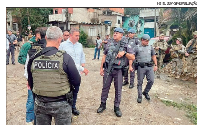
Operações recentes conduzidas pelo MP não contaram com a Polícia Civil

De acordo com o senador Romário (PL-RJ), relator da CPI, o motivo para o convite foram as declarações de Textor à imprensa de que possui provas sobre casos de manipulação de resultados envolvendo diversas partidas de futebol das séries A e B do campeonato brasileiro, de de que estaria disposto a compartilhá-las com autoridades competentes.