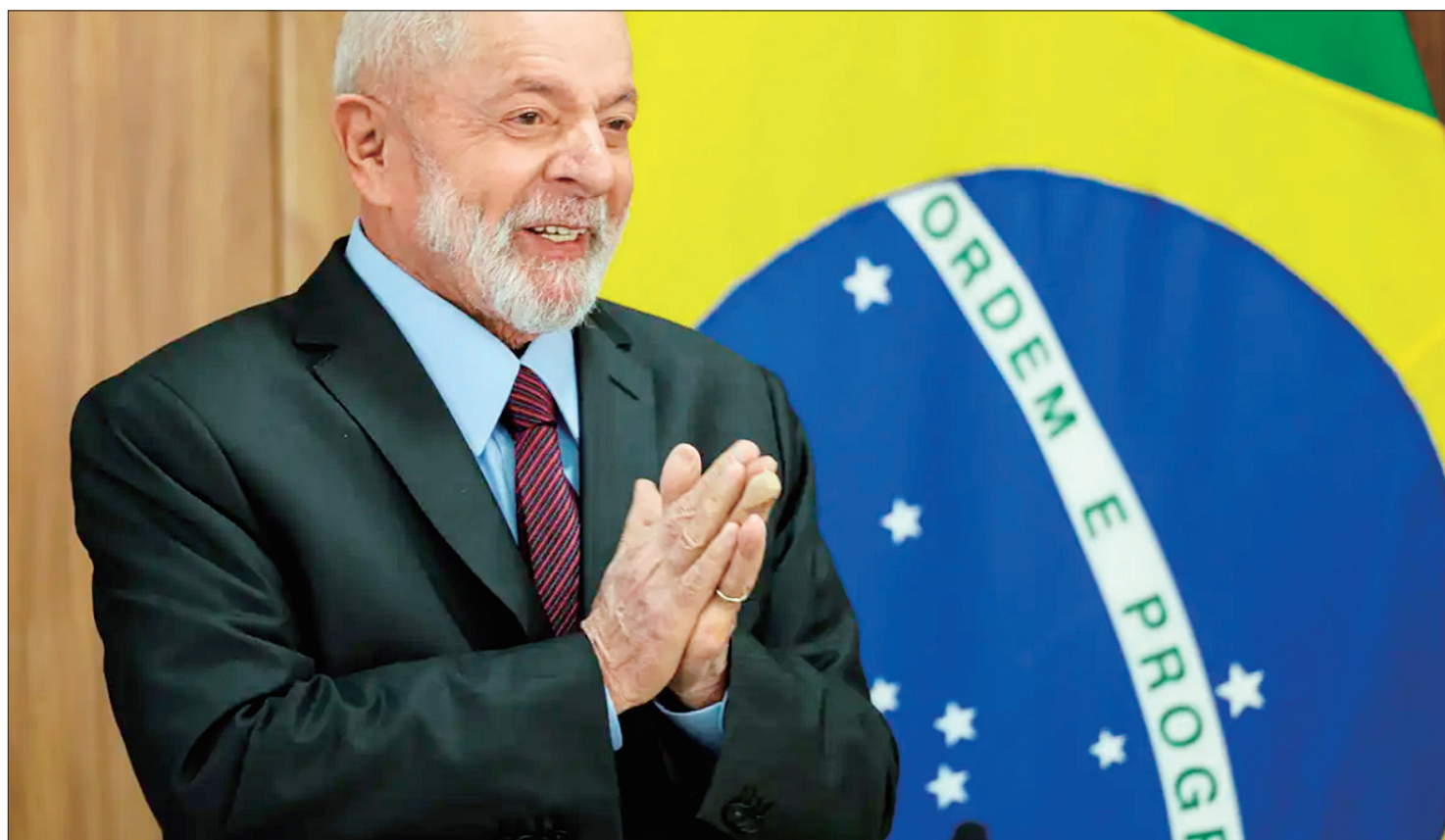
“Os setores de esquerda, os setores progressistas, os setores democráticos têm que se organizar, têm que se preparar”

Segundo o presidente brasileiro, hoje, centenas de pessoas estão pre-