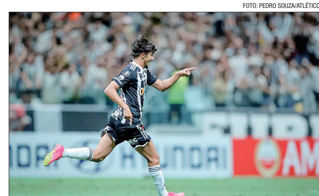
Galo mantém 100% de aproveitamento na competição continental