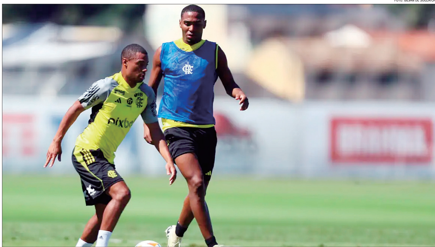
Rubro-Negro terá pela frente justamente o líder da classificação, a equipe boliviana, que até aqui, conta com seis pontos

O Flamengo tem o seu maior desafio na atual edição da Copa Libertadores até aqui, subir os 3.640 metros de altitude de La Paz para encarar o Bolívar (Bolívia) no estádio Hernando Siles, nesta quarta-feira (24) a partir das 21h30 (horário de Brasília). A Rádio Nacional transmite o jogo válido pela 3ª rodada da fase de grupos da competição.