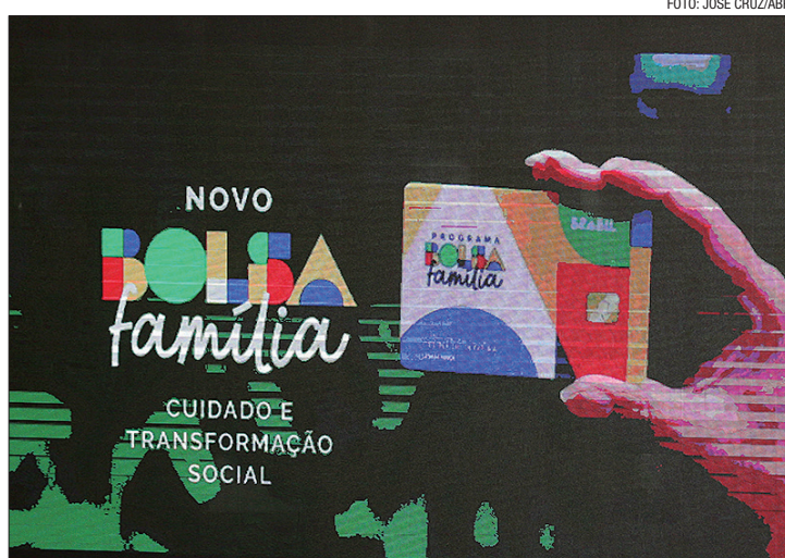
Auxílio-gás (R$ 102) também é pago nesta quarta para beneficiários de NIS final 6

O Bolsa Família também paga um acréscimo de R$ 50 a famílias com gestantes e filhos de 7 a 18 anos e outro, de R$