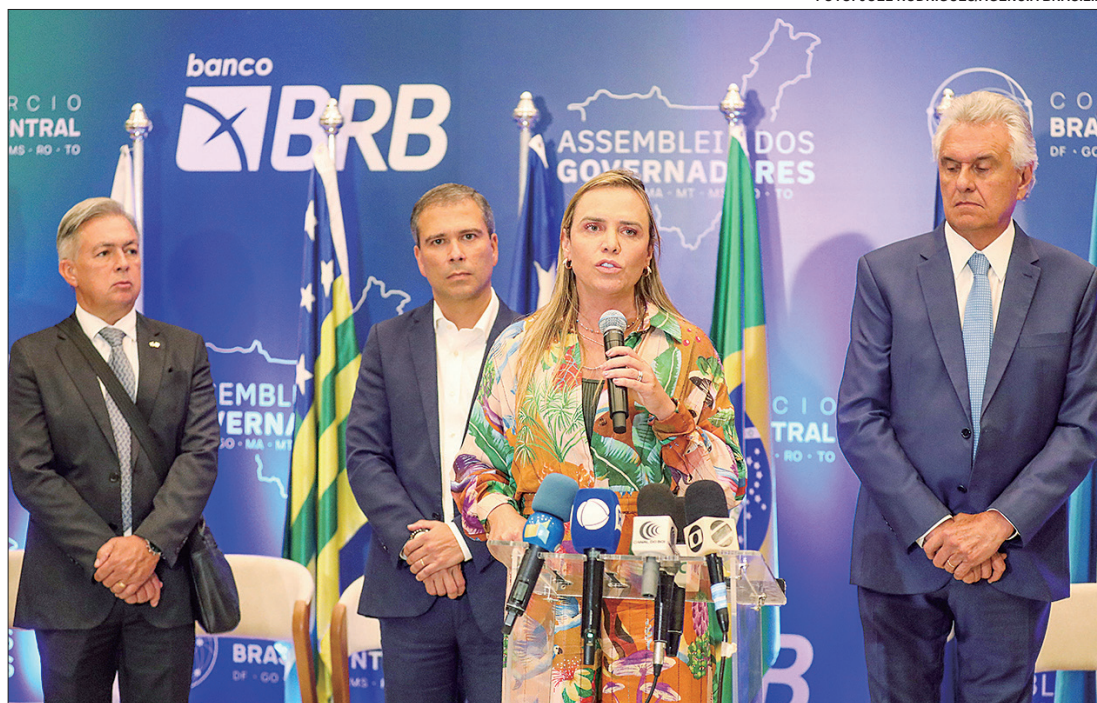
Autoridades também anunciaram a realização de prêmio de Boas Práticas e novo acordo técnico com a ONU

Para Celina Leão, as medidas anunciadas demonstram o empenho do DF e dos outros estados em promover segurança pública para seus moradores. Ela destacou que o financiamento permitirá a aquisição de equipamentos por valores mais baixos do que o usual. “Alguns itens que são comprados de forma coletiva ficam mais baratos.