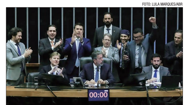
Renúncia fiscal do Perse foi acordada com Ministério da Fazenda

O líder do governo, José Guimarães, garantiu que o governo manterá os R$ 15 bilhões e informou que a redução no número de atividades beneficiadas foi solicitada pelos líderes da Câmara, e não pelo governo.