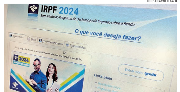
Receita Federal espera receber 43 milhões de documentos neste ano

Em maio do ano passado, o governo elevou a faixa de isenção para R$ 2.640, o equivalente a dois