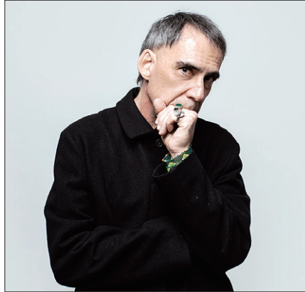
Arnaldo Antunes celebra seus mais de 40 anos de carreira e recebe Carlinhos Brown para uma participação especial