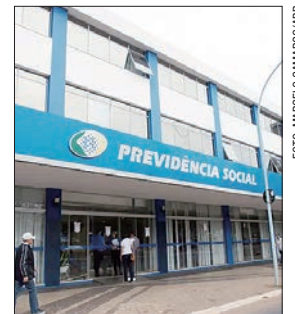
Até 8/5, 33,6 milhões de pessoas receberão 1ª parcela

Quem não tiver acesso à internet pode consultar a liberação do décimo terceiro