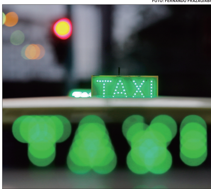
A medida, se aprovada no plenário, beneficiará também motoristas de aplicativos

Atualmente, taxistas e motoristas de aplicativo têm um desconto de 40% sobre a tributação