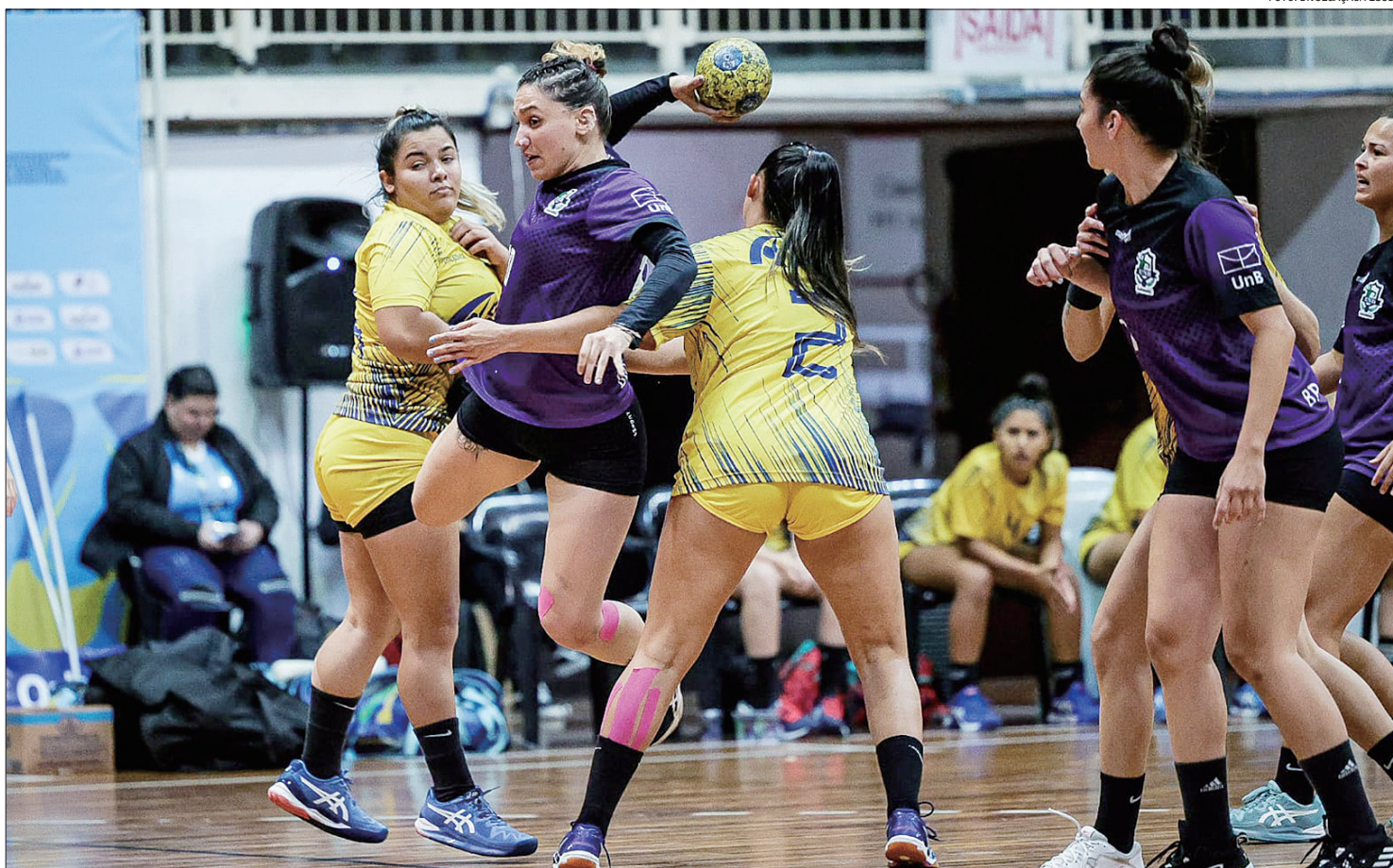
Os Jogos Universitários do DF são uma vitrine para talentos esportivos do Distrito Federal; competição define participantes dos Jogos Brasileiros