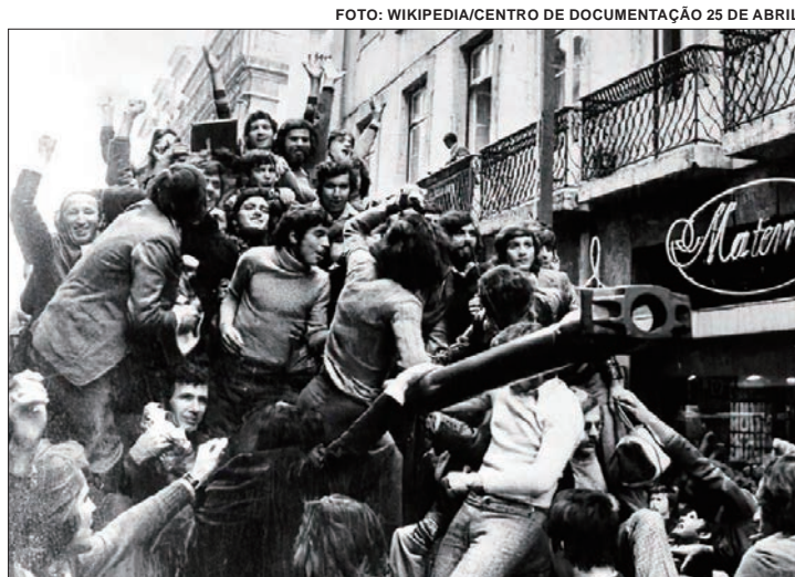
Presidente prestigia 50 anos do movimento contra ditadura portuguesa

O movimento, que teve adesão em massa da população, democratizou o país europeu e abriu caminho para uma série de avanços sociais e políticos desde então. O símbolo foi a distribuição de cravos vermelhos aos soldados, que os colocaram nos canos dos fuzis, por isso a referência do nome.