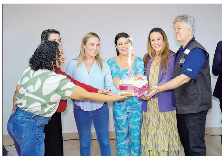
Comemoração contou com música, atendimentos de saúde e beleza para elas

Localizada em Ceilândia, a Casa da Mulher Brasileira é um espaço que oferece acolhimento e atendimento humanizado para mulheres em situação de violência. A vice-governadora Celina Leão reforçou o compromisso do GDF com o público feminino: "As mulheres têm a Casa como referência de apoio e suporte para que elas possam