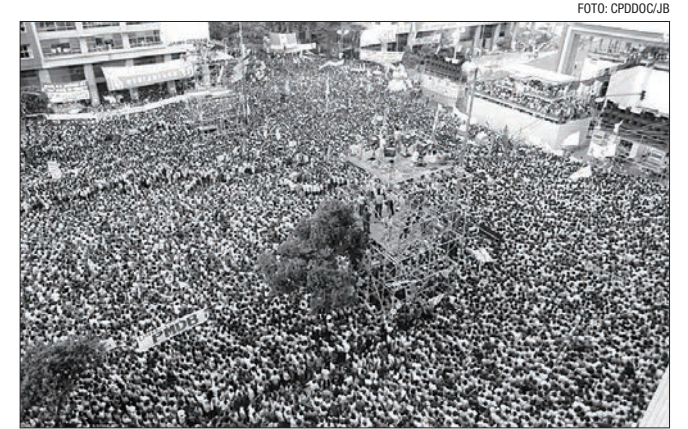
Mesmo após derrota no Congresso, sentimento no país era de esperança

Com a derrota da Emenda Dante de Oliveira, a primeira eleição de um presidente civil após a ditadura militar aconteceu no Colégio Eleitoral, formado pelos membros do Congresso Nacional e por delegados eleitos nas assembleias legislativas dos estados. O então líder da oposição, Tancredo Neves, superou o então deputado Paulo Maluf, apoiado pelo regime militar, por 480 votos contra 180.