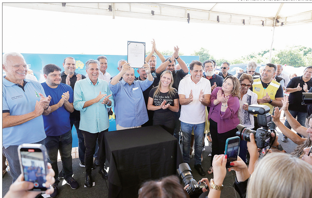
Ibaneis Rocha: "Agora, com essa obra, a gente espera poder ampliar o atendimento para toda a população"

Ao comentar a obra, o governador Ibaneis Rocha listou investimentos na saúde que chegam a R$ 2 bilhões. Nessa conta estão quatro novos hospitais, entre eles o do Guará e o do Recanto das Emas, lançado na semana passada, e também as futuras estruturas de São