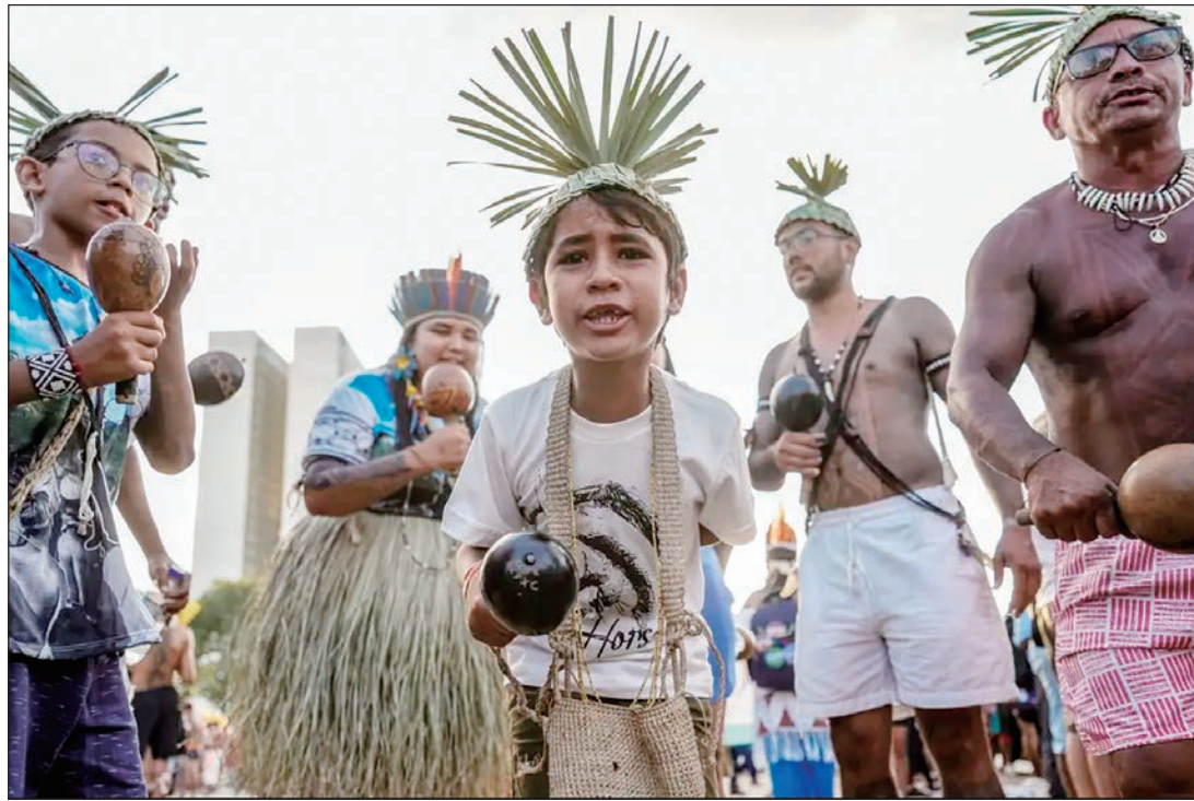
Mais de 40 lideranças indígenas do País participam da 20ª edição do ATL foram recebidos pelo presidente Lula

As terras pendentes têm longo histórico de disputa pela demarcação. São elas: Morro dos Cavalos e Toldo Imbu, em Santa Catarina, Potiguara de Monte-