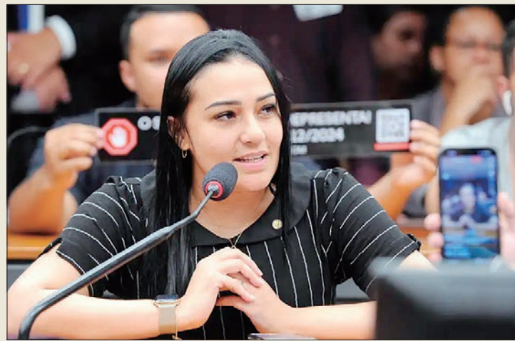
A deputada federal Dayany Bittencourt: apartamento vigiado

A Polícia Federal (PF) investigará a instalação de câmeras escondidas encontradas em um apartamento da deputada federal Dayany Bittencourt (União-CE), em Brasília. O caso já estava sendo apurado pela Polícia Civil do Distrito Federal, após o equipamento ter sido encontrado escondido em meio a disparadores de água e sensores de fumaça, em 2023.