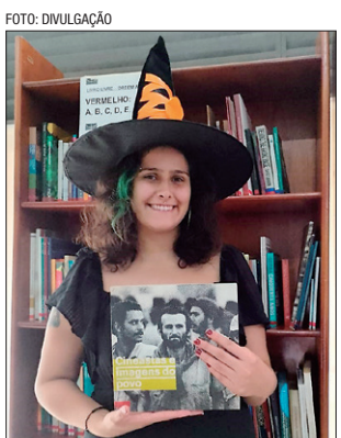
Campanha será realizada no dia 31/10, das 8h às 20h, na FAC

PROJETO LIVRO LIVRE. LOCAL: Área de convivência da Faculdade de Comunicação da UnB. MAIS INFORMAÇÕES: sites: google.com/view/livrolivre/fac/home?authuser=0 INSTAGRAM: @livrolivre.unb.