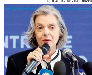
Carmem Lúcia, presidente do TSE, divulgou os dados

Neste domingo foram usadas 97.392 urnas, sendo que 0,12% dos equipamentos precisaram ser substituídos.