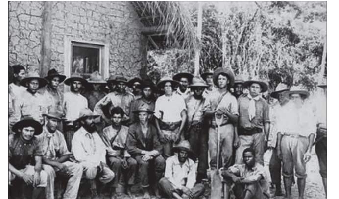
Maiores marcha militar do mundo percorreu 25 mil km, com 1,5 mil pessoas