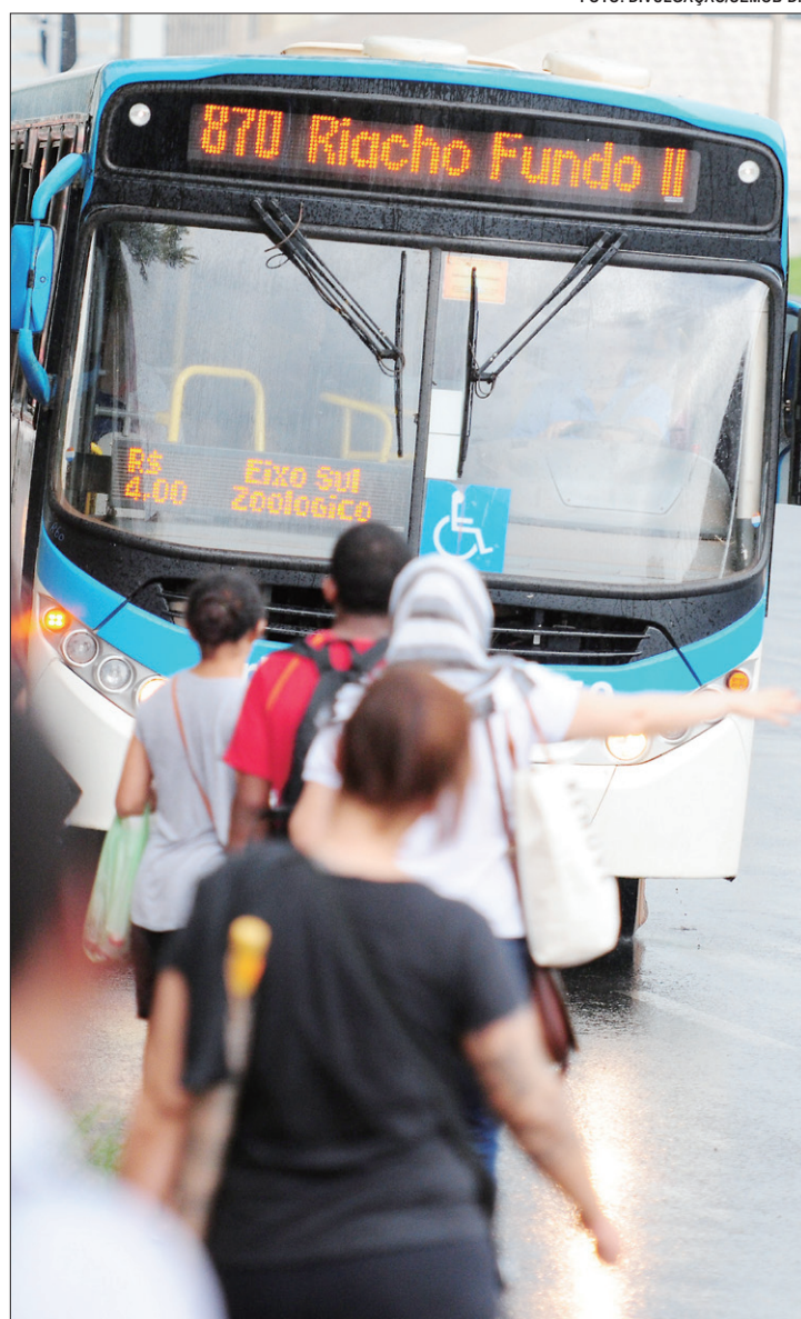
Passageiros dos condomínios ganharam 19 opções de viagens

As novas linhas vão atender, principalmente, as demandas dos moradores do condomínio Riacho 42. Os ajustes feitos pela Semob permitem aos passageiros fazerem integração no terminal do Riacho Fundo II, por meio da linha alimentadora 806.3 que terá 16 viagens por dia. E as novas linhas 870.3 / 881.3 e 882.3 farão viagens diretas para