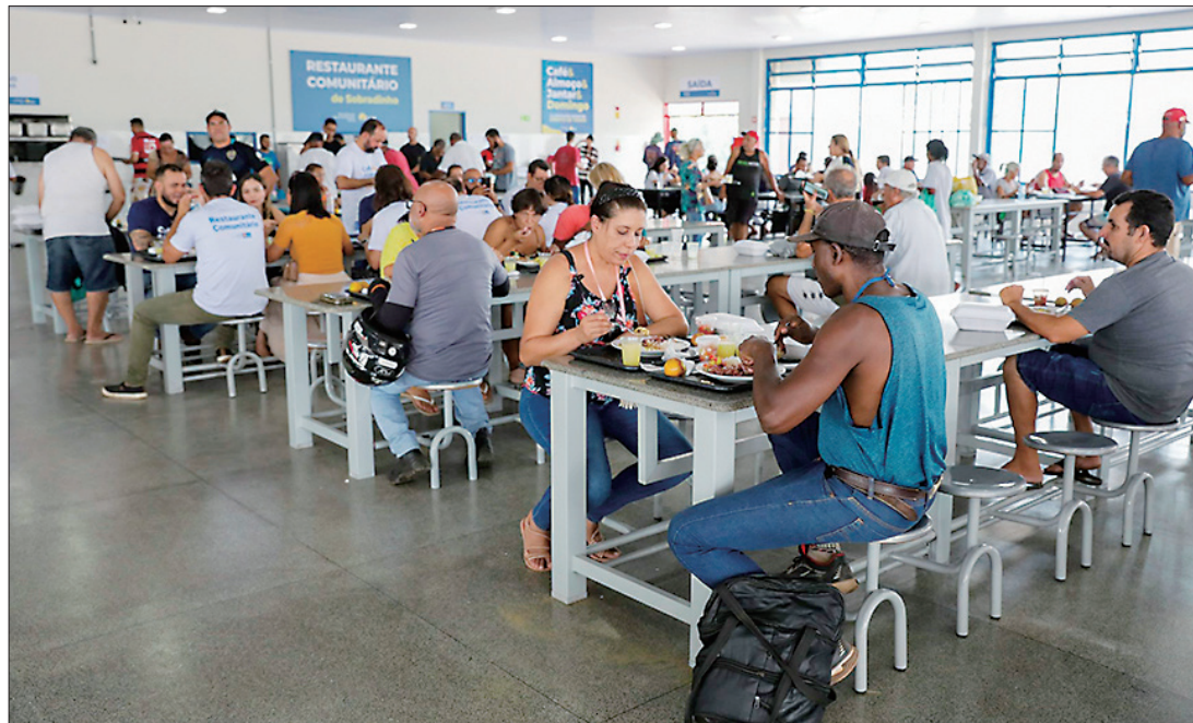
Novos restaurantes comunitários e oferta de café da manhã e jantar são exemplo do investimento social

Para reforçar a rede de segurança alimentar da população, o GDF inaugurou novos restaurantes comunitários, iniciou a oferta de café da manhã e jantar – atualmente disponíveis em nove dos 18 equipamentos públicos – e quase duplicou o