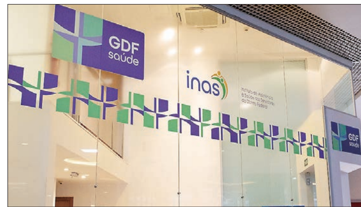
São 98.028 beneficiários, sendo 58.157 titulares e 39.871 dependentes

A participação dos beneficiários nas decisões referentes ao plano também foi assegurada neste último ano, com a implementação dos conselhos administrativo e fiscal, formados por representantes das entidades de classe dos servidores do GDF. Com o importante apoio do governo, que sempre