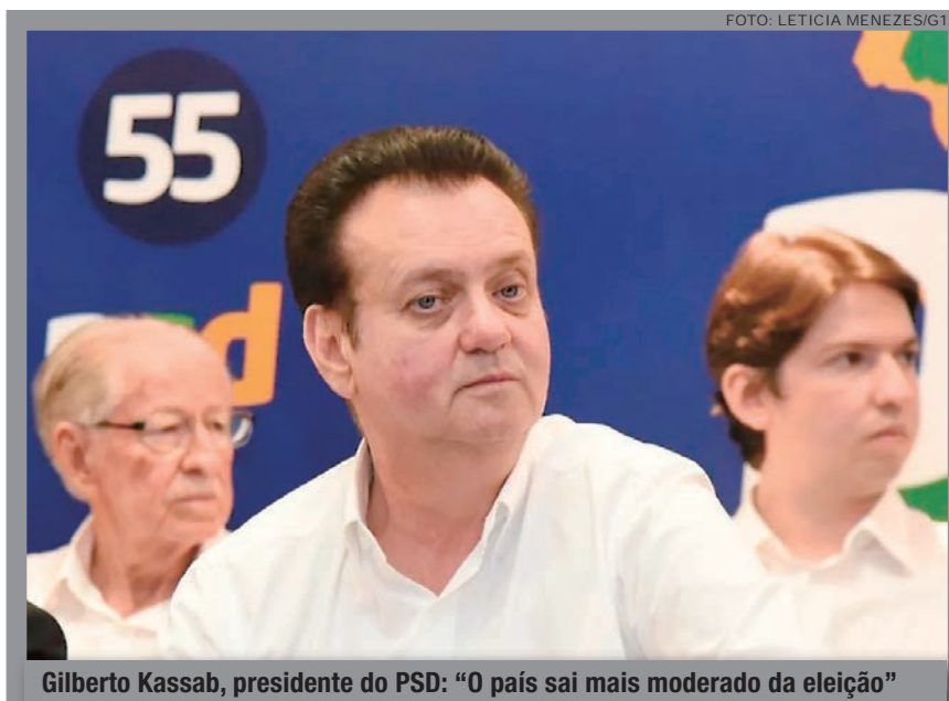
Gilberto Kassab, presidente do PSD: "O país sai mais moderado da eleição"