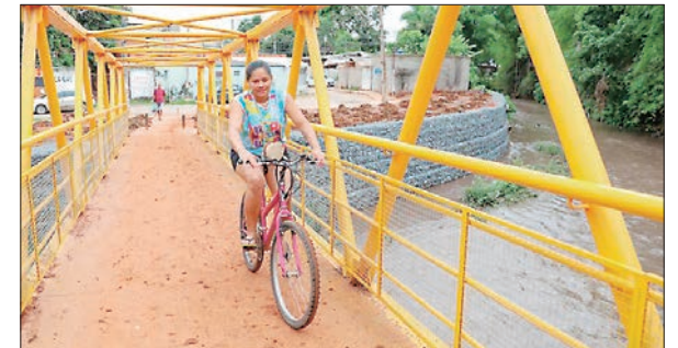
Ponte foi reconstruída com investimento de R$ 2,5 milhões