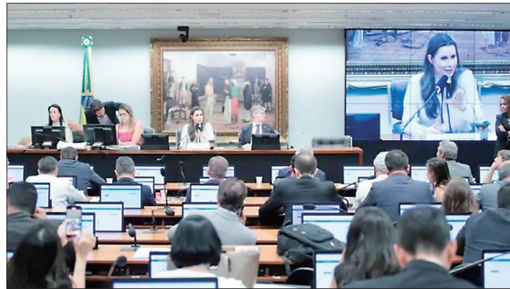
Senado e Câmara têm a agenda cheia para o retorno após as eleições

Na Câmara, o presidente Arthur Lira (PP-AL) convocou sessão no plenário para esta terça-feira (29). Um dos destaques é o segundo projeto de regulamentação da reforma tributária, que define regras para o Comitê Gestor do novo