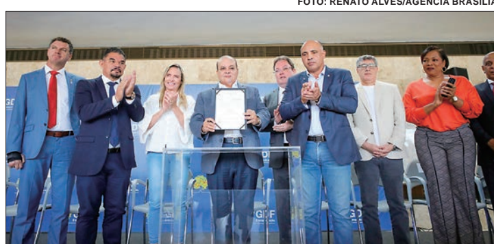
Ibaneis concedeu reajuste de 18% para os servidores efetivos do DF

Do ponto de vista de recomposição salarial, o GDF quitou, em agosto, a segunda parcela do reajuste linear de 18%. Cerca de