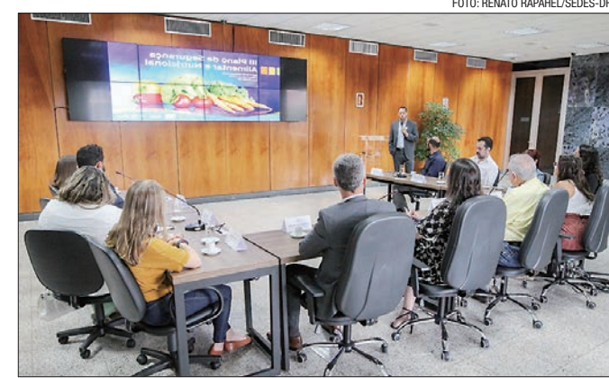
Qualquer pessoa pode dar contribuições para aprimorar o plano

O Pdsan é o principal instrumento de planejamento, gestão e execução das ações de segurança alimentar e nutricional no Distrito Federal. Funciona como uma espécie de bússola para orientar todas as ações do Sistema de Segurança Alimentar e Nutricional (Sisan), estabelecendo metas e direcionando esforços para garantir acesso regular e permanente a alimentos em quantidade e qualidade adequadas, de forma sustentável, respeitando a diversidade cultural e práticas alimentares.