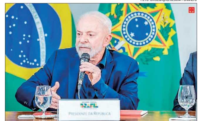
Lula planejava fazer o encontro há um mês, mas esperou as eleições