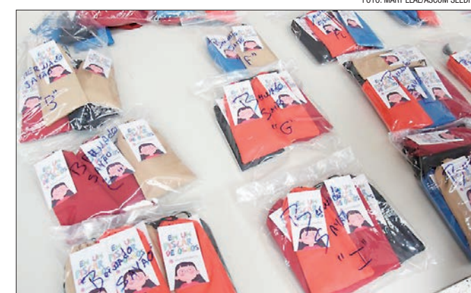
Cada pacote contém armações escolhidas pelos próprios alunos