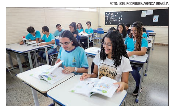
Solicitação deve ser feita no site da SEEDF ou pelo canal 156

A consulta do resultado é de inteira responsabilidade do candidato ou do responsável. A Secretaria de Educação não envia comunicado sobre o resultado das inscrições. A previsão é que os resultados sejam divulgados em 30 de dezembro, a partir das 18h, pelo site da Secretaria de Educação ( www.educacao.df.gov.br/ ).