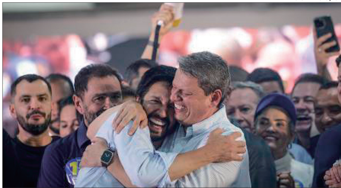
Em São Paulo, o prefeito reeleito Ricardo Nunes (MDB) teve o apoio de Tarcísio de Freitas (Republicanos)

Um ponto positivo destacado por Lavareda foi a ausência de questionamentos sobre a urna eletrônica nestas eleições, o que ele considera “uma beleza para a nossa institucionalidade