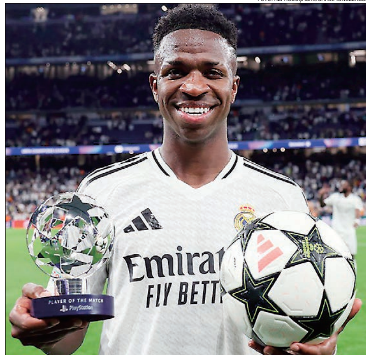
Vini Jr. (Real Madrid) foi destaque nos títulos do Espanhol e Champions League

A informação inicialmente foi dada pela rádio francesa RMC e pelo jornal espanhol Marca e posteriormente confirmada pela reportagem. Além do brasileiro, nenhum outro membro do Real Madrid – seja jogador, membro da comissão técnica ou dirigente – irá ao Théâtre du Châtelet, local de cerimônia, ao contrário do que era esperado no fim de semana.