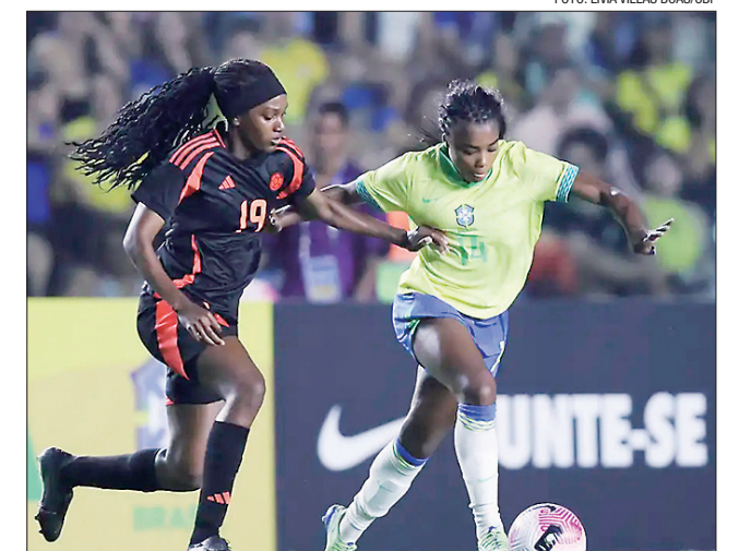
Esta foi a primeira apresentação do Brasil após a prata olímpica

Com o resultado, o Brasil mantém uma invencibilidade histórica contra a Colômbia: são dez vitórias e dois empates em 12 confrontos entre as seleções. O 13º duelo já tem data e local: na terça-feira (29) as equipes voltam a se enfrentar em Cariacica, às 19h.