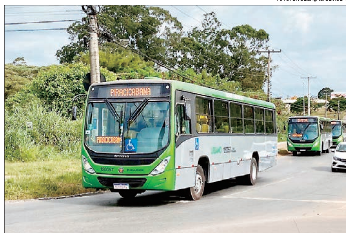
Veículos circularão a partir desta segunda, com 3 horários de viagens por dia