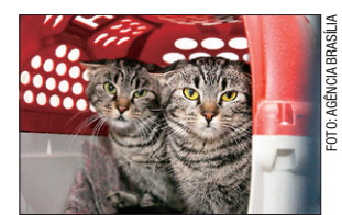
Ideal é transportar os animais em caixas apropriadas

A norma do CTB classifica como infração média a prática de dirigir com animais ou objetos entre os braços e pernas,