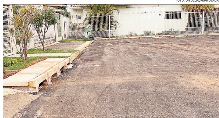
Obra realizada na QI 10 contou com investimento de R$ 1,5 milhão

Ao todo, a nova rede tem quase 1 km de extensão. Os trabalhos foram executados pela Companhia Urbanizadora da Nova Capital (Novacap) e duraram 45 dias, tendo sido concluídos na última segunda-feira (21). Além da construção do sistema, foi feito o recapeamento das vias, utilizando 105 toneladas de massa asfáltica. “A obra trará melhorias no escoamento das águas pluviais no conjunto e