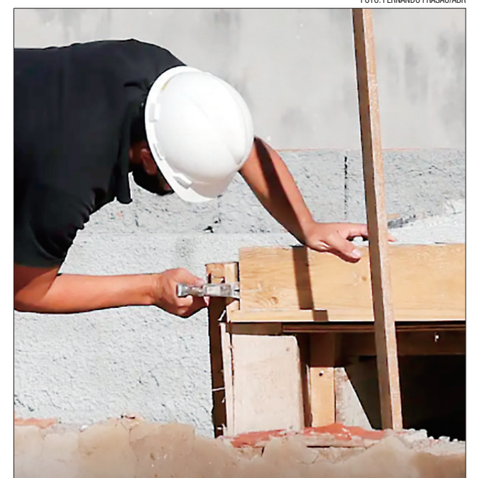
Região de maior aumento foi a Norte, menor mercado do país

Em nota, o Sindicato Nacional da Indústria de Cimento atribuiu o desempenho positivo à melhora contínua do mercado de trabalho e da renda da população, com aumento de massa salarial e aquecimento do mercado imobiliário, puxados pela retomada de obras do programa Minha Casa, Minha Vida.