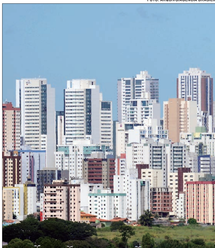
Águas Claras é uma das regiões com a maior oferta de aluguéis no DFw

A alta de 13,5% no ano passado é quase o triplo do Índice Nacional de Preços ao Consumidor Amplo (IPCA), apurado pelo IBGE, que acumulou 4,83% em 2024. Além disso, é o dobro do Índice Geral de Preços – Mercado (IGP-M), da Fundação Getúlio Vargas (FGV), comumente chamado de “inflação do aluguel”, pois costuma corrigir