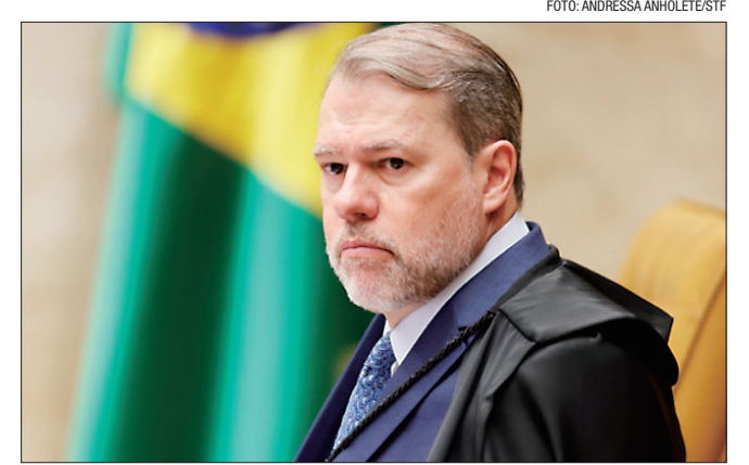
Ministro Toffoli negou seguimento a habeas corpus de Natalino Guimarães

Ainda segundo o juiz de primeira instância que decretou a prisão, a medida foi fundamentada em razão de denúncia de atuação em organização criminosa armada voltada para a prática de diversos crimes com a finalidade de usurpar terrenos das vítimas para criação de condomínio para venda a terceiros, causando enormes transtornos à população de Armação de Búzios.