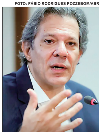
Haddad: “Tudo não passa de uma grande fake news”

De acordo com Haddad, tudo não passa de uma grande fake news. “Hoje surgiu uma nova fake news que está circulando com muita força nas redes sobre uma coisa que eu nem sei explicar o que é, mas seria uma taxa