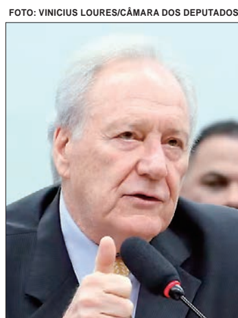
Lewandowski vai apresentar a proposta de PEC

Lançada em outubro, a PEC da Segurança Pública visa a ampliar a atuação do governo federal nas ações de segurança pública, com foco no combate ao crime organizado no país. Entre as mudanças propostas na versão inicial estão a integração das polícias, o reforço