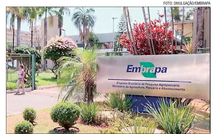
Para ministro Edson Fachin, decisão contraria orientação do STF

Ao deferir a liminar, Fachin observou que, em casos semelhantes, também envolvendo a Embrapa, o STF tem reconhecido que suas dívidas judiciais devem obedecer ao regime constitucional de precatórios. Isso porque se trata de empresa pública que presta serviço público essencial de natureza não concorrencial, voltado à produção de ciência e tecnologia no setor agrícola, e sem fins lucrativos.