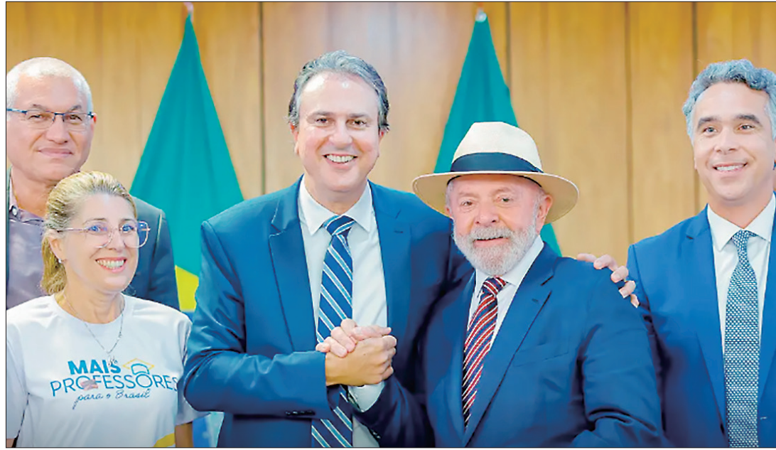
Ministro Camilo Santana, com Lula: alunos contemplados poderão sacar até R$ 700 por mês

No caso da bolsa para estudantes de graduação, ela deve começar a valer a partir de 2025, conforme inscrição dos estudantes