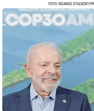
Desembarque de Lula coincidirá com “dia-chave” de negociações

Lula também deve tratar do Mapa para a transição dos combustíveis fósseis, prioridade em seu discurso durante a Cúpula dos Líderes em Belém e na sua fala durante a abertura da COP. A diplomacia brasileira considera que Lula é uma voz forte, espe-