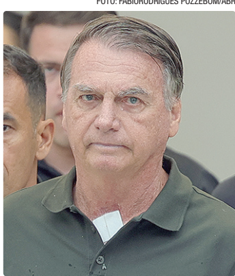
Jair Bolsonaro foi condenado a 27 anos e 3 meses de prisão

Nesse caso, os embargos infringentes poderiam ser protocolados contra a decisão. No entanto, o placar pela condena-