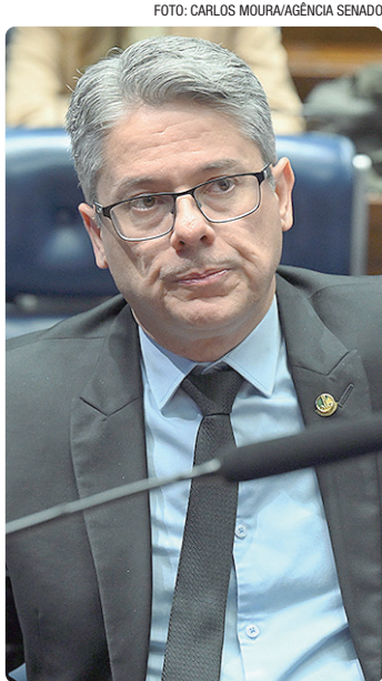
Senador Alessandro Vieira, relator da CPI do Crime Organizado

Apenas na Operação Carbono Oculto deste ano foram apreendidos quase R$ 4 bilhões. A ação combateu a lavagem de dinheiro do Primeiro Comando da Capital (PCC) no mercado financeiro e em postos de combustíveis. “Nós devemos chegar a cerca de R$9 bilhões efetivamente apreendidos [em 2025]. Não é bloqueio de contas em que nunca vai surgir o dinheiro. Isso é dinheiro, são imóveis, são veículos, aeronaves e embarcações efetivamente apreendidos”, afirmou Andrei.