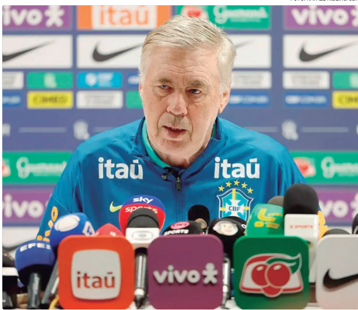
ANCELOTTI: “Creio que estamos em um bom caminho e temos que seguir”

“FAMA DE “MONSTRO” Carlo Ancelotti foi questionado sobre como enxerga a repercussão da vitória do Brasil contra Senegal na Europa, tratada até mesmo como o “despertar de um monstro”. “Normalmente, você tem medo do monstro (risos). Isso