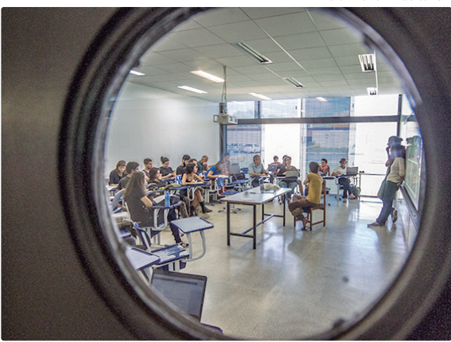
O projeto da UnB inclui capacitação de profissionais e estudantes