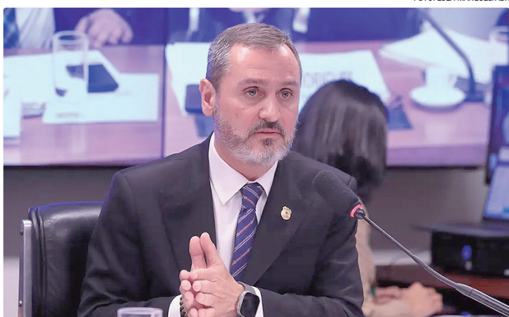
Andrei teceu algumas críticas ao relatório do PL Antifacção de Derrite

Essa é a primeira oitiva da CPI, instalada no Senado após a repercussão da operação policial no Rio de Janeiro contra o Comando Vermelho, que levou a