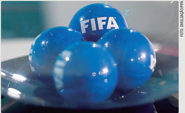
Sorteio será no dia 5 de dezembro, às 14h (horário de Brasília)