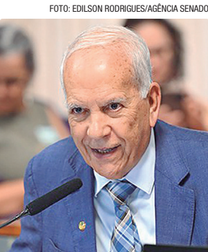
O projeto de lei é de autoria do senador Flávio Arns (foto)

Conselho Monetário Nacional definir os patamares máximos. Os tetos para as operações deverão ser estabelecidos a partir de um diálogo com Conselho de Controle de Atividades Financeiras (COAF), órgão que monitora atividades suspeitas e atua na prevenção e combate à lavagem de dinheiro. Segundo a proposta, os limites valerão para todos os clientes de bancos e instituições financeiras regulamentadas pelo Banco Central. Também deverá haver limite para uso de “dinheiro vivo” no pagamento de boletos e cheques. Pelo texto, se as transações financeiras com esses dois mecanismos superarem os valores máximos, deverão ser feitas por meio eletrônico. Orlivoisto Guimarães afirmou que regras semelhantes já são adotadas em diversos países, como os Estados Unidos, Canadá e Austrália. Segundo ele, a proposta também conta com o apoio do Ministério Público, Polícia Federal e Receita Federal.