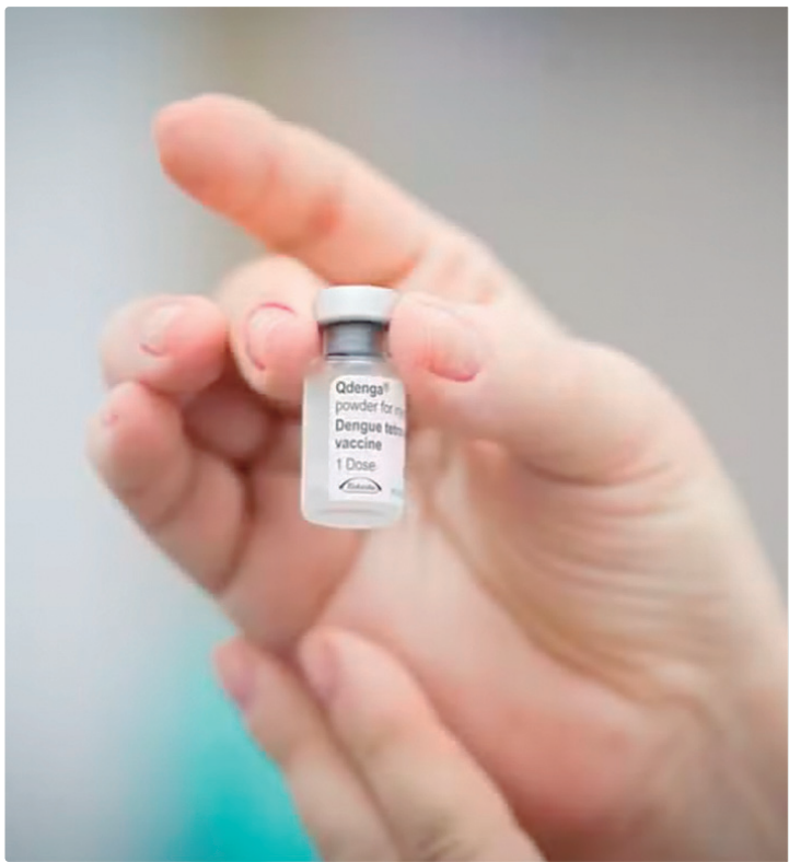
Mais de 16 mil voluntários de 14 estados participaram da pesquisa

Apesar da aprovação, de acordo com a Anvisa e o