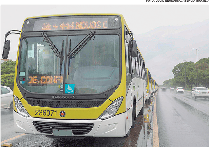
Veículos já circulam em dezembro e vão atender cerca de 350 mi pessoas

Segundo Ibaneis, esta é mais uma iniciativa que melhora a qualidade do serviço para o usuário que depende do transporte público todos os dias, inclusive, no final do dia e aos fins de semana. Ele destacou também o programa Vai de Graça, que permite que a população circule pela cidade. “A melhoria no transporte público do DF foi uma