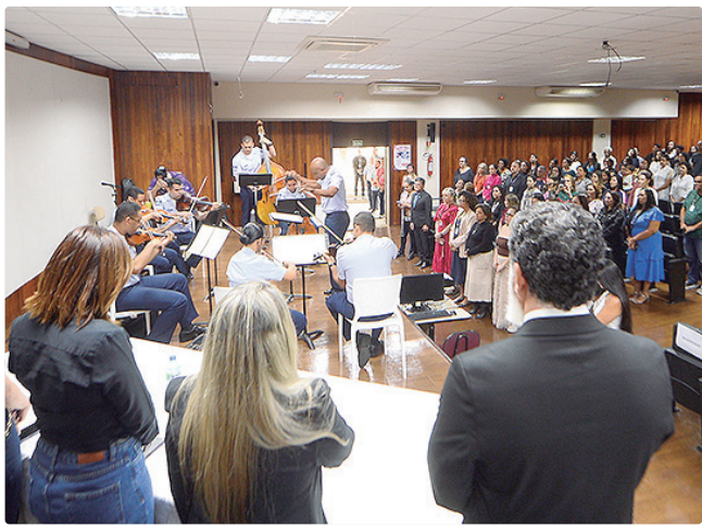
Orquestra Sinfônica da Força Aérea celebrou a data no hospital

Em 2024, segundo dados do InfoSaúde DF, ocorreram mais de 2,4 mil nascimentos na unidade. Desses, 79% foram de gestantes do DF e 21% de outras localidades. Neste ano, até o momento, foram mais de mil partos, sendo 79,4% de grávidas do DF e 20,6% de mulheres provenientes de estados como Minas Gerais e Goiás.