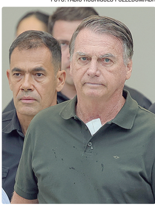
Jair Bolsonaro foi condenado a mais de 27 anos de pris  o

Apenas o deputado federal Alexandre Ramagem (PL-RJ) n  o teve audi  ncia designada por estar foragido nos Estados Unidos. O ministro Alexandre de Moraes, do STF (Supremo