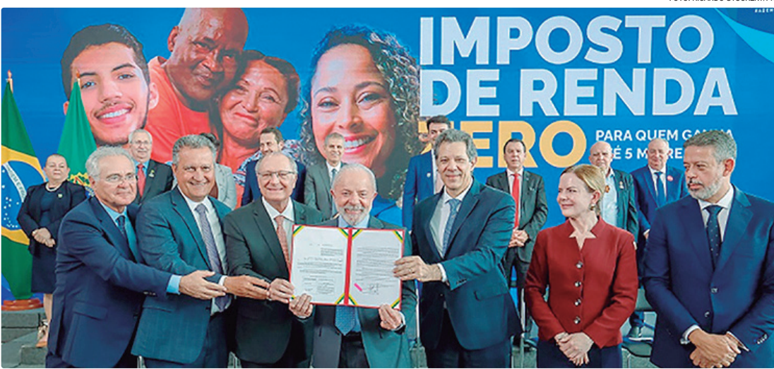
Motta e Alcolumbre n  o foram ao evento, mas o senador Renan Calheiros e o deputado Arthur Lira marcaram presen  a

Lula repetiu uma frase recorrente em seus discursos, – a de