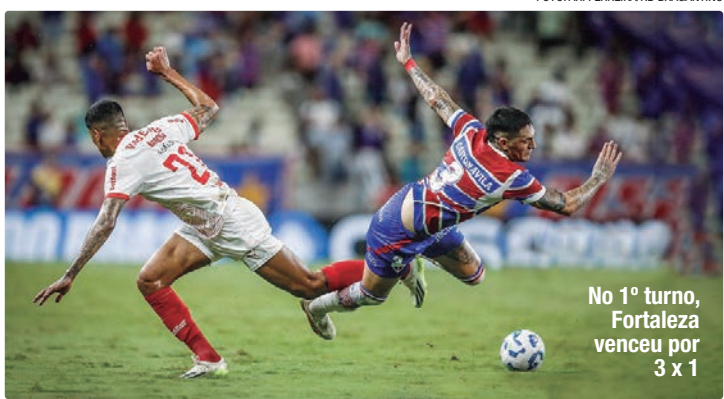
No 1º turno, Fortaleza venceu por 3 x 1

Já o Fortaleza terá o reforço do volante Lucas Sasha, que pode voltar ao time titular fazendo dupla com Pierre na marcação. O time