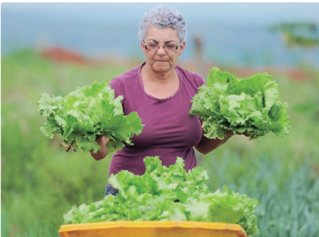
Ações voltadas à sustentabilidade estão entre os principais temas