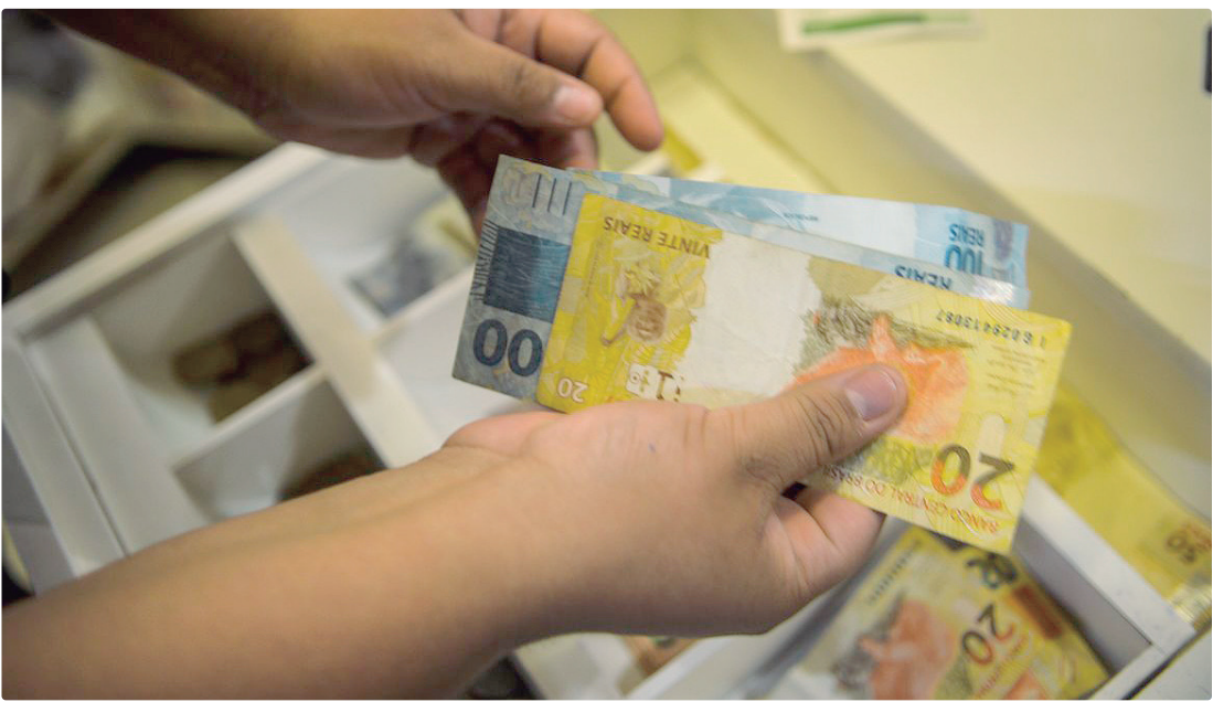
Ipea aponta avanço após crises (2014 e 2021) e a retomada do trabalho e a expansão da transferência de renda

O Brasil registrou, em 2024, os melhores resultados de renda, desigualdade e pobreza de toda a série histórica iniciada em 1995, segundo nota técnica do Instituto de Pesquisa Econômica Aplicada (Ipea). O estudo foi divulgado nesta terça-feira (25) a partir de dados levantados pelo Instituto Brasileiro de Geografia e Estatística (IBGE). Ao longo de 30 anos, a renda domiciliar per capita cresceu cerca de 70%, o coeficiente de Gini (índice que mede concentração de renda) caiu quase 18% e a taxa de extrema pobreza recuou de 25% para menos de 5%. O progresso foi irregular, concentrado entre 2003 e 2014, e retomado com força entre 2021 e 2024. Após um ciclo prolongado de crises entre 2014 e 2021 — marcado por recessão, lenta recuperação e forte impacto da pandemia — a renda per capita atingiu seu menor patamar em uma década. A trajetória mudou a partir de 2021: em três anos seguidos, a renda média cresceu mais de 25% em termos reais, maior avanço desde o Plano Real, acompanhado de queda expressiva na desigualdade. “Os resultados mostram que é possível reduzir intensamente a pobreza e a desigualdade, mas