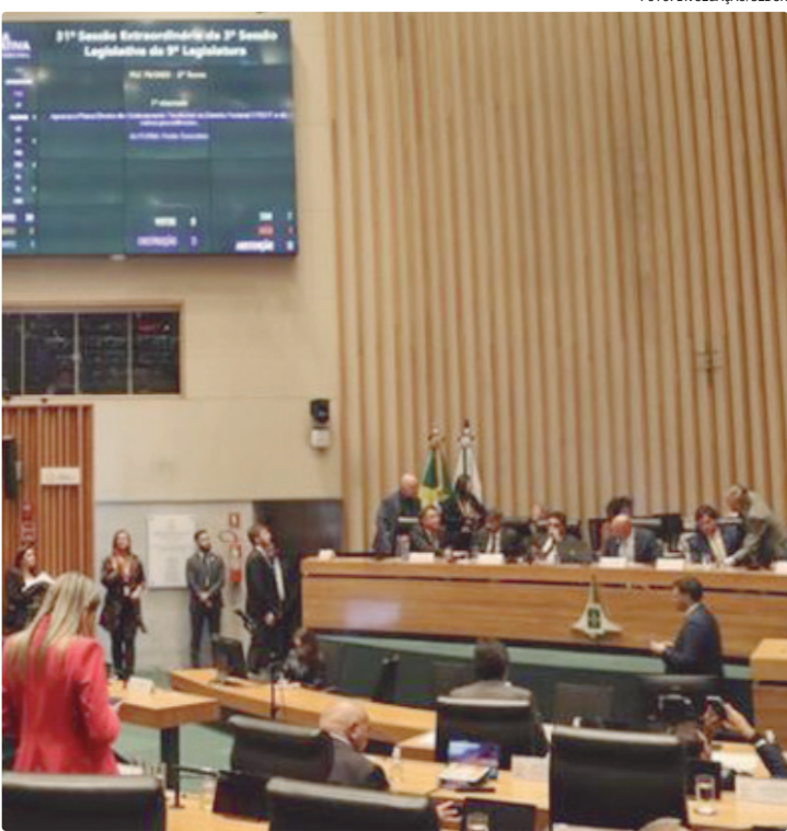
Projeto foi aprovado por ampla maioria dos votos dos deputados distritais

APERFEIÇOAMENTO “A maioria das emendas acatadas de fato aperfeiçoaram o projeto, que foi aprovado na melhor versão possível. Entregamos à população do DF a atualização de uma norma