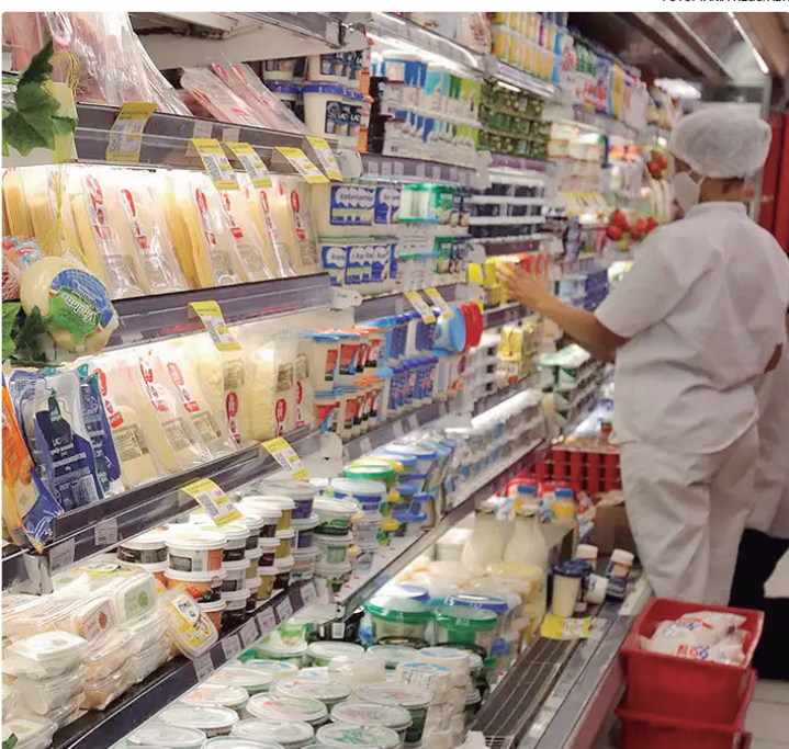
Alimentação e bebidas interrompeu uma sequência de 5 meses de queda

INFLUÊNCIAS Em outubro, o IPCA-15 havia sido de 0,18%. Dos nove grupos de produtos e serviços pesquisados, sete tiveram alta na passagem de outubro para novembro: