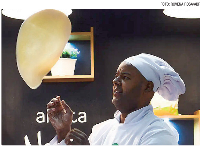
Uma das funções em destaque nas ofertas do feirão é de pizzaiolo

O espaço foi instalado ao lado da Biblioteca Nacional, próximo à Rodoviária do Plano Piloto, e oferece uma programação completa e totalmente gratuita, com oficinas de qualificação, palestras, entrega de brindes e muito mais. O atendimento começou na segunda-feira (24) e vai até esta sexta(28), das 8h às 20h.