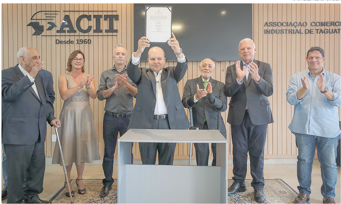
Após 48 anos de espera, a concessão entregue por Ibaneis Rocha prevê retribuição mensal de R$ 20,1 mil

A concessão foi firmada com prazo de 30 anos, prorrogável por iguais períodos, e prevê retribuição mensal de R$ 20,1 mil. Além disso, a entidade poderá, no futuro, solicitar a adoção do sistema de pagamento em moeda social, desde que atenda aos requisitos