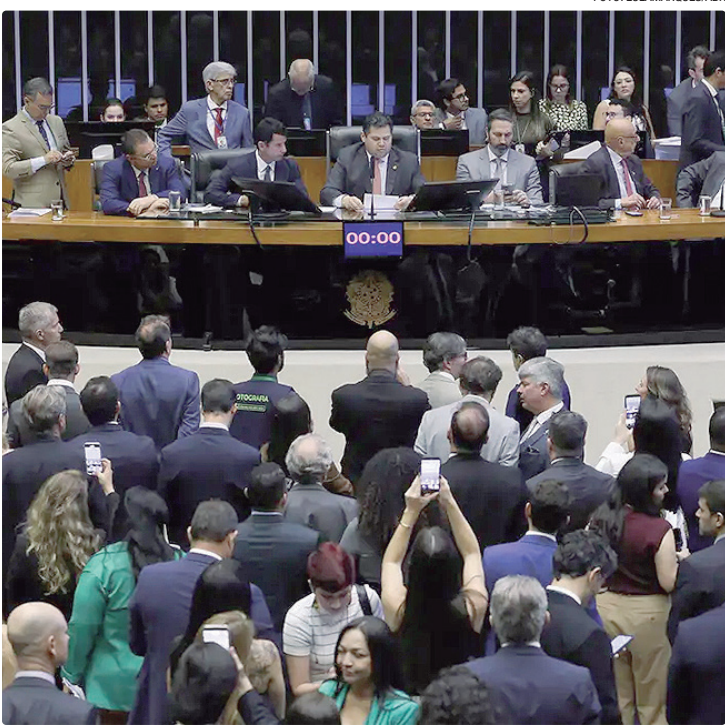
Bancada do agronegócio comemorou a derrubada dos vetos pelo Congresso

Ao vetar o dispositivo da LAE, o Executivo editou a Medida Provisória (MP) 1308 de 2025, mantendo a previsão desse instrumento ambiental. Porém, em vez de licenciamento em fase única, a MP edi-