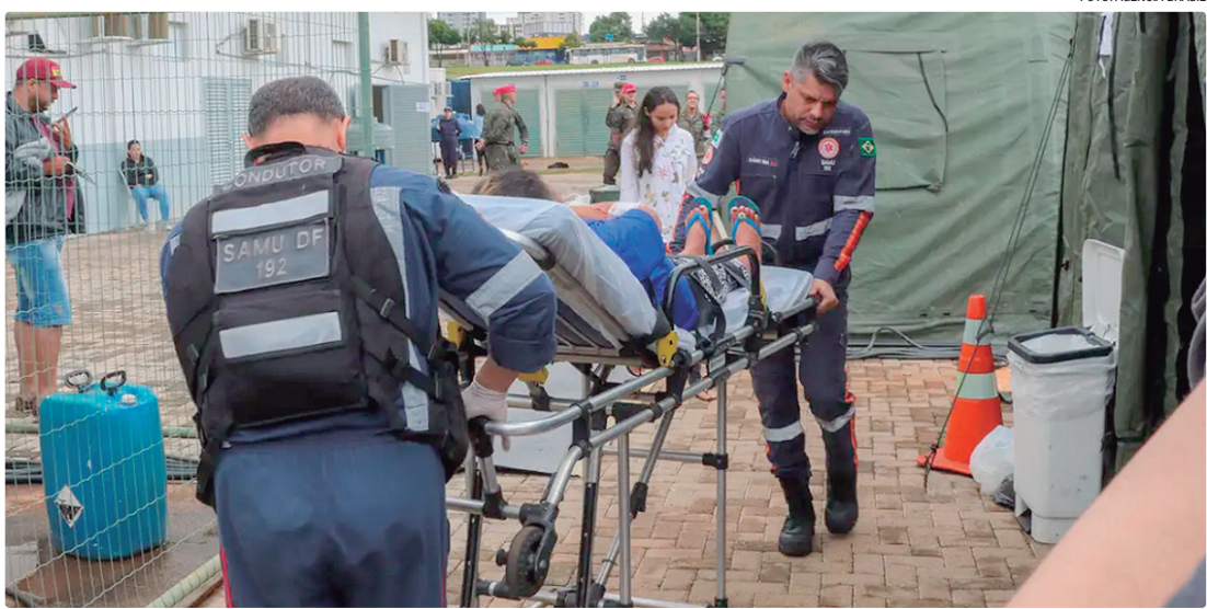
Secretaria de Saúde foi agraciada com o Prêmio Ipê de Inovação pelos serviços hospitalares de emergência

ALTO NÍVEL O ITA também premiou a categoria Alto Nível, que ava-