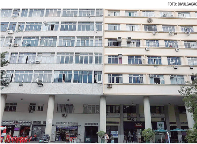
Somente para o mês de novembro de 2025, o IGP-M marcou 0,27%

Especificamente no mês de novembro, o IGP-M marcou 0,27%, invertendo o resultado de queda de outubro (-0,36%). Mesmo com a alta no mês, o acumulado de um ano passou de inflação (em outubro somava 0,92%) para deflação. Isso se explica porque saiu da conta o dado de novembro de 2024, quando a inflação do aluguel tinha subido 1,30%.