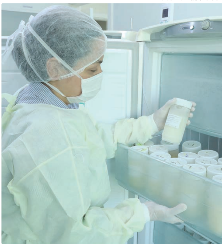
Apenas um frasco de 300 ml é capaz de nutrir até dez recém-nascidos