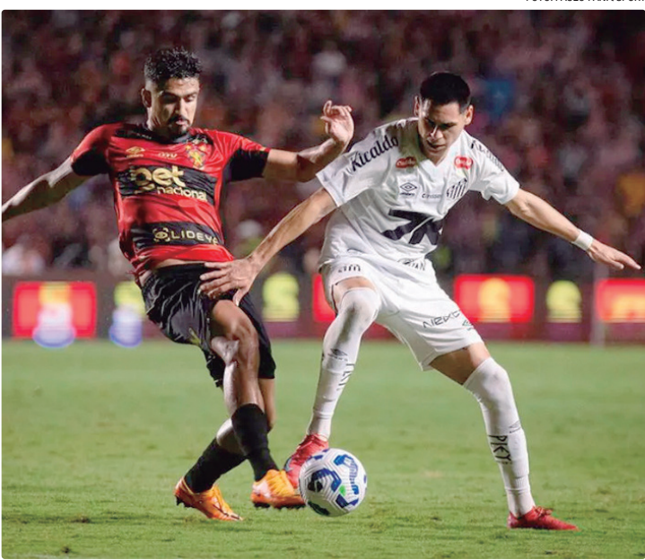
Santos precisa vencer e torcer por um tropeço do Vitória contra o Mirassol

Santos e Sport se enfrentam às 21h30 (de Brasília) desta sexta-feira, na Vila Belmiro, em partida válida pela 36ª rodada do Campeonato Brasileiro. SporTV e Premiere transmitem ao vivo. O Santos luta para fugir da zona de rebaixamento. O Peixe precisa vencer e torcer por um tropeço do Vitória contra o Mirassol para deixar o Z-4. A equipe comandada pelo técnico Juan Pablo Vojvoda está invicta há três jogos, com uma vitória e dois empates. Um mau resultado na Vila Belmiro pode complicar a situação do time, já que o Fortaleza também encostou na tabela. Rebaixado matematicamente há três rodadas, o Sport está em clima de despedida. Não só da elite nacional, mas