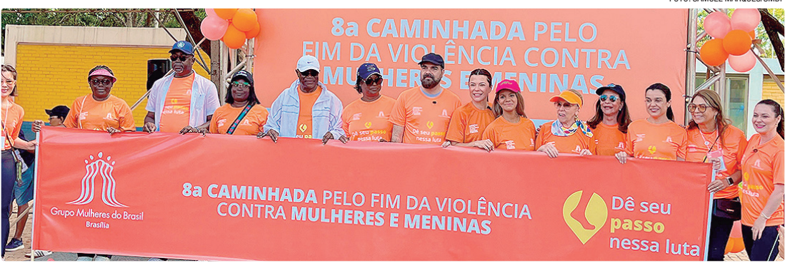
Movimento mobilizado pelo grupo Mulheres do Brasil intensifica a conscientização sobre a Violência Contra o gênero

“É fundamental reforçarmos diariamente as ações de combate à violência contra a mulher”, declarou a vice-governadora Celina Leão. “É preciso mudar a mentalidade com educação e conscientização de toda a sociedade. Ao nos unirmos nesta caminhada, demonstramos a importância desta luta contra a violência, que é, mui-