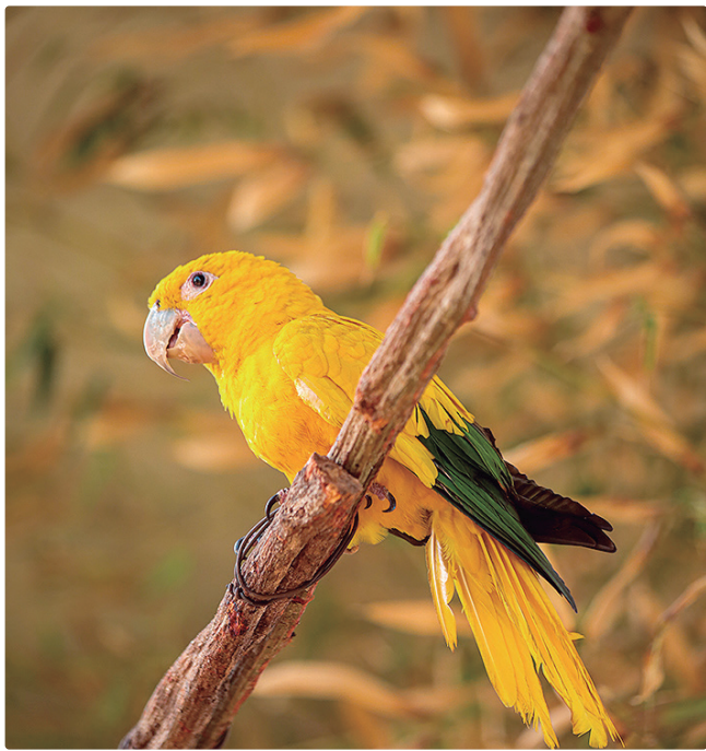
Ararajuba, ameaçada de extinção: destaque pelo amarelo vibrante

Entre as espécies presentes no aviário, a ararajuba se destaca pelo amarelo vibrante e por ser uma das aves mais ameaçadas de extinção no Brasil. Já a jacutinga, de plumagem preta e branca, é uma grande aliada na dispersão de sementes na Mata Atlântica. O papagaio-de-peito-roxo, conhecido pelas penas arreoadas no peito, é símbolo da Região Sul e enfrenta ameaças em seu habitat natural.