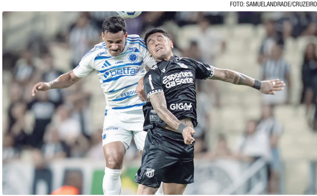
Vinícius Zancolo marcou para o Ceará e Kaiki Bruno empatou