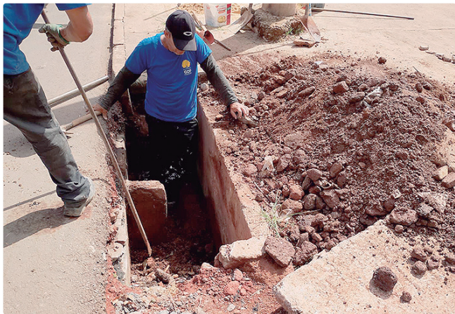
Ações asseguram um melhor escoamento das águas pluviais

A limpeza e desobstrução de bocas de lobo e redes pluviais podem ser solicitadas via ouvidoria, no site do Participa DF, ou nas administrações regionais. A população pode requerer diversos serviços, como poda de árvores, reapecamento, recolhimento de inservíveis, bem como registrar elogios, reclamações e questionamentos.