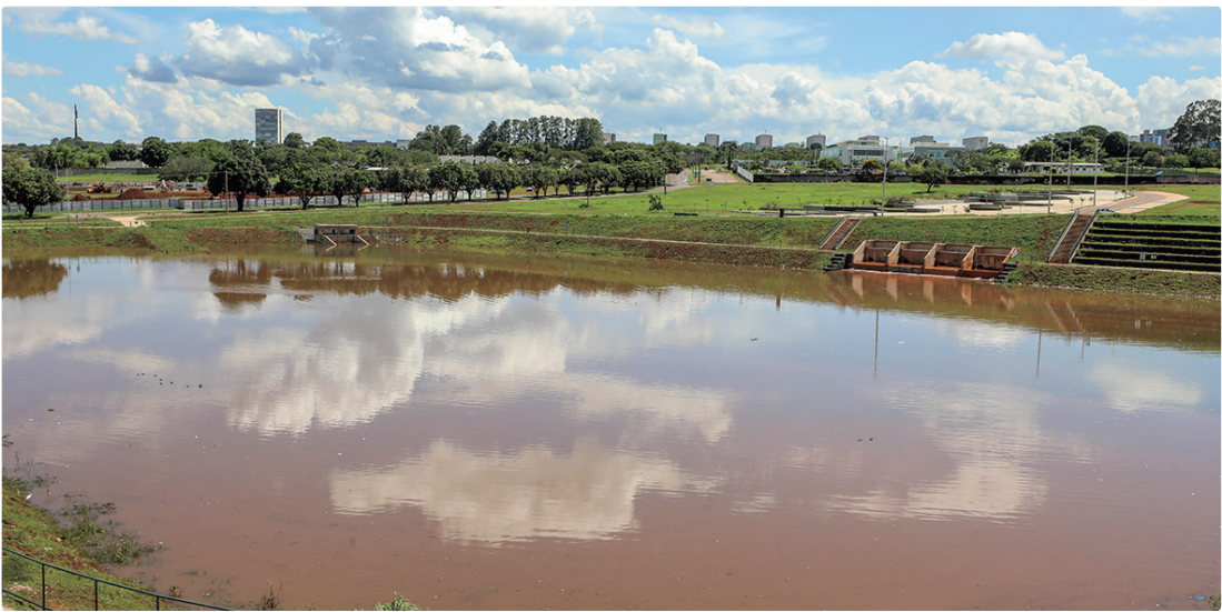
Bacia de retenção retém resíduos sólidos, evitando que o lixo siga para o Lago Paranoá, como ocorreu por anos