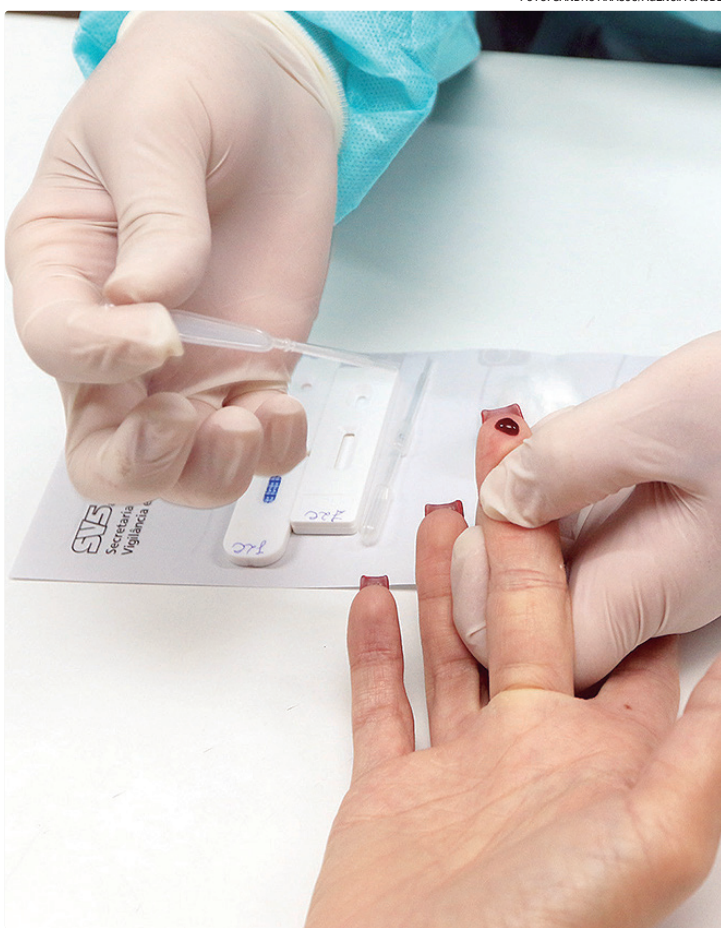
Ação da SES-dF é uma oportunidade de combater o estigma e o preconceito

Para esta segunda-feira, a secretaria mobilizou profissionais, gestores e população, a fim de fortalecer o trabalho intersetorial focado nos avanços científicos e sociais já alcançados. “Buscamos reafir-