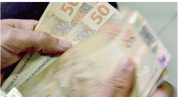
Instituições serão responsáveis por operações bancárias terceirizadas

Ao regulamentar a terceirização de serviços bancários no modelo Banking as a Service (BaaS), o BC deixou explícito que contas abertas, mantidas ou encerradas por meio desse sistema devem ter a titularidade individualizada e podem ser movimentadas apenas pelos próprios clientes finais. A prática de conta-bolsão, segundo o órgão, nunca foi permitida.