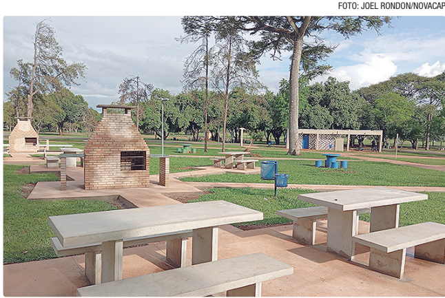
Uso é gratuito, mas famílias devem limpar o local após churrasco

O uso é totalmente livre; basta chegar ao local e levar o necessário para o preparo dos alimentos, como carvão, acendedor, utensílios, grelha e mantimentos. A Administração do Parque orienta que o carvão seja aceso com cerca de 20 minutos de antecedência, garantindo que as brasas estejam prontas para o churrasco. Após o uso, é obrigatória a limpeza do espaço e o descarte correto dos resíduos, reforçando que a conservação depende dos frequentadores.