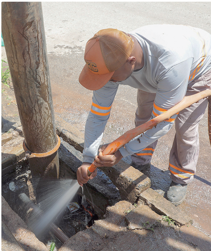
As ações do GDF alcançaram aproximadamente 1.656 km de redes e ramais

“Nossa equipe chega ao local, retira a tampa da boca de lobo e começa a sugar toda a sujeira que tiver. Dependendo da