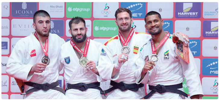
Com os três pódios, brasileiros vão para o Grand Slam de Tóquio, no Japão

o húngaro Zsombor Veg (14°). Na repescagem, derrotou Dzha-khongir Madzhidov (sétimo), do Tadjiquistão. Por fim, superou o holandês Simeon Catharina (18°), assegurando o bronze. A medalha de ouro da categoria ficou com o russo Arman Adamian, nono do mundo, que superou o compatriota Idar Bifov (93°) na final. Além de Leonardo, o georgiano naturalizado espanhol Nikoloz Sherazadishvili (oitavo) também foi bronze. O Brasil teve outros dois judocas no tatame neste