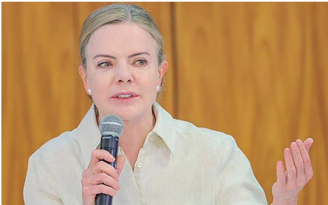
Ministra Gleisi Hoffmann (SRI): “Temos pelo senador Davi Alcolumbre o mais alto respeito e reconhecimento”

“Temos pelo senador Davi Alcolumbre o mais alto respeito e reconhecimento. Jamais consideráramos rebaixar a relação institucional com o presidente do Senado a qualquer espécie