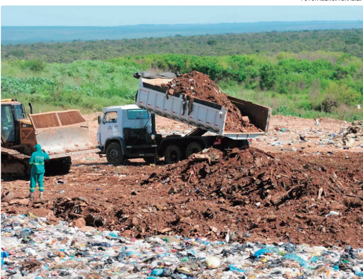
Média individual de acúmulo de lixo no DF é igual a nacional: 1kg por dia

Dados técnicos da Adasa e do Plano Distrital de Gestão Integrada de Resíduos Sólidos mostram que o Distrito Federal produz diariamente uma média de 0,94 kg de resíduos por pessoa, dos quais apenas 12,4% são efetivamente reciclados. Mais da metade do que chega aos aterros, cerca de 56%, é formada por resíduos orgânicos. O montante, multiplicado por uma população de quase 3 milhões de habitante, corresponde a um acúmulo médio diário de lixo próximo a 3 mil toneladas. Os números evidenciam a necessidade de ampliar ações educativas e incentivar práticas que reduzam o desperdício e promovam o reaproveitamento de materiais. Os números foram apresentados em um encontro no Instituto Federal de Brasília., com a participação de representantes de diversas regiões do país para discutir caminhos mais eficientes na gestão de resíduos e no fortalecimento da economia circular. O Ciclo Consciente de Boas Práticas Lixo Zero foi coordenado pelo SLU 1, em parceria com os institutos Lixo Zero Brasil e Desponta Brasil. Segundo o presidente do