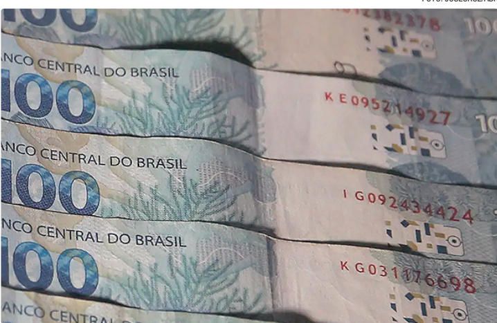
Em setembro, a Comissão do Orçamento aumentou o fundo para R$ 4,9 bilhões

Os parlamentares decidiram aprovar, no entanto, uma mudança no valor de referência. Pelo texto,