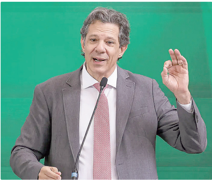
Segundo Haddad, o Brasil vive período de menor desemprego e inflação

Segundo ele, o governo está conseguindo conciliar o melhor de dois mundos: um país com menor desemprego e menor inflação. O Brasil atingiu no último trimestre uma taxa de desemprego de 5,4%. É o menor índice registrado pela série histórica do Instituto Bra-