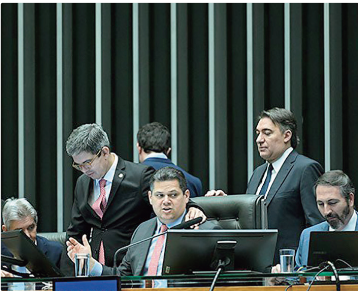
Proposta também permite que governo congele volume menor de gastos

A medida atende a um pleito de congressistas que, em ano eleitoral, querem que os