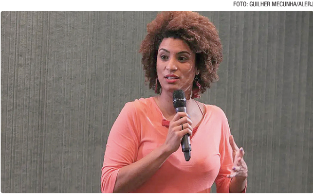
Marielle e Anderson foram assassinados em 14 de março de 2018

O jornal britânico “Financial Times” incluiu o ministro Alexandre de Moraes, do Supremo Tribunal Federal (STF), na lista das 25 pessoas mais influentes do ano, divulgada nesta sexta-feira (5). Ele é o único brasileiro da lista deste ano.