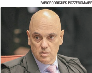
Alexandre de Moraes é o único brasileiro da lista deste ano