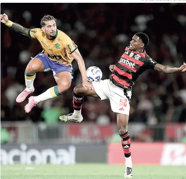
No duelo do primeiro turno, Flamengo derrotou o Mirassol com placar de 2 x 1

O Leão tentará manter sua invencibilidade em casa no Brasileiro. São 12 vitórias e seis empates atuando como mandante. A equipe está ao lado do Fla como as duas únicas que não perderam dentro dos seus domínios na Série A.