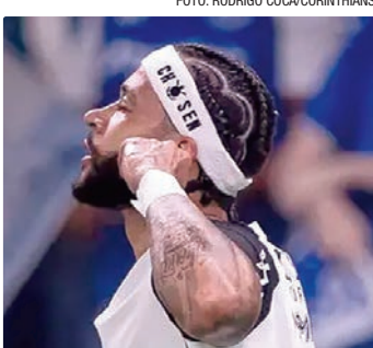
Depay deixa Timão em vantagem em disputa por uma vaga na final