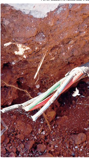
Cabos furtados dariam para ligar Santa Maria a Formosa (GO)

A Asa Norte, especialmente nas quadras 700, segue como o principal alvo dos criminosos. Para tentar conter o avanço dos furtos, a CEB IPes contratou uma empresa especializada para reforçar com solda as janelas de inspeção que dão acesso à fiação subterrânea, dificultando a abertura clandestina. Enquanto isso, as equipes regulares continuam com as