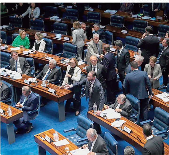
Por ter sofrido alterações no Senado, o PL retorna à Câmara dos Deputados

Não houve votos contrários: todos os senadores presentes