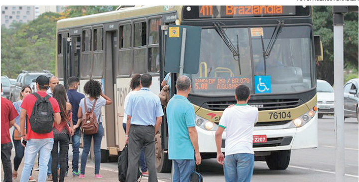
Desvio pelas rodovias DF-435 e DF-445 facilita o embarque de passageiros

A Semob determinou ainda a alteração percurso das linhas circulares da região (416.1, 416.2 e 416.3) para trafegarem até a pastelaria, para não prejudicar os passageiros. Segundo o Dnit, a interdição foi necessária por devido ao funcionamento inadequado de um bueiro. A intervenção está prevista por 30 dias.