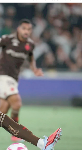
Depay deixa Timão em vantagem em disputa por uma vaga na final

ção mesmo com um empate. Já a Raposa precisa vencer por dois de diferença para garantir a classificação no tempo regulamentar, já em caso de triunfo por diferença de apenas um gol a vaga será decidida nas penalidades máximas.