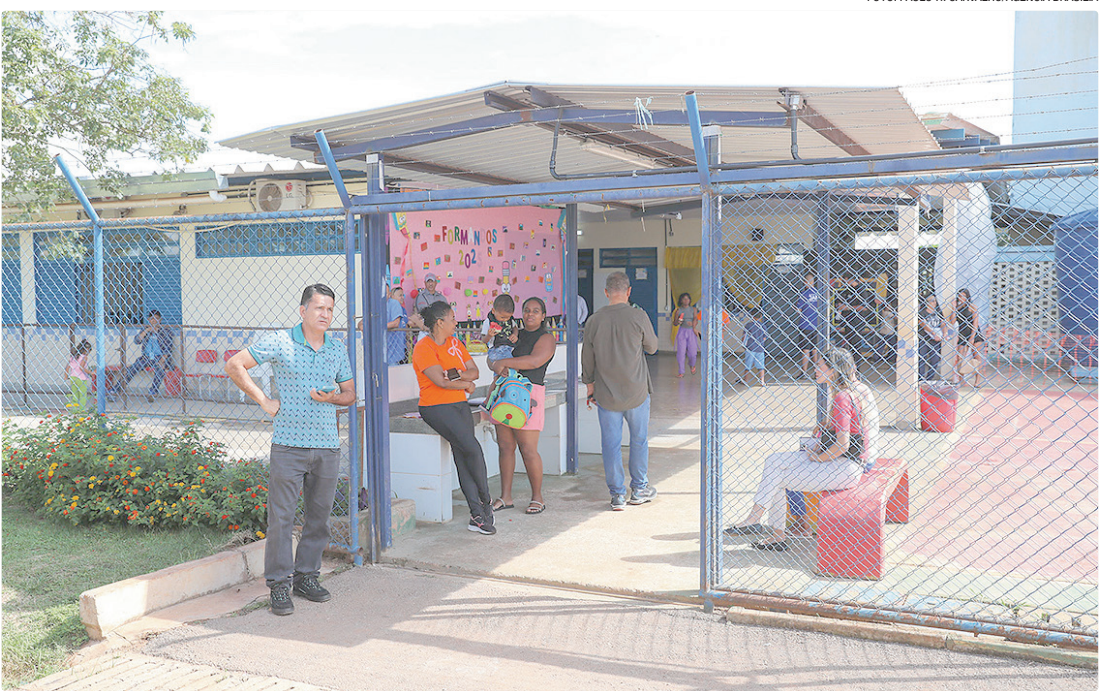
Obras melhoram o acesso à escola e promovem benefícios para 180 alunos, além dos pais e toda a comunidade

O governador Ibaneis Rocha assinou, nesta quinta-feira (11), a ordem de serviço para pavimentar as vias de acesso à Escola Classe Sítio das Araucárias, na VC-257, em Sobradinho. Com investimento superior a R$ 5,8 milhões, a obra vai beneficiar diretamente os cerca de 180 alunos da escola e os aproximadamente cinco mil motoristas que trafegam diariamente pelo local. Segundo o chefe do Executivo, o governo não tem olhado apenas para as cidades, mas também para as áreas rurais, o que, para ele, é motivo de satisfação. “Eu, que vim do interior do Piauí, sei das dificuldades de quem escolhe morar no campo”, lembrou. “Por isso, quanto mais conseguirmos levar conforto e segurança, melhor para todos”. Após ter visitado a escola da região, ele elogiou a manutenção, a nova cobertura e o forno instalados, além da satisfação dos professores, destacada pela diretora presente ao evento. “São quilômetros e quilômetros de asfaltamento feito nas mais diversas áreas para que a gente valorize essas famílias que moram nas áreas rurais e que querem criar seus filhos aqui”,