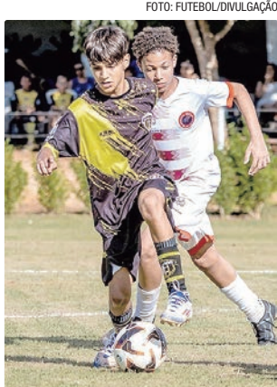
Categorias de base terão aporte entre R$ 500 mil e R$ 1 milhão

Caso uma equipe dispute mais de uma competição profissional no mesmo ano (como Série D e Copa do Brasil), o apoio será concedido considerando apenas o valor mais alto, sem acúmulo. No caso das categorias de base, o apoio pode ser cumulativo, mediante apresentação de plano de trabalho específico.