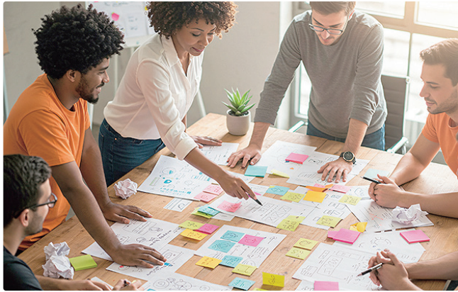
Projetos devem apresentar ideias que levem em conta o urbanismo