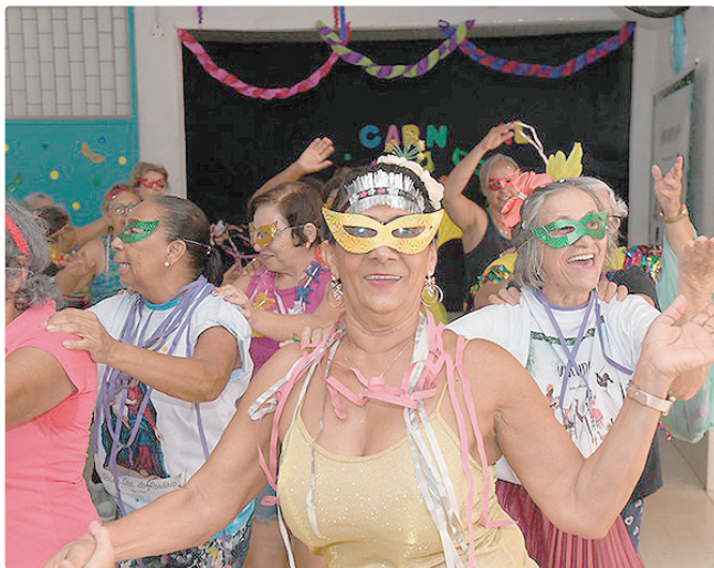
A ação integra as políticas públicas desenvolvidas pela Sejus-DF