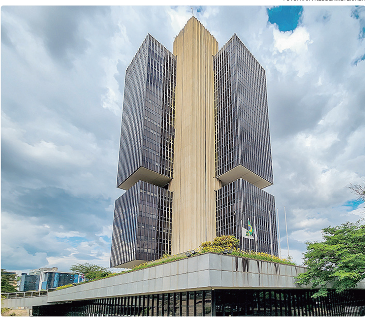
O BC utiliza a Taxa Selic como principal instrumento de controle da inflação

Essa é a quarta reunião seguida em que o Copom mantém os juros básicos. A taxa está no maior nível desde julho de 2006, quando estava em 15,25% ao ano.