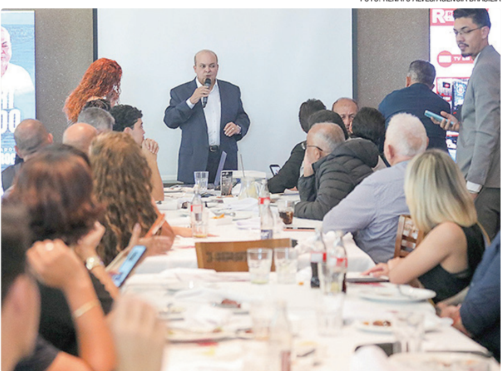
Em almoço com empresários e lideranças, Ibaneis fez balanço das obras

O governador Ibaneis Rocha almoçou com empresários e lideranças na Churrascaria Buffalo Bio, em Vicente Pires, nesta quarta-feira (10). O encontro foi marcado por um balanço das obras realizadas pelo Governo do Distrito Federal (GDF), além da entrega simbólica de uma placa de agradecimento ao chefe do Executivo. “Tenho o prazer de dizer que construí uma cidade. Vicente Pires passou por dificuldades que ninguém olhou”, disse Ibaneis Rocha para que a gente valorize essas famílias que moram nas áreas rurais e que querem criar seus filhos aqui”,