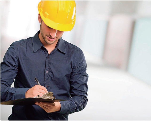
Técnico em Segurança do Trabalho oferece salário de R$ 3 mil

Empregadores e empreendedores que desejem ofertar vagas ou utilizar o espaço das Agências do Trabalhador para as entrevistas podem se cadastrar pessoalmente nas unidades ou pelo e-mail gcv@sedet.df.gov.br. Pode ser utilizado, ainda, o Canal do Empregador, no site da Secretaria de Desenvolvimento Econômico, Trabalho e Renda (Sedet).