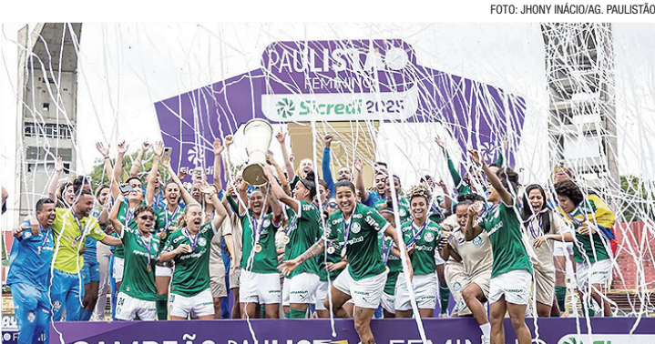
Corinthians venceu, mas não reverte vantagem alviverde no placar agregado

O título coroa a temporada mais vitoriosa do futebol feminino pailestrino desde 2019. Foram três títulos no ano. Além do Paulistão, o Palmeiras ganhou a Copa do Brasil em cima da Ferroviária e a Brasil Ladies Cup sobre o Grêmio – coincidente-