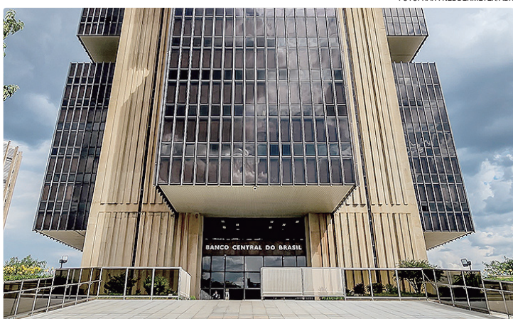
BC realiza pesquisa com economistas e dados são divulgados semanalmente

Os analistas do mercado financeiro reduziram suas estimativas de inflação para os anos de 2025 e de 2026. As projeções fazem parte do Boletim “Focus”, divulgado nesta segunda-feira (15) pelo Banco Central (BC), com base em pesquisa realizada com mais de 100 instituições financeiras na última semana. No mês passado, o mercado baixou, pela primeira vez neste ano, a expectativa de inflação para um patamar abaixo do teto de 4,5% do sistema de metas. Para 2025, a projeção recuou de 4,40% para 4,36% (quinta queda seguida); para 2026, a pro-