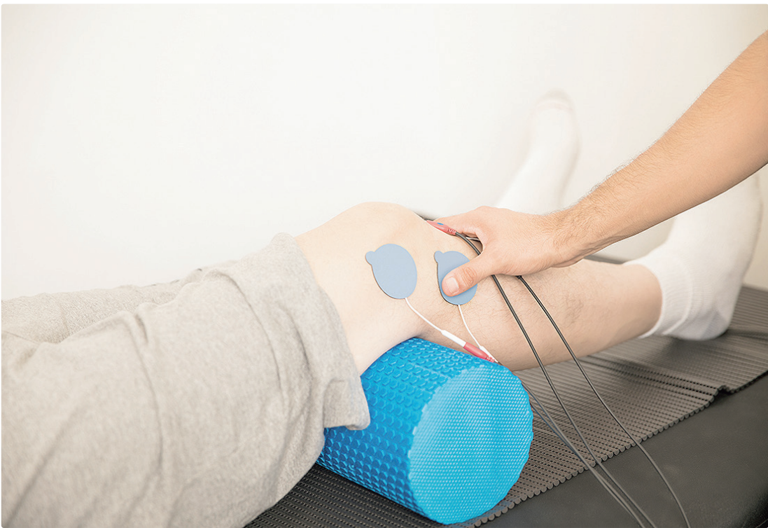
Eletrodos de posicionamento manipulados em paciente reduz a fadiga muscular e a sensação de desconforto

dência disponível como “muito baixa”. Para produzir dados conclusivos, a UnB desenhou um ensaio clínico rigoroso, comparando correntes monofásicas e bifásicas aplicadas com pulsos curtos e pulsos largos. “A literatura sugeria que os pulsos largos poderiam favorecer o recrutamento via medula espinal, produzindo menos fadiga, mas quase todos os estudos anteriores testavam apenas correntes monofásicas, que são desconfortáveis e pouco usadas na clínica”, explica o professor. “Precisávamos entender se equipamentos comuns poderiam oferecer os mesmos benefícios neurofisiológicos com mais conforto.” Na eletroestimulação, pulso significa o tempo de duração de cada estímulo elétrico enviado ao nervo ou ao músculo. Pulsos curtos (de microssegundos) ativam diretamente os axônios motores – extensões dos neurônios que funcionam como fios condutores, levando o comando da medula espinal até o músculo – gerando força rápida, porém acompanhada de maior fadiga. Já os pulsos largos, que duram entre 1 e 2 milissegundos, conseguem recrutar fibras sensoriais que desencadeiam o reflexo medular, produzindo contrações mais fisiológicas, distribuídas e resistentes à fadiga.