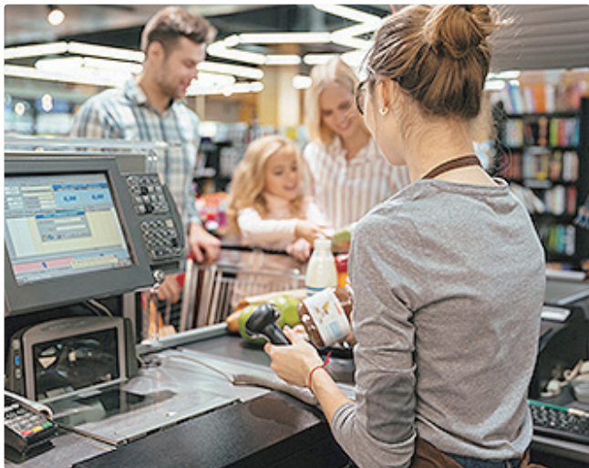
Função de operador de caixa está com 102 vagas abertas