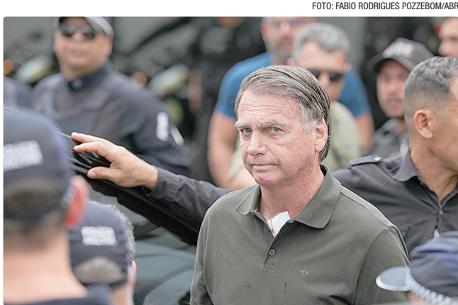
Ex-presidente Bolsonaro foi diagnosticado com 2 hérnias inguinais

Moraes, no entanto, negou o pedido e manteve as regras atuais para as visitas, com necessidades de autorização judicial. Para o ministro, “não há qualquer motivo razoável para que sejam feitas alterações” nos procedimentos.