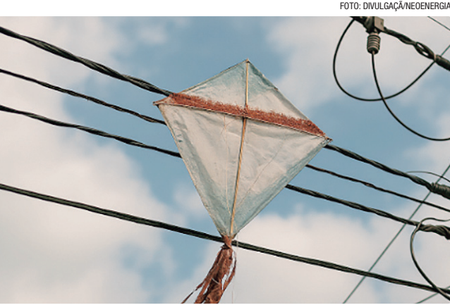
Número de ocorrências aumenta com o período de férias escolares

PROFISSIONAIS AUTORIZADOS A distribuidora reforça que a retirada de pipas presas na rede é uma tarefa exclusiva de profissionais autorizados e treinados. Entrar em subestações, mesmo para buscar brinquedos, é terminantemente proibido e representa grave risco. Em caso de acidentes, a orientação é desligar a chave geral ou o disjuntor e acionar imediatamente o Corpo de Bombeiros (193) ou o Samu (192). Situações envolvendo a rede de distribuição devem ser comunicadas à Neoenergia Brasília pelo número 116.