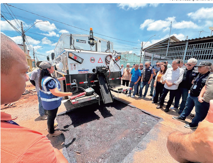
A tecnologia já foi adotada em outros estados e será a primeira vez no DF

O investimento representa um avanço importante no serviço de manutenção asfáltica, que atenderá todas as 35 regiões administrativas do Distrito Federal, conforme as solicitações encaminhadas e previamente vistoriadas. A tecnologia já foi adotada em outros estados e será a primeira vez que o DF utiliza caminhões com caçamba térmica. Atualmente, a massa asfáltica sai da usina a 170 °C e perde temperatura no trajeto, o que reduz a qualidade da compactação e a durabilidade do reparo. Com a nova aquisição, a massa permanecerá