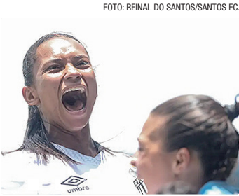
Santos conquistou a vaga ao golear o Fluminense com placar de 4 x 0