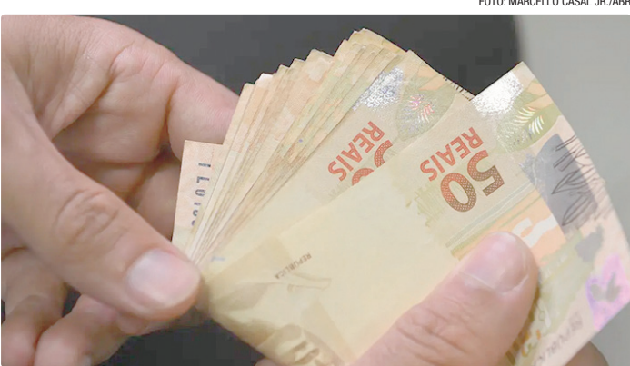
Salário extra injetará R$ 369,4 bilhões na economia, segundo o Dieese

Essas datas valem apenas para os trabalhadores na ativa. Como nos últimos anos, o décimo terceiro dos aposentados e pensionistas do Instituto Nacional do Seguro Social (INSS) foi antecipado. A pri-