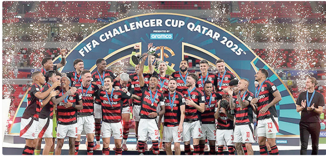
Decisão será na próxima quarta-feira, contra o PSG, a partir das 14h