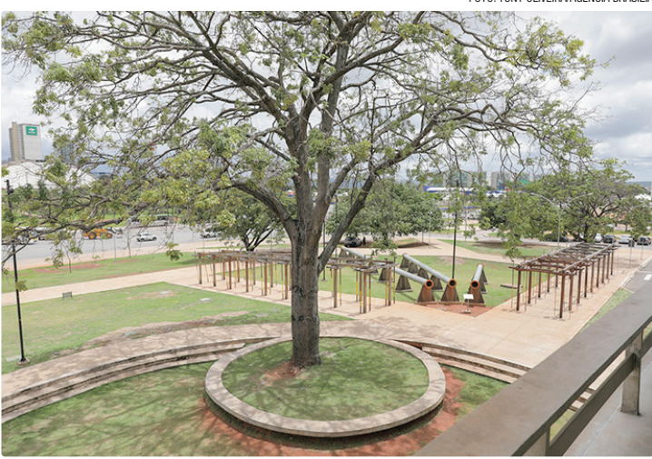
Com maior convivência e acesso à cultura, ação aquece economia criativa

Além de ampliar a convivência e o acesso à cultura, a adoção impulsionou a economia criativa. De novembro de 2022 até agora, o Sesi Lab recebeu cerca de 122