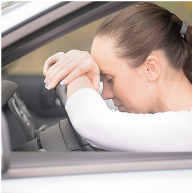
Condutor habilitado pode paraticipar de capacitação gratuita