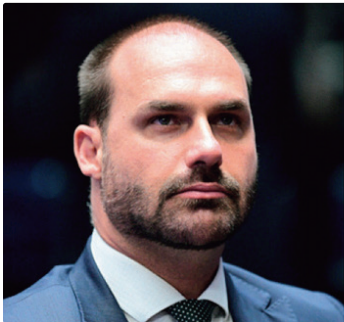
Eduardo foi cassado por faltas; Ramagem (D) por ter sido condenado pelo STF

A Câmara dos Deputados comunicou na última sexta-feira (19) o cancelamento dos passaportes diplomáticos de Eduardo Bolsonaro (PL-SP) e Alexandre Ramagem (PL-RJ), que tiveram os mandatos cassados pela direção da Casa um dia antes. O cancelamento dos passaportes, que ocorre de forma protocolar, seguiu as regras do Ministério das Relações Exteriores (MRE) sobre a emissão dos documentos para autoridades. Segundo a Câmara, cabe ao MRE o cancelamento dos passaportes. A medida foi informada aos ex-parlamentares em escritórios da Segunda Secretaria da Casa, que é a repartição responsável pelo apoio à emissão de documentos oficiais de viagem. Segundo a norma que rege a emissão de passaportes diplomáticos, apenas deputados e senadores com mandato vigente têm direito ao documento. Em nota, a Câmara dos Deputados informou que apenas comunicou o cancelamento dos passaportes a Eduardo Bolsonaro e Alexandre Ramagem. A Casa disse que seus órgãos não fazem qualquer juízo sobre a emissão dos documentos e que a “comunicação a ex-deputados da revogação ou cancelamento de passaportes é ato meramente protocolar e burocrático”. Eduardo e Ramagem perderam o mandato na última quinta (18) por decisão da Mesa Diretora da Câmara. Os dois deixaram o Brasil e moram nos Estados Unidos há meses. A cúpula da Câmara decidiu cassar o mandato do filho do ex-presidente Jair Bolsonaro (PL) por excesso de faltas.