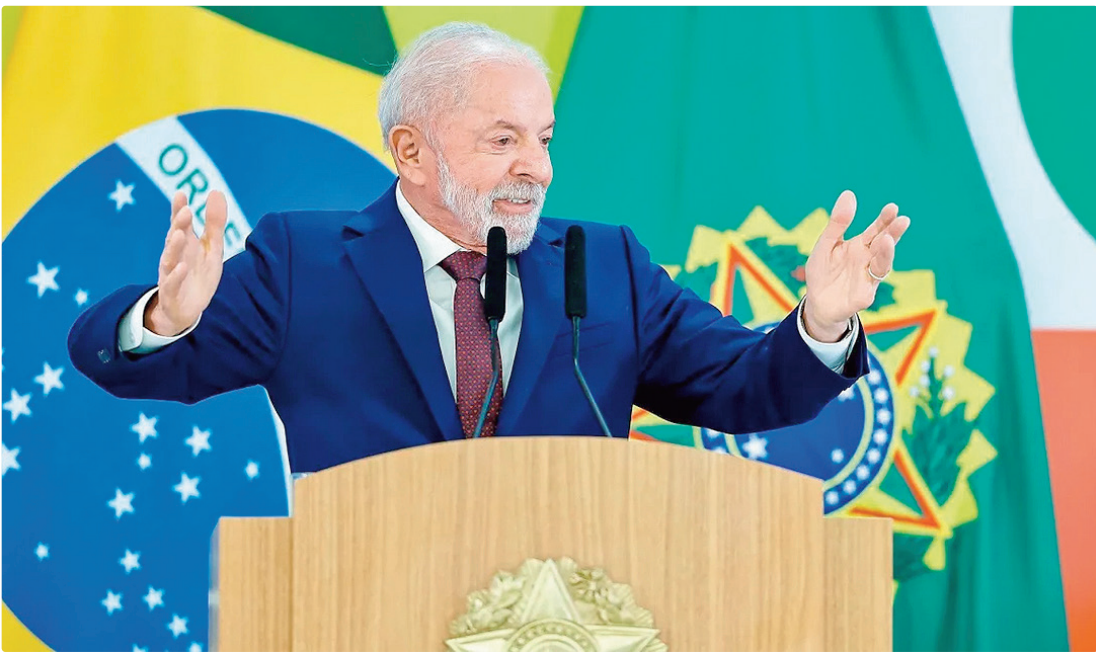
Além dos presos pelo 8/1 e delatores, decreto de Lula deixa de fora agressores de mulheres, chefes de facção e golpistas

LIBERADOS O indulto estabelece a condicionante do tamanho da pena, a reincidência e a natureza do crime. Para condena-