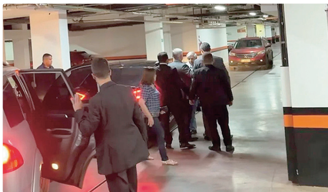
Heleno terá de cumprir medidas cautelares, como o uso de tornozeleira

que por meio de telefone e utilize as redes sociais. “O descumprimento da prisão domiciliar humanitária ou de qualquer uma das medidas alternativas implicará no imediato retorno ao regime fechado”, salienta o magistrado. Heleno também deverá requerer previamente autorização para deslocamentos por questões de saúde, com exceção de situações de urgência e emergência, que deverão ser justificadas no prazo de 48 horas. ALVARÁ DE SOLTURA O general Augusto Heleno deixou a detenção no Comando Militar do Planalto na noite desta segunda-feira (22) para começar a cumprir prisão domiciliar após determinação do ministro Alexandre de Moraes, do STF (Supremo Tribunal Federal). O alvará de soltura foi enviado por Moraes à PF (Polícia Federal), à Vara de Execuções Penais e à Secretaria de Administração Penitenciária do Distrito Federal por volta de 19h.