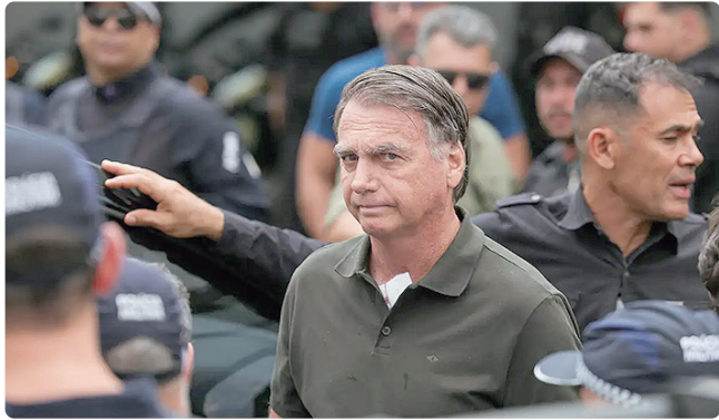
Bolsonaro está cumprindo pena na Superintendência da PF em Brasília

mencionava a suspeita de que o ex-presidente teria tentado violar a tornozeleira eletrônica que utilizava e fugir. Essa tentativa se deu poucos dias após ser revelado que o ex-deputado Alexandre Ramagem (PL-RJ), condenado por golpe de Estado junto de Bolsonaro, havia fugido para os Estados Unidos, aumentando o alerta da polícia e do STF sobre os outros participantes da trama. EXECUÇÃO DE PENA A prisão preventiva do ex-presidente foi convertida em execução de pena três dias depois. A defesa não apresentou no prazo o segundo recurso do qual tinha direito, os embargos declaratórios. Com isso, o ministro do Supremo considerou o caso transitado em julgado, que é quando acabam as possibilidades de recurso e o condenado pode começar a cumprir a pena imposta. Bolsonaro foi sentenciado a 27 anos e três meses de prisão por tentativa de golpe de Estado. Moraes decidiu que Bolsonaro poderia cumprir a pena onde já estava preso preventivamente: em um quarto com cama, televisão, banheiro privativo e ar-condicionado na Superintendência da Polícia Federal.