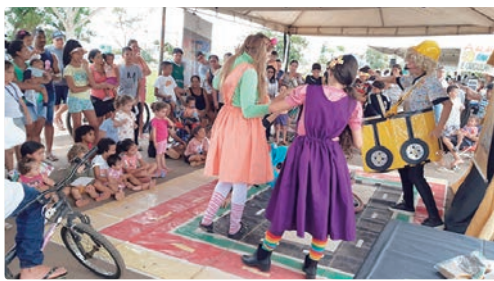
Ações do Detran-DF percorreram dez RAs e reforçaram a segurança viária no período festivo do fim de ano

No domingo (21), as ações continuaram com o Detran nos Parques, no Jardim Botânico, e a Rua do Lazer, na Arapoanga, levando orientações educativas por meio de palestras, intervenções artísticas e distribuição de material informativo à população.