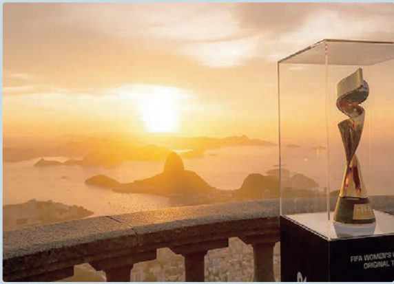
Secretaria coordenará encaminhamentos do Mundial Feminino

eventos e, nesses momentos, a criação de estruturas extraordinárias garante coordenação, eficiência e transparência”, declarou o ministro do Esporte, André Fufuca, sobre a estrutura que irá funcionar no âmbito do Ministério do Esporte e terá vigência até dezembro de 2027. Segundo a secretária executiva adjunta do Ministério do Esporte e coordenadora da Copa do Mundo Feminina 2027 na pasta, Cynthia Motta, não serão necessárias obras de estádios e a atuação se concentrará principalmente em logística, mobilidade, aeroportos, tecnologia da informação, gramados, saúde e articulação interministerial: “É através dessa equipe criada agora que vamos trabalhar exclusivamente para colocarmos a Copa do Mundo de Futebol Feminino 2027 em campo”.