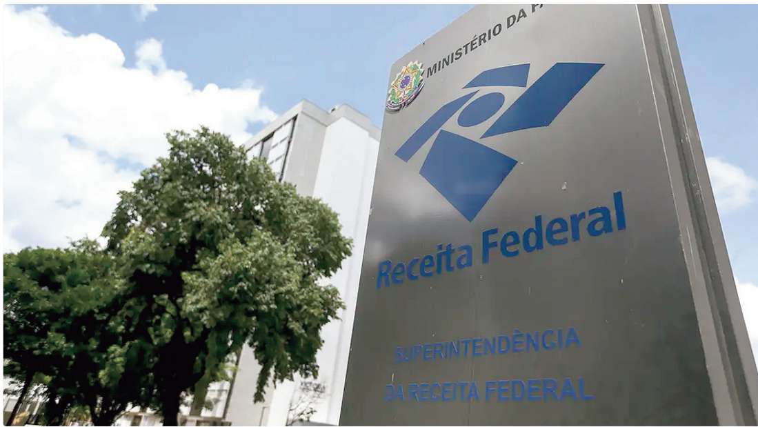
De janeiro a novembro de 2024, o recolhimento extra foi R$ 4 bi; no acumulado deste ano chegou a R$ 3 bilhões

Os valores se referem a tributos federais, como Imposto de Renda (IR) de pessoas físicas e empresas, receita previdenciária, Imposto sobre Produtos