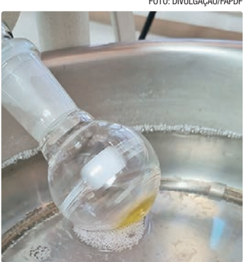
No estudo, a ação na dor não produziu efeitos adversos relevantes

O estudo utiliza um modelo animal de transtorno do espectro autista induzido, no qual alterações comportamentais semelhantes às observadas em pessoas com autismo são reproduzidas de forma controlada, a partir da exposição ao ácido valproico em animais de laboratório, permitindo investigar mecanismos