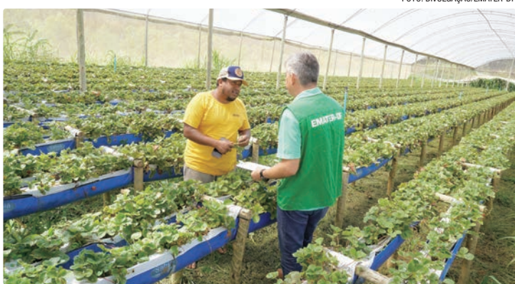
Assistência técnica da Emater-DF ultrapassa 150 mil atendimentos

Ao longo do ano, a empresa promoveu 355 capacitações, beneficiando mais de 3,2 mil