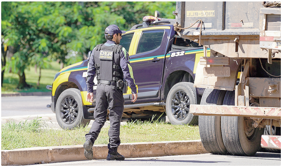
Campanhas educativas e operações de fiscalização foram realizadas ao longo dos quase 2 mil quilômetros de rodovias

Os benefícios dos expressivos investimentos realizados em 2024, a exemplo do Complexo Viário do Jardim Botânico, refletiram-se em 2025 na melhoria da fluidez do tráfego, na diminuição dos congestionamentos e na redução do tempo