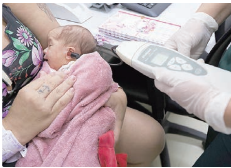
Execução da política pública conta com auxílio da fonoaudiologia, profissão que completa 44 anos de regulamentação nesta semana

A SES-DF conta com 217 fonoaudiólogos em seu corpo técnico. No contexto hospitalar, esse profissional de saúde de nível superior está disponível em todas as 16 unidades da rede pública.