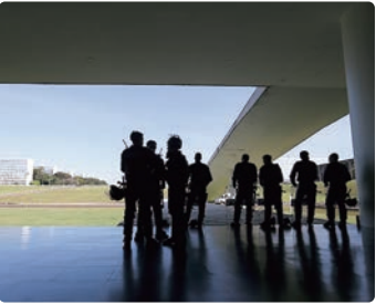
Somente policiais legislativos do Congresso tinham posse de arma

O presidente Luiz Inácio Lula da Silva (PT) sancionou o projeto de lei que autoriza o porte de arma de fogo para os policiais legislativos que atuam nas Assembleias estaduais e na Câmara Legislativa do Distrito Federal (DF), conforme publicado no Diário Oficial da União nesta terça-feira (23). Com a medida, o porte passa a valer para toda a polícia legislativa do país, uma vez que os policiais da Câmara e do Senado já possuem essa autorização. O projeto de lei, que altera o estatuto do desarmamento de 2003, foi aprovado pela Comissão de Constituição e Justiça e de Cidadania (CCJ) da Câmara dos Deputados no fim de setembro e aguardava sanção presidencial. Antes disso, o PL já havia sido aprovado pelo Senado. No entanto, Lula vetou trechos do texto aprovado pela CCJ que dispensavam os policiais de comprovar idoneidade, capacidade técnica e aptidão psicológica para o manuseio de arma de fogo, como previsto no estatuto. Na avaliação do Poder Executivo, os vetos foram necessários por representarem uma flexibilização significativa do sistema normativo e a retirada de garantias essenciais para o manuseio seguro de armas de fogo, com risco à política nacional de controle de armas e à segurança pública.