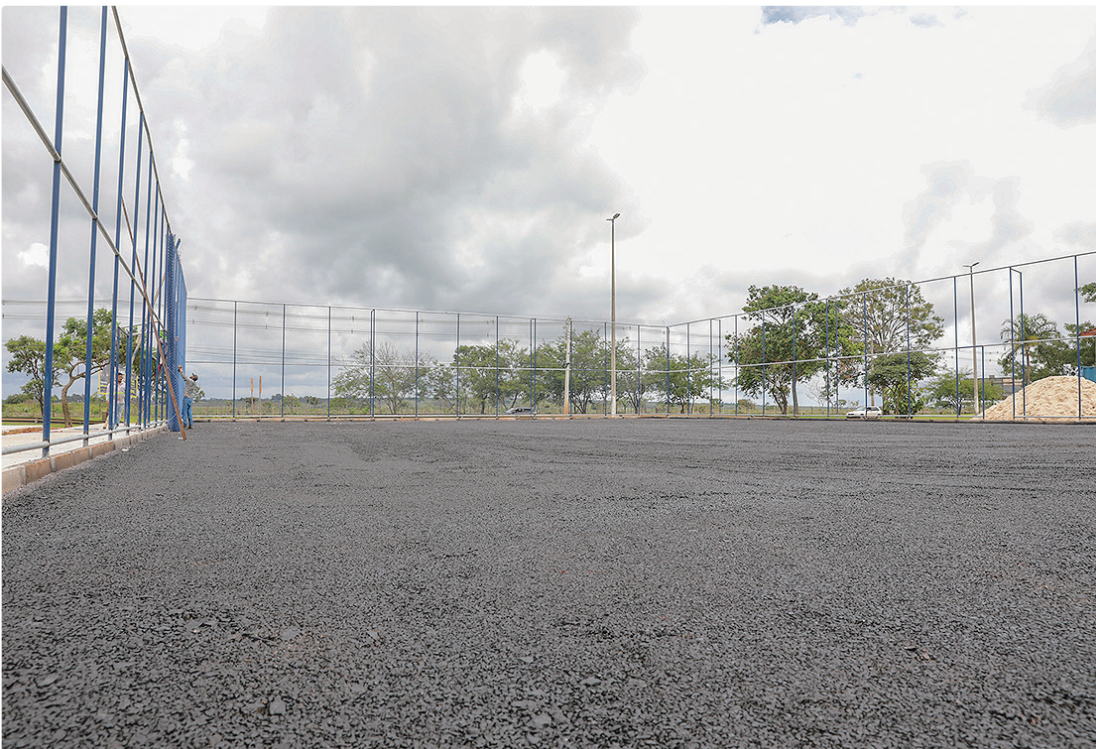
A reforma do campo sintético está em andamento, assim como do parquinho infantil, que vai ganhar brinquedos novos