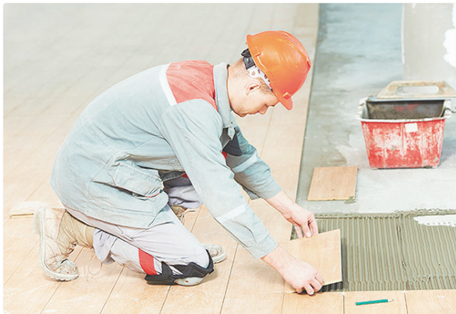
Na Asa Norte, há 10 vagas para ladrilheiro; exigem-se experiência

Empregadores e empreendedores que desejem ofertar vagas ou utilizar o espaço das agências do trabalhador para as entrevistas podem se cadastrar pessoalmente nas unidades ou pelo e-mail gcv@sedet.df.gov.br. Pode ser utilizado, ainda, o Canal do Empregador, no site da Secretaria de Desenvolvimento Econômico, Trabalho e Renda (Sedet-DF).