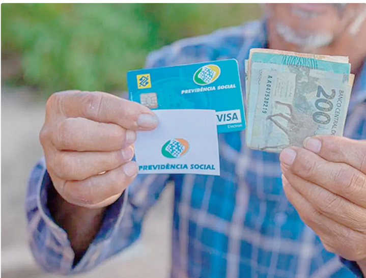
Todo ano haverá acdrescimo no cálculo do benefício, até 2031

Quem está prestes a se aposentar precisa estar atento. A reforma da Previdência, promulgada em 2019, estabeleceu regras automáticas de transição, que mudam a concessão de benefícios a cada ano. A pontuação por tempo de contribuição e por idade sofreu alterações.