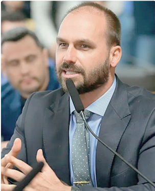
Eduardo se afastou da PF para cumprir o mandato na Câmara

A Polícia Federal determinou que Eduardo Bolsonaro, filho do ex-presidente Jair Bolsonaro, volte ao cargo de escrivão na corporação. A medida foi publicada no Diário Oficial da União (DOU) desta sexta-feira (2). Eduardo estava afastado de suas funções na PF para cumprir o seu mandato na Câmara dos Deputados. Contudo, teve o mandato cassado em 18 de dezembro por excesso de faltas. A perda do mandato foi declarada com base em uma regra da Constituição que proíbe deputados e senadores de faltar a mais de 1/3 das sessões deliberativas do ano. Eleito por São Paulo, Eduardo Bolsonaro mora nos Estados Unidos desde o início do ano passado. Ele tem afirmado que a mudança ocorreu para evitar uma suposta perseguição política e jurídica no Brasil. Eduardo tentou exercer o mandato à distância e driblar o registro de ausências na Câmara. Não teve sucesso.