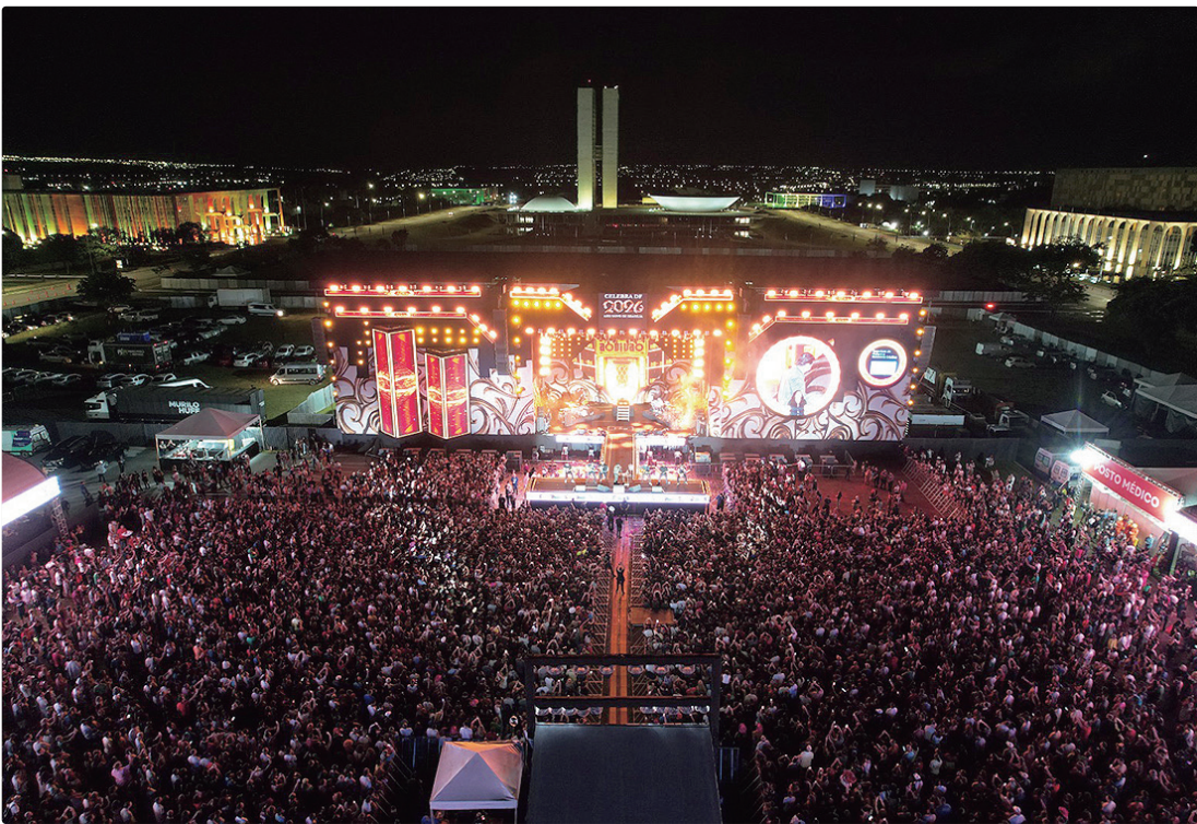
Um grande público notabilizou Brasília como referência nacional em festas de virada de ano, nos dias 31 e 1º

Com estrutura planejada para receber grandes públicos e programação distribuída para diferentes perfis, o Celebra DF integrou uma agenda cultural ampla, segura e acessível, voltada para toda a família. A iniciativa também dialoga diretamente com o Nosso Natal, fortalecendo uma política pública de eventos que valoriza o encontro, a fraternidade e o