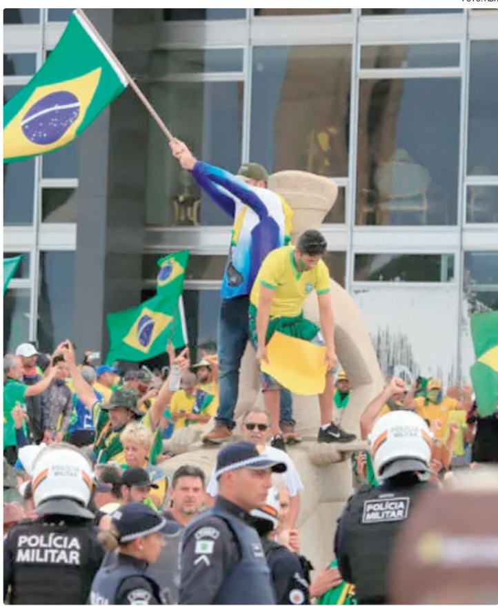
Golpistas destruíram o Congresso, o Palácio do Planal e o Supremo

EXPOSIÇÃO No início da tarde de 8 de janeiro haverá a abertura da exposição “8 de janeiro: Mãos da Reconstrução”, a ser exibida no Espaço do Servidor, no STF. Em seguida, será exibido o documentário “Democracia Inabalada: Mãos da Reconstrução” no Museu do próprio tribunal. A programação segue com uma