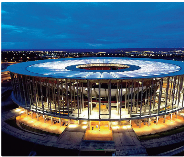
Flamengo e Corinthians disputam o 1º título da temporada de 2026

Não disputada entre 1992 e 2019, a Supercopa do Brasil foi reativada pela CBF em 2020. Em 2024, a CBF rebatizou a competição para Supercopa Rei em homenagem a Pelé, o Rei do Futebol, falecido em dezembro de 2022. A ideia é que o troféu represente a coroa do futebol nacional, sendo disputado pelos dois clubes que dominaram o cenário futebolístico no ano anterior.