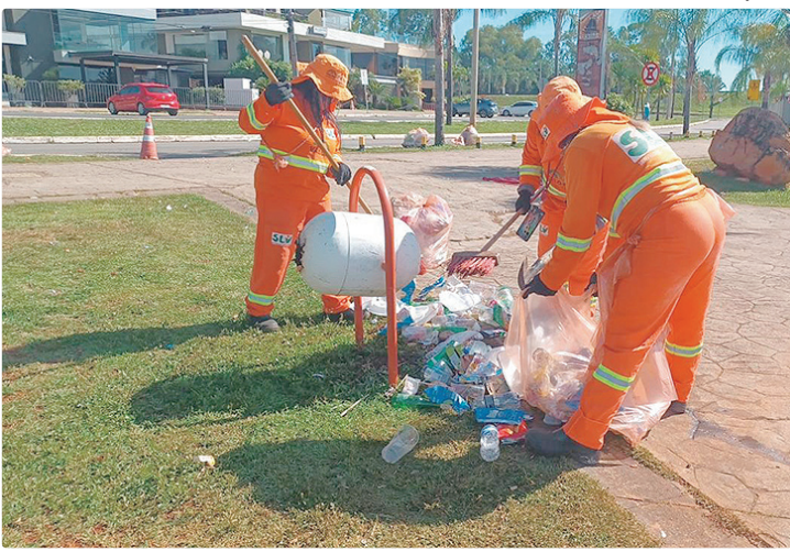
SLU vê redução como mudança de conscientização da população do DF

Segundo ele, o trabalho contínuo do SLU e a conscientização da população são fundamentais para manter essa tendência de queda e aprimorar a gestão de resíduos no DF.