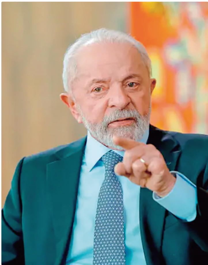
Lula autorizou um déficit primário de R$ 6,75 bilhões no Orçamento

DÉFICIT PRIMÁRIO A meta fiscal para 2026, fixada na LDO, permite um déficit primário de até R$ 6,75 bilhões. Não serão con-