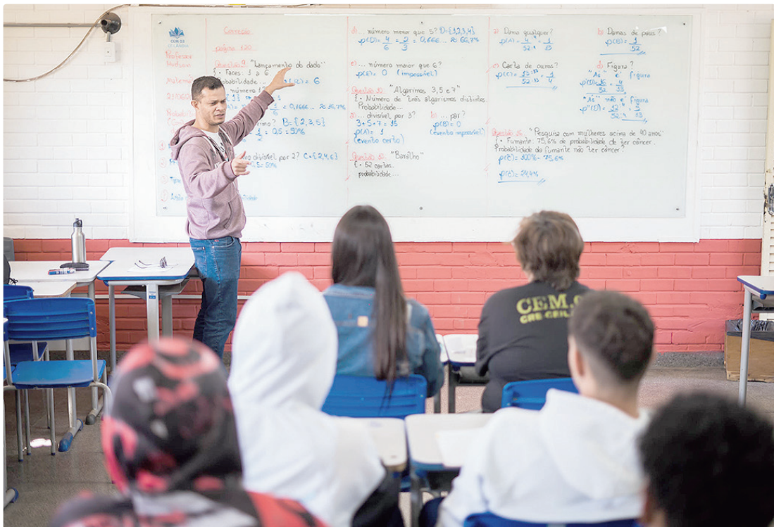
Iniciativa reforça o Distrito Federal como a unidade da Federação com a menor taxa de analfabetismo do Brasil