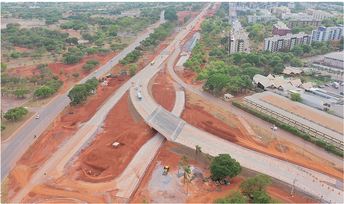
Obras na Epig: corredor exclusivo de ônibus segue em andamento e vai desafogar o trânsito para o centro

Na região da Colônia Agrícola Samambaia, as obras de infraestrutura representam a última etapa de um projeto que transformou completamente Vicente Pires. O local, que historicamente sofria com alagamentos e problemas viários, agora recebe os serviços finais de drenagem, pavimentação e urbanização.