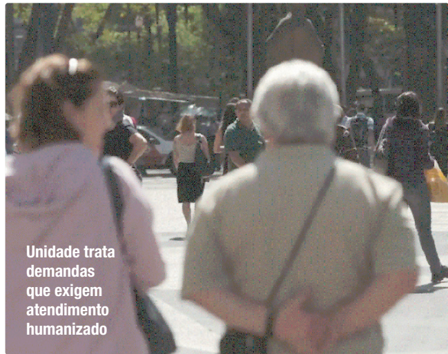
Unidade trata demandas que exigem atendimento humanizado

E a gente está falando das clínicas da Família, dos centros de Referência Especializados de Assistência Social (Creas), dos centros de Referência de Assistência Social (Cras), dos abrigos, das casas de envelhecimento saudável que o município tem. Todo esse aparato contribui para uma prestação jurisdicional melhor, porque de nada adianta o juiz dar uma sentença determinando o acolhimento de um idoso se não tiver um local para acolhê-lo”, explicou o magistrado.