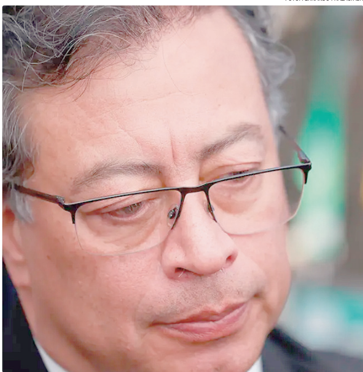
Petro não pode concorrer à reeleição a um segundo mandato consecutivo

Ele não vai continuar fazendo isso por muito tempo”,