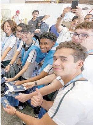
Alunos de vários CEFs fizeram intercâmbio na Europa

A SEEDF lançou este ano o programa Pontes para o Mundo, com o objetivo de oferecer experiência internacional de ensino e inovação a estudantes da rede pública. O intercâmbio teve duração de 17 semanas, com participação em instituições de países de língua inglesa, como Inglaterra, País de Gales e Escócia. A primeira edição concluiu a experiência com formatura.