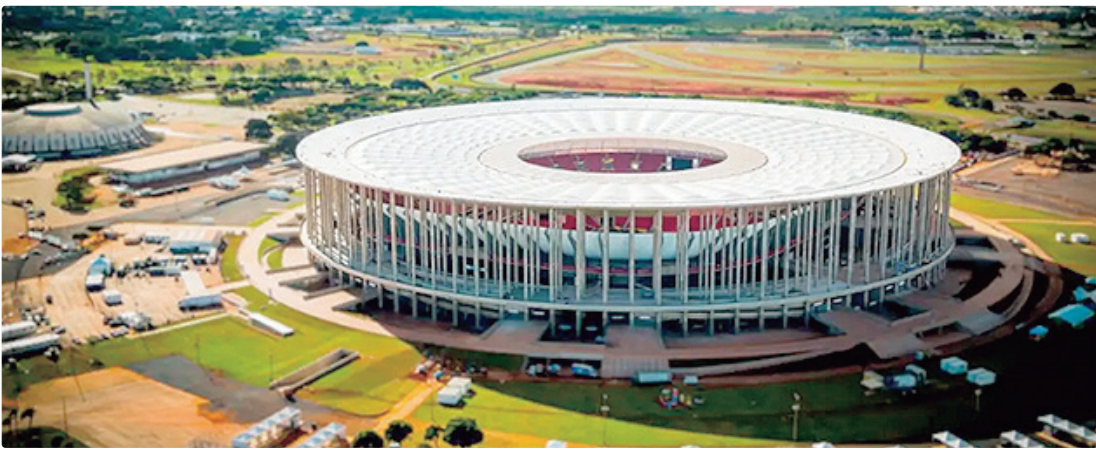
O estádio Nacional Mané Garrincha (Arena BRB) recebe a decisão e será o primeiro a receber a Copa Rei

ESTÁDIO DIVIDIDO A partida será entre Flamengo, campeão do Campeonato Brasileiro de 2025, e Corinthians, campeão da Copa do Brasil, neste ano. A partida abre a temporada de bola de 2026. Ainda segundo