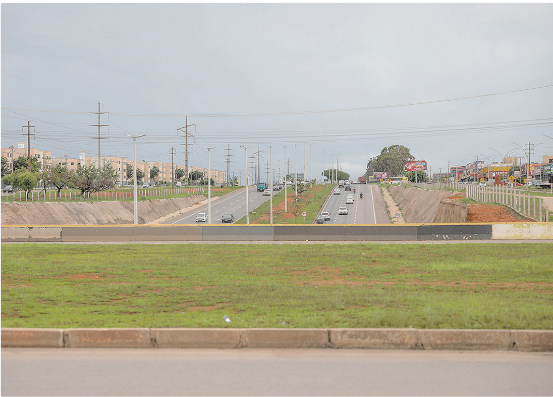
Nova pista e o elevado deram maior fluidez ao trânsito das duas cidades, divididas apenas pelo viaduto

FLUIDEZ Executada pelo DER-DF, com investimento de R$ 30,9 milhões, a estrutura criou um novo acesso ao Recanto das Emas e ao Riacho Fundo II, e melhorou a fluidez para quem transita no sentido Gama-Samambaia e vice-versa. A estimativa é de que 60 mil motoristas passem pelo