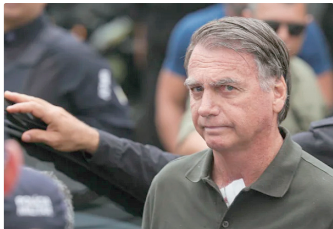
Ex-presidente cumpre pena em regime fechado na Polícia Federal

De acordo com o magistrado, as visitas ocorrerão às terças e quintas-feiras, das 9 horas às 11 horas, com duração de 30 minutos, com limitação de dois familiares por dia. Cada familiar deverá visitar o preso separadamente.