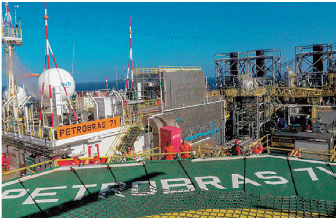
A maior parte da produção de petróleo (97,7%) e do gás natural (85,7%) foi produzida em campos marítimos

A produção de petróleo e de gás natural no Brasil atingiu 4,921 milhões de barris de óleo equivalente por dia (boe/d) em novembro de 2025. Foram extraídos 3,773 milhões de barris por dia (bbl/d) de petróleo, o que representa uma queda de 6,4% frente ao mês anterior e aumento de 13,9% se comparado ao mesmo mês de 2024. A produção de gás natural ficou em 182,57 milhões de metros cúbicos por dia (m³/d), o que significa recuo de 6,3% em relação a outubro e alta de 15,7% frente novembro de 2024. Os dados - que fazem parte do Boletim Mensal da Produção de Petróleo e Gás Natural - foram divulgados nesta segunda-feira (5), no Rio de Janeiro, pela Agência Nacional do Petróleo, Gás Natural e Biocombustíveis (ANP). Na área do pré-sal, a produção de petróleo e gás natural, no mesmo mês, ficou em 3,913 milhões de boe/d, o