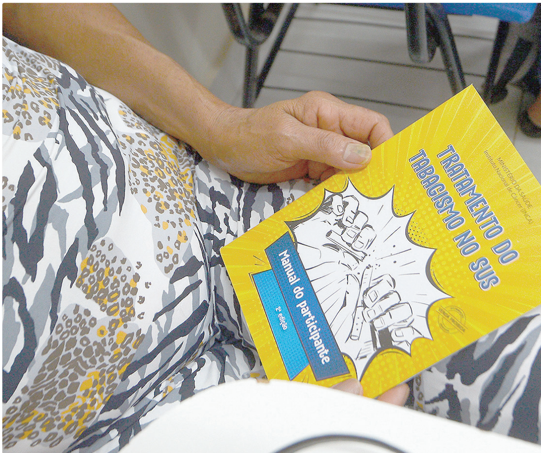
O tratamento antitabagismo inclui diferentes abordagens e pode ser acessado por qualquer pessoa interessada

O tratamento ofertado nas unidades da SES-DF segue protocolos estabelecidos pelo Ministério da Saúde e pelo Instituto Nacional de Câncer (Inca). Há encontros estruturados que têm como foco o processo de parar de fumar. Em caso de sucesso, o paciente continua a ser acompanhado para manter fora da rotina o antigo vício. A duração depende de pessoa para pessoa.