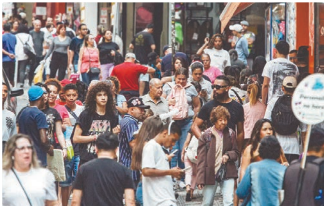
Contribuição representa 5% do novo salário mínimo: R$ 1.621

DEMANDA AQUECIDA Quando o Copom aumenta a Selic, a finalidade é conter a demanda aquecida; isso causa reflexos nos preços porque os juros mais altos encarecem o crédito e estimulam a poupança. Assim, taxas mais altas também podem dificultar a expansão da economia. Os bancos ainda consideram outros fatores na hora de definir os juros cobrados dos consumidores, como risco de inadimplência, lucro e despesas administrativas. Quando a taxa Selic é reduzida, a tendência é que o crédito fique mais barato, com incentivo à produção e ao consumo, reduzindo o controle sobre a inflação e estimulando a atividade econômica.