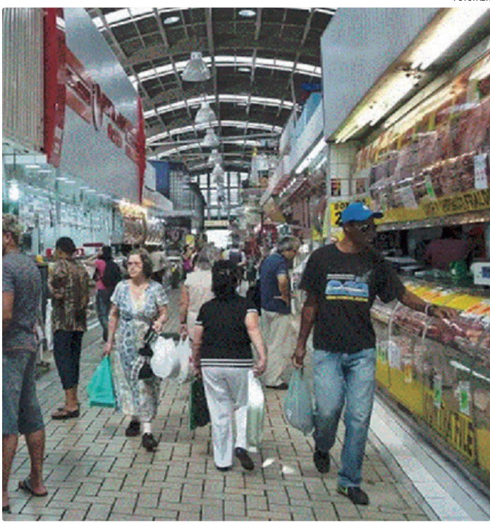
Quando o Copom aumenta a Selic, objetiva conter a demanda aquecida

PIB Tanto as projeções do mercado financeiro para o câmbio, como para a taxa básica