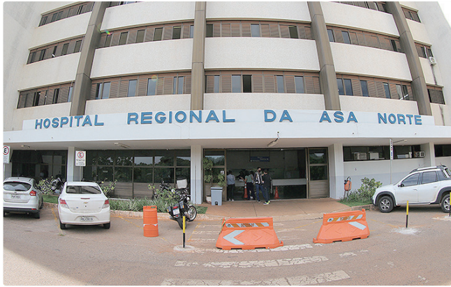
Residência médica no Hran é considerada como de padrão ouro

O incentivo à pesquisa é outro alicerce da unidade. Todos os residentes têm a obrigatoriedade de publicar ao menos um trabalho científico, mas muitos concluem o curso com até cinco publicações.