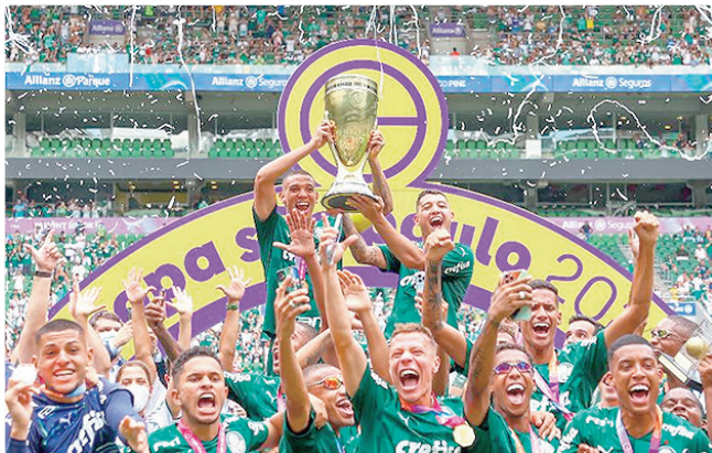
Base do time que levou o Palmeiras a títulos foi campeã em 2022

defendeu o Inter de Milão (Itália), Benfica (Portugal), Flamengo e, por último, o Cruzeiro.