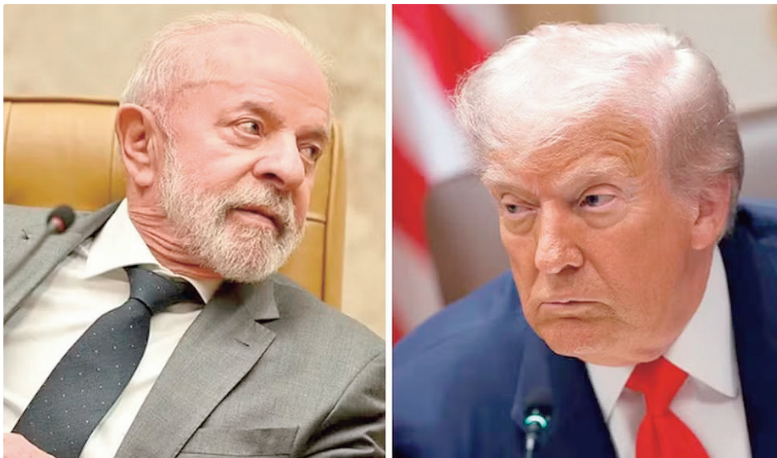
Lula faz uma leitura cautelosa de possível expansão das ações de Trup, que está interessado nas terras raras

A preocupação central do governo brasileiro é que o epi-