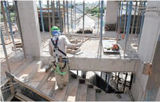
Cargo de pedreiro, em Águas Claras, paga R$ 2 mil mensais

são 30 como atendente de padaria, 30 para repositor de mercadorias, 30 na função de fiscal de prevenção de perdas, além de outras 30 como operador de caixa — todas oferecendo um salário de R$ 1,7 mil. Para participar dos processos seletivos, basta cadastrar o currículo no aplicativo da Carteira de Trabalho Digital (CTPS) ou ir a uma das agências do trabalhador, das 8h às 17h, durante a semana. Mesmo que nenhuma das oportunidades do dia seja atraente ao candidato, o cadastro vale para oportunidades futuras, já que o sistema cruza dados dos concorrentes com o perfil que as empresas procuram. Empregadores que desejam ofertar vagas ou utilizar o espaço das agências do trabalhador para entrevistas podem se cadastrar pessoalmente nas unidades ou solicitar atendimento pelo e-mail gcv@setrab.df.gov.br e no site da Sedet-DF.