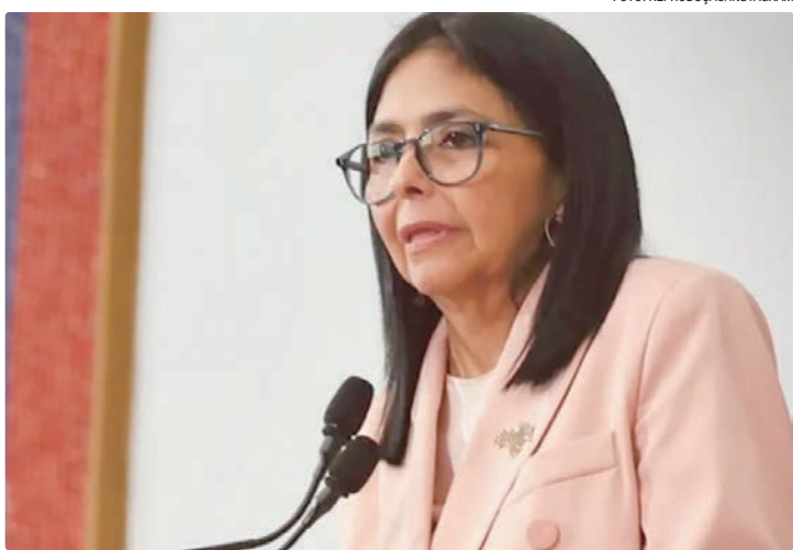
A presidente interina da Venezuela disse que quer trabalhar “junto” com os EUA

“Tem que se respeitar a soberania nacional. Porém, a situação na Venezuela transcendeu a razão. Uma ação forçada em um governo ilegítimo. Não se pode passar a mão na cabeça dos malfeitos