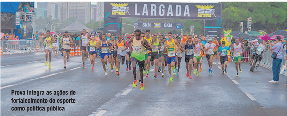
Prova integra as ações de fortalecimento do esporte como política pública

Com mais de cinco décadas de história, a Corrida de Reis é um evento que vai além da competição esportiva, consolidando-se como um símbolo de incentivo à prática esportiva, à saúde e à ocupação dos espaços públicos. A prova conta com o apoio do Governo do Distrito Federal (GDF) e integra as ações de fortalecimento do esporte como política pública. Em 2026, a prova principal será disputada no dia 31 deste mês, e a infantil terá vez no dia 24. A Secretaria de Esporte e Lazer (SEL-DF) apresentará, na próxima sexta-feira (9), os