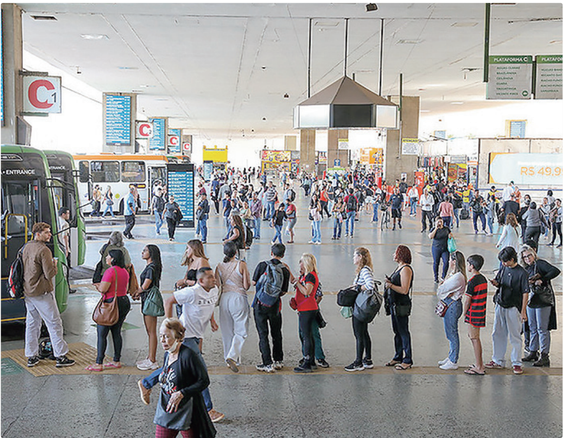
O programa funcionou durante 69 dias, incluindo domingos, feriados e datas em que o benefício foi estendido

ACESSOS DIÁRIOS Segundo o secretário, a média de viagens aos domingos, que antes do programa girava em torno de 270 mil acessos por dia, subiu mais de 70% com as passagens gratuitas, passando para uma média de 458 mil acessos diários. “O Vai de Graça contribuiu para o incremento no sistema de