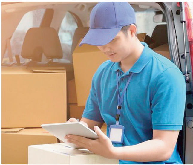
Posto com maior remuneração é o de motorista entregador

Empregadores e empreendedores que desejem ofertar vagas ou utilizar o espaço das agências do trabalhador para as entrevistas podem se cadastrar pessoalmente nas unidades ou pelo e-mail gcv@sedet.df.gov.br. Pode ser utilizado, ainda, o Canal do Empregador, no site da Secretaria de Desenvolvimento Econômico, Trabalho e Renda (Sedet).