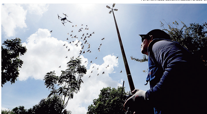
Mais de 2,1 mil hectares foram mapeados por meio de drones

As ações de combate às arboviroses foram executadas de forma ininterrupta ao longo do ano, abrangendo desde residências até locais públicos. Entre as estratégias utilizadas está a Borrifação Residual Intradomiciliar (BRI), tecnologia que cria uma camada protetora nas paredes internas, capaz de eliminar os mosqui-