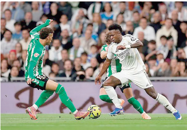
Especialistas decifraram diálogo do brasileiro com Xabi Alonso

f***. Eles têm que tocar a bola. Aqui todo mundo quer driblar e depois eu que sou vaiado. Fala para o Gonzalo que ele tem que passar uma. Não toda vez, mas pelo menos uma”, disse. Gonzalo marcou três dos cinco gols do Real Madrid na vitória de 5 a 1 sobre o Betis. Asencio e Fran García complementaram o placar para os merengues. Cucho Hernández descontou para os visitantes. O time de Xabi Alonso é o segundo colocado no Campeonato Espanhol com 45 pontos, quatro a menos que o líder Barcelona.