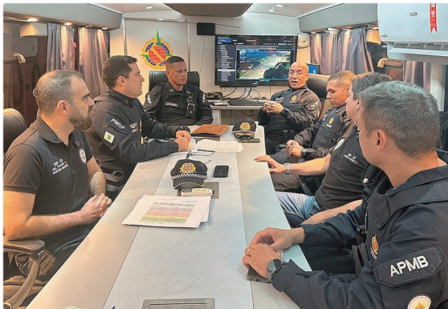
Centro Integrado reuniu 31 órgãos e agências de segurança do DF

cedimentos forem definidos e implementados pela autarquia. A página reúne informações sobre o novo processo da CNH, as adequações previstas, as ações já concluídas e aquelas que ainda estão em andamento, além de orientações gerais ao cidadão. O ambiente digital disponibiliza, ainda, um campo de perguntas frequentes (FAQ), um passo a passo para a obtenção da CNH, a relação dos serviços pagos e gratuitos e, em breve, contará com um quiz interativo para testar os conhecimentos sobre trânsito.