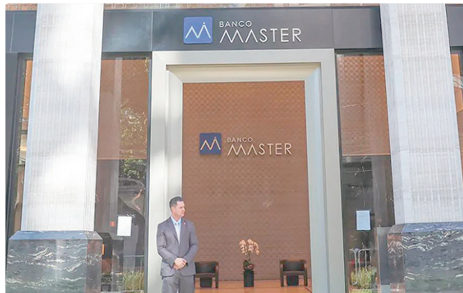
Nota técnica encaminhada à Corte foi considerada insuficiente