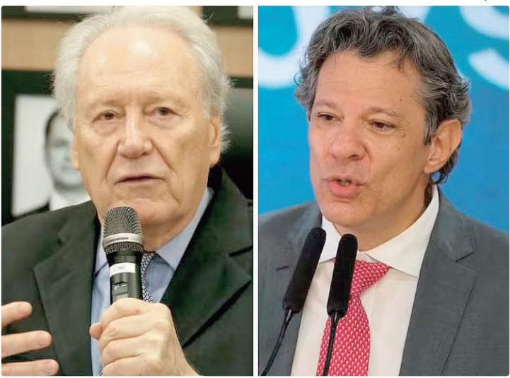
Lewndovski e Haddad devem deixar o governo até 9 de janeiro próximo