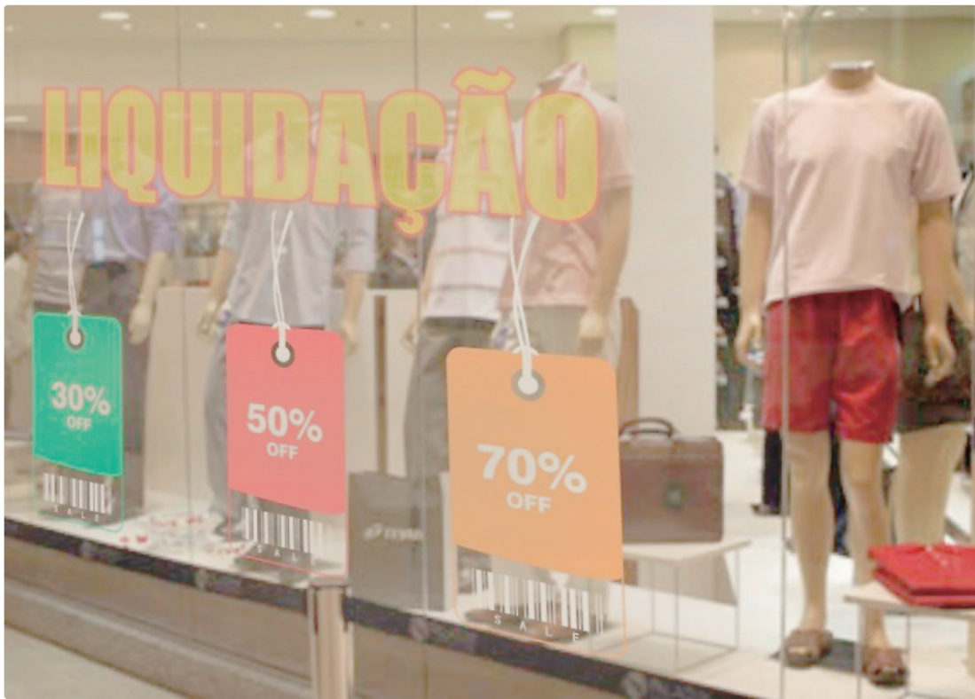
Lojistas do DF já estão se preparando para a queima de estoque tradicional que ocorre nos mês seguinte ao Natal