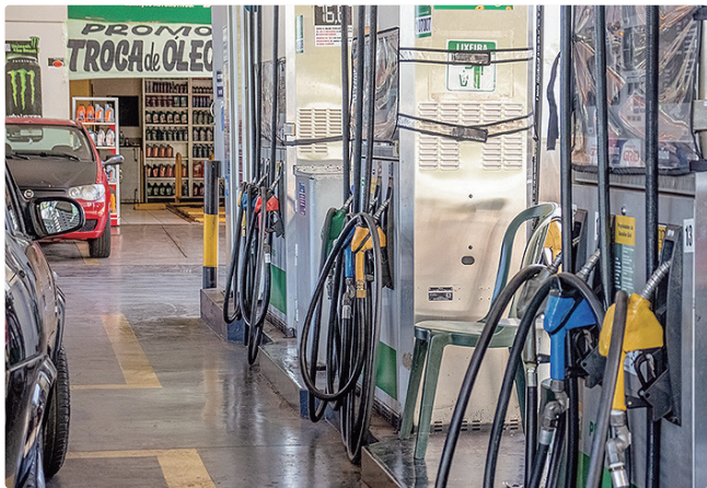
Decisão do Confaz vale para todo o território nacional

O ajuste anual das alíquotas para gasolina, diesel e GLP considerou os preços médios mensais dos combustíveis divulgados pela Agência Nacional do Petróleo, Gás Natural e Biocombustíveis (ANP), de fevereiro a agosto de 2025, em comparação com o mesmo período de 2024, seguindo metodologia técnica aplicada desde a edição da lei pelo Confaz.