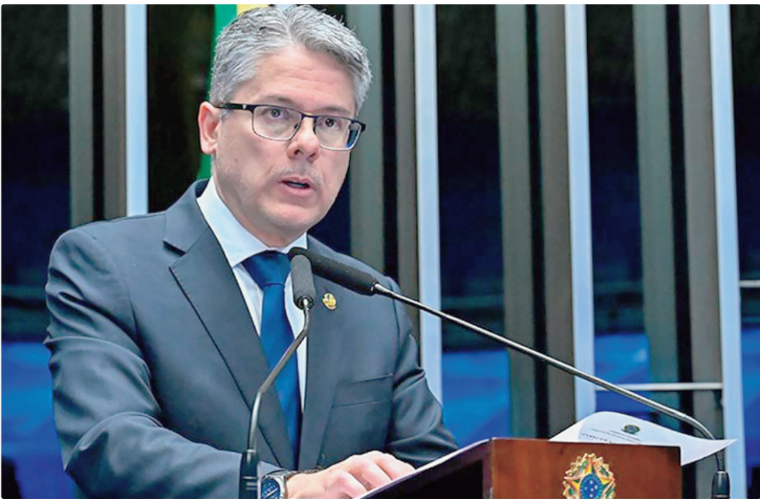
Projeto de Lei relatado por Alessandro Vieira prevê penas até 120 anos de prisão para casos específicos

A portaria permite o uso de imagens de pessoas geradas por inteligência artificial, mas prevê que deverá ser assegurada a isonomia, a rastreabilidade e a integridade do material apresentado. O texto veda, porém, o uso de álbuns criminais ou policiais que contenham apenas imagens de investigados ou processados.