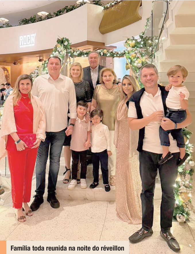
Família toda reunida na noite do réveillon

No trabalho, atenção às palavras e foco nas tarefas. A tarde traz boas energias para fortalecer parcerias e colaborar com colegas. As amizades e relacionamentos também ficam em alta, com possibilidades de apimentar a vida a dois. Aproveite o dia com momentos especiais. Cor: VERDE-ESMERALDA Palpite: 32, 51, 04.