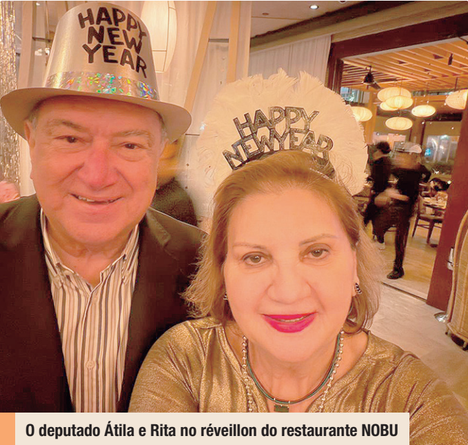
O deputado Átila e Rita no réveillon do restaurante NOBU

NEM BRASÍLIA, NEM MANAUS. Ao contrário dos outros anos, o deputado Átila Lins, que é o decano da Câmara dos Deputados, e sua Rita, na companhia da família, escolheram Miami para saudar a chegada de 2026.