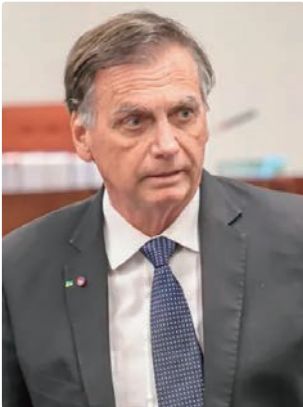
Bolsonaro teve traumatismo leve ao bater a cabeça na cela

Claudio Birolini, médico de Bolsonaro, afirmou à GloboNews que o ex-presidente teve um traumatismo craneoencefálico (TCE) leve. O quadro, em geral, tem recuperação do estado mental normal em até 24 horas, mas exige atenção.