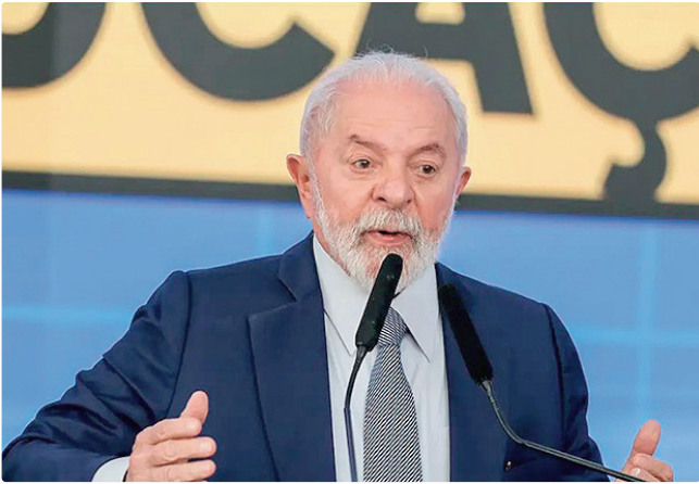
Decisão do presidente ainda pode ser derrubada pelo Congresso

O texto vetado também restringiria a obrigatoriedade do georreferenciamento de imóveis rurais em todo o território nacional. No entendimento do governo federal, a mudança atrasaria a digitalização da malha fundiária e comprometeria a segurança dos registros imobiliários.