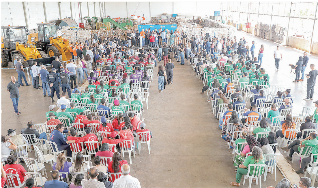
Celina Leão: “Hoje estamos melhorando as condições de trabalho, entregando equipamentos, assinando ações”

VALORIZAÇÃO Durante a cerimônia, a governadora em exercício ressaltou a importância dos investimentos para a valorização dos catadores e fez um apelo à população. “Nós já somos referência na área da reciclagem e temos a melhor renda per capita para catadores no Brasil. Hoje estamos melhorando as condições de trabalho, entregando equipamentos, assinando ações de capacitação e ampliando esse espaço para a instalação de novos maquiná-