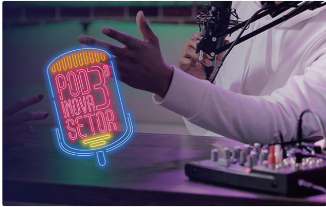
Os projetos selecionados participarão de um podcast profissional