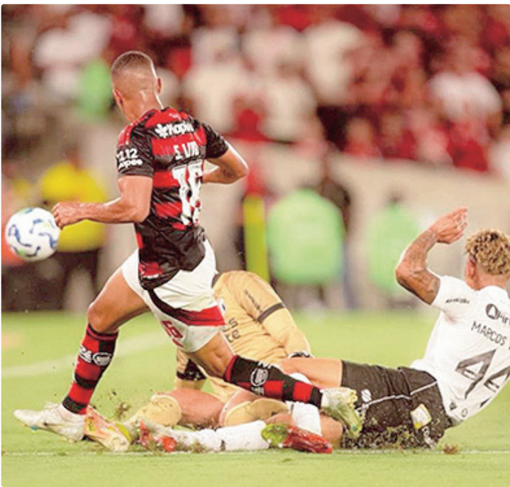
Agenda do campeão brasileiro e sul-americano forçou a antecipação

O Flamengo se prepara para a estreia no Campeonato Carioca no próximo domingo (11), diante da Portuguesa, em jogo antecipado da quinta rodada do estadual. Com calendário apertado já no início da temporada, o Rubro-Negro não terá o estadual como prioridade em meio à disputa de outras competições nacionais e internacionais. O duelo com a Lusa acontecerá antes mesmo do retorno do elenco profissional às atividades. A reapresentação do grupo comandado por Filipe Luís acontece na segunda-feira (12), dia seguinte ao primeiro jogo no Cariocão, que começará oficialmente na próxima quarta-feira, dia 14 de janeiro. Nesse sentido, a expectativa é que o Flamengo seja representado pelo time sub-20 nos três primeiros compromissos no estadual, contra Portuguesa, Bangu e Volta Redonda. A tendência é que a estreia dos titulares seja diante do Vasco, no dia 21, na terceira rodada – o jogo contra a Lusa é antecipado da quinta rodada. Logo após o duelo com o Cruz-Maltino, o Mais Querido tem mais um clássico, desta vez contra o Fluminense. Na