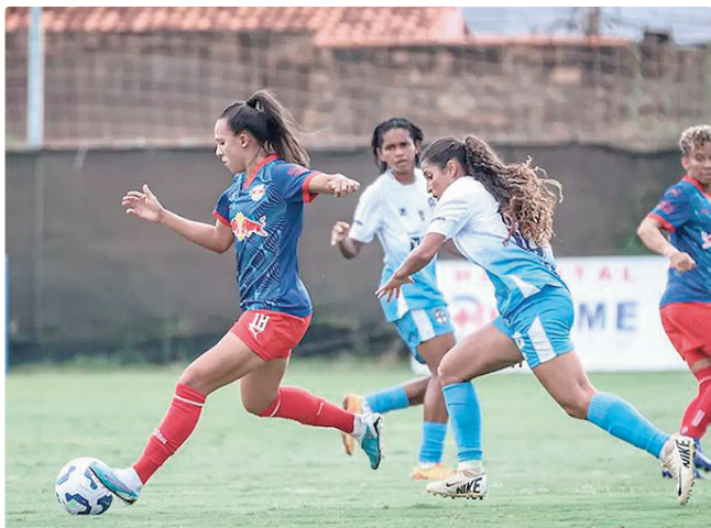
Real Brasília deixa a competição por peder o patrocínio do BRB

oficial, o clube justificou a decisão pela restrição orçamentária e da incapacidade financeira para manter a modalidade. Além do sonhado acesso à elite do futebol nacional, as Leões – apelido do time feminino do Fortaleza – também foram campeãs cearenses e conquistaram o título da primeira edição da Copa Maria Bonita, que reuniu nove equipes do Nordeste. Enquanto as Leões brilharam em 2025, o time masculino amargou o rebaixamento para a Série B do Brasileirão de 2026. REAL BRASÍLIA A desistência do Real Brasília-DF, tradicional representante do Distrito Federal no Brasileirão Feminino, ocorreu, segundo o clube, em razão da saída do patrocinador master, o Banco de Brasília. A decisão foi anunciada pelas redes sociais no último dia de 2025.