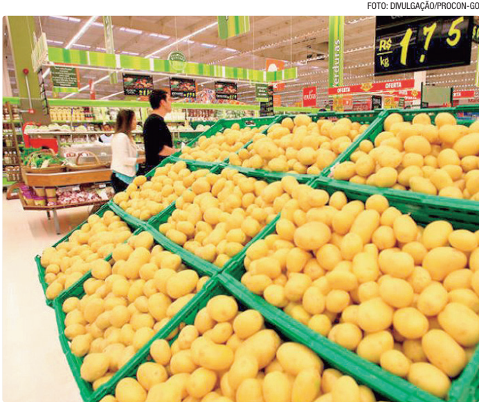
Elevação dos preços de alimentos no DF foi de 1,55% em dezembro

Em dezembro de 2025, a cesta básica ficou mais cara em 17 capitais brasileiras. A conclusão é da Pesquisa Nacional da Cesta Básica de Alimentos, um levantamento divulgado mensalmente pelo Dieese, junto com a Companhia Nacional de Abastecimento (Conab). A única capital onde o preço médio não variou foi João Pessoa. Nas demais capitais, houve queda. A elevação mais importante ocorreu em Maceió, onde o custo médio da cesta variou 3,19%. Em seguida, aparecem Belo Horizonte, com aumento de 1,58%; Salvador (1,55%); Brasília (1,54%); e Teresina (1,39%). As quedas mais expressivas foram observadas na região norte do país, com Porto Velho liderando a lista (-3,60%), seguida por Boa Vista (-2,55%), Rio Branco (-1,54%) e Manaus (-1,43%). Um dos principais responsáveis pelo aumento no preço da cesta foi a carne bovina de primeira, que subiu em 25 das 27 capitais. Segundo os responsáveis pela pesquisa, a alta no preço da carne pode ser explicada pelo aquecimento da demanda interna e externa e pela oferta restrita do produto.