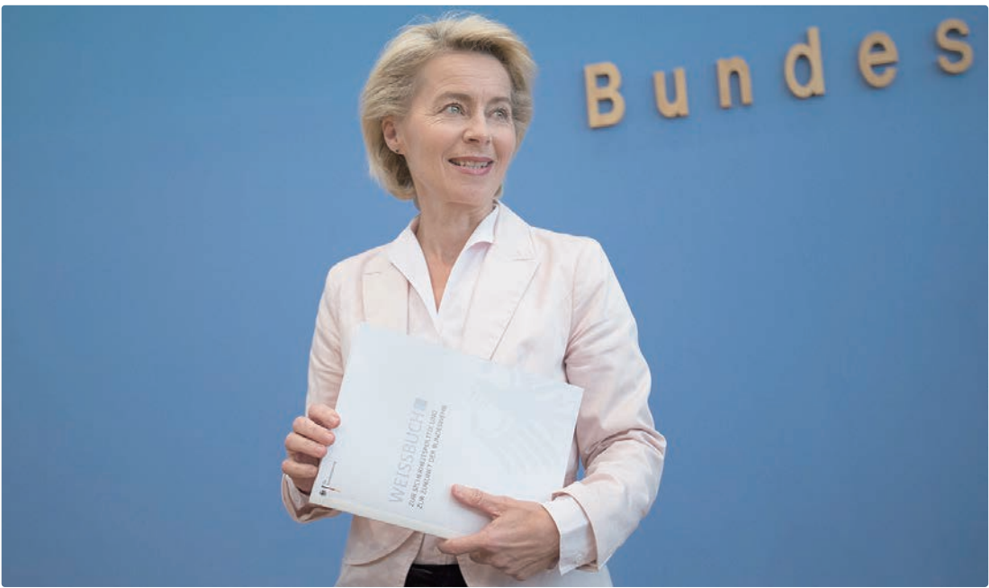
Ida de Ursula von der Leyen à cúpula de Montevidéu foi fundamental para selar o acordo liderado pelo Brasil

Com o aval do bloco, a presidente da Comissão Europeia, Ursula von der Leyen, poderá assinar oficialmente o acordo na próxima segunda-feira (12), no Paraguai. O tratado pode criar a maior área de livre comércio do mundo.