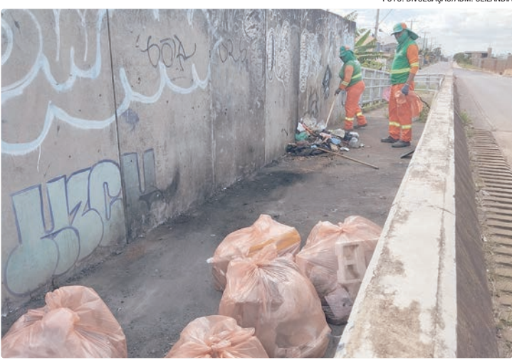
Aproximadamente 120 toneladas de lixo e entulho já foram recolhidas

Somente na última semana, em um período de cinco dias,