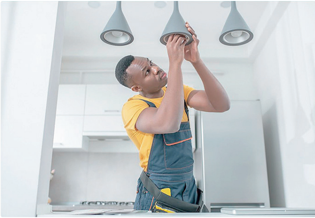
Vaga para montador instalador de acessórios paga R$ 2,8 mil

Para participar dos processos seletivos, basta cadastrar o currículo no aplicativo da Carteira de Trabalho Digital (CTPS) ou ir a uma das agências do trabalhador, das 8h às 17h, durante a semana, além de acionar o site da Sedest. Mesmo que nenhuma das oportunidades do dia seja atraente ao candidato, o cadastro vale para oportunidades futuras, já que o sistema cruza dados dos concorrentes com o perfil que as empresas procuram.