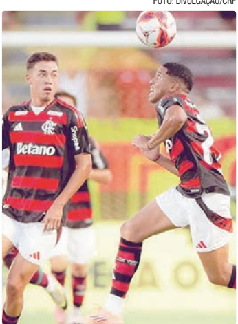
O Flamengo jogou com juniores e empatou nos acréscimos