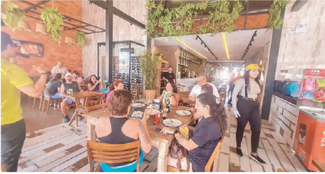
As ações percorreram seis regiões administrativas do DF

No domingo, o Detran nos Parques marcou presença em Taguatinga, com palestras sobre segurança viária para pedestres, ciclistas e condutores, atingindo 230 pessoas que circulavam pelo Taguaparque.