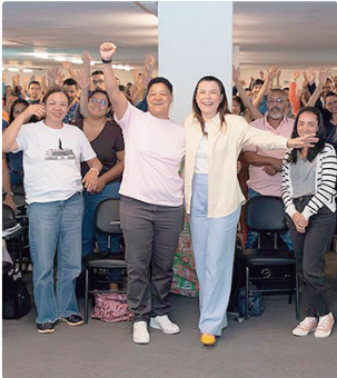
Criado em 2024, programa impactou milhares de alunos

Neste novo ciclo, o programa passou a incluir também novas disciplinas, como a Lei Orgânica do Distrito Federal (LODF), além da ampliação do corpo docente, com a chegada de novos professores de cursinhos renomados da capital, reforçando ainda mais a qualidade técnica e pedagógica das aulas.