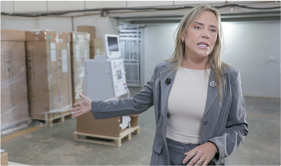
Governadora em exercício Celina Leão destacou o impacto direto da modernização na ponta do atendimento

Durante a entrega, a governadora em exercício destacou o impacto direto da modernização na ponta do atendimento. “Isso vai dobrar a nossa capacidade. Hoje temos dois turnos