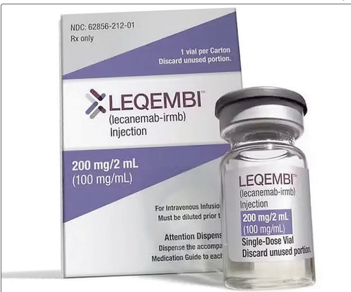
Novo remédio, com o anticorpo lecanemabe, retarda o declínio cognitivo

“A principal medida de eficácia foi a mudança nos