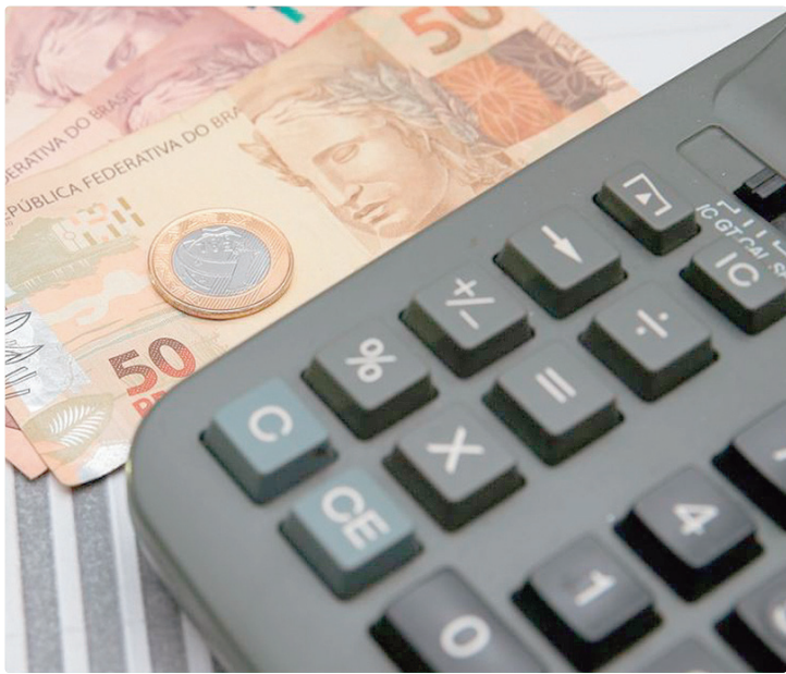
De acordo com o mercado financeiro, demais índices ficarão estáveis

META DE INFLAÇÃO Definida pelo Conselho Monetário Nacional (CMN), a meta de inflação para 2025 é 3%, com intervalo de tolerância de 1,5 ponto percentual para cima ou para baixo. Ou seja, o limite inferior é 1,5%, e o superior, 4,5%. De acordo com o Instituto Brasileiro de