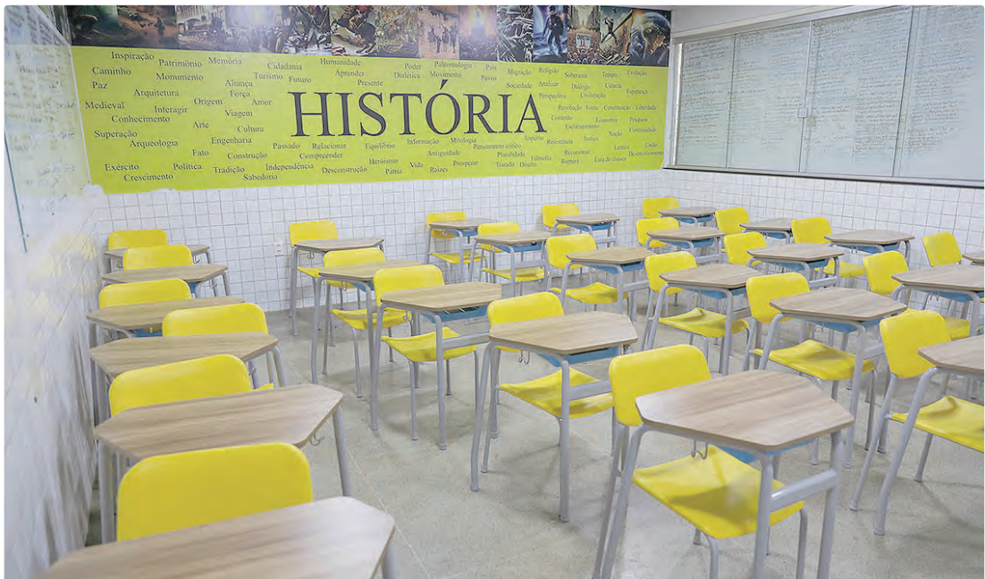
Para 2026, a SEEDF informa que já há previsão orçamentária de R$ 150 milhões em recursos do Tesouro do DF

O Programa de Descentralização de Recursos para Apoio à Manutenção e Modernização das Escolas (Pdaf) recebeu, em 2025, R$ 241,7 milhões destinados à manutenção, modernização e ao funcionamento de 708 escolas da rede pública de ensino do Distrito Federal e 14 Coordenações Regionais de Ensino (CREs). Também foi no ano passado que a rede pública passou a contar de forma integral com o cartão Pdaf, ferramenta que facilitou a execução dos recursos e reforçou os mecanismos de controle e transparência dos gastos. Para 2026, a Secretaria de Educação (SEEDF) informa que já há previsão orçamentária de R$ 150 milhões em recursos do Tesouro do DF. Em anos anteriores, os valores também foram expressivos: cerca de R$ 230 milhões em 2024 e aproximadamente R$ 260 milhões em 2023, considerado o maior volume já executado pelo programa. Os recursos permitem que as escolas atendam necessidades de manutenção, façam pequenas reformas dentro dos limites de dispensa de licitação previstos na Lei nº 14.133, invistam em projetos pedagógicos e promovam melhorias nos ambientes escolares.