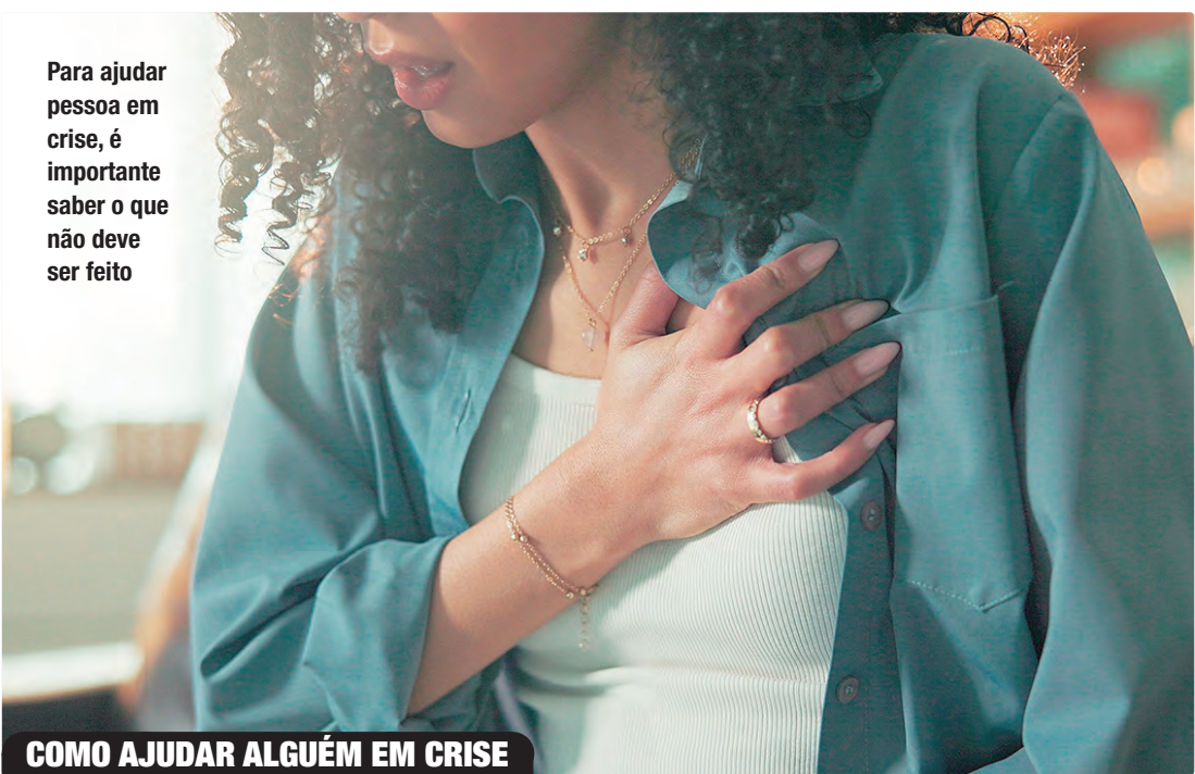
Para ajudar pessoa em crise, é importante saber o que não deve ser feito

posta é reforçar que cuidar da mente é tão essencial quanto cuidar do corpo. Organismos internacionais, como a OMS e a Organização Pan-Americana da Saúde (Opas), também alertam para a necessidade de colocar a saúde mental no centro das políticas públicas. No cenário pós-pandemia, os serviços de saúde também têm observado aumento significativo nas crises emocionais agudas, que chegam às unidades de pronto atendimento (UPAs), aos centros de atenção psicossocial (Caps) e ao Serviço de Atendimento Móvel de Urgência (Samu). Segundo o psicólogo Igor Santiago Almeida, especialista em saúde mental do adulto do Hospital de Base do Distrito Federal (HBDf), esse crescimento tem múltiplas causas. “A pandemia de covid-19 atuou como um importante catalisador, intensificando vulnerabilidades preexistentes e criando fontes de estresse”, explica. “A pandemia agravou uma situação que já era preocupante. Muitos serviços de saúde mental ficaram interrompidos justamente quando a população mais precisava de apoio”. Santiago lembra que uma crise é um estado agudo de desequilíbrio emocional, psíquico e comportamental,