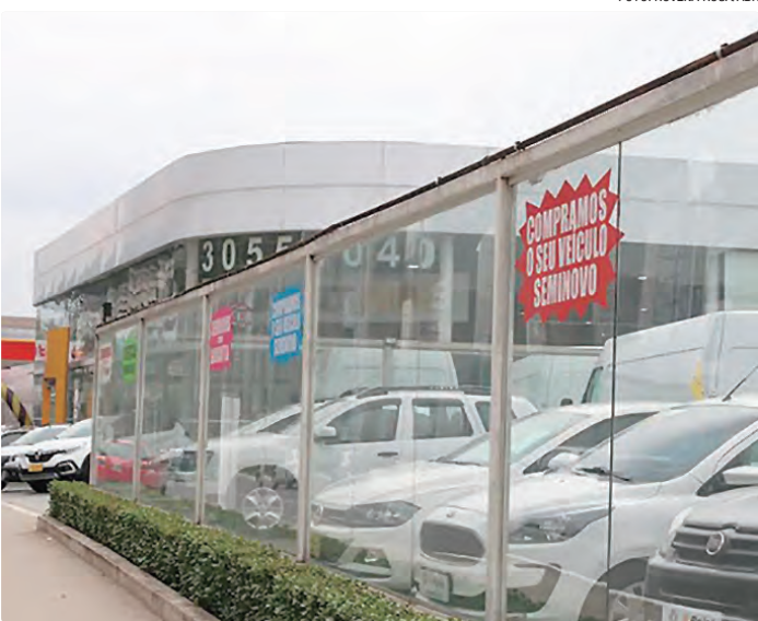
Entre os financiamentos em 2025, o Centro-Oeste representa 10,6%

Levantamento realizado no Sistema Nacional de Gravames (SNG), operado pela B3 e que registra as operações de financiamento de compras de veículos automotivos no país, demonstra que 2025 teve alta de 2% nos financiamentos para esses itens, com um total de 7,3 milhões de unidades financiadas. O levantamento mostra que é a terceira alta seguida, o que indica tendência de alta consolidada, além do melhor resultado em unidades desde 2011. Os estados do Nordeste e do Norte tiveram aumento, respectivamente, de 12,3% e 9,8%, o que foi determinante para o resultado positivo. Entre os financiamentos, veículos novos foram 2,6 milhões de unidades, mais de 50% do total de vendas, que até novembro foram 4,6 milhões de unidades, segundo a Fenabrave, associação de empresas do setor. Os