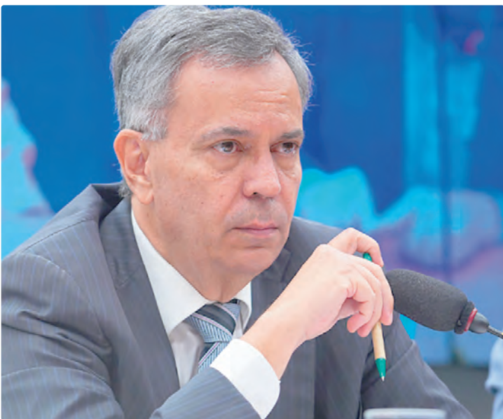
O principal alvo é o deputado federal Félix Mendonça Júnior (PDT-Bahia)

Ainda segundo a PF, os investigados poderão responder pelos crimes de organização cri-