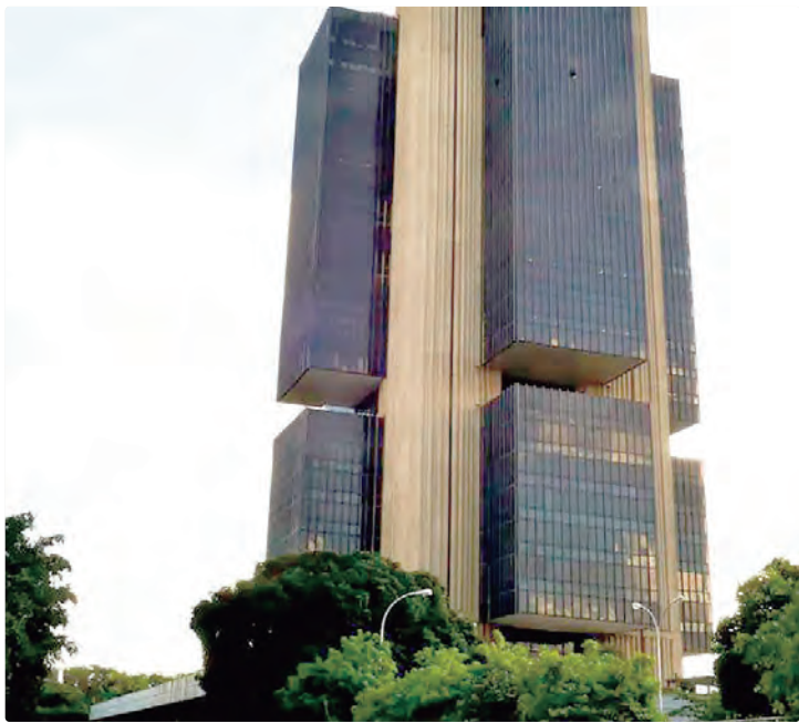
BC garantiu o acesso do TCU a documentos que fundamentaram a decisão

O Banco Central (BC) concordou com a realização de uma inspeção do Tribunal de Contas da União (TCU) sobre o processo de liquidação extrajudicial do Banco Master, disse nesta segunda-feira (12) o presidente do TCU, ministro Vital do Rêgo. O ministro esteve reunido com o presidente do BC, Gabriel Galípolo e disse que a autoridade monetária garantiu acesso aos documentos que fundamentaram a decisão. Segundo Vital do Rêgo, o encontro teve como principal objetivo esclarecer dúvidas sobre a competência do TCU para atuar no caso e alinhar procedimentos entre as duas instituições. De acordo com o ministro, ficou definido que a inspeção já está em curso e que os documentos do Banco Central utilizados no processo de liquidação estarão disponíveis para análise da Corte de Contas. “Hoje saio do Banco Central profundamente feliz com