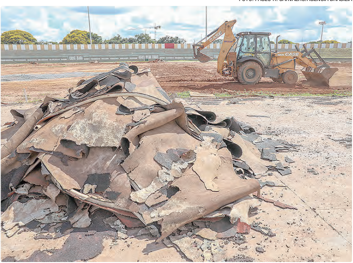
Teforma instalará uma pista sintética apta a receber provas oficiais