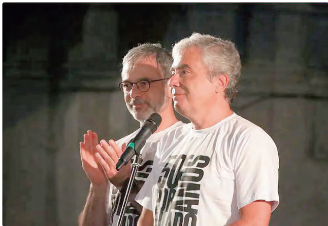
Eles receberão pedido de desculpa, além de R$ 100 mil cada

Em nota, a defesa do parlamentar afirma que ele “jamais negociou a execução de emendas parlamentares, nunca indicou empresas e não exerce qualquer função de ordenador de despesas,”. Ao todo, estão sendo cumpridos nove mandados de busca e apreensão, expedidos pelo ministro Nunes Marques, do (STF): Brasília, Salvador, Mata de São João e Vera Cruz, na Bahia.