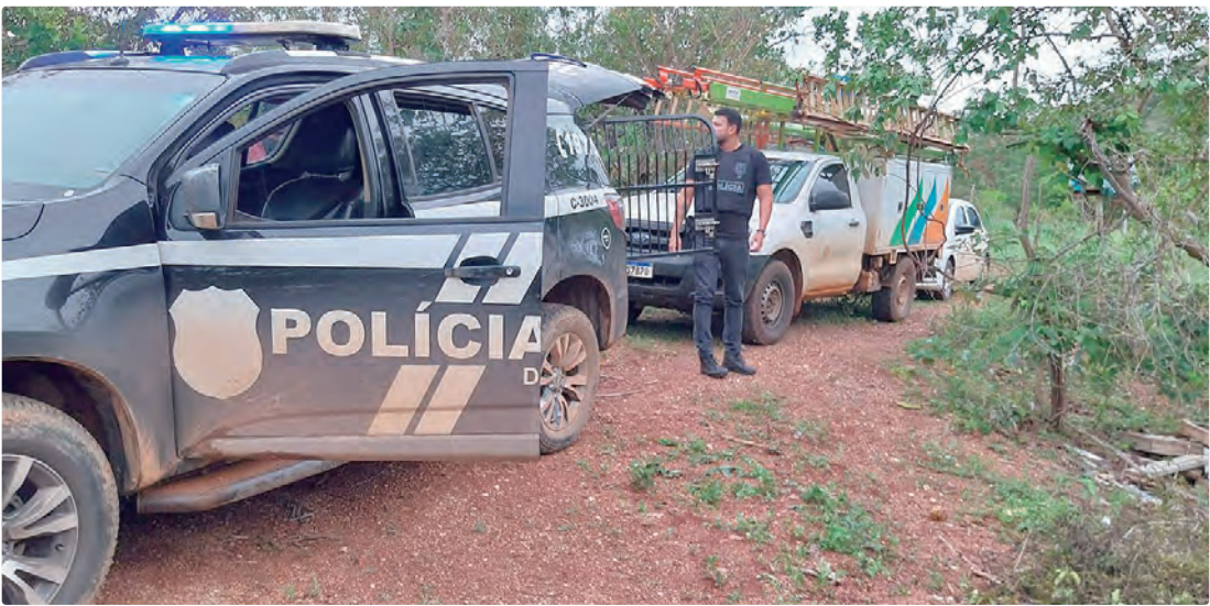
Responsáveis pelo furto de energia, com prejuízos a toda a população, foram identificados e autuados pela PCDF

INVESTIGAÇÃO Após investigação da Neoenergia, os responsáveis foram identificados e conduzidos pela Polícia Civil, que instaurou inquérito para apurar outros