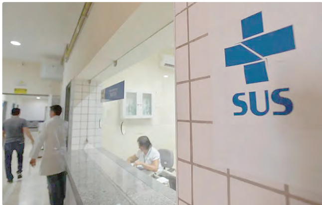
Decisão favorece pacientes com carcinoma adrenocortical (CAC)

Segundo ela, a análise da documentação que consta nos requerimentos de anistia política mostra o quanto os irmãos “foram afetados desde a infância pelas disputas em torno das diferentes versões sobre as circunstâncias do assassinato de seu pai”.