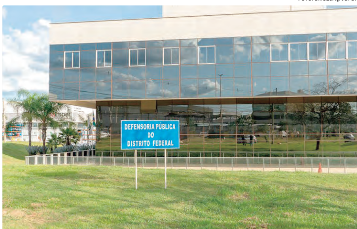
Atendimentos foram presenciais e virtuais, reafirmando a atuação da DPDF

A Defensoria Pública do Distrito Federal (DPDF) vem consolidando, nos últimos anos, um papel central na promoção do acesso à Justiça e na defesa dos direitos da população em situação de vulnerabilidade, em atuação articulada com o Governo do Distrito Federal (GDF) e diversos parceiros públicos e privados. Somente em 2025, a instituição ultrapassou a marca de 1 milhão de atendimentos, resultado que se soma aos números expressivos de 2024, quando foram realizadas cerca de 850 mil assistências, e de 2023, com aproximadamente 800 mil registros. Ao todo, iniciativas da atual gestão superam 3 milhões de atendimentos, tanto presenciais quanto virtuais, reafirmando a DPDF como uma das instituições mais atuantes do DF. Os dados refletem um