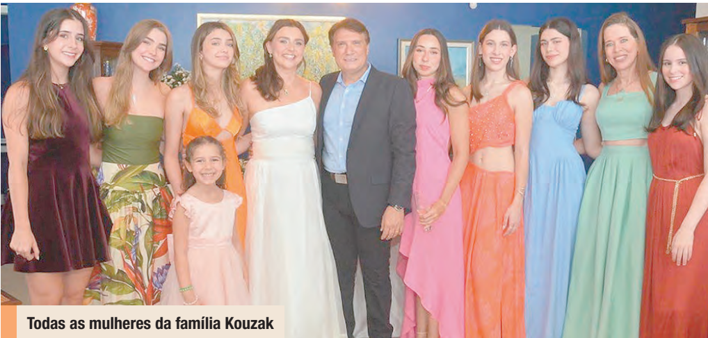
Todas as mulheres da família Kouzak