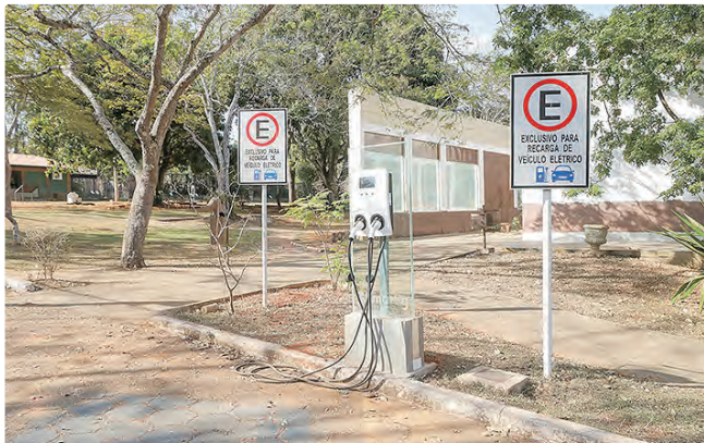
São 28 eletropostos em diferentes localidades do Distrito Federal

No período de 2019 a 2022, a iniciativa foi voltada ao incentivo ao uso de veículos elétricos, que contemplou a instalação de 28 eletropostos em diferentes localidades do DF. O projeto foi encerrado de forma planejada em 2022, ocasião em que se deu o término do Contrato de Comodato de Bens Móveis, não havendo continuidade da gestão direta dos equipamentos pela pasta.