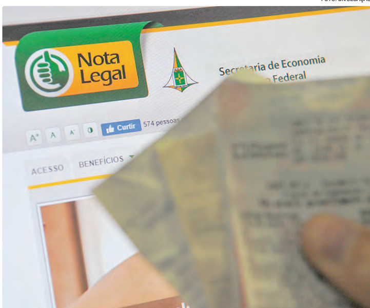
Prêmios esquecidos vão de R$ 10 mil a R$ 100 e somam 608 beneficiados

Atenção, contribuinte premiado no segundo sorteio do Nota Legal de 2025: o prazo para indicar os dados bancários para recebimento no segundo lote de prêmios se encerra nesta quarta-feira (14). Ainda faltam se apresentar à Secretaria de Economia (Seec-DF) cinco ganhadores de R$ 10 mil, dez de R$ 5 mil, 11 de R$ 1 mil, 161 de R$ 200 e 4.429 de R$ 100. Para saber se você foi um dos sorteados, basta visitar o portal do programa, inserir os dados cadastrados e conferir. Em seguida, é preciso informar os dados ban-