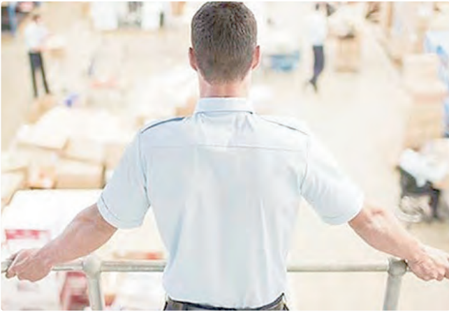
Gerente de produção e operações, no Guará, receberá R$ 3,5 mil

cada. A remuneração é de R$ 1.621, além de benefícios. SAIBA COMO PARTICIPAR Para participar dos processos seletivos, basta cadastrar o currículo no aplicativo da Carteira de Trabalho Digital ou ir a uma das 16 agências do trabalhador, das 8h às 17h, durante a semana. Mesmo que nenhuma oportunidade seja atraente ao candidato, o cadastro vale para oportunidades futuras, já que o sistema cruza dados dos concorrentes com o perfil que as empresas procuram. Empregadores e empreendedores que desejem ofertar vagas ou utilizar o espaço das agências do trabalhador para as entrevistas podem se cadastrar pessoalmente nas unidades ou pelo e-mail gcv@sedet.df.gov.br. Pode ser utilizado, ainda, o Canal do Empregador, no site da Secretaria de Desenvolvimento Econômico, Trabalho e Renda (Sedet).