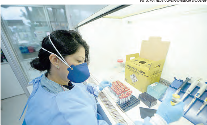
Aquisição de novos equipamentos ampliou a produtividade das entregas