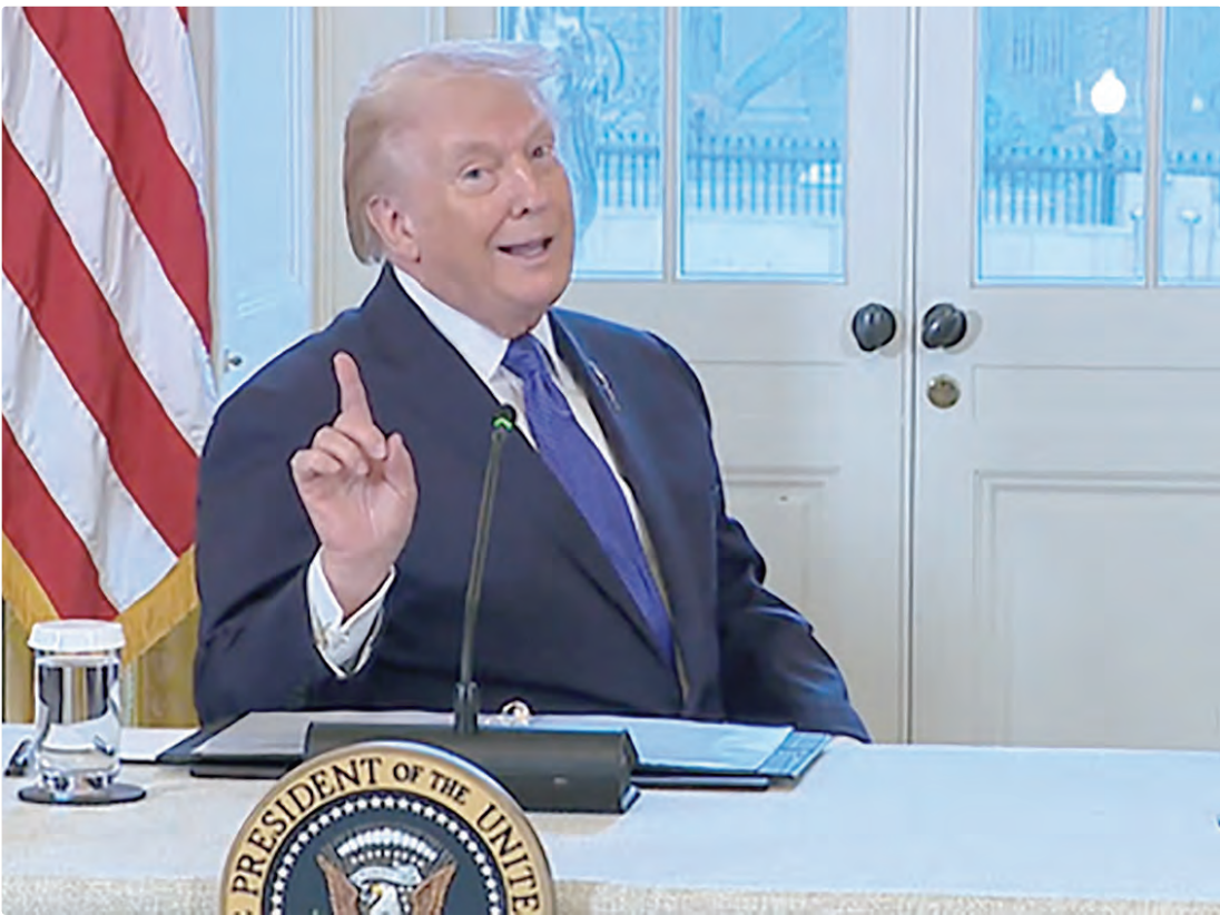
Donald Trump disse que o país que estiver negociando com o Irã também sofrerá sanções dos Estados Unidos

Em publicação nas redes sociais nesta segunda-feira (12), Trump afirmou que a nova tarifa entra em vigor de forma imediata. “Com efeito imediato, qualquer país que faça negócios com a República Islâmica do Irã pagará uma tarifa de 25% sobre quaisquer e todas as transações realizadas com os Estados Unidos. Esta ordem é final e conclusiva”, escreveu o presidente na Truth Social.