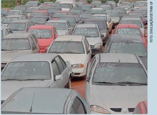
Veículos ficarão expostos entre os dias 26 e 27 de janeiro

localizado no Setor de Manobras, sentido Samambaia, 1ª Avenida Sul, SMSE s/n. Os lances poderão ser realizados no site www.viabrasiliasegura.com.br. Os veículos foram retirados em operações de fiscalização de trânsito e não foram reclamados por seus proprietários dentro do prazo legal. A relação completa dos bens disponíveis, assim como as condições de participação, está descrita no edital e seus anexos, publicados no portal do DER-DF. A medida atende à legislação vigente e garante a destinação correta dos veículos recolhidos, promovendo a liberação dos pátios e a eficiência administrativa do órgão.