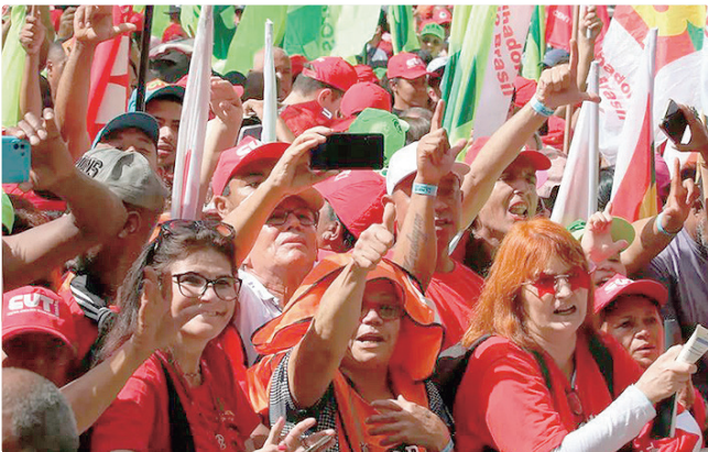
Centrais comemoraram os 95 anos do Salário Mínimo no Brasil

INVESTIGAÇÃO COMPLETA Para Haddad, a investigação completa do caso será fundamental para esclarecer responsabilidades e evitar que episódios semelhantes voltem a ocorrer.