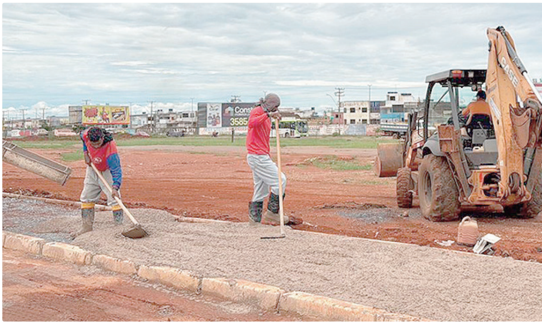
Atualmente, 4 km de novas calçadas estão em execução por equipes terceirizadas da Novacap, na QNN 27

Os serviços estão sendo realizados por equipes terceirizadas da Novacap, que atuam na implantação de passeios com padrões técnicos voltados à acessibilidade e à