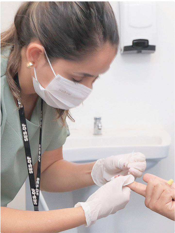
Secretaria de Saúde quer reduzir sequelas e interromper ciclo da doença

“O diagnóstico tardio reflete diretamente na qualidade de vida do paciente. Em 2020, o Distrito Federal registrou muitos casos com grau de incapacidade física 2, o que significa que muitos