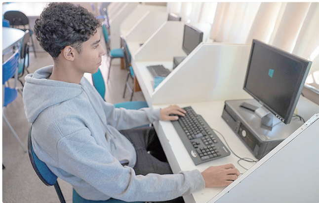
Seleção é destinada a jovens que queiram atuar em órgãos do DF

O programa Transforma DF oferece aos estudantes a oportunidade de conhecer, na prática, a rotina do serviço público, estimulando o desenvolvimento de competências técnicas e comportamentais.