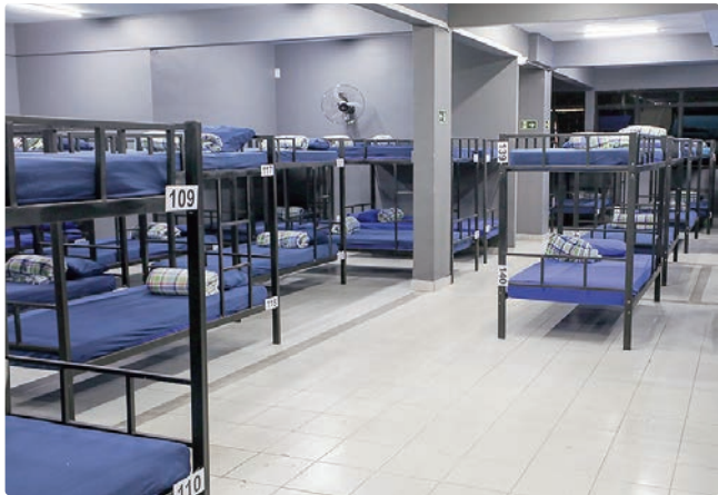
Visitantes contam com ambiente confortável e camas para dormir