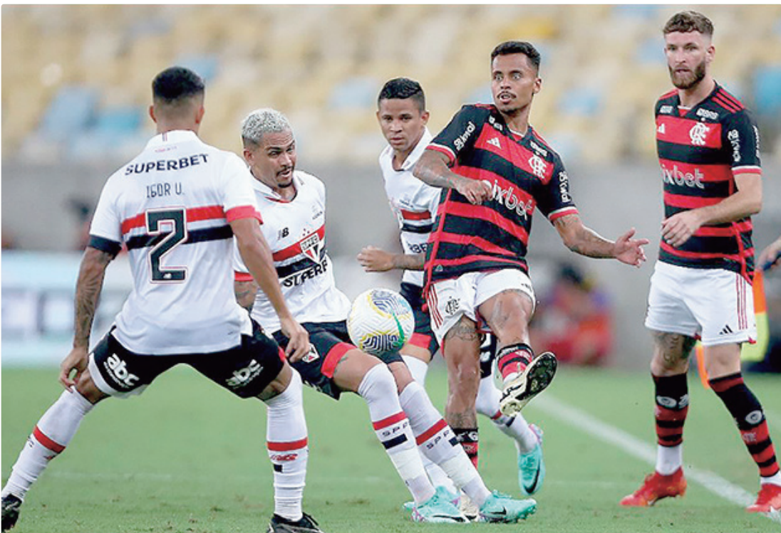
Flamengo e São Paulo se enfrentam quatro dias antes da decisão da Supercopa do Rei, marcada para Brasília

O formato da competição segue o mesmo: 20 times se enfrentam entre si, em jogos de ida e volta, totalizando 38 rodadas. O clube que somar