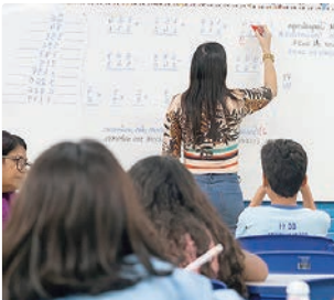
Ensino é reforçado com novas nomeações de professores