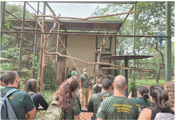
Ação reúne fiscalização, monitoramento, auditoria e participação social