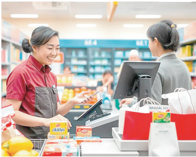
Há 50 vagas para operador de caixa na região de Águas Claras

Empregadores e empreendedores que desejem ofertar vagas ou utilizar o espaço das Agências do Trabalhador para as entrevistas podem se cadastrar pessoalmente nas unidades ou pelo e-mail gcv@sedet.df.gov.br. Pode ser utilizado, ainda, o Canal do Empregador, no site da Secretaria de Desenvolvimento Econômico, Trabalho e Renda (Sedet-DF).