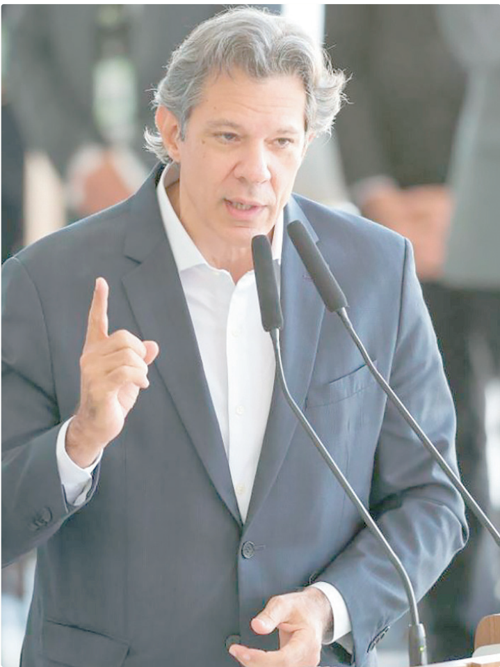
Haddad: “Temos que tomar todas as cautelas devidas e garantir a defesa”

O caso envolvendo o Banco Master pode se configurar como a maior fraude bancária da história do país, disse nesta terça-feira (13) o ministro da Fazenda, Fernando Haddad. Segundo ele, o governo acompanha de perto a atuação do Banco Central (BC) e mantém diálogo permanente com a autoridade monetária desde a decretação da liquidação da instituição financeira. “O caso [Master] inspira muito cuidado, podemos estar diante da maior fraude bancária da história do país, podemos estar diante disso. Então temos que tomar todas as cautelas devidas, com as formalidades, garantindo todo o espaço para a defesa se explicar, mas, ao mesmo tempo, sendo bastante firmes em relação àquilo que tem que ser defendido, que é o interesse público”, disse o ministro ao chegar ao Ministério da Fazenda. Haddad informou que tem conversado diariamente com o presidente do Banco Central, Gabriel Galípolo, e fez questão de manifestar apoio público ao trabalho conduzido pelo BC. Haddad ressaltou que a condução do processo exige rigor