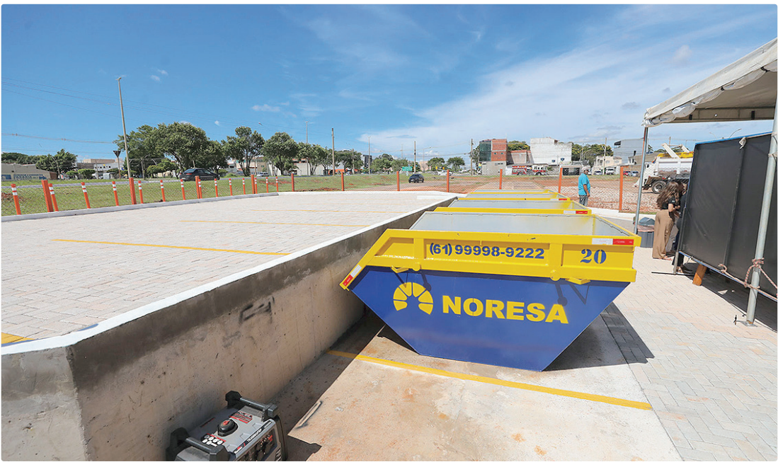
Localizado na QN 20, Conjunto 1, Lote 1, o novo papa-entulho recebeu investimento de R$ 465 mil do GDF

Localizado na QN 20, Conjunto 1, Lote 1, o novo papa-entulho recebeu investimento de R$ 465 mil, com recursos do Banco do Brasil, e ocupa uma área de mil m². O espaço foi projetado para receber resíduos da construção civil de pequeno porte, móveis velhos, restos de poda, materiais recicláveis e óleo de cozinha usado, contribuindo para a preservação ambiental, a organização urbana e a redução do descarte irregular em vias públicas, áreas verdes e terrenos baldios. “Quando a gente cria um papa-entulho, a gente traz um local adequado para que a comunidade possa descartar um outro tipo de material que antes ficava jogado e