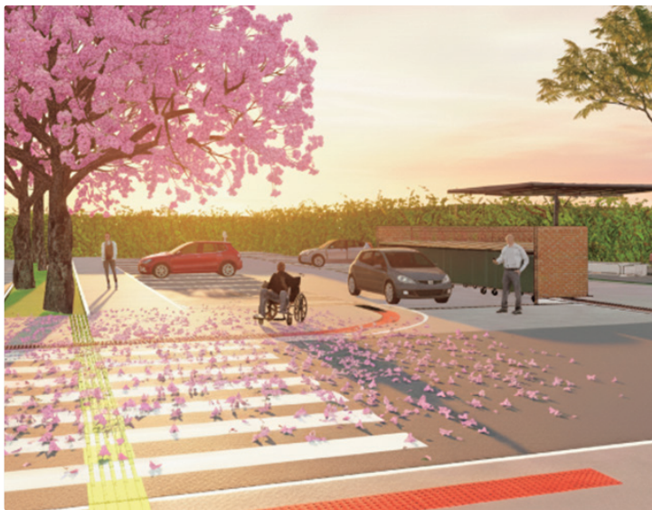
Vias internas dos estacionamentos serão reduzidas, conforme a legislação

O projeto prioriza o deslocamento de pedestres e outros modais ativos, como bicicle-