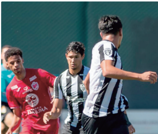
O Galo volta pra casa depois de perder por 3x1 para o Referência

O tricolor carioca também passou para a terceira fase da Copinha, ao derrotar o Refeência nos pênaltis.