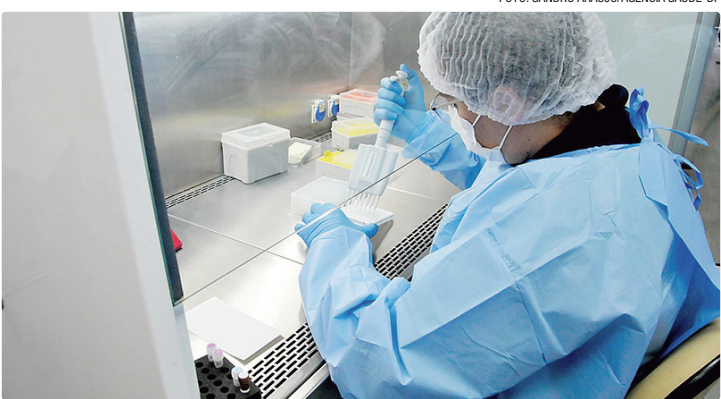
Toxina provocou vômitos e diarreia em bebês por volta de um ano de idade

DROGARIAS Todas as drogarias, estabelecimentos de saúde e pontos de comercialização do produto no DF já foram devidamente informados pela Vigilância Sanitária sobre a situação. Mas, caso seja constatada