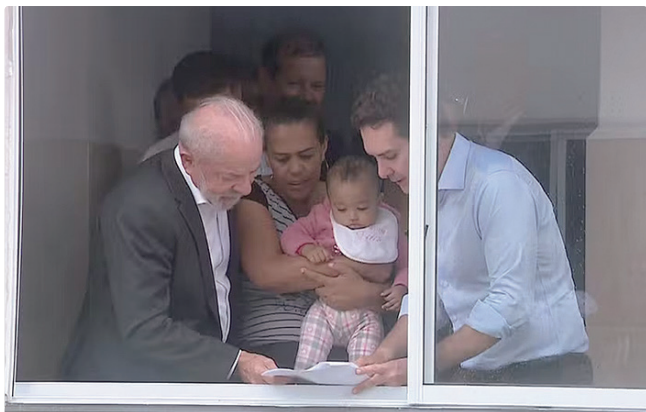
Lula cumpre agenda no RS. É a 1ª visita que ele faz ao estado em 2026

O ministro de Portos e Aeroportos, Silvío Costa Filho, também estará na solenidade. Ele deve anunciar o contrato de adesão do Terminal de Uso Privado de uma nova fábrica de celulose no Porto de Rio Grande, com investimentos totais de R$ 24 bilhões.