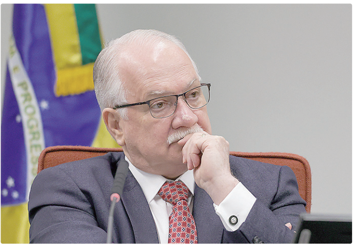
Após conversas com colegas, Fachin decidiu retornar para tratar do caso

A volta de Fachin antes da data prevista foi decidida após conversas com colegas da Corte. Ele havia passado a