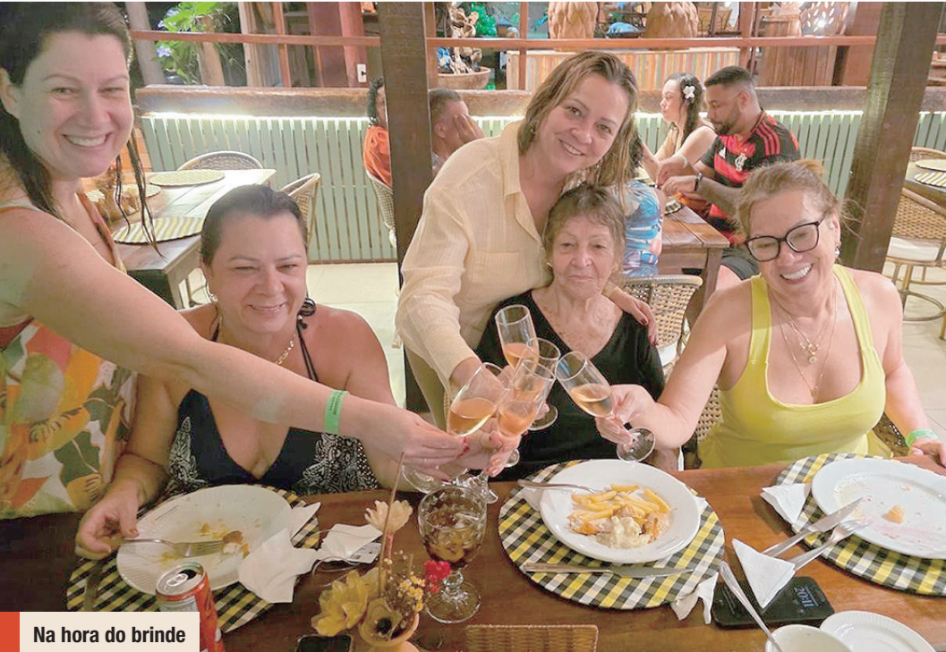
Na hora do brinde

A notícia como deve ser dada. Seja qual for o segmento. Sociedade, política, curiosidades e gossip.