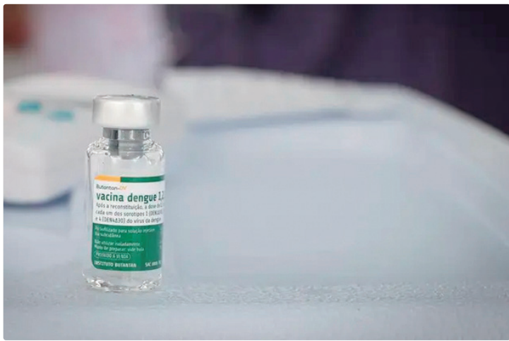
A vacina contra a dengue desenvolvida pelo Instituto Butantan é de dose única

O ministro explicou que a vacinação deste público será possível com a chegada de mais doses da Butantan-DV. O Instituto Butantan deve produzir e entregar até 31 de janeiro cerca de 1,1 milhão de doses adicionais desta vacina nacional contra a dengue, para garantir a imunização dos profissionais que atuam na linha de frente do Sis-