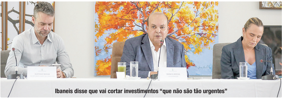
Ibaneis disse que vai cortar investimentos “que não são tão urgentes”

Segundo o site Metrópoles, ele disse que quando fala de “cortes, não são cortes na área da saúde, na educação. Vamos trabalhar o corte no custeio e