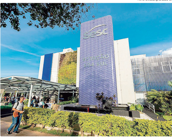
O Sesc-DF oferece vagas para gerente e educador com benefícios

Os cargos de Gerente de Unidade e Gerente Substituto de Unidade ganham especial destaque por envolverem funções de liderança, tomada de decisão e gestão de equipes multidisciplinares, além de ampla visibilidade institucio-