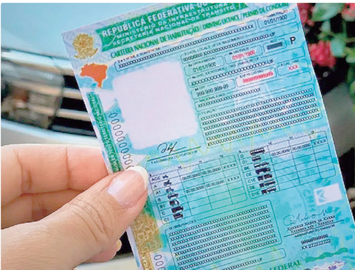
A renovação automática não é válida para condutores com mais de 70 anos

De todo o Brasil, o Sudeste concentra o maior número de renovações automáticas. Os 10 estados com mais CNHs renovadas: São Paulo: 86.770 carteiras; Minas Gerais: 35.771; Rio de Janeiro: 29.343; Paraná: 22.119; Rio Grande do Sul: 18.239; Bahia: 15.226; Santa Catarina: 13.230; Pernambuco: 12.927; Goiás: 12.213; e Ceará: 11.798. O Ministério dos Transpor-