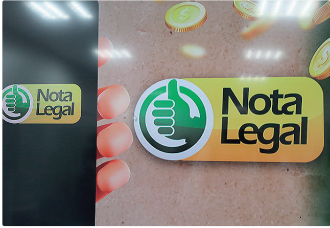
Quem não fizer a indicação pode pedir a restituição em dinheiro

butos, segundo a Secretaria de Economia (Seec-DF). No ano passado, o total acumulado pelos participantes superou os R$ 93 milhões – a maioria (67%) para o IPVA. O contribuinte que não fizer a indicação para descontar nos impostos pode pedir a restituição em dinheiro, direto na conta bancária, em junho. UM MILHÃO A segunda edição de 2025 do sorteio do Nota Legal premiou mais de 12,6 mil bilhetes, distribuindo R$ 3,5 milhões. Um morador de Taguatinga Norte fez uma compra de R$ 145,37 no Ultrabox da Área de Desenvolvimento Econômico (ADE) dos lotes 1 a 4 do Polo JK, em Santa Maria, e garantiu o prêmio principal, de R$ 1 milhão.