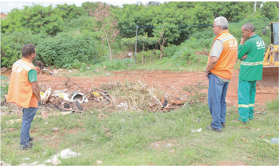
Todos os meses o SLU retira de áreas impróprias cerca de 2,1 mil toneladas de lixo descartadas irregularmente

IMPACTO NAS CONTAS Esse volume adicional de resíduos irregulares recolhidos diariamente pelo SLU gera impacto direto nas contas públicas, uma vez que exige a mobilização de equipes, máquinas e caminhões além da coleta regular já programada. Apenas com a remoção de lixo e entulho descartados de forma inadequada em ruas, calçadas e terrenos públicos, o Governo do Distrito Federal (GDF) desembolsa cerca de R$ 5,8 milhões por mês, con-