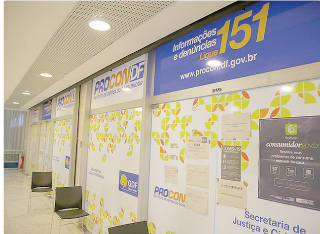
As escolas autuadas têm o prazo de 30 dias para regularizar a lista

As escolas autuadas têm o prazo de 30 dias para regularizar os problemas identificados nas listas de material. Depois deste prazo, caso permaneçam em desacordo com a legislação, poderão sofrer sanções e multas pelo órgão de defesa. O Procon-DF reitera a importância dos pais e responsáveis sempre conferirem se a lista está de acordo com o que é permitido e acionarem o órgão em casos de reclamações ou dúvidas. O Procon-DF irá prosseguir com as fiscalizações nas escolas que forem denunciadas.