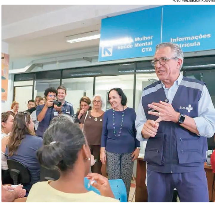
Anúncio sobre vacinas contra dengue foi feito pelo ministro Alexandre Padilha

Aprovada em 2023 pela Agência Nacional de Vigilância Sanitária (Anvisa), a QDenga foi inicialmente disponibilizada em 2024 às crianças e adolescentes de 2,1 mil municípios considerados prioritários pelo governo do Brasil. Com o aumento dos estoques, a vacinação da QDenga será feita em unidades básicas de saúde (UBS) do SUS dos mais de 5,5 mil municípios brasileiros, exclusivamente ao público de 10 a 14 anos. O ministro contabiliza que foram distribuídos e aplicados no Brasil, em 2024 e 2025, cerca de 10 milhões de doses da QDenga para o público infanto-juvenil.