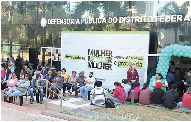
Criado para ampliar acesso à Justiça, data tornou-se permanente