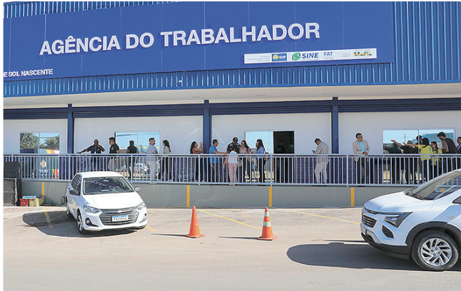
Salário médio para várias categorias chega a R$ 1.700 mensais

Para pessoas com deficiência (PcD), há cinco postos de repositor de mercadorias na Asa Norte, com oferta de R$