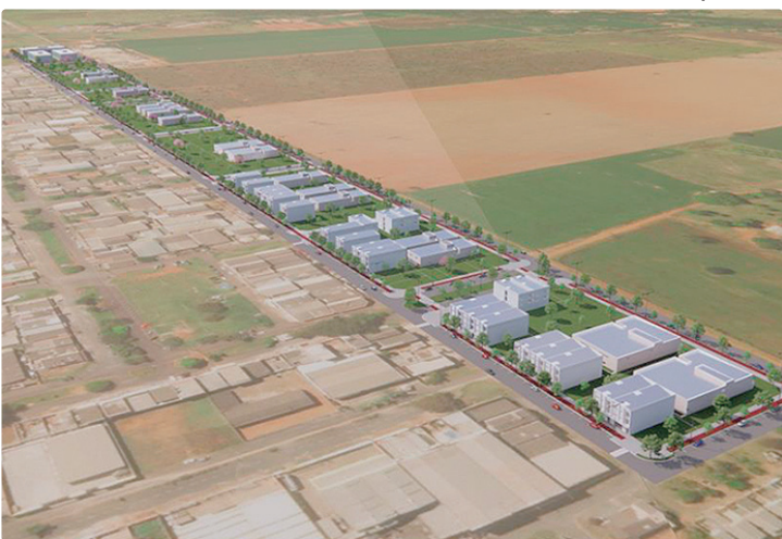
Parcelamento prevê criação de 182 unidades imobiliárias em vários níveis

O parcelamento prevê a criação de 182 unidades imobiliárias, distribuídas em diferentes categorias de uso e ocupação do solo. Do total, 115