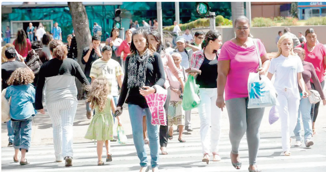
Essa é a menor taxa de desemprego já registrada pela Pesquisa Nacional por Amostra de Domicílios (Pnad)

“A composição e dinâmica da população ocupada ainda é bastante dependente da infor-