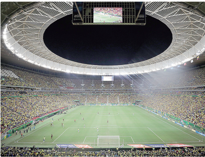
Trânsito sofrerá alterações e haverá monitoramento no entorno da Arena

O monitoramento da operação contará com cerca de 600 câmeras exclusivas do Centro de Comando e Controle da Arena BRB, integradas às câmeras do Programa de Videomonitoramento Urbano, acompanhadas pelo Centro Integrado de Operações de Brasília (Ciob). Na área externa do estádio, será instalada uma cidade policial, reunindo representantes das forças de segurança e de diversos órgãos