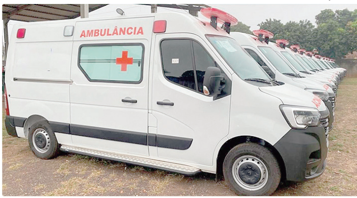
Serviço será feito com vans sanitárias e ambulâncias de suporte básico

O serviço será realizado por meio de vans sanitárias e ambulâncias de suporte básico e avançado, com operação estruturada a partir de base própria e central de regulação. O modelo assegura resposta contínua às demandas das unidades de saúde da rede IgesDF,