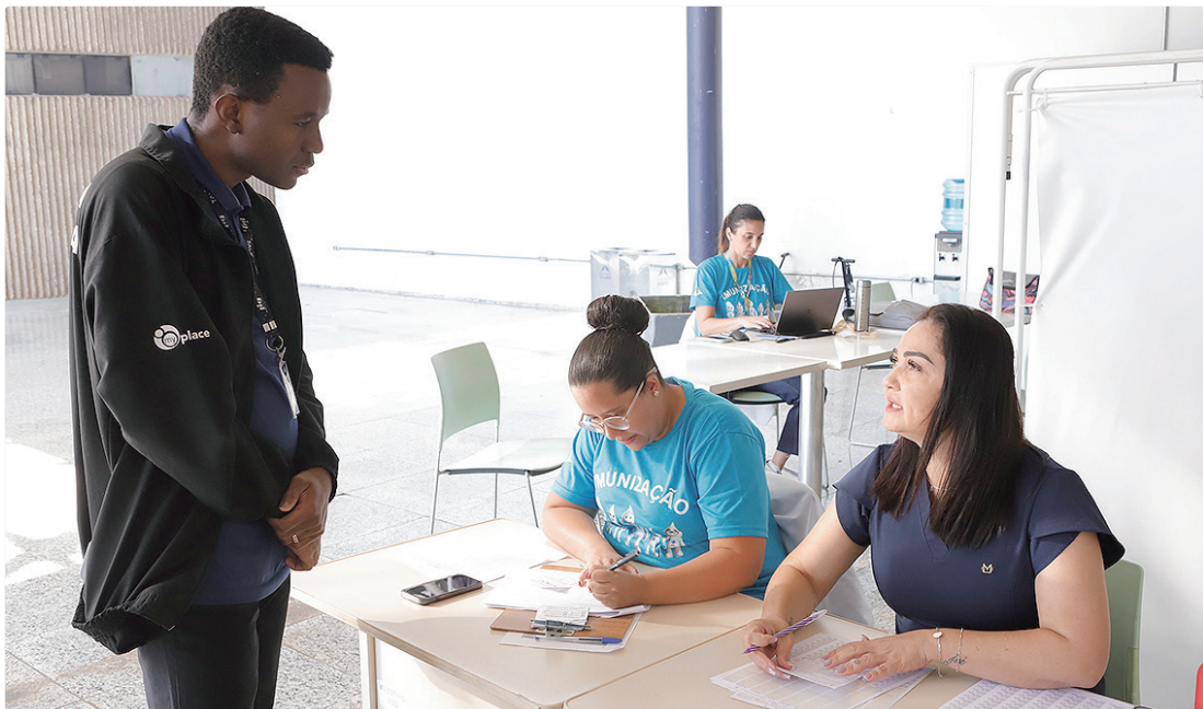
Equipes de saúde estão preparadas para verificar a situação de cada pessoa e recomendar ou não a aplicação da vacina

Nos locais de vacinação também haverá disponibilidade de doses contra outras doenças, como covid-19, gripe (influenza), tétano, papilomavírus humano (HPV) e, em algumas salas, den-