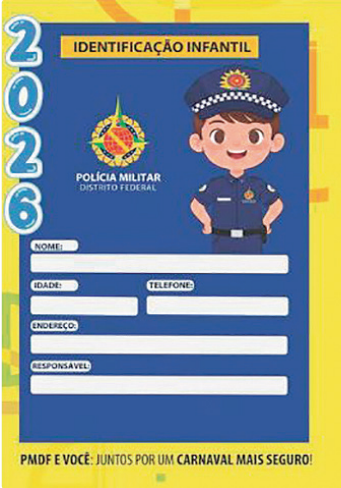
Documento de identificação infantil é importante para garantir segurança

Além das carteirinhas, a PMDF estará em pontos estratégicos de blocos voltados ao público infantil, reforçando também a identificação segura das crianças por meio de pulseiras. A orientação da polícia é nunca deixar as crianças desacompanhadas, e intruí-las a sempre a procurar os postos policiais caso se percam.