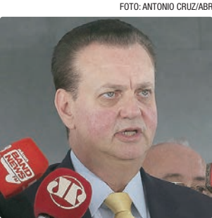
Gilberto Kassab: “Não tem sentido criticar a gestão Lula”

o UOL, Kassab traçou uma linha imaginária para isolar as franjas mais radicalizadas na direita bolsonarista. “Gratidão é uma coisa, submissão é outra”, afirmou.