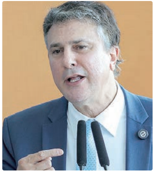
Camilo Santana, ministro da Educação, assinou a portaria

O aumento decorre de uma mudança no cálculo do piso salarial, promovida pela Medida Provisória (MP) 1.334/2026, assinada por Lula no último dia 21. A MP alterou a fórmula de reajuste para adequá-la ao novo modelo do Fundo de Manutenção e Desenvolvimento da Educação Básica e de Valorização dos Profissionais da Educação (Fundeb), instituído pela Emenda Constitucional 108.