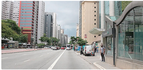
Em 12 meses, o IGP-M, conhecido como “inflação do aluguel”, recua 0,91%

Para chegar ao IGP-M do mês, a FGV faz coleta de preços em Belo Horizonte, Brasília, Porto Alegre, Recife, Rio de Janeiro, São Paulo e Salvador.