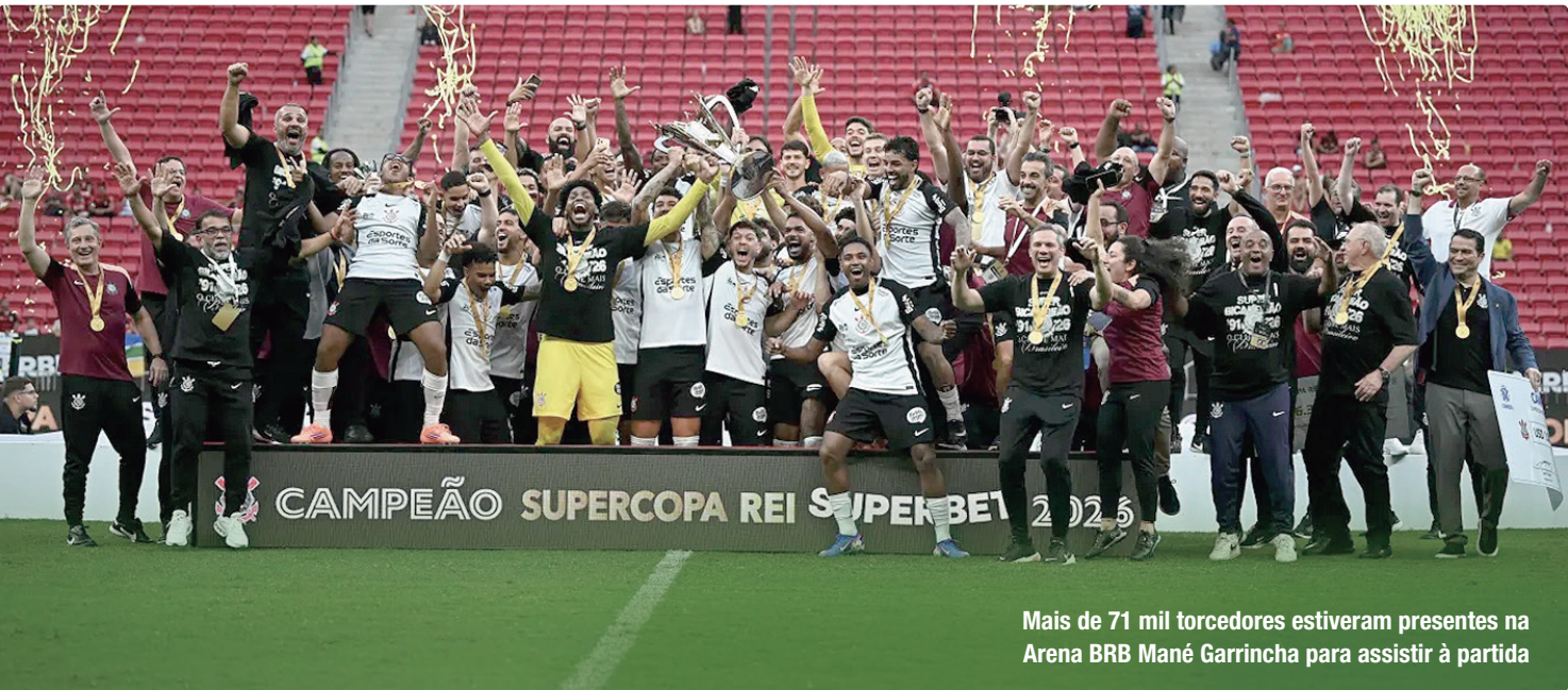
Mais de 71 mil torcedores estiveram presentes na Arena BRB Mané Garrincha para assistir à partida