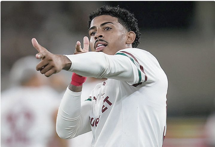
Com a vitória, Fluminense soma 12 pontos e se classifica para o mata-mata

O duelo foi marcado por forte chuva, que afetou diretamente no desempenho das equipes. O temporal na capital fluminense chegou a interromper o jogo no primeiro tempo. Os dois clubes chegaram ao confronto como líderes de seus respectivos grupos no Carioca, com campanhas idênticas — nove pontos, com três vitórias e uma derrota. Após o duelo, o Botafogo permanece na liderança do Grupo B, mas viu a sua distância