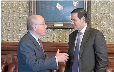
Vieira e Rubio conversam sobre comércio, segurança e alinham detalhes da viagem de Lula aos EUA, em março

vidados a ocupar um assento no conselho, mas ainda não respondeu ao convite. Na semana passada, em evento em Salvador, ele chegou a criticar a proposta de criação do Conselho da Paz. A ligação entre chanceleres ocorre também pouco depois de Lula e Trump terem conversado por telefone, na última segunda-feira (26). Segundo o Palácio do Planalto, o presidente defendeu uma reforma no Conselho de Segurança da ONU, pauta histórica do Brasil. Outro assunto debatido pelos mandatários foi a Venezuela. De acordo com o divulgado pelo Planalto, Lula expressou a Trump a necessidade de se manter a paz na região. Os dois também desejam avançar na cooperação no combate ao crime organizado transnacional. A segurança na região é um tema caro a Trump, sobretudo o combate ao narcotráfico. Desde que entrou no poder, o presidente norte-americano aumentou significativamente a presença militar na região, o que culminou com o sequestro, em 3 de janeiro, do então presidente venezuelano, Nicolás Maduro, por tropas dos EUA.