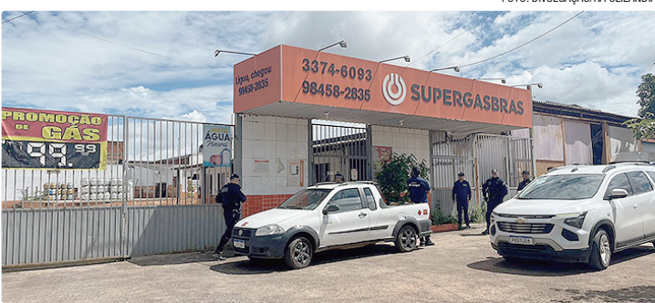
DF Legal intensificará as ações de fiscalização desse tipo de abastecimento

Após explosão de botijões de gás na noite de terça-feira (27), em uma residência no Sol Nascente, que resultou em incêndio e deixou quatro pessoas feridas, a Administração Regional de Ceilândia solicitou o reforço de fiscalização em distribuidoras e comércios de gás na região. No sábado (31), foi realizada uma ação da DF Legal e o 10º Batalhão da PM, em fiscalização de rotina. Na operação, uma distribuidora de gás foi interditada por pendências no Registro e Licenciamento de Empresas (RLE). Diante do risco à segurança pública, a DF Legal informou