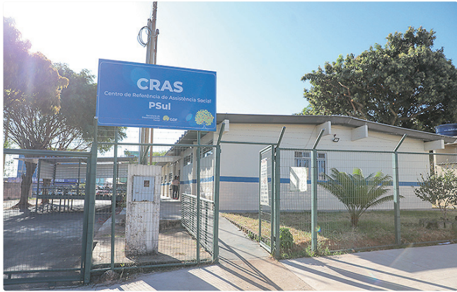
GDF tem benefícios voltados a ajudar a população de baixa renda

é voltado às famílias de baixa renda que estejam passando por alguma situação crítica que agrave a situação de vulnerabilidade social. O benefício pode ser concedido em duas modalidades: pecúnia, no valor de R$ 408, em até seis parcelas por ano; e passagem interestadual – sendo uma no período de 12 meses –, para o retorno à cidade de origem ou eventual mudança em situação de risco ou violência. “É um apoio suplementar e provisório para que a família possa enfrentar a vulnerabilidade”, revela Raqueline. Já o Auxílio Excepcional é um benefício destinado a famílias ou pessoas que foram privadas de moradia em razão de catástrofes, desastres ou calamidades públicas; risco geológico ou salubridade; desocupação de áreas ambientais; realocações e assentamentos; e situação de rua ou risco pessoal excepcional. O valor é de até R$ 600 por mês, prorrogado por igual período.