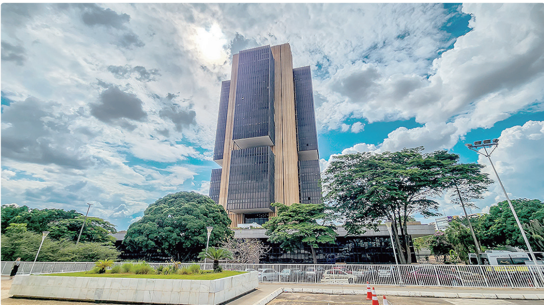
Dados constantes no Boletim Focus são da pesquisa semanal do Banco Central com mais de 100 instituições financeiras

Se confirmada a projeção, o Índice Nacional de Preços ao Consumidor Amplo (IPCA) ficará abaixo do registrado no último ano – quando somou 4,26%. Para 2027, a expectativa permaneceu estável em 3,80%; Para 2028, a previsão foi mantida em 3,50%; Para 2029, a estimativa continuou em 3,50%. Desde o início de 2025, com a adoção do sistema de meta contínua, o objetivo é manter a inflação em 3%, sendo considerada dentro da meta se variar entre 1,50% e 4,50%. Quanto maior a inflação, menor é o poder de compra da população – especialmente entre quem recebe salários mais baixos. Isso ocorre porque os preços sobem, enquanto