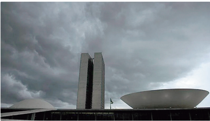
Câmara dos Deputados e Senado abrem o calendário legislativo nesta segunda

O Congresso Nacional retoma oficialmente os trabalhos nesta segunda-feira (2) sob um cenário que costuma travar a produção legislativa: ano eleitoral, calendário encurtado e ambiente político altamente polarizado. Deputados e senadores entram em 2026 com poucos meses efetivos de trabalho em Brasília antes de mergulhar nas campanhas, o que tende a transformar o ano em um período de votações pontuais, disputas políti-