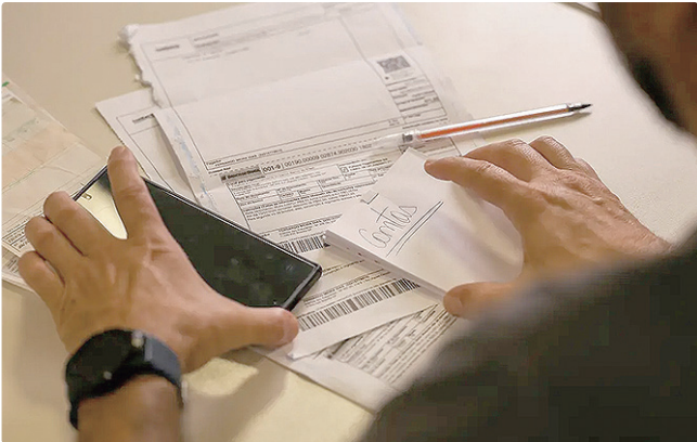
INSS, seguro-desemprego e contribuições têm novos valores

Além de afetar diretamente trabalhadores que recebem o piso nacional, o novo valor serve como referência para uma série de bene-