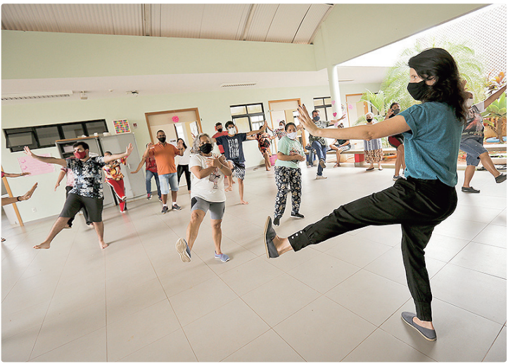
Atividades como yoga e tai chi chuan são oferecidas gratuitamente nas UBSs

Tendo como foco que o estilo de vida tem impactos importantes nos fatores de risco para doenças crônicas não transmissíveis – como hipertensão, diabetes e cânceres –, a Secretaria de Saúde oferece atividades e orientações para quem quer reconhecer hábitos nocivos e tirar a meta do papel. Nas UBSs, é possível encontrar ações que estimulam a atividade física. Nesses locais, há profissionais que lideram grupos de caminhada, ginástica coletiva, cir-