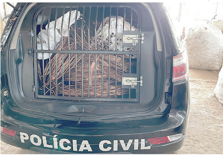
Nos últimos anos, a PCDF tem feito diversas ações para reprimir furtos

A padronização das informações recebidas contribui para agilizar a análise das denúncias e auxilia o trabalho