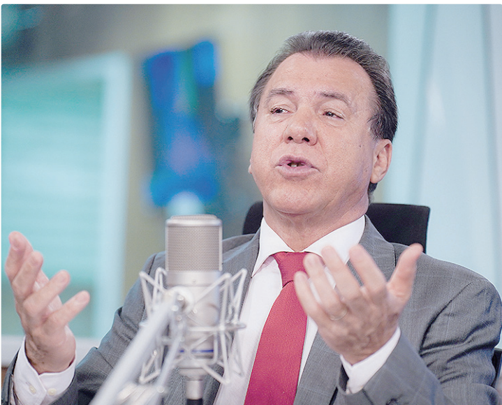
Segundo Marinho, 9,9 milhões já comprometeram o valor com empréstimos

O governo federal libera, a partir desta segunda-feira (2), R$ 4,6 bilhões para pagamento da segunda parcela a trabalhadores que optaram pelo saque-aniversário do Fundo de Garantia do Tempo de Serviço (FGTS). O valor corresponde aos recursos retidos de trabalhadores que foram demitidos entre janeiro de 2020 e 20 de dezembro de 2025. De acordo com o Ministério do Trabalho e Emprego, o pagamento desses saldos remanescentes nesta segunda etapa beneficiará 822,6 mil pessoas. Os pagamentos dos saldos remanescentes serão feitos até o dia 12 de fevereiro. Na primeira etapa, foram liberados também R$ 3,8 bilhões, que beneficiaram mais de 14 milhões de pessoas, conforme previsto em medida provisória publicada no dia 23 de dezembro. PENALIZAÇÃO INJUSTA Em nota, o MTE lembra que a modalidade impõe uma “penalização injusta” aos trabalhadores e trabalhadoras que optam por esse formato, ao impedir o acesso aos recursos do FGTS em caso de demissão.