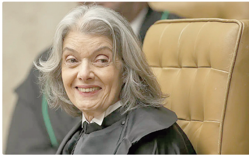
Segundo a ministra Cármen Lúcia, o eleitor espera ética na atuação de juízes e servidores da Justiça Eleitoral

Segundo a presidente, o eleitor espera ética na atuação de juízes e servidores da Justiça Eleitoral. “Do Judiciário eleitoral, o eleitorado não apenas espera atuação ética, eficiente e estritamente adequada à legislação vigente, como todas as pessoas contam que o corpo de juízes e servidores da Justiça Eleitoral atue de forma honesta, independentemente de pressões ou influências para garantia de realização de eleições sobre as quais não pendam dúvidas sobre a lisura do pleito”, afirmou.