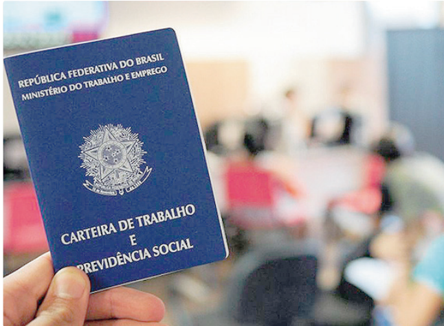
Os salários variam entre R$ 1,6 mil e R$ 4,5 mil em várias regiões

Empregadores e empreendedores que desejam ofertar vagas ou utilizar o espaço das agências do trabalhador para entrevistas podem se cadastrar pessoalmente nas unidades ou solicitar atendimento pelo e-mail gcv@sedet.df.gov.br. Pode ser utilizado, ainda, o Canal do Empregador no site da Sedet-DF.