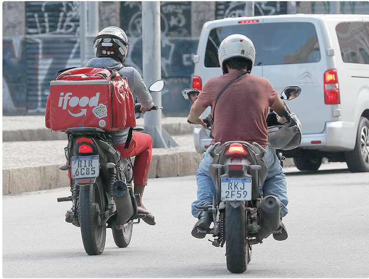
Lula diz que os trabalhadores não podem ter sua mão de obra precarizada