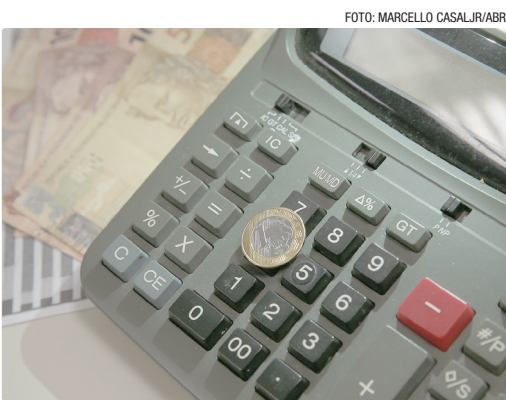
Banco Central manteve a taxa básica de juros da economia em 15% ao ano na semana passada

marcada para o mês de março, porém reforça que manterá a restrição adequada para assegurar a convergência da inflação à meta. Nesta terça-feira (3), por meio da ata do Copom, a autoridade monetária, porém, não deu indicação de qual será o tamanho do ciclo de redução da taxa Selic. “Mantido o compromisso fundamental de garantia da convergência da inflação à meta, dentro do horizonte relevante para a política monetária, o Comitê estabeleceu que a magnitude e a duração do ciclo de distensão monetária serão determinadas ao longo do tempo, à medida que novas informações forem incorporadas às suas análises, permitindo uma avaliação mais precisa”, informou o BC, na ata do Copom. O Banco Central citou, porém, o “contexto atual” de um ambiente de “melhora do cenário inflacionário corrente e expectativas de inflação “menos distantes da meta”, que proporciona maiores evidências sobre a transmissão da política monetária [alta dos juros para conter a inflação]”.