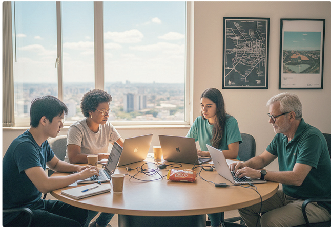
Dos inscritos, 82 optaram pela categoria de acesso à informação

Na categoria acesso à informação, os participantes deveriam desenvolver modelos capazes de identificar automaticamente pedidos que contenham dados pessoais, contribuindo para uma classificação mais segura e alinhada à Lei Geral de Proteção de Dados (LGPD). Já na categoria ouvidoria, o desafio consistia na criação de uma versão PWA (Progressive Web App) do Participa DF, que permita o envio de manifestações por texto, áudio, vídeo e imagem, com acessibilidade plena, protocolo automático e possibilidade de anonimato.