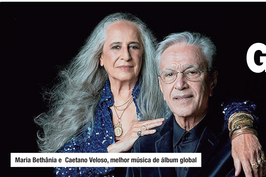
Maria Bethânia e Caetano Veloso, melhor música de álbum global

A MAIOR PREMIAÇÃO DA MÚSICA dos Estados Unidos, o Grammy 2026 aconteceu no último domingo. Estão entre os primeiros, Maria Bethânia e Caetano Veloso, que levaram bem alto, mais uma vez, o nome do Brasil. Nas fotos, alguns dos vencedores.