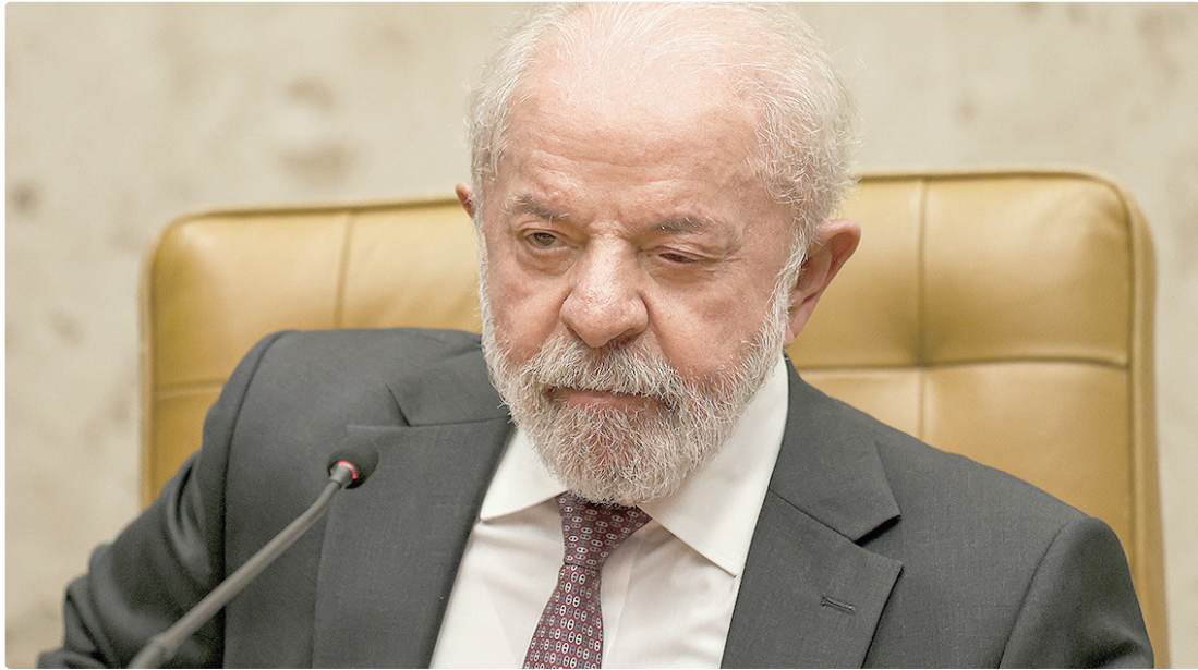
Lula não foi à abertura dos trabalhos legislativos, mas participou da sessão solene de abertura do Ano Judiciário 2026

Na mensagem, o presidente colocou como compromisso para este ano “fazer do Brasil um país mais desenvolvido e mais justo, com mais investimentos e menos desigualdades. Um país onde cada família possa viver com dignidade, moradia, saúde, educação, segurança, cultura, lazer e comida de qualidade na mesa”.