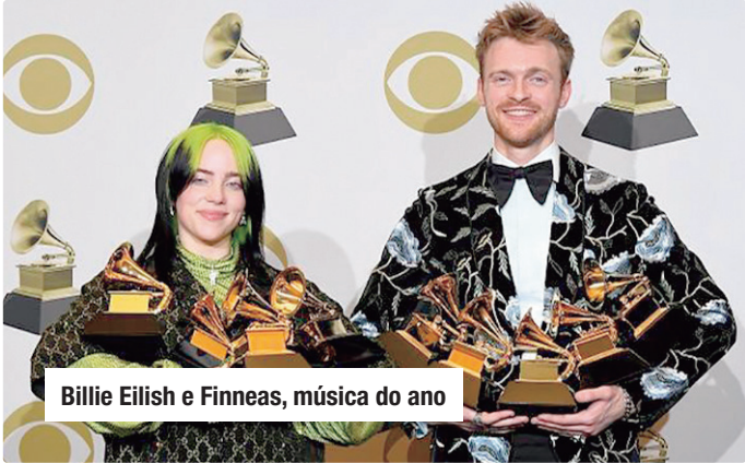
Billie Eilish e Finneas, música do ano