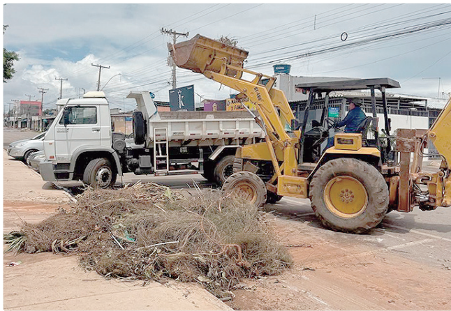
A ação em vários pontos de Ceilândia tem caráter preventivo

Também foram executados serviços de remoção de entulho na QNQ 3, QNR 3/4 e QNQ 7, em Ceilândia Norte, totalizando 36 toneladas de entulho recolhidas, além da retirada de resíduos no Quadradão da QNP 28 e no Quadradão da QNP 10, no Setor P Sul.