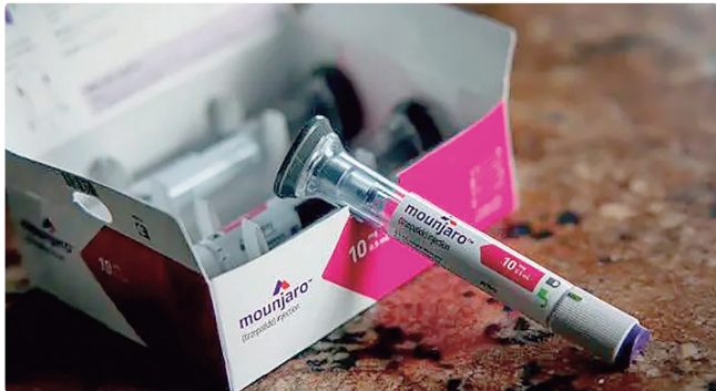
Pancreatite é efeito colateral conhecido, e pouco frequente, diz agência

camentos agonistas GLP-1, eles se mostram seguros e eficazes, “proporcionando benefícios significativos para a saúde”. “O risco de desenvolver esses efeitos colaterais graves é muito pequeno, mas é importante que pacientes e profissionais de saúde estejam cientes e atentos aos sintomas associados”, completou Alison. ENTENDA Os medicamentos agonistas GLP-1 são prescritos para o tratamento de diabetes tipo 2 e, no caso de produtos específicos, para o controle de peso e a redução do risco cardiovascular em indivíduos com doença estabelecida e alto índice de massa corpórea (IMC). Pesquisa recente publicada pela University College London estima que 1,6 milhão de adultos na Inglaterra, no País de Gales e na Escócia usaram as chamadas canetas emagrecedoras, incluindo a semaglutida (Wegovy e Ozempic) e a tirzepatida (Mounjaro), entre o início de 2024 e o início de 2025, com o objetivo de perda de peso.