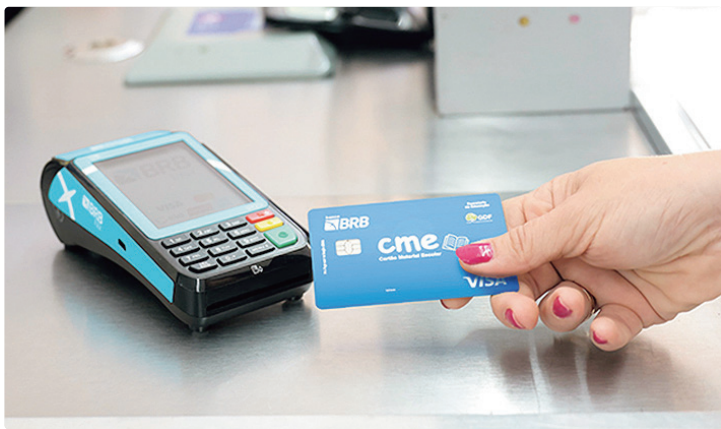
Com a liberação do crédito, as famílias já podem adquirir o material

Após a liberação do crédito, as famílias poderão adquirir os