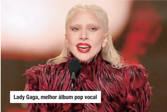
Lady Gaga, melhor álbum pop vocal