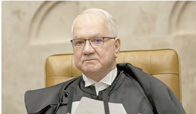
Presidente da Corte diz que buscará diálogo para aprovar o texto

A cerimônia foi acompanhada pelo presidente Luiz Inácio Lula da Silva, os presidentes da Câmara dos Deputados, Hugo Motta (Republicanos-PB), e do Senado, Davi Alcolumbre (União-AP), além de outras autoridades.