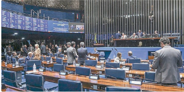
MP aprovada no Congresso deve alcançar 15 milhões de famílias

mais 15 milhões de famílias serão beneficiadas. O programa pretende combater a pobreza energética, definida como a dificuldade de uma família em ter acesso a serviços de energia essenciais e modernos, como iluminação, aquecimento, refrigeração e energia para cozinhar. Atualmente, o programa está instalado em todas as capitais. O Auxílio Gás, benefício criado no governo passado e que permite a compra de um botijão de 13 kg a cada dois meses por cerca de 4,4 milhões de famílias de baixa renda, será substituído. Em seu lugar, o Gás do Povo consolida a gratuidade do botijão em mais de 10 mil revendedoras credenciadas espalhadas pelo país, aumentando o alcance e o número de famílias atendidas, segundo o governo. De acordo com o regulamento do programa, a quantidade de recargas gratuitas de 13 kg será de quatro por ano para famílias de duas a três pessoas; para as famílias com quatro ou mais pessoas, será de seis ao ano. O texto também cria uma nova modalidade no programa, destinada à instalação de sistemas de baixa emissão de carbono e biodigestores que gerem gás metano por decomposição de restos de alimentos. Essa modalidade é destinada a áreas rurais e cozinhas comunitárias, e ainda depende de regulamento a ser feito pelo governo.