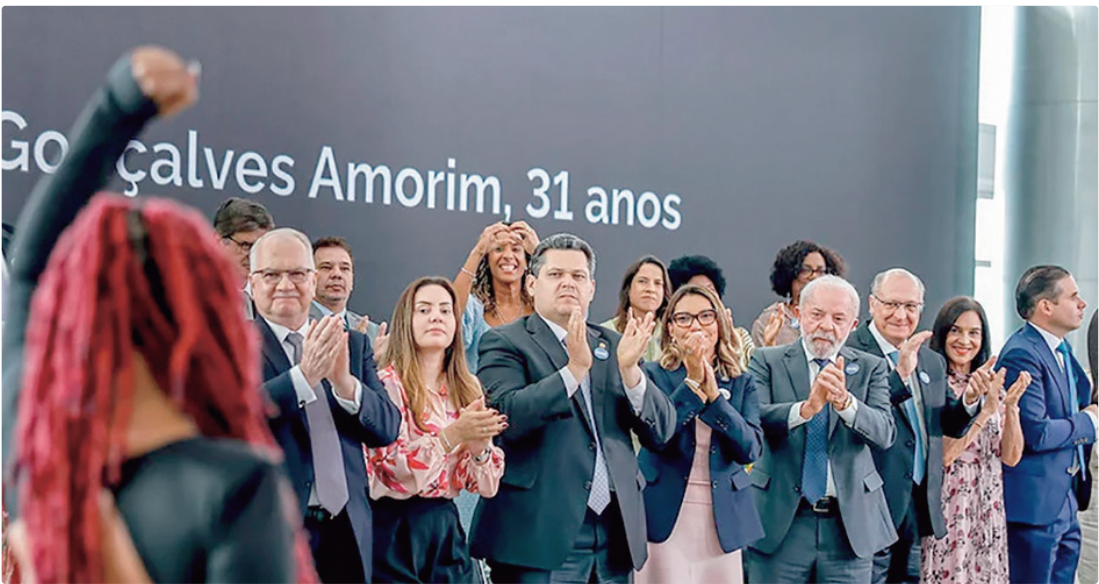
Intitulado de “Todos Por Todas”, o pacto, uma iniciativa do presidente Lula, uniu os Três Poderes da República

Os Três Poderes da República assinaram nesta quarta-feira (4), no Palácio do Planalto, o “Pacto Nacional Brasil de Enfrentamento ao Feminicídio”. A iniciativa uniu Executivo, Legislativo e Judiciário em um compromisso institucional para enfrentar a violência letal contra mulheres e meninas no Brasil. O lançamento ocorreu no Salão Nobre do Palácio do Planalto, com a presença do presidente Luiz Inácio Lula da Silva (PT), da ministra das Mulheres, Márcia Lopes, e de autoridades de todos os Poderes. A intenção é articular esforços entre União, estados, Distrito Federal, municípios, sistema de Justiça e sociedade civil. O pacto, batizado com o lema “Todos Por Todas”, tem como objetivo integrar ações de prevenção, proteção, responsabilização de agressores e garantia de direitos para mulheres vítimas de violência de gênero. Lula destacou a importância da educação de meninos e mencionou episódios envolvendo atletas brasileiros. “Não é apenas para o Dia da Mulher fazer passeada, mas lembrar que estamos conscientizando, os professores, da creche às universidades. Quando um jovem se forma em