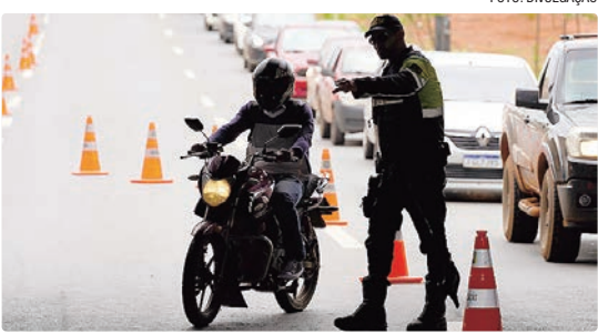
Motociclistas são o alvo da ação, que tem como objetivo orientar para a redução de sinistros e coibir irregularidades

abordagens e registradas 46 infrações, entre as quais se destacaram sete condutores inabilitados, 13 motocicletas com o sistema de iluminação alterado, seis com escapamento irregular, cinco com pneus em condições inadequadas e sete veículos