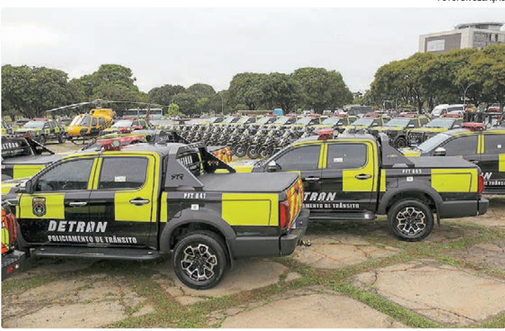
Novos veículos vão transportar equipamentos que hoje são de difícil uso

Durante a cerimônia, a vice-governadora enfatizou que as novas viaturas estão diretamente ligadas à segurança viária e à preservação de vidas. “A gente promete uma frota que vai melhorar a segurança da população”, declarou. “O Detran faz muitas blitzes