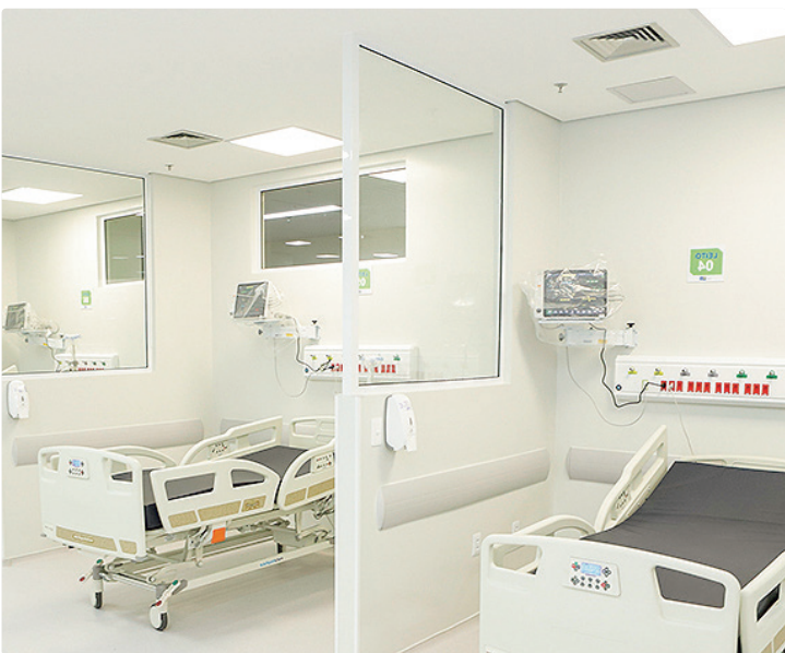
Contratação visa garantir acesso oportuno a procedimentos intensivos