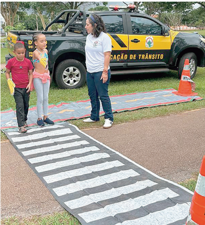
Campanhas educativas do Detran-DF ensinam a se proteger nas faixas

Gerência de Estatística é muito importante para subsidiar o planejamento de ações de educação, engenharia de tráfego e fiscalização de trânsito mais assertivas, levando em conta os tipos de sinistros, o perfil das vítimas e os fatores de risco. Temos observado que a vulnerabilidade e o desrespeito às leis de trânsito estão presentes na maioria das ocorrências que resultam em morte e a redução desses fatores depende que cada cidadão se conscientize mais do seu papel na segurança viária, obedecendo às