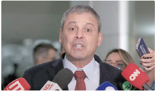
Lindbergh Farias informou que PT vai apoiar CPls do Banco Master

bém discute o tema. Apesar dessas iniciativas em tramitação no Legislativo, o líder do PT Lindbergh Farias argumentou que um projeto enviado pelo governo com urgência constitucional tem mais força para ser aprovado no Parlamento com mais rapidez. “Se a gente ficasse esperando, porque na Câmara está na Comissão do Trabalho, é um processo muito longo, você passa por várias comissões. Esse é um debate que a sociedade exige que seja tratado como prioridade”, afirmou. Lindbergh reconheceu que o tema tem rejeição das entidades patronais, mas acredita que é possível vencer as resistências à redução da jornada. “Quando a escravidão foi abolida, as pessoas diziam que isso ia ser uma catástrofe. Quando criaram o salário mínimo, diziam que isso ia desempregar muita gente. Quando criaram o décimo terceiro também, sempre foi isso. Vários países do mundo já estão adaptados, não trabalham com escala 6x1. Aqui vários setores da economia também”, argumentou.