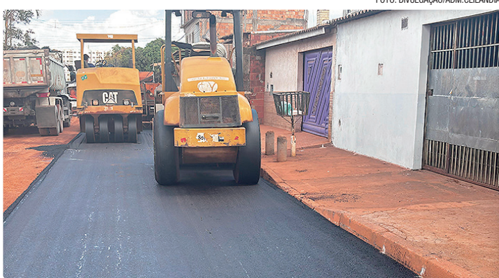
As ações reforçam o crescimento sustentável e o futuro de Ceilândia

As intervenções abrangem áreas estratégicas como infraestrutura urbana, mobilidade, educação, saúde, segurança pública, energia elétrica, esporte, lazer e geração de empregos. Entre os destaques estão a urbanização do Setor de