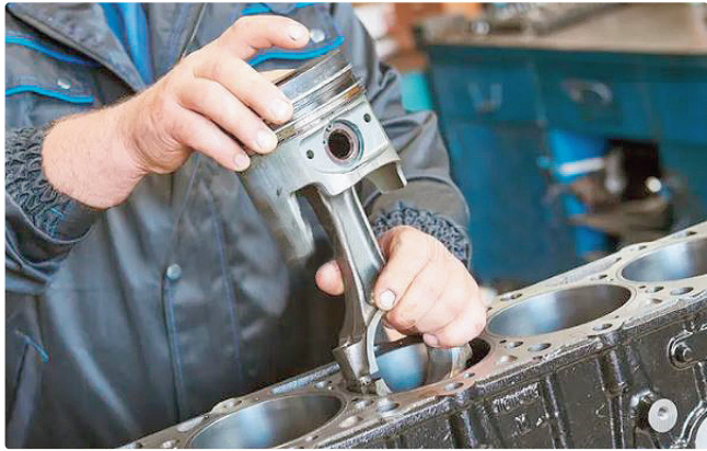
Vaga de R$ 4,5 mil para mecânico é oferecida em Vicente Pires

Empregadores e empreendedores que desejem ofertar vagas ou utilizar o espaço das agências do trabalhador para as entrevistas podem se cadastrar pessoalmente nas unidades ou pelo e-mail gcv@sedet.df.gov.br. Pode ser utilizado, ainda, no site da Sedet.