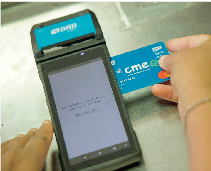
Para 43,7%, o CME corresponde entre 20% e 50% do faturamento no trimestre

Além do impacto imediato do CME, a pesquisa aponta um cenário de expectativa positiva para as vendas do setor em 2026.