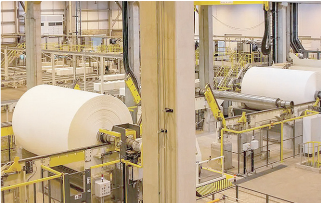
Para a CNI, juro a 15% ao ano encareceu o crédito ao setor produtivo

A análise da confederação também alerta para a pressão externa: as compras de bens de consumo no exterior saltaram 15,6% no ano passado. Ao mesmo tempo em que a indústria nacional reduzia o ritmo, os produtos importados preenchiam as lacunas, dificultando qualquer tentativa de recuperação do empresariado local ao longo dos dois semestres de 2025.