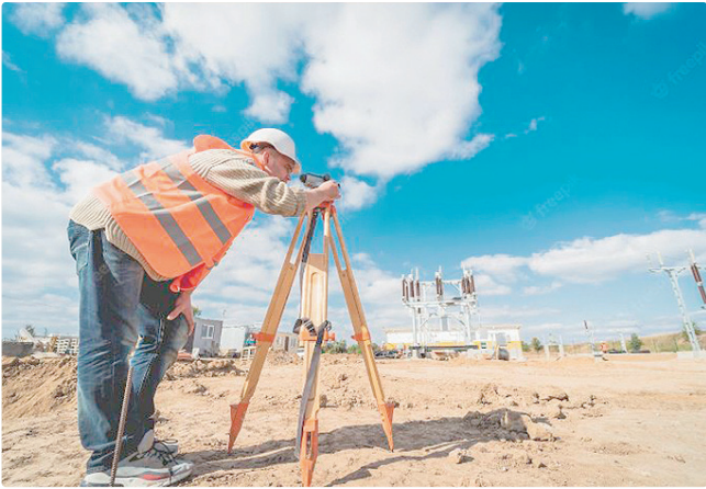
Cargo de topógrafo tem a maior remuneração do dia: R$ 2.786,21

Empregadores e empreendedores que desejem ofertar vagas ou utilizar o espaço das agências do trabalhador para as entrevistas podem se cadastrar pessoalmente nas unidades, pelo e-mail gcv@sedet.df.gov.br ou site da Sedet.