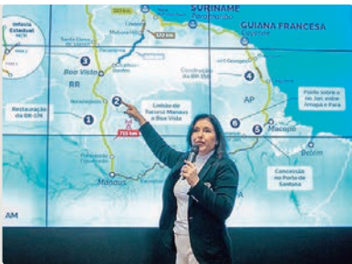
Simone Tebet, ministra do Planejamento

As redes de infraestrutura focam em cinco rotas estratégicas desenhadas após consulta aos 11 estados brasileiros que fazem fronteira com os países da América do Sul.