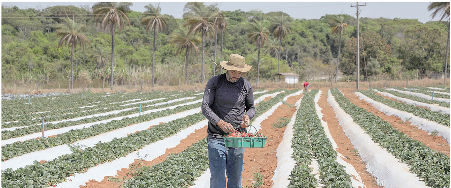
Esse recorte da PDAD-A ajuda o governo no desenho de ações, programas e projetos para a mitigação das dificuldades enfrentadas por essa população

PERFIL DA POPULAÇÃO Em relação à raça/cor da pele declarada pelos moradores da área rural, os pardos aparecem em maior percentual (57%), seguidos pela população branca (29,1%) e preta (11,6%). Quanto à religião, os católicos