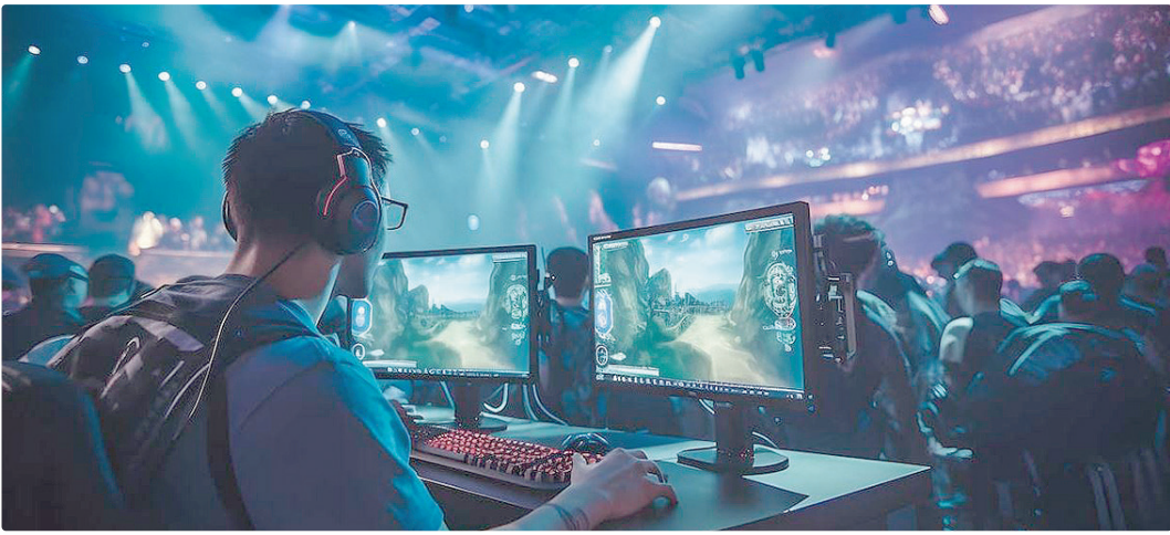
O projeto é fruto de parceria entre a Secretaria de Ciência, Tecnologia e Inclusão e o Instituto Brasil

“A ação ocorreu após a identificação da migração de comerciantes irregulares da CNN 1 para a CNN 2 e imediações. A DF Legal reforça seu compromisso com a organização do espaço público e com o combate ao comércio irregular, assegurando concorrência justa aos comerciantes regularmente licenciados no DF.”