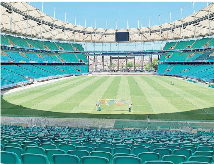
O Bahia é a única equipe do Brasileirão com 100% de aproveitamento

Classificado com antecedência no Carioca, o Fluminense enfrenta o Bahia para manter a sequência positiva nesse início de temporada – até agora são qua-