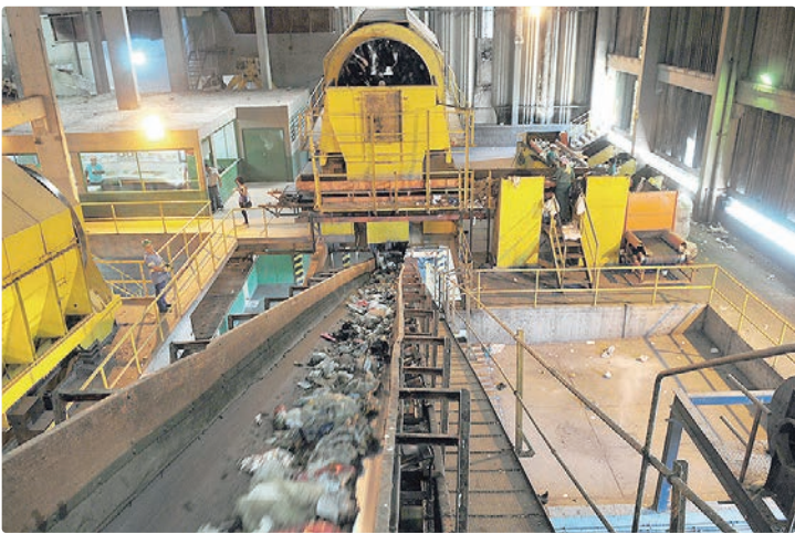
UTMB do P Sul coloca o Distrito Federal entre os principais polos do país

Ao longo da última década, somadas as operações das Utmb's do P-Sul e da Asa Sul, foram processadas mais de 2,7 milhões de toneladas de resíduos da coleta convencional, volume que corresponde, em média, a 40% de todo o lixo domiciliar coletado no DF. Esses resíduos passaram por triagem, separação de recicláveis e tratamento da fração orgânica, evitando que uma parcela expressiva fosse destinada diretamente ao Aterro Sanitário de Brasília (ASB). Entre 2015 e 2025, as usinas produziram mais de 720 mil toneladas de composto orgânico cru, que após o processo de maturação resulta em produto pronto para uso. Desse