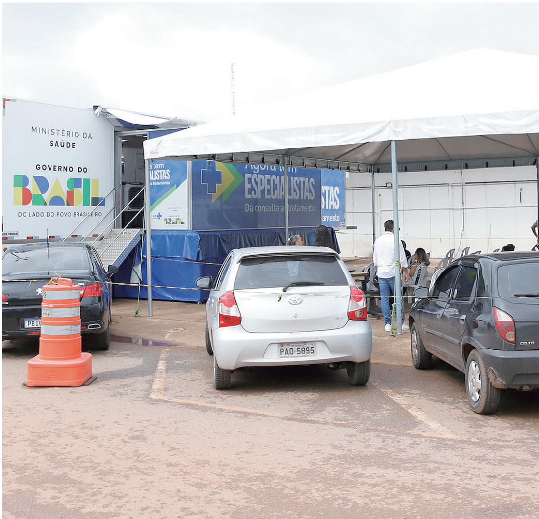
Com apoio da Secretaria de Saúde, a iniciativa oferece serviços voltados à prevenção e cuidado para a mulher

Quase 800 consultas e 1,2 mil exames, sendo 718 de mamografias e 495 de ecografias transvaginais. Esse é o resultado dos atendimentos realizados pela Carreta do Programa Agora Tem Especialistas, no Hospital Regional de Taguatinga (HRT). Com apoio da Secretaria de Saúde (SES-DF), a iniciativa, que é do Ministério da Saúde (MS), oferece serviços voltados à prevenção e cuidado da saúde da mulher, como consultas com especialistas ginecologistas, além da realização de exames de imagem, como mamografias e ultrassonografias. Durante a permanência na Região de Saúde Sudoeste – que engloba Taguatinga, Águas Claras, Recanto das Emas, Samambaia, Vicente Pires e Água Quente – a carreta atenderá a mulheres previamente reguladas, ou seja, já inseridas na fila de espera do Distrito Federal. O objetivo é ampliar o acesso à assistência especializada, atuando como uma porta adicional de entrada para os usuários do Sistema Único de Saúde (SUS).