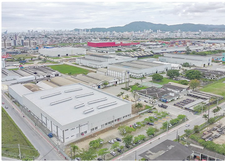
As baterias servem para guardar energia elétrica e liberá-la quando necessário

Um dos atributos do sistema é reduzir perdas associadas ao