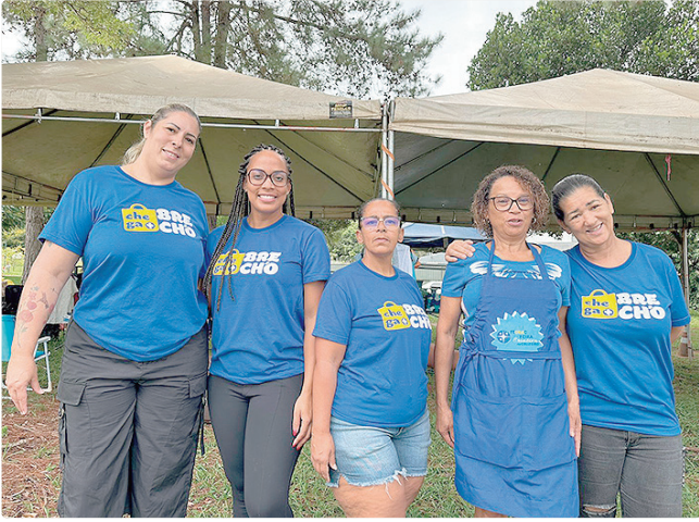
Mulheres expõem produtos artesanais, gerando renda no comércio

Os artigos vendidos às quintas-feiras são diversos, como roupas, sapatos, bolsas, peças de artesanato e quitutes, tudo por um preço acessível. Tudo passa pelo olhar criterioso das feirantes, que fazem jus a um dos objetivos principais: movimentar a economia local, gerando empregos e renda.