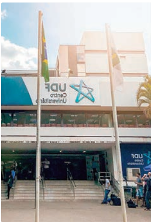
Parceria de bolsas entre GDF e UDF teve início em 1968

No período em que esteve em Ceilândia, entre dezembro de 2025 e a primeira quinzena de 2026, foram registradas mais de 1,4 mil pessoas atendidas e 3,3 mil procedimentos realizados.