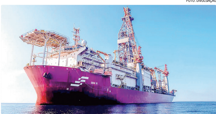
Petrobras poderá continuar operação quando comprovar cumprimento

A retomada das atividades somente poderá ocorrer após a substituição de todos os selos