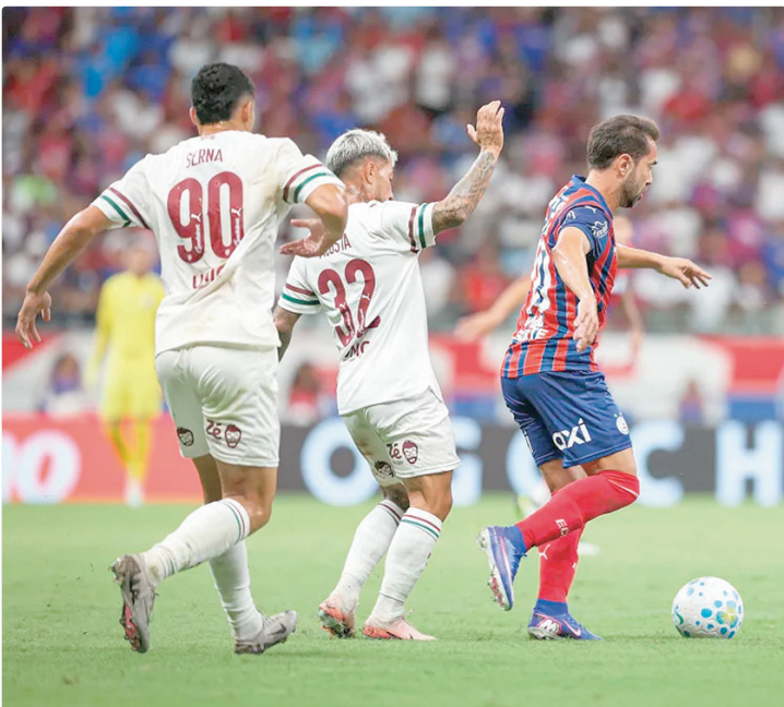
Fluminense e Bahia estão juntinhos na tabela, em 6º e 7º, respectivamente

A situação poderia ter ficado ainda mais favorável aos