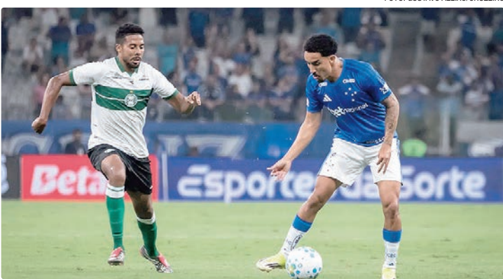
Quebra de jejum: Coritiba não vencia o Cruzeiro em Belo Horizonte há 22 anos

O técnico Tite viu o trabalho ficar ainda mais pressionado. Lanterna do Brasileiro, com duas derrotas, o treina-