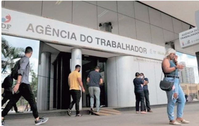
Região com mais vagas é Asa Norte, que oferece 91 oportunidades

completo ou nenhuma exigência de escolaridade. As regiões com maior número de vagas são Asa Norte, com 91 oportunidades; Águas Claras, com 50; Sobradinho, com 50; Planaltina, com 50; e Samambaia Sul, com 45. Há, ainda, 61 vagas sem local fixo de trabalho. Os cargos com maior número de vagas são operador de caixa, com 91 postos; repositor de mercadorias, com 65; atendente de lojas, com 50; açougueiro, com 45; e fiscal de prevenção de perdas, com 35. Para participar dos processos seletivos, os trabalhadores podem cadastrar o currículo no aplicativo da Carteira de Trabalho Digital ou comparecer a uma das 16 agências do trabalhador do DF, de segunda a sexta-feira, das 8h às 17h. Empregadores e empreendedores podem utilizar a estrutura das agências. Cadastro pelo e-mail gcv@sedet.df.gov.br, ou no site da Sedet.