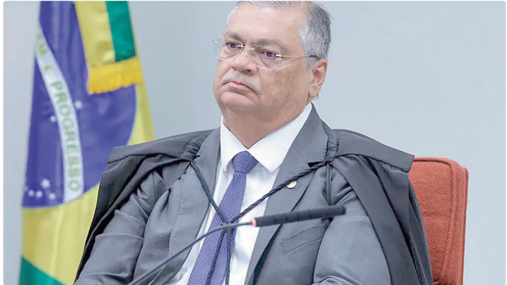
Na decisão, ministro diz que há um “fenômeno da multiplicação anômala”

patíveis com a Constituição Federal. Ele cita como exemplo o pagamento de “auxílio-peru” e “auxílio-panetone” (benefícios extras de fim de ano) como exemplos de ilegalidade.