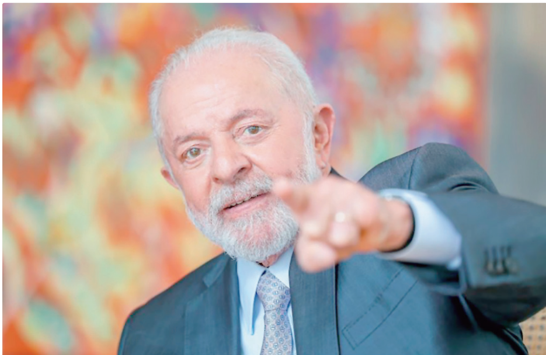
Lula disse que não acha justo uma pessoa entrar com 35 anos e ficar até 75 anos no cargo: “É muito tempo”

8 DE JANEIRO “Eu acho que não é justo uma pessoa entrar com 35 anos e ficar até 75 anos, ou seja, não é justo. É muito tempo, então eu acho que pode ter um mandato. Mas isso é um processo a ser discutido com o Congresso Nacional que não tem nada a ver com o que aconteceu no 8 de janeiro ou com o julgamento do 8 de janeiro”, acrescentou o presidente.