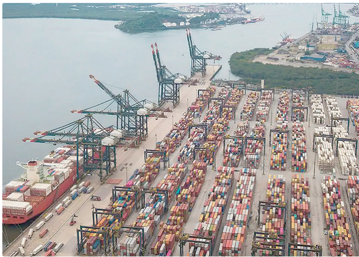
O Mdic projeta superávit comercial de US$ 70 bilhões a US$ 90 bilhões em 2026

O valor das exportações é o terceiro melhor para meses de janeiro desde o início da série histórica, em 1989, só perdendo para janeiro de 2024 e de 2025. As importações registraram o segundo melhor