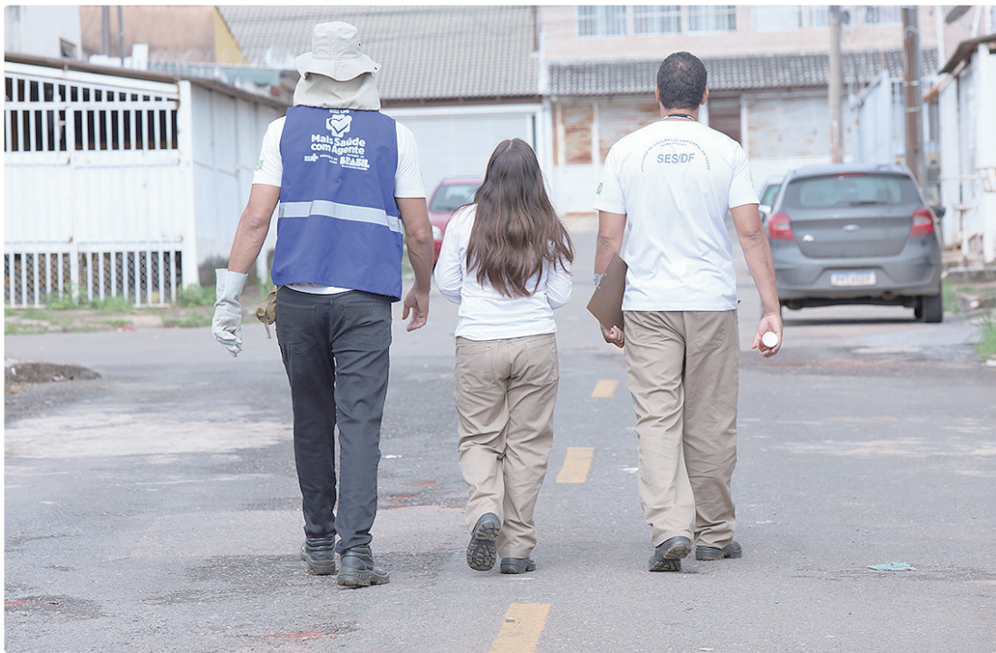
Serviço de orientação técnica da Vigilância Sanitária é solicitado pelo número 162 ou por meio do site do Participa DF

CONSCIENTIZAÇÃO O principal objetivo das