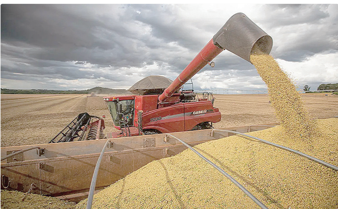
Exportações à China cresceram 17,4% em janeiro; a soja lidera o comércio

Esta foi a sexta retração consecutiva nas vendas brasileiras aos EUA desde a imposição da sobretaxa de 50% aplicada pelo governo de Donald Trump a produtos do Brasil, em meados de 2025. Apesar de a tarifa ter sido parcialmente revista no fim do ano passado, o Mdic estima que 22% das exportações brasileiras ainda estejam sujeitas às alíquotas extras, que variam entre 40% e 50%.