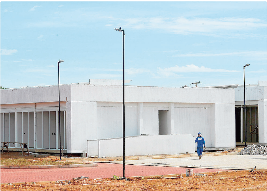
O espaço contará com consultórios médicos e de enfermagem, farmácia e salas de vacinação e de curativos

ESTRUTURA Atualmente, os serviços estão concentrados em pintura das paredes, instalação de portas e janelas e preparação para instalar aparelhos de ar-condicionado. Na área externa, a execução da calçada e o plantio do gramado também já foram iniciados.