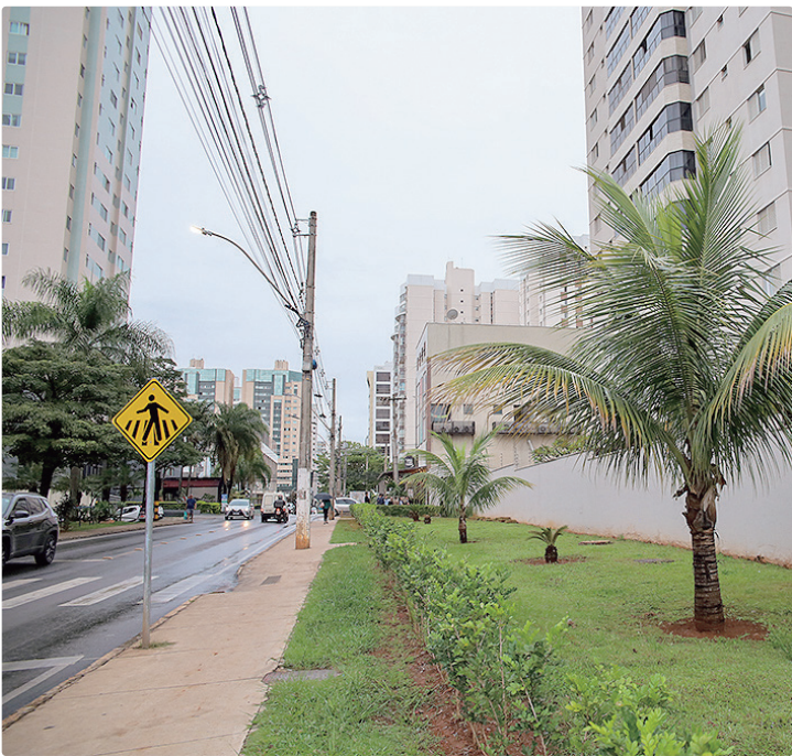
O programa Adote uma Praça une as iniciativas pública e privada