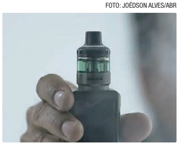
Parceria visa garantir resolução que proíbe comercialização dos vapes

Em nota, a Anvisa informou que o acordo visa garantir o cumprimento da Resolução da Diretoria Colegiada (RDC) 855/2024, que proíbe a fabri-