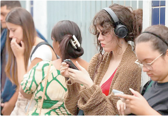
Financiamento custeia mensalidade em faculdade privada

VAGAS O Ministério da Educação (MEC) ofertará mais de 112.168 vagas para financiamento em 2026, sendo 67.301 vagas para o primeiro semestre, em 1.421 universidades, faculdades e centros universitários, para 19.834 cursos. As vagas que eventualmente não forem ocupadas nesta edição serão ofertadas no segundo semestre.