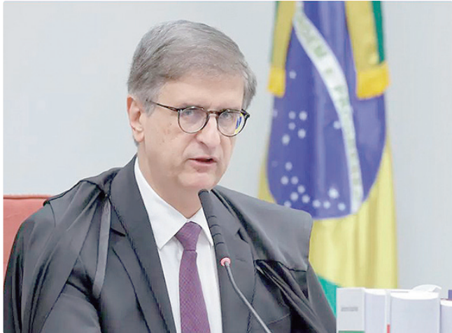
Para Gonet, competência para analisar é da Justiça comum

No ano passado, o ministro Gilmar Mendes, relator, suspendeu todas as ações sobre o tema que estão em tramitação no país. Os processos só voltarão a tramitar após a decisão da Corte sobre a legalidade da pejetização.