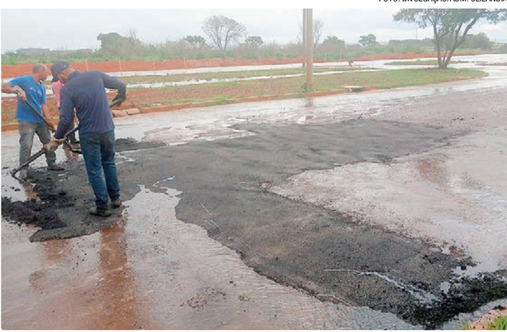
Entre as ações estão a retirada de restos de asfalto e manutenção asfáltica

Entre as ações realizadas estão a retirada de restos de asfalto, para evitar que o material seja levado para a rede de águas pluviais e provoque entupimentos, além de serviços emergenciais de manutenção asfáltica, executados com massa fria e caminhão térmico, garantindo mais segurança para motoristas e pedestres. As equipes também