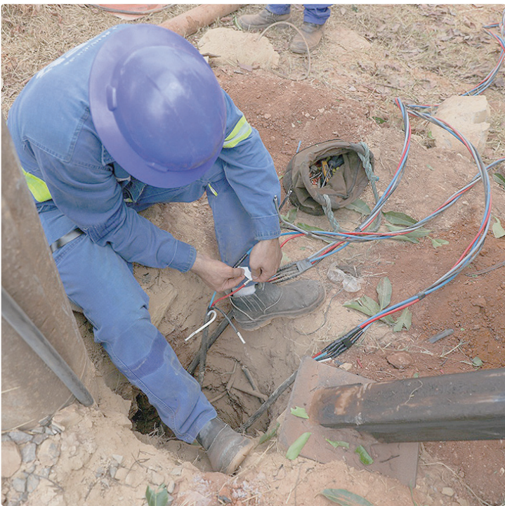
O serviço para recompor a rede elétrica é complicado e pode levar horas

O Plano Piloto concentrou o maior número de casos, com 602 ocorrências. Águas Claras vem em seguida, com 120 registros, sendo a segunda região mais impactada. Segundo a Neoenergia, cada ação criminosa provoca oscilações, interrupções no fornecimento e pode resultar na queima de equipamentos, além