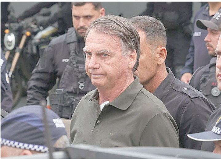
Perícia médica atesta que Bolsonaro recebe tratamento adequado na Papudinha

República (PGR). Embora não haja um prazo definido para isso, a tendência, segundo o analista, é que o ex-presidente continue no complexo penitenciário por pelo menos um médio prazo, já que o principal argumento para a prisão domiciliar seria a necessidade de cuidados médicos que não pudessem ser oferecidos no local de detenção atual.