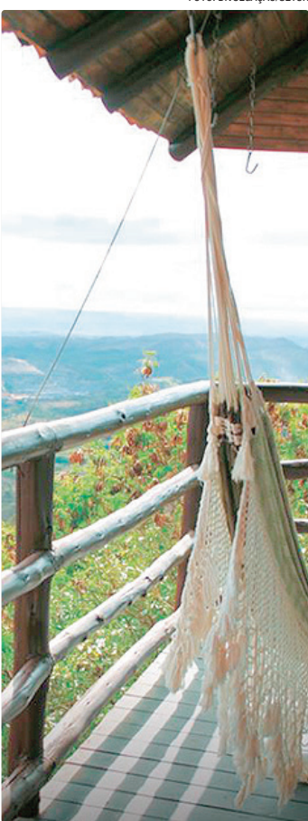
Coleção Rotas Brasília traz dicas de vários estilos para descansar

Brasília está se preparando para um Carnaval vibrante e plural, oferecendo uma combinação única para moradores e visitantes: de um lado, a efervescência dos blocos de rua; do outro, a serenidade de roteiros turísticos voltados à tranquilidade, ao contato com a natureza e à espiritualidade. A Secretaria de Turismo (Setur-DF) tem dicas para quem quer aproveitar a folia com sossego. A secretária disponibiliza a coleção Rotas de Brasília (www.turismo.df.gov.br/colecao-rotas-brasilia), composta por miniguias com experiências segmentadas, pensadas para que moradores e turistas aproveitem diferentes aspectos da capital. O material reúne opções para toda a família, que vão desde vivências cívicas, passando por ícones como o Congresso Nacional e a Praça dos Três Poderes, até atrativos voltados ao relaxamento e ao contato com a natureza.