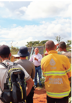
Na trilha, pode ser observada a espécie de abelha sem ferrão

A Defensoria Pública do DF (DPDF), lançou o curso “Infâncias em perspectiva: proteção integral e o papel da Defensoria Pública do DF”. As aulas são gratuitas e estão disponíveis na plataforma de ensino a distância da Escola de Assistência Jurídica da instituição (Easjur/DPDF), a Easjur EaD. O curso é dividido em sete módulos e, ao final, os participantes recebem certificação de dez horas/aula. O objetivo é propor um olhar sensível e qualificado sobre a atuação da Defensoria Pública na área da infância e da juventude, destacando seu compromisso com a defesa de direitos e a promoção do desenvolvimento pleno de crianças e adolescentes. A formação apresenta conceitos fundamentais sobre a proteção integral, aprofunda o entendimento sobre os direitos infantojuvenis e evidencia a importância da rede de proteção, dos serviços de acolhimento e dos processos de adoção como instrumentos para assegurar segurança, cuidado e convivência familiar. A capacitação conta com materiais didáticos exclusivos, entre os quais a edição da série “Você não sabe? A Defensoria te ensina”, que conta com 50 perguntas e respostas didáticas envolvendo a vivência da DPDF na atuação diária. Além disso, consta da lista de materiais a versão com jurisprudência da publicação.