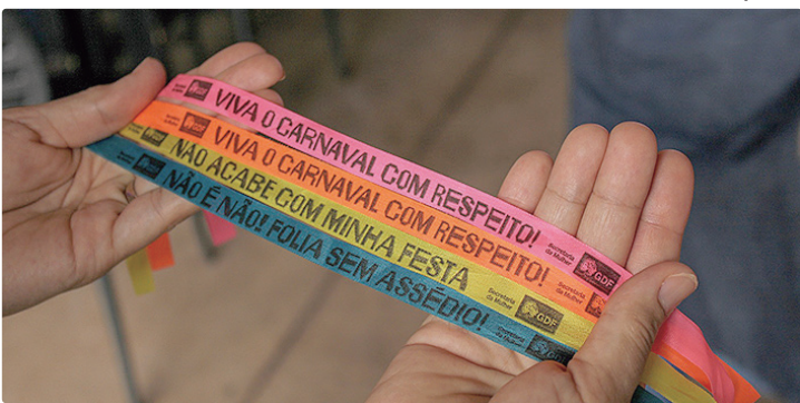
Os materiais são entregues em locais de grande circulação, como os bares