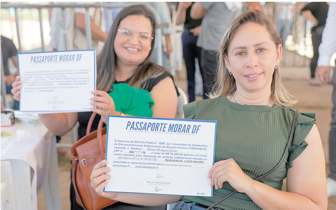
Famílias que tenham renda até cinco salários mínimos (R$ 8.105) podem participar do programa da Codhab