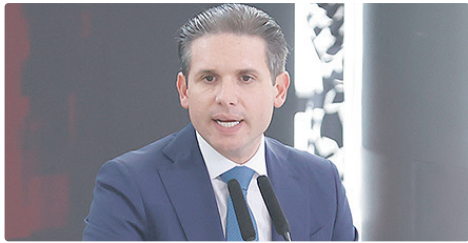
Hugo Motta afirmou que todos os setores serão ouvidos para formulação da proposta de redução de jornada

lho (VAT), que ganhou força nas redes e somou 1,5 milhão de assinaturas em um abaixo-assinado que pede à Câmara dos Deputados a revisão da escala 6x1. A PEC, que agora poderá ser discutida na Câmara, pretende alterar um trecho da Constituição que trata dos direitos dos trabalhadores urbanos e rurais. A proposta de Erika Hilton prevê estabelecer que a jornada de trabalho normal: • não poderá ser superior a 8 horas diárias; • não poderá ultrapassar 36 horas semanais; e • será de 4 dias por semana. Segundo o texto, as mudanças entrariam em vigor depois de 360 dias da eventual promulgação da PEC. O governo e partidos da base do presidente Lula já disseram ser favoráveis a uma redução da jornada de trabalho. O encaminhamento anunciado por Motta nesta segunda é também um aceno ao Palácio do Planalto. No Senado, uma PEC com teor semelhante ao texto de Erika Hilton já foi aprovado pela CCJ da Casa, mas ainda não foi pautado no plenário pelo presidente Davi Alcolumbre (União-AP).