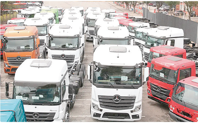
Programa Move Brasil apoia troca de caminhões antigos por novos

Quando o Copom aumenta a Selic, a finalidade é conter a demanda aquecida e isso causa reflexos nos preços porque os juros mais altos encarecem o crédito e estimulam a poupança. Assim, taxas mais altas também podem dificultar a expansão da econo-