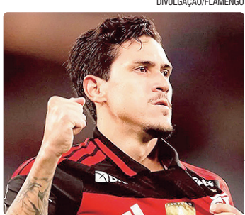
FLAMENGO ATROPELA O SAMPAIO CORRÊA (7 X 1)

Com o resultado, o clube vai encerrar o Volta Redonda nas quartas de final do Carioca, com a vantagem de jogar em casa. A equipe alvinegra, por sua vez, já sabia que terá o Flamengo pela frente no mata-mata e ganhou desfalques.