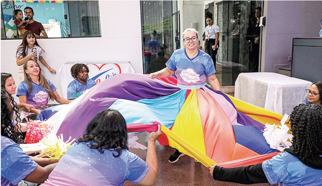
Visita à Cocris objetivou fortalecer a parceria com as organizações

Andrade adverte que se, mesmo após adotar medidas de higiene do sono, a pessoa continuar com os sintomas de antes, então é necessário procurar ajuda. A porta de entrada preferencial para os serviços da SES-DF são as unidades básicas de saúde (UBS). Nelas, o paciente será inicialmente atendido pela equipe de estratégia e saúde da família. A depender da complexidade do quadro, poderá ser encaminhado ao atendimento especializado, como o ambulatório do sono, no Hran.