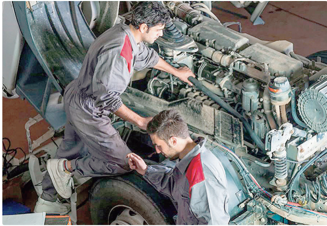
Vaga para mecânico de caminhões, no Guará, paga R$ 4,6 mil

Empregadores e empreendedores que desejem ofertar vagas ou utilizar o espaço das agências do trabalhador para as entrevistas podem se cadastrar pessoalmente nas unidades ou pelo e-mail gcv@sedet.df.gov.br. Pode ser utilizado, ainda, o Canal do Empregador, no site da Sedet.