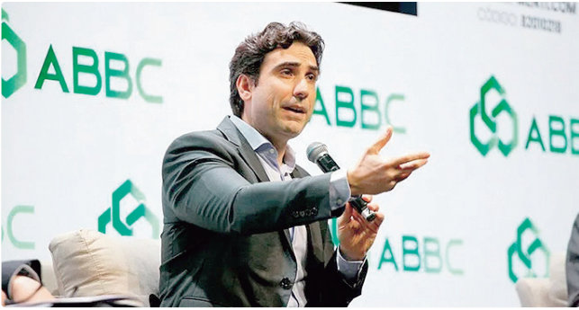
Gabriel Galípolo detalhou bastidores da liquidação do Banco Master