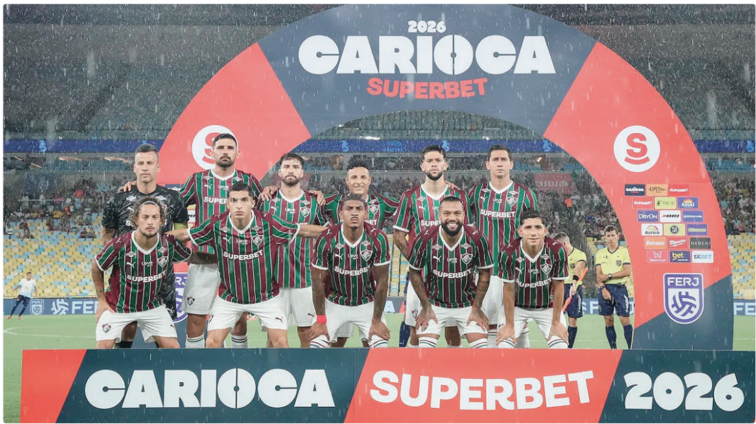
Líder do grupo A, o Flu já entrou em campo com o título da Taça Guanabara