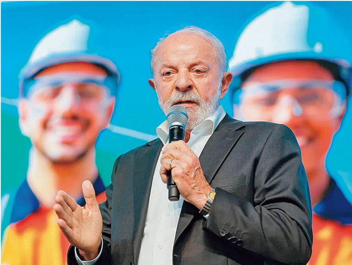
Fala de Lula ocorreu durante evento no Instituto Butantan, nesta segunda

O presidente Luiz Inácio Lula da Silva (PT) voltou a exaltar a soberania nacional em discurso e a defender o multilateralismo. Em evento no Instituto Butantan nesta segunda-feira (9), o chefe do Executivo afirmou que não quer que o Brasil seja “menor” do que os Estados Unidos ou do que a China. “Um unilateralismo imposto pela teoria de que o mais forte pode tudo contra o mais fraco, a nós não nos interessa. Eu não quero ter supremacia sobre o Uruguai, eu não quero ter supremacia sobre a Bolívia, mas também não quero ser menor do que os Estados Unidos ou do que a China”, declarou. Segundo Lula, o Brasil não está “escolhendo” entre China e Estados Unidos. O petista disse que, se houvesse uma oportunidade com a China, não haveria motivos para não negociar com o país asiático. “Se a China aceita fazer uma parceria conosco na produção de vacinas e vai produzir a quantidade que a gente ainda não tem condição de produzir, por que não fazer um convênio com a China?”, questionou durante a cerimônia que simboliza o aumento da produção nacional de vacinas.