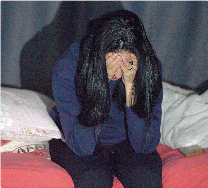
Noite mal dormida desorganiza hormônio e atrapalha controle de diabetes

IMPORTÂNCIA DO SONO Profissional do ambulatório do sono do Hospital Regional da Asa Norte (Hran), a pneu-