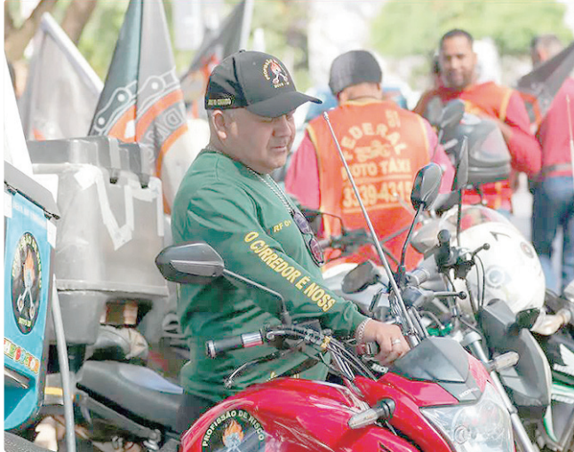
Para participar, homens terão de apresentar inscrição no CadÚnico

O curso, com 30h aula, será gratuito para quem participar do programa Mulheres que Dirigem Vão Mais Longe e para homens que comprovarem inscrição ativa no CadÚnico. Homens que não fazem parte do CadÚnico podem se inscrever mediante o pagamento de R$ 234. Eventuais dúvidas podem ser encaminhadas para o Detran, por meio do endereço eletrônico e-mail nufor@detran.df.gov.br.