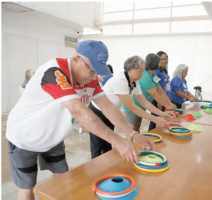
Além dos exercícios, grupo recebe orientação para a educação em saúde

Para reduzir esse cenário, as unidades básicas de saúde (UBSs) promovem circuitos multissensoriais de prevenção de quedas, com metodologias próprias que estimulam força, cognição e equilíbrio de pessoas idosas. Na UBS 1 do Areal, o circuito é realizado toda terça-feira, às 8h, com a participação de 20 idosos, em média. A atividade inclui práticas corporais funcionais, estímulos de atenção e memória. Além disso, os participantes têm acesso a um canal no YouTube, criado pelos próprios profissionais, para que os participantes mantenham a rotina ativa em casa.