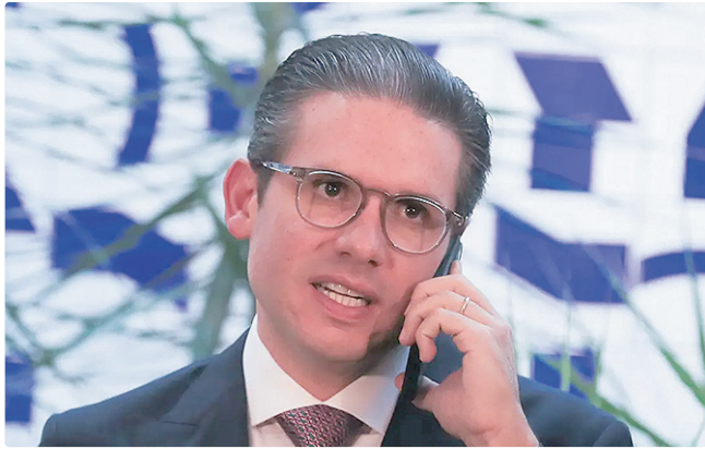
Segundo Motta, todos os setores serão ouvidos com responsabilidade

Segundo o texto, as mudanças entrariam em vigor depois de 360 dias da eventual promulgação da PEC.