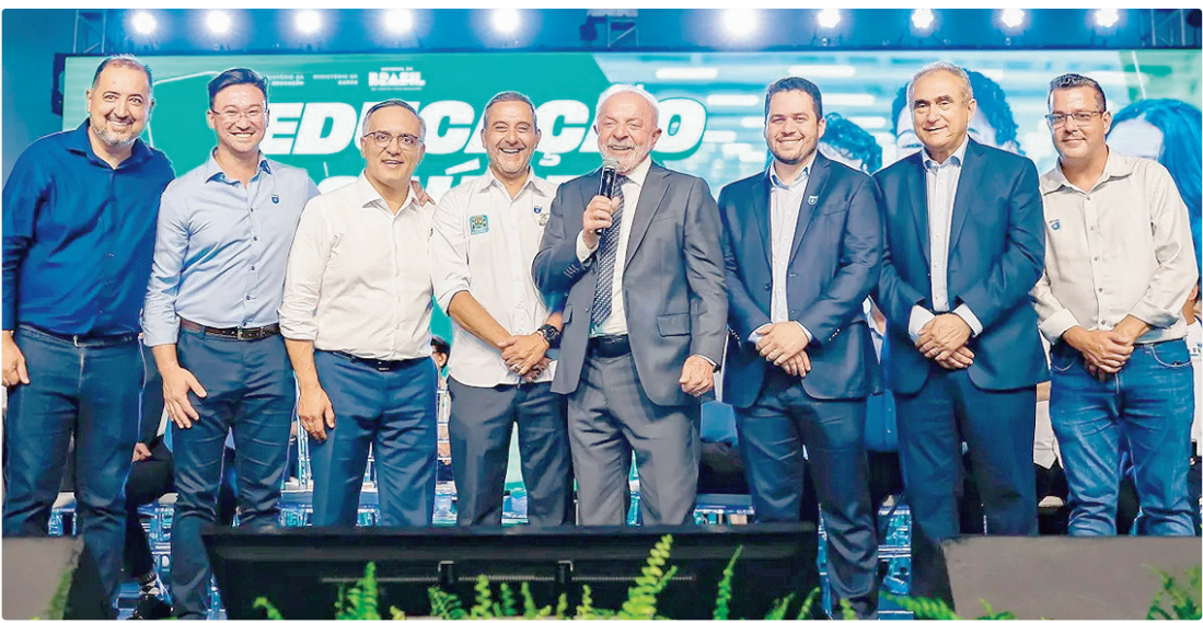
Petista entregou ambulâncias e anunciou investimentos em saúde e educação na cidade da Grande São Paulo

“Só para vocês terem ideia, aqui tem dois prefeitos que são do PL. O PL é o partido do Bolsonaro, o PL é o maior inimigo nosso na Câmara, mesmo assim vocês estão recebendo ambulância porque vocês foram eleitos pelo voto e eu respeito o voto da cidade de vocês”, acrescentou Lula.