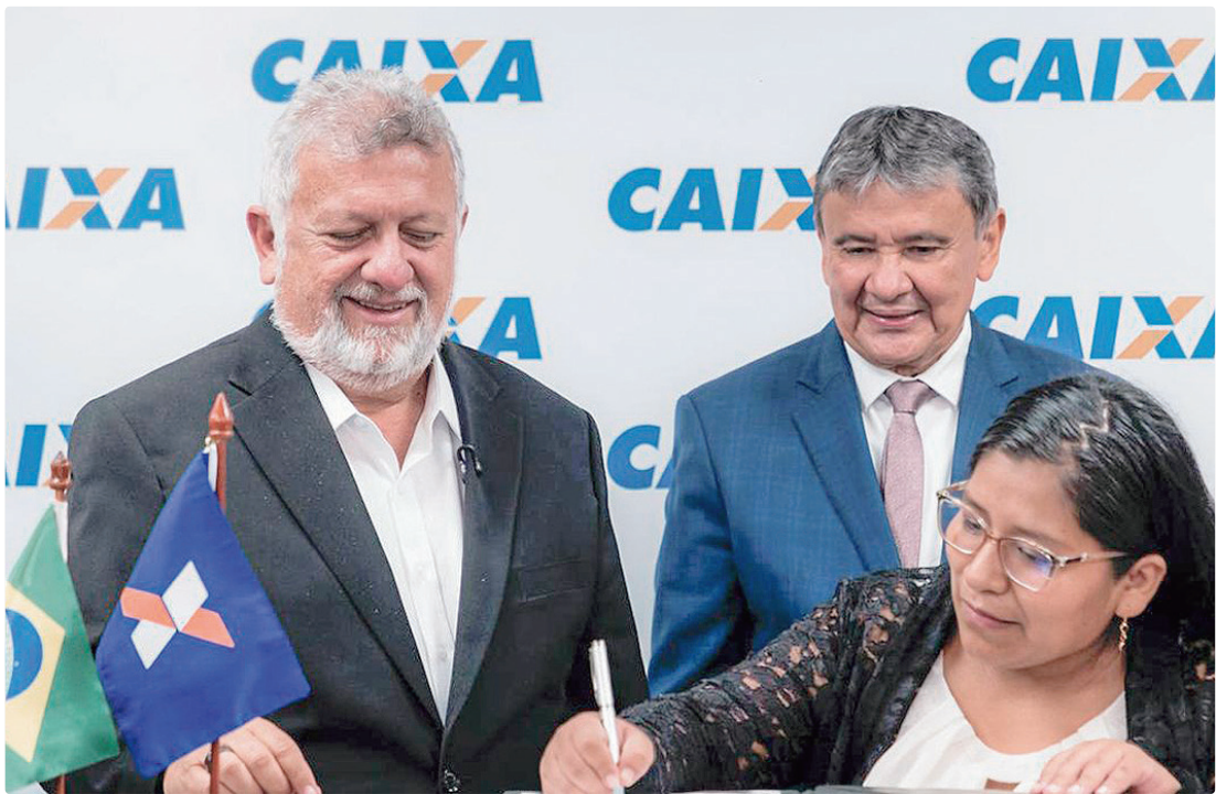
Os primeiros contratos foram assinados na segunda, pelo ministro do MDS e o presidente da Caixa Econômica

“Não se trata só de um financiamento, é um crédito assistido. Tem o crédito, mas tem a assis-