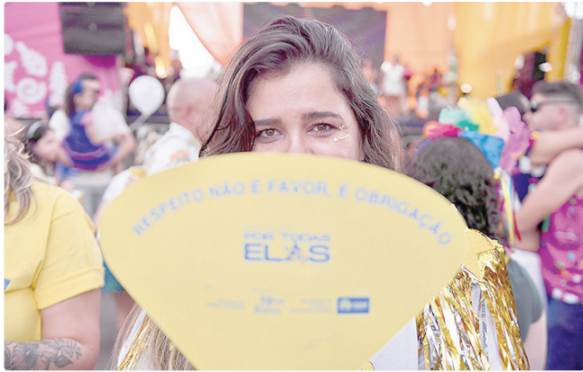
Campanha estará nos eventos de maior público do carnaval