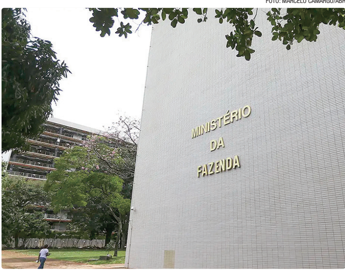
Volume para emissões de títulos de dez anos do Tesouro bateu recorde

que na emissão anterior de títulos de dez anos, realizada em novembro. Na ocasião, o Tesouro obteve juros de 6,2% ao ano. Em relação ao spread, a diferença também foi maior que os 210,9 pontos (2,109 pontos percentuais) registrada em novembro.