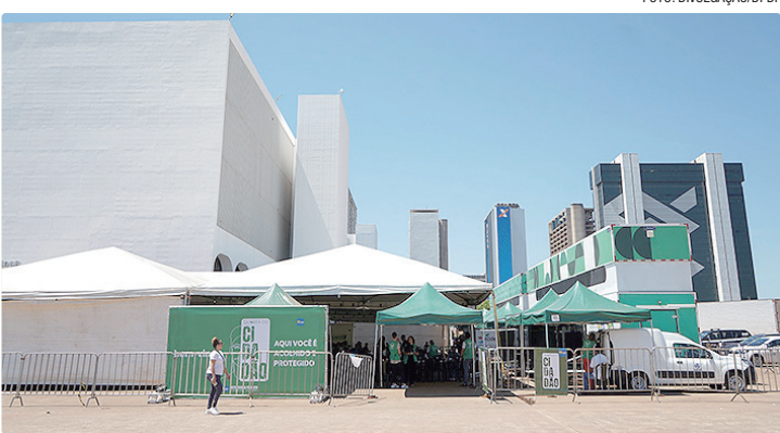
Evento oferece diversos serviços concentrados em um único dia e local

A ação tem como objetivo promover a inclusão, a cidadania e a transformação social, preferencialmente a homens em situação de vulnerabilidade e seus familiares. Embora o foco seja o público masculino, a iniciativa é inclusiva, garantindo que outros grupos também sejam beneficiados. Desde