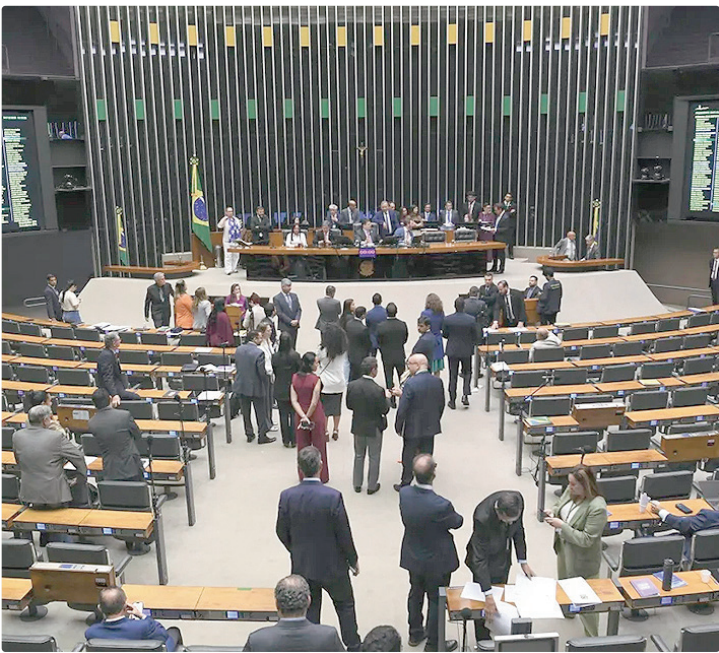
Governo terá de pagar 65% das emendas parlamentares até o final de junho

Integrantes do governo afirmam que a liberação recorde é resultado de um esforço para melhorar a relação com o Congresso Nacional. No ano passado, a gestão petista foi alvo de reclamações na própria base