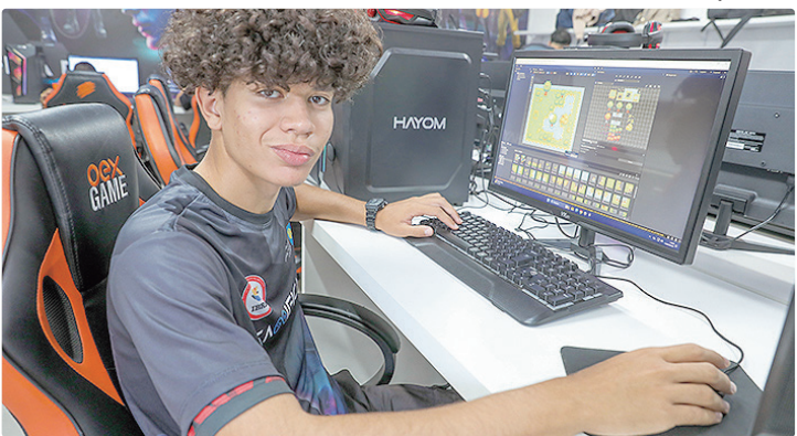
Projeto prevê abranger mais de 22,4 mil pessoas ao longo deste ano

A partir desta quinta-feira (12), estarão abertas as inscrições para o projeto Tecnologia em Jogo-Gamifica, iniciativa da Secretaria de Ciência, Tecnologia e Inovação (Secti-DF) executada em parceria com o Instituto de Bombeiros de Responsabilidade Social (Ibres). O objetivo é oferecer a jovens do DF capacitação em uma das áreas que mais crescem no mercado de tecnologia. Interessados devem fazer o cadastro pelo site oficial do programa para garantir a participação no projeto, que prevê prestar mais de 22,4 mil atendimentos ao longo de um ano. Com um investimento total de R$ 15 milhões, o Gamifical promove inclusão digital, inovação tecnológica e qualificação no universo dos jogos ele-