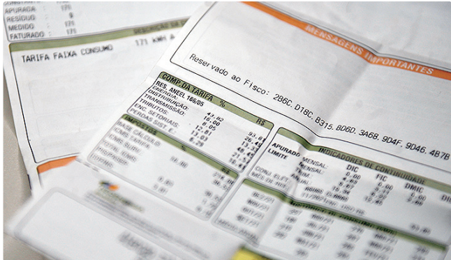
Conta de luz mais barata no mês de janeiro compensa alta da gasolina

A coleta de preços é feita em dez regiões metropolitanas - Belém, Fortaleza, Recife, Salvador, Belo Horizonte, Vitória, Rio de Janeiro, São Paulo, Curitiba, Porto Alegre - além de Brasília, Goiânia, Campo Grande, Rio Branco, São Luís e Aracaju.