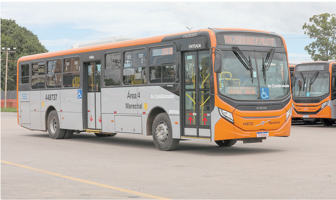
Fabricados com tecnologia Euro 6 – Proconve 8, os ônibus reduzem até 80% da emissão de gases poluentes

A renovação da frota de ônibus do Distrito Federal ganhou mais um capítulo com a entrega de 23 novos coletivos da Viação Marechal, em Taguatinga Sul. Os veículos passaram pela vistoria da Secretaria de Transporte e Mobilidade (Semob-DF) e começaram a circular na última semana, atendendo a linhas que circulam por Águas Claras, Arniqueira, Ceilândia, Guará, Park Way e Taguatinga. Fabricados com tecnologia Euro 6 – Proconve 8, os ônibus reduzem até 80% da emissão de gases poluentes, segundo o padrão ambiental mais recente adotado no país. Além disso, todos contam com ar-condicionado, elevador para acessibilidade, câmeras de monitoramento e sistema de GPS. Os veículos também possuem portas dos dois lados, o que permite a operação tanto no Boulevard do Túnel Rei Pelé quanto nos corredores exclusivos da EPTG e da Epig, facilitando o embarque e desembarque ao longo do Eixo Oeste. MENOR MÉDIA DE IDADE “Nós temos hoje, contando com esses 23 e os que já haviam sido renovados, a