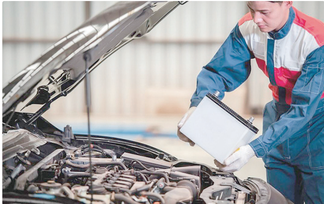
Posto de mecânico de veículos, em Águas Lindas, paga R$ 3,8 mil

Os salários partem de R$ 1.621. Há, ainda, 20 vagas para estágio como auxiliar administrativo em Planaltina e Sobradinho, com oferta de R$ 163,25/semana. Informações no Canal do Empregador, no site da Sedet.