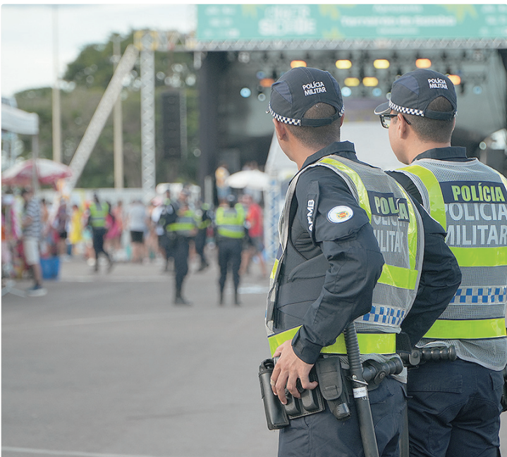
Durante o período carnavalesco, PMs estarão em todos os circuitos foliões