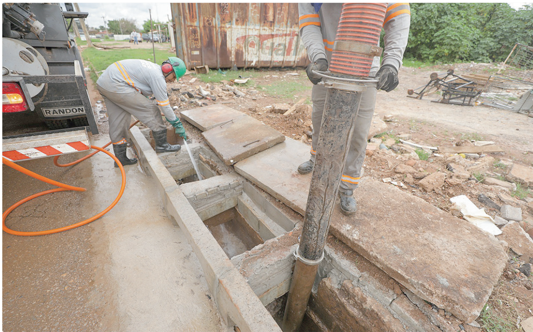
Demanda que pedia solução contra inundações era aguardada pela população da Estrutural por mais de 30 anos

LEVANTAMENTO TOPOGRÁFICO A Novacap foi responsável pela terraplanagem e pelo levantamento topográfico, rua por rua. Foram instaladas as redes elétrica, de água e esgoto, além de milhares de bloquetes para a pavimentação. O serviço garantiu o nivelamento adequado