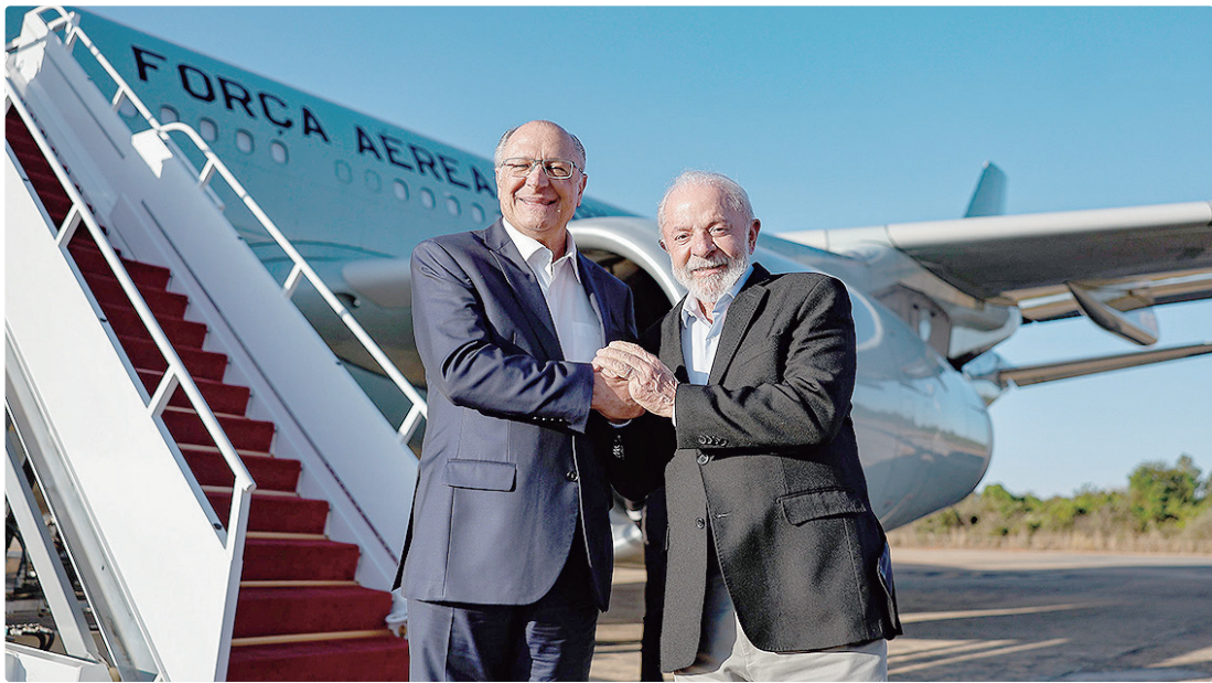
Segundo João Campos, é importante para o PSB a manutenção do vice-presidente Geraldo Alckmin na chapa com Lula

POSSIBILIDADES NO MDB No momento, Lula consulta o MDB sobre a possibilidade de indicar um nome da sigla para a vaga de vice-presidente na chapa à reeleição. Com isso, Alckmin poderia deixar o posto no alto escalão do governo.