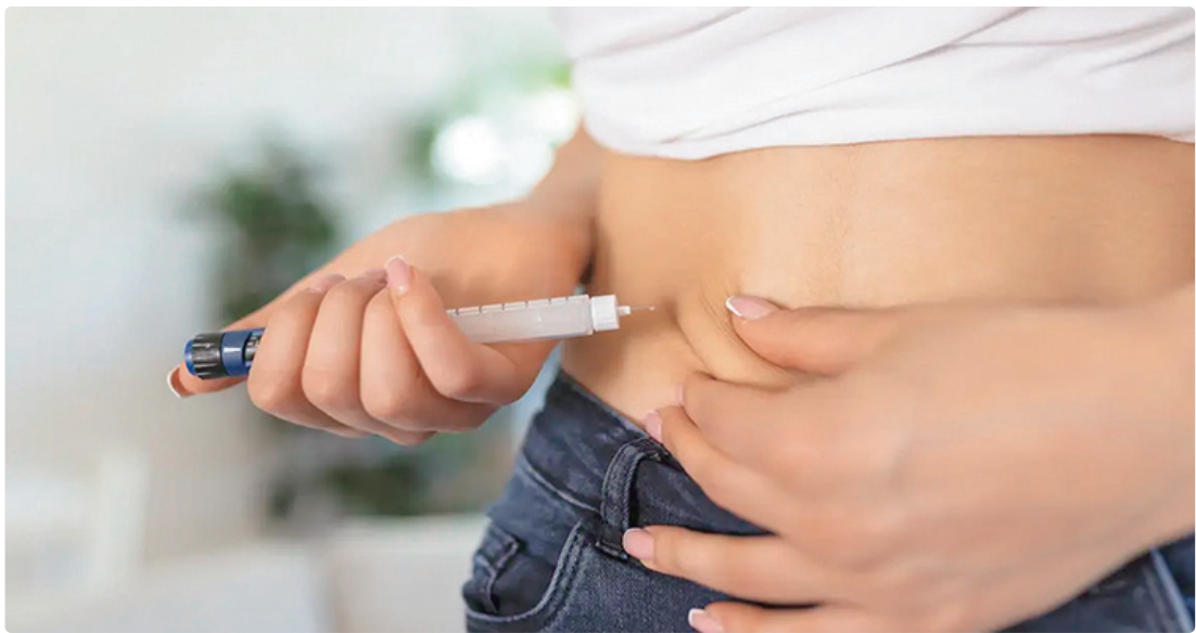
Dados da Anvisa indicam que, entre 2020 e 7 de dezembro de 2025, 145 notificações de suspeitas de eventos adversos

“Apesar do alerta, não houve mudança na relação de risco e efi-