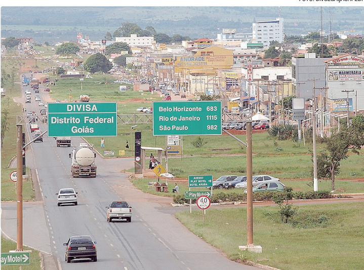
Maiores densidades estão em Águas Lindas, Luziânia e Valparaíso de Goiás