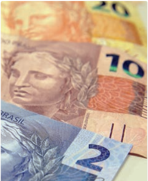
Bancos anteciparão aportes e elevarão valor das contribuições

Outra alternativa em discussão no setor é a destinação de parte dos recursos do compulsório de depósitos à vista, reservas que os bancos são obrigados a manter no Banco Central (BC), para reforçar o caixa do FGC. A proposta, no entanto, depende de autorização do BC, que ainda não se manifestou sobre o tema. Até o momento, o FGC desembolsou cerca de R$ 36 bilhões de um total superior a R$ 40 bilhões previstos para ressarcir os credores do Banco Master. O fundo ainda não iniciou os pagamentos relacionados ao Will Bank, que integrava o conglomerado e teve a liquidação decretada posteriormente. Nesse caso, a estimativa é de aproximadamente R$ 6,3 bilhões em garantias.