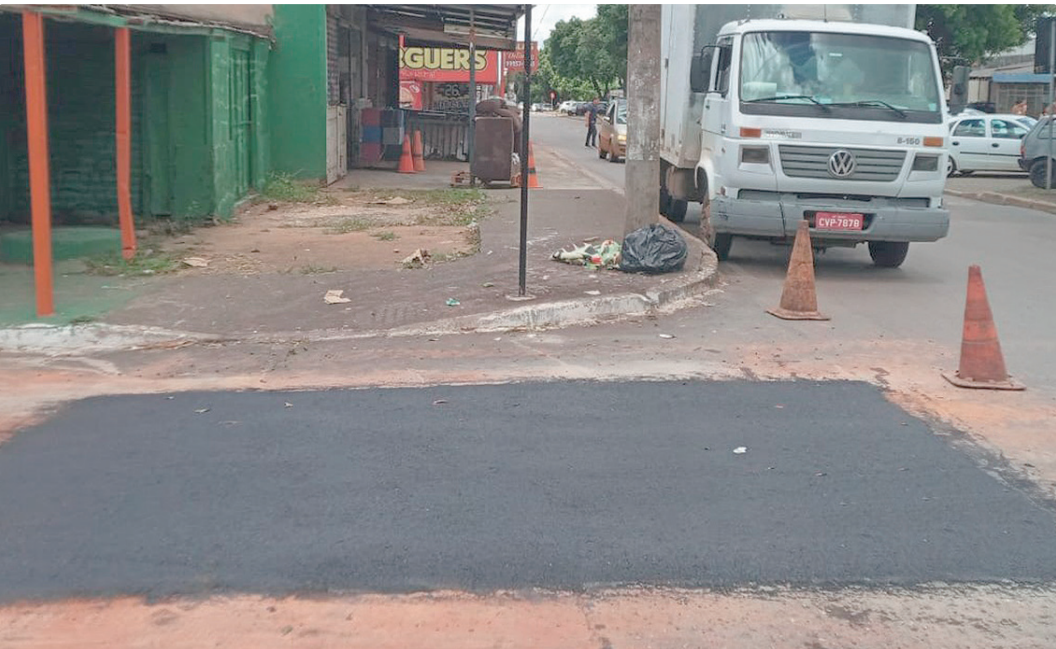
A ação contou com equipes especializadas da Novacap e caminhão rolo compressor de cerca de 10 toneladas

CONCESSIONÁRIAS Antes da interligação, a água da chuva se acumulava nas vias e atingia estabelecimentos, especialmente concessionárias e revendedoras de veículos. Com a nova galeria, a expectativa é reduzir riscos de novos prejuízos e melhorar as condições de funcionamento da área.