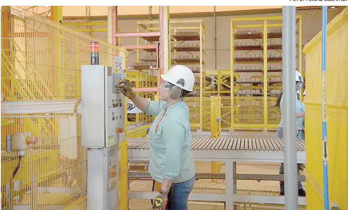
Impacto com o custo da redução atingiria menos de 1% em grandes setores

Os custos de uma eventual redução da jornada de trabalho para 40 horas semanais seriam similares aos impactos observados em reajustes históricos do salário mínimo no Brasil, o que indica uma capacidade de absorção da medida pelo mercado de trabalho. A conclusão é de estudo publicado nesta terça-feira (10) pelo Instituto de Pesquisa Econômica Aplicada (Ipea), que analisa os efeitos econômicos da eventual redução da jornada atualmente predominante de 44 horas semanais, associada à escala 6x1, que estabelece um dia de descanso a cada seis trabalhos. A redução da jornada de trabalho teria um custo de menos de 1% em grandes setores, como indústria e comércio, mas alguns setores de serviços que dependem de mais mão de obra podem precisar de políticas públicas, avalia o Ipea.