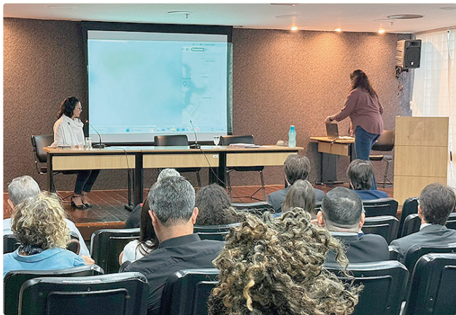
A reunião teve como foco a apresentação técnica do projeto

missa central a criação de grandes áreas livres. Esses vazios garantem a visibilidade do hotel histórico, preservam sua hierarquia no conjunto e mantêm a leitura aberta do gramado de chegada e da relação com o entorno do Palácio da Alvorada. O projeto propõe a implantação de um novo edifício em forma de “L”, posicionado de maneira periférica no terreno. A solução busca proteger as visadas internas do Brasília Palace e assegurar, a partir de seus pilotis, a vista para o Lago Paranoá. Também foi ressaltado o afastamento superior a 20 metros entre a nova construção e o hotel existente, além do respeito ao limite máximo de altura de 12 metros, conforme as diretrizes do Plano de Preservação do Conjunto Urbanístico de Brasília (Ppclub).