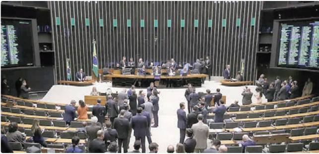
Proposta pelo governo, medida agora vai para análise do Senado