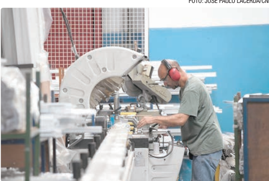
Para a CNI, o ambiente de juros elevados – com a Selic a 15% ao ano – impacta tanto o crédito quanto as expectativas dos empresários

O Índice de Confiança do Empresário Industrial (Icei) caiu 0,3 ponto em fevereiro, passando de 48,5 para 48,2 pontos, segundo levantamento divulgado nesta quinta-feira (12) pela Confederação Nacional da Indústria (CNI). Com o resultado, o setor completa 14 meses consecutivos abaixo da linha de 50 pontos, que separa confiança da falta de confiança. Em janeiro, o indicador havia subido 0,5 ponto, aproximando-se do nível de neutralidade. O novo recuo ocorre após o Banco Central fixar a taxa básica de juros, a Selic, em 15% ao ano, nível que mantém o Brasil entre os países com maiores juros reais do mundo. Para a CNI, o ambiente de juros elevados impacta tanto o crédito quanto as expectativas dos empresários. “O patamar elevado das taxas de juros afeta a atividade industrial de