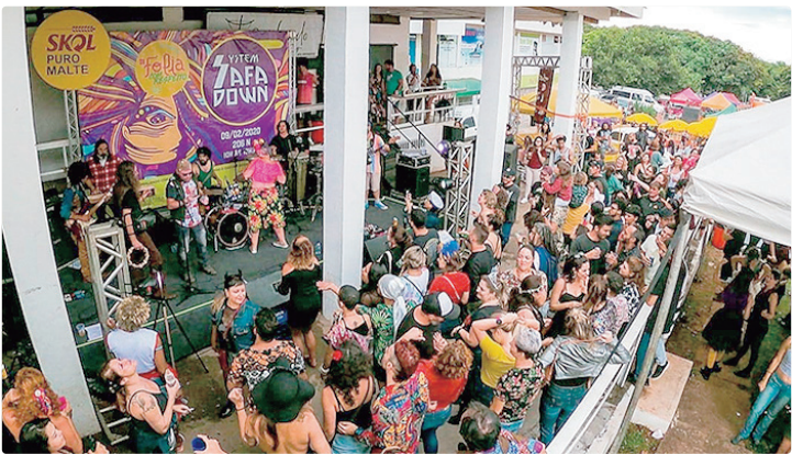
Concentração será no domingo (15), na saída do metrô da Galeria dos Estados

Guitarras distorcidas, fantasias sem regra, crítica afiada e muito carnaval fora da caixinha tomam conta do Setor Carnavalesco Sul quando o bloco System Safadown completa cinco anos de história no carnaval de rua de Brasília, em um encontro marcado para o dia 15 de fevereiro, com concentração a partir das 15h, na saída do metrô da Galeria dos Estados. A proposta transforma a rua