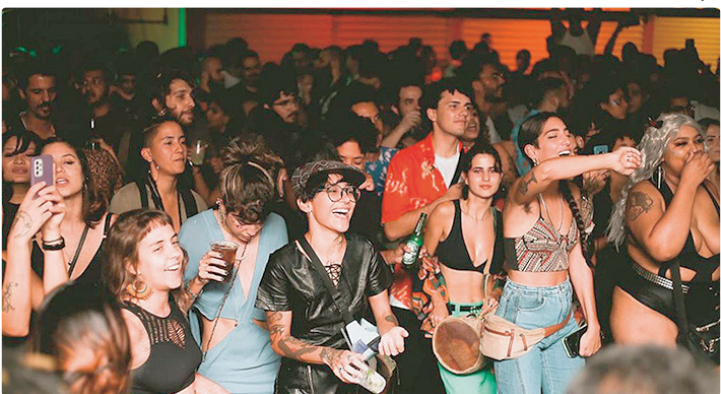
Cerca de 50 artistas vão animar o CarnaConic, de 13 a 17 de fevereiro