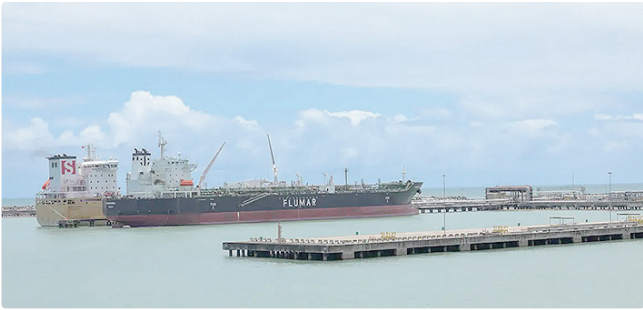
Colegiado aplica medidas antidumping contra China em dois setores

MEDIDAS ANTIDUMPING Na mesma reunião, o comitê aprovou a aplicação de três novos direitos antidumping, com o objetivo de proteger a indústria nacional contra importações consideradas desleais. No setor de dispositivos médicos, foi determinada a aplicação de direito antidumping por cinco anos sobre agulhas hipodérmicas originárias da China. Já na área siderúrgica, o Gecex aprovou medidas contra laminados planos a frio e laminados planos revestidos, também provenientes da China. As medidas têm como objetivo neutralizar prejuízos causados por produtos importados a preços abaixo do valor de mercado. O Ministério do Desenvolvimento, Indústria, Comércio e Serviços (Mdic) não detalhou os produtos com alíquotas zeras nem as medidas antidumping. Apenas informou que os itens serão conhecidos após a publicação no Diário Oficial da União, prevista para ocorrer nos próximos dias.