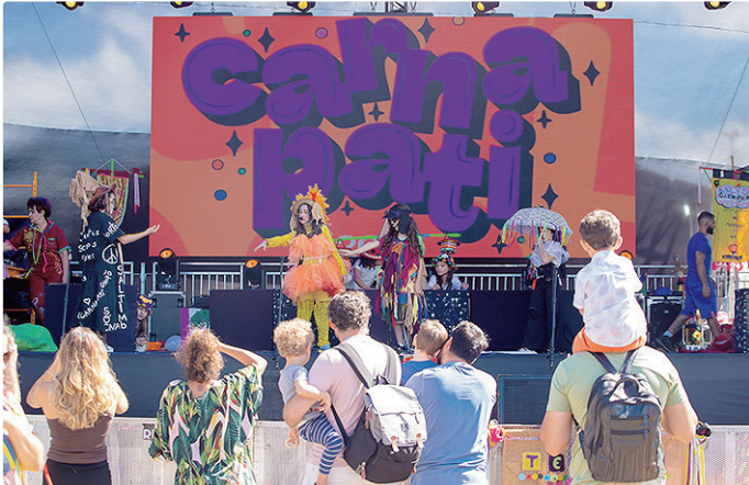
Serão dois dias de atividades para toda a família no Setor Comercial Sul

ção ganha novos contornos e se expande em três frentes. O Festival Ludicidade, voltado especialmente para o público infantil, será realizado nos dias 14 e 15 de fevereiro, das 8h às 12h, no Setor Comercial Sul, ao lado da Estação Galeria do Metrô, com uma programação de teatro e atividades artísticas para os pequenos. O espetáculo “Os Saltimbancos” também integra o festival, com apresentação no domingo (15), às 9h da manhã. Ainda no domingo, o Carnapati acontece das 14h às 18h, no mesmo local, com atrações diversas e, ainda com outra apresentação do espetáculo “Os Saltimbancos”, às 17h. No mesmo dia, das 14h às 15h, ocorre o Patinhas na Folia, com desfile de pets e ações voltadas à causa animal, incluindo a participação de ONGs de proteção e estabelecimentos parceiros. Com apoio da Secretaria de Cultura do Distrito Federal, do FAC e do Governo do Distrito Federal, o Carnapati 2026 reafirma o compromisso do Espaço Cultural Mapati com a formação cultural, a diversidade, a acessibilidade e a ocupação democrática dos espaços públicos, celebrando 35 anos de história com um carnaval pensado para a criança e toda a família.