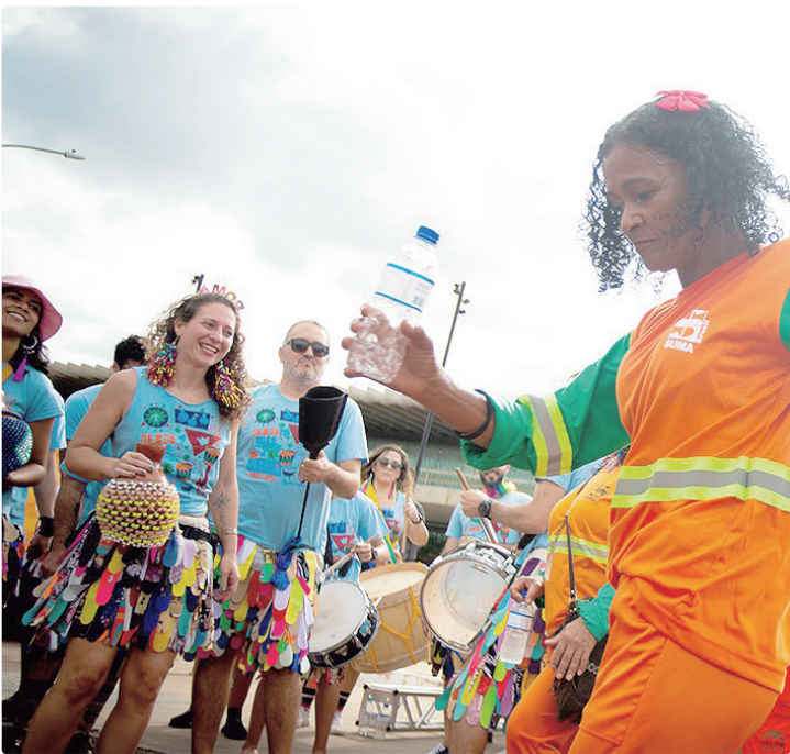
Bloco Vassourinhas terá a valiosa parceria do SLU, com a Ala dos Garis

TERRITÓRIOS Deste sábado (14) a terça-feira (17), o DF Folia 2026 contará ainda com três territórios culturais, instalações pensadas para ampliar o acesso do público e garantir uma festa diversa, organizada e segura. Na plataforma Car-