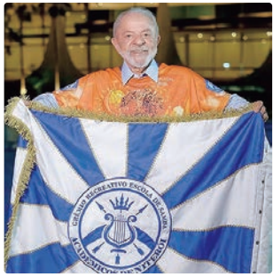
Lula será homenageado pela Acadêmicos de Niterói

Depois, ainda no sábado, Lula segue para Salvador para acompanhar a saída do bloco Trio da Cultura, da ministra Margareth Menezes. A cantora puxará pelo terceiro ano seguido o desfile no circuito Barra-On-dina. A edição deste ano terá as participações das cantoras Josyara e Luedji Luna.