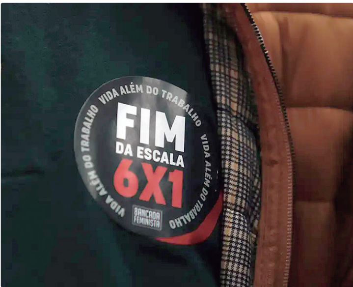
Pesquisa aponta que 84% acreditam que o trabalhador deveria ter duas folgas