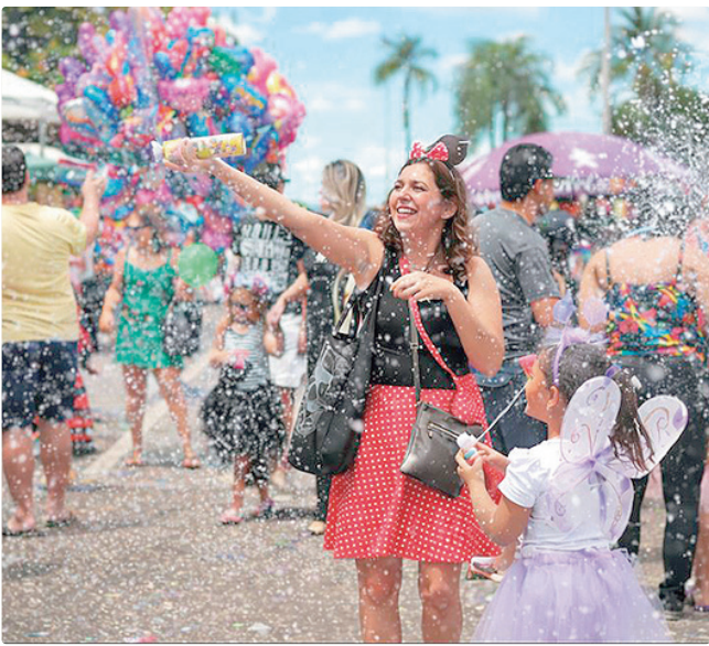
Bloco Infantil Literário Arniqueira 2026 reunirá cultura e diversão