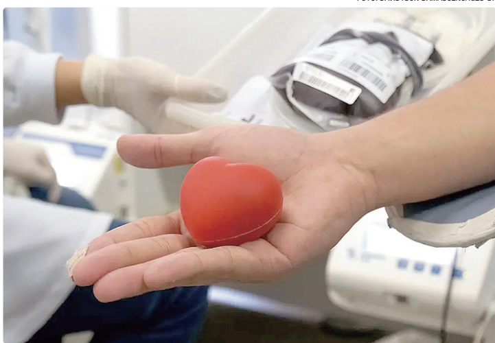
Podem doar sangue pessoas entre 16 e 69 anos e pesar pelo menos 50 kg

Com a proximidade do carnaval, o Ministério da Saúde reforçou a importância da doação voluntária de sangue - inclusive antes do início da folia começar porque, historicamente, os estoques costumam ficar reduzidos e o período figura como um dos mais críticos para os hemocentros. Em nota, o ministério destacou que, para ser um doador, é necessário ter entre 16 e 69 anos (menores de idade precisam de autorização); pesar pelo menos 50 quilos e estar bem de saúde. Acrescentou que “o sangue é essencial para os atendimentos de sangramentos agudos em casos de urgência e emergência, realização de cirurgias de grande