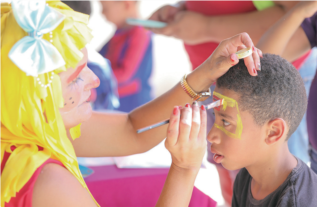
Programação contempla famílias e crianças, com blocos infantis como Baratinha, Eminha Kids e Criem

PARQUE ANA LÍDIA No domingo (15), das 13h às 20h, será realizado o Bloco da Baratinha, no estacionamento do Parque Ana Lúcia, no Parque da Cidade. Em razão do evento, no sábado (14), a partir das 23h59, equipes do Detran-DF fecharão o estacionamento e implantarão sinalização viária nas imediações. O trecho isolado na via S2 facilitará a circulação de pedestres. Aos condutores, a orientação é que utilizem o Estacionamento 13 do Parque da Cidade.