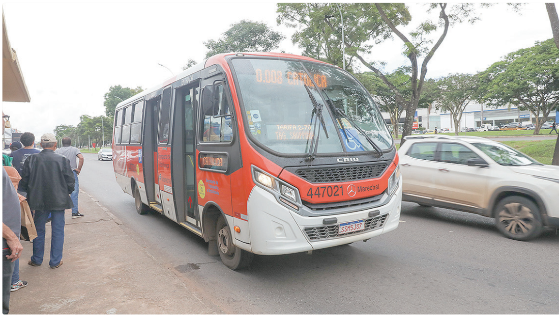
Os zebrinhas circulam em 17 regiões administrativas e atendem quase 21 mil pessoas por dia no Distrito Federal