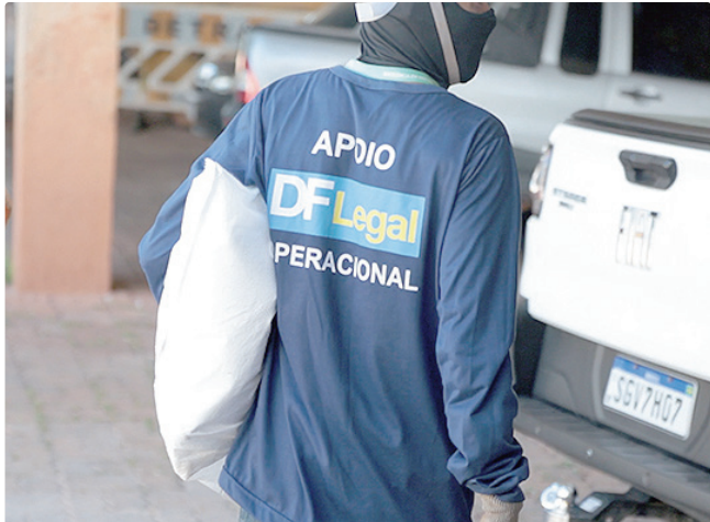
Abordagem está prevista para passar por 17 pontos do Plano Piloto

Após todo o atendimento, a DF Legal fará o desmonte das estruturas das pessoas em situação de rua e o transporte dos pertences ao local regular indicado pelo ocupante. Em último caso, o governo levará os objetos pessoais ao depósito da pasta, no SIA Trecho 04, Lotes 1380/1420, para retirada em até 60 dias, sem qualquer custo para o responsável. No decorrer de toda a semana, as secretarias realizaram abordagens sociais e atendimentos prévios nos locais, mapeando o público que será atendido e suas demandas.