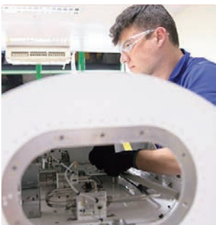
Programa quer fortalecer o ensino tecnológico no país

Com redução das taxas de juros anuais, os entes federativos economizam e podem fazer investimentos financeiros para expandir as vagas na educação profissional técnica de nível médio. O dinheiro também deve servir para melhorar a infraestrutura dos cursos. Os 22 estados brasileiros participantes do Propag são: Acre, Alagoas, Amazonas, Amapá, Bahia, Ceará, Espírito Santo, Goiás, Maranhão, Minas Gerais, Mato Grosso do Sul, Paraíba, Pernambuco, Piauí, Rio de Janeiro, Rio Grande do Norte, Rondônia, Roraima, Rio Grande do Sul, Sergipe, São Paulo, Tocantins.