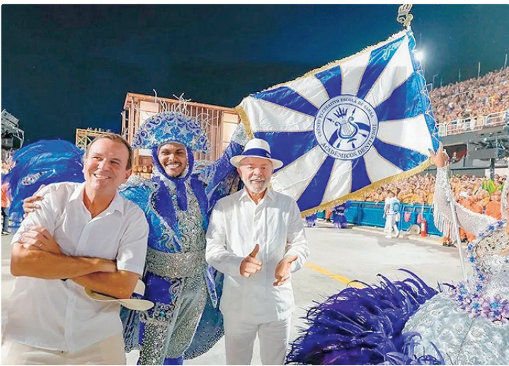
Todos os ministros do TSE alertaram para o potencial ato ilegal do desfile

Já nesta segunda-feira (16), após o desfile, o Partido Novo anunciou que pedirá a inelegibilidade do presidente assim que ocorrer o registro formal