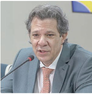
Petistas consideram “certa” a candidatura de Haddad em SP

A lista de nomes cotados para o Senado também inclui Simone Tebet, que possivelmente migraria do MDB para o PSB para participar da disputa; e Marina Silva, que, como revelou o blog, conversa sobre a possibilidade de se filiar novamente ao PT. Até este domingo, a ministra do Meio Ambiente ainda esperava uma conversa com Lula para selar seu destino.