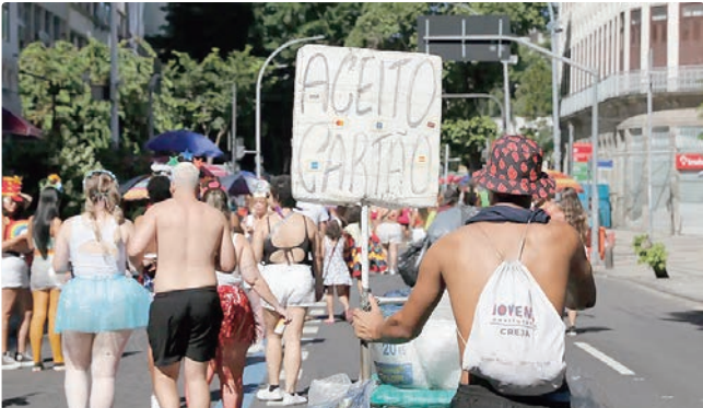
Mais de 56 mil se formalizaram como microempreendedor em 2025

Ainda segundo o Sebrae, na Bahia, os pequenos negócios são quase a totalidade dos segmentos de bares, restaurantes e alimentação fora do lar (98,6%) e de transporte e receptivo turístico (97%). Eles também representam 84,1% dos hotéis e meios de hospedagem. A expectativa é de que mais de 1,2 milhão de turistas cheguem à capital soteropolitana e movimentem mais de R$ 1,8 bilhão.