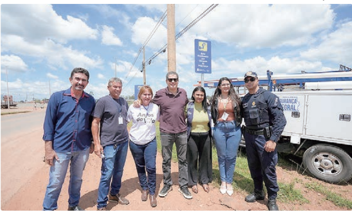
Videomonitoramento visa à construção de ambientes mais seguros

A Região Administrativa de Água Quente é a 35ª a receber o Programa de Videomonitoramento Urbano e Rural (PVU/PVR), da Secretaria de Segurança Pública do DF (SSP-DF), consolidando, assim, a presença da tecnologia em todas as regiões administrativas do Distrito Federal. Com a instalação das novas câmeras, o sistema passa a contar com 1.350 equipamentos distribuídos estrategicamente em todo o território do DF, fortalecendo o monitoramento integrado e ampliando a capacidade de prevenção e resposta das forças de segurança. A região recebeu a placa de monitoramento nesta sexta-feira (13). Criado em 2013, o PVU/PVR é uma das principais estratégias estruturantes da SSP-DF para o fortalecimento da política de Segurança Integral. O programa tem como foco a construção de ambientes mais seguros, pro-