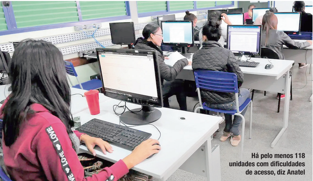
Há pelo menos 118 unidades com dificuldades de acesso, diz Anatel

empresas não quiserem cumprir essa obrigação, elas podem pedir para converter essa obrigação em multa e aí abrem mão de um desconto previsto (5%). O conselheiro da Anatel acrescenta que existem áreas isoladas que estão em campus universitário, mas sem acesso à rede. “Com essa medida, a Anatel busca proporcionar a conexão também dessas unidades mais afastadas ou desses espaços que, por algum motivo, ainda não estejam participando dessa rede da RNP com internet de alta velocidade e serviços de integração acadêmica”, afirmou Peiranti, que foi autor da proposta aprovada por todos os conselheiros.