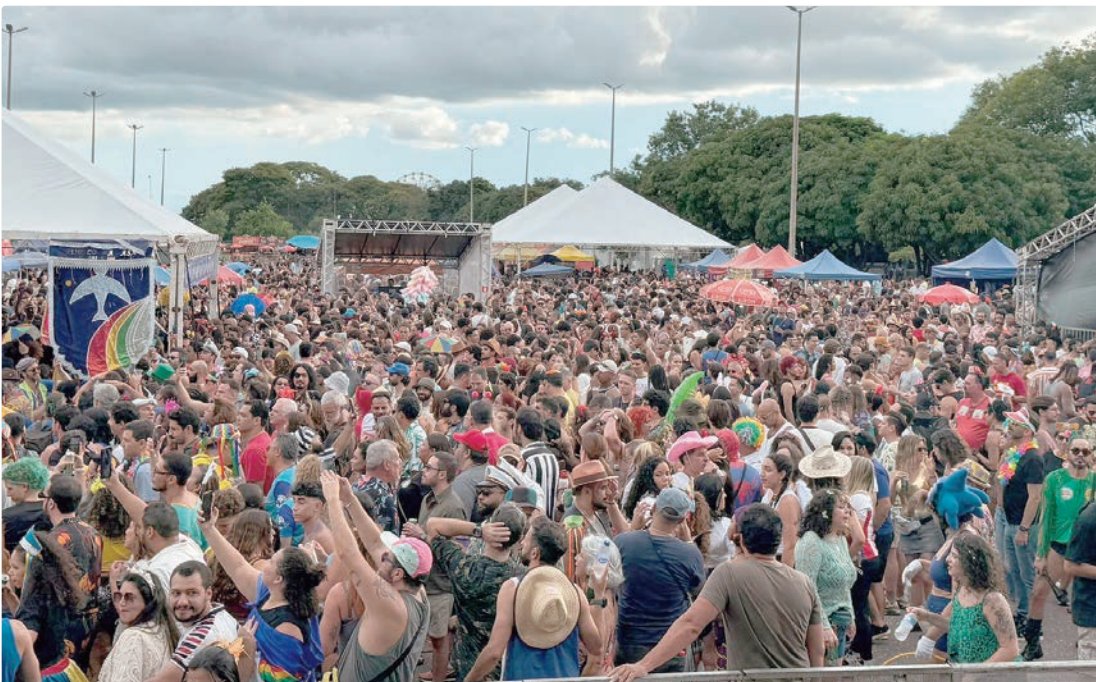
Festividades carnavalescas levaram diversão a 18 regiões administrativas, com programação organizada e clima seguro

Ainda segundo a pasta, o público estimado de mais de 1,5 milhão de pessoas movimentou cerca de R$ 75 milhões no período – considerando-se um gasto médio de R$ 50 por pessoa. “Em outra ponta, para cada R$ 1 investido em cultura, há um retorno estimado de R$ 3 para a economia — o que representa mais de R$ 30 milhões. Isso consolida o DF como local que produz cultura de qualidade, promove um Carnaval democrático, acessí-