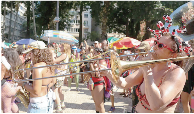
Média superou ano passado, segundo sindicato de empresas do setor

Pelo menos 118 unidades de universidades públicas e institutos federais, com dificuldades de conectividade à internet, poderão ser beneficiadas por uma decisão do Conselho Diretor da Agência Nacional de Telecomunicações (Anatel).