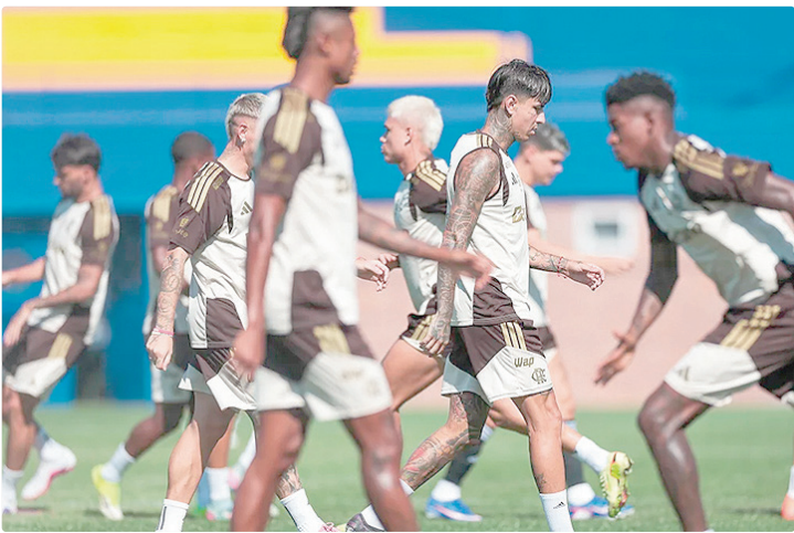
Atletas do Flamengo em último treino antes do duelo contra o Lanús

O Flamengo já conquistou o título em 2020, quando superou o Independiente Del Valle. Em 2023, os equatorianos “deram o troco” e levantaram a taça diante do clube carioca. O Lanús só disputou a Recopa Sul-Americana uma vez. Os argentinos foram vice-campeões em 2014, quando o Atlético-MG, campeão da Liber-