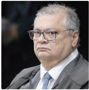
Decisão de Flávio Dino será analisada pelo plenário do STF

A decisão foi monocrática, ou seja, tomada por ele sem a participação dos demais ministros. Ela será analisada pelos demais ministros do Supremo no plenário, em sessão marcada para a próxima quarta-feira (25).