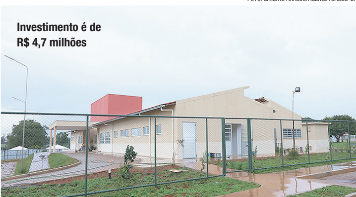
Investimento é de R$ 4,7 milhões

O Capsi é voltado ao atendimento de crianças e adolescentes de até 18 anos incompletos