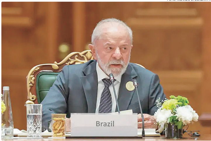
O evento dá continuidade ao processo iniciado no Reino Unido em 2023

No caso da revolução digital e da IA, Lula diz que as tecnologias “impactam positivamente a produtividade industrial, os serviços públicos, a medicina, a segurança alimentar e energética, e a forma como conectamos uns com os outros”. “Mas também podem fomentar práticas extremamente nefastas, como o emprego de armas autônomas, discurso de ódio, desinformação, pornografia infantil, feminicídio, violência contra mulheres e meninas e precarização do trabalho. Conteúdos falsos manipulados por inteligência artificial distor-