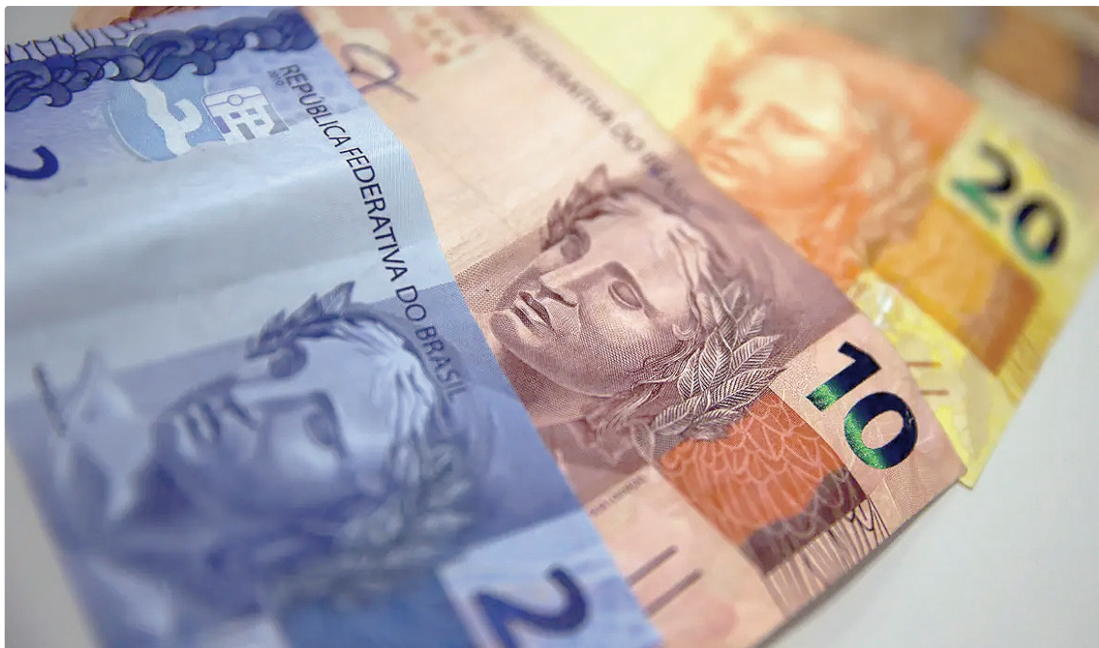
A estimativa do mercado financeiro para a taxa básica de juro, a Selic, é que ela feche 2026 a 12,25% ao ano

Em janeiro, a alta dos preços da conta de luz e da gasolina fizeram a inflação oficial do mês fechar em 0,33%, mesmo patamar de dezem-