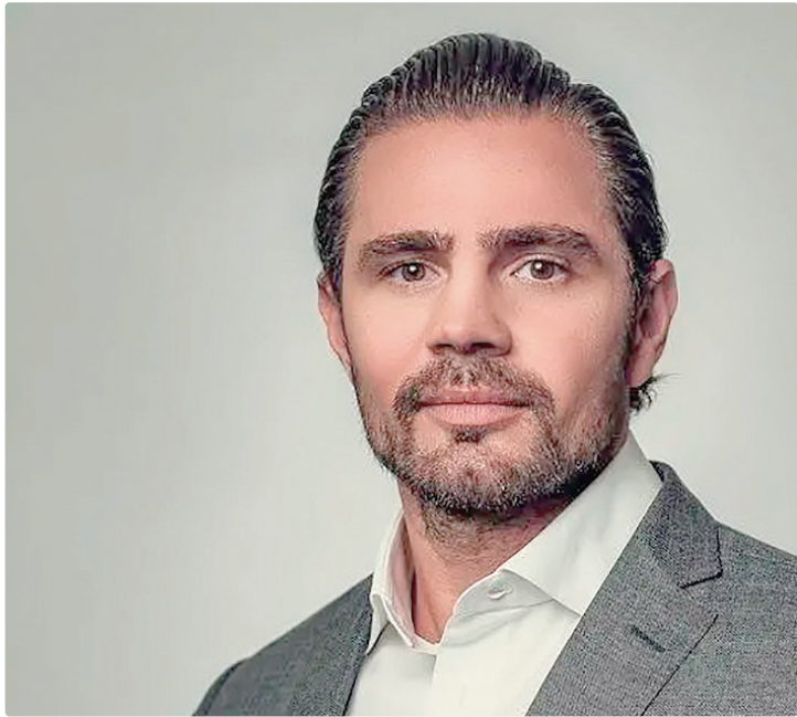
Parte dos integrantes defende oitiva tenha foco restrito à fraude do INSS

A sessão da próxima segunda-feira deve funcionar como termômetro sobre o rumo da comissão e o eventual aprofundamento das investigações envolvendo agentes do mercado financeiro.