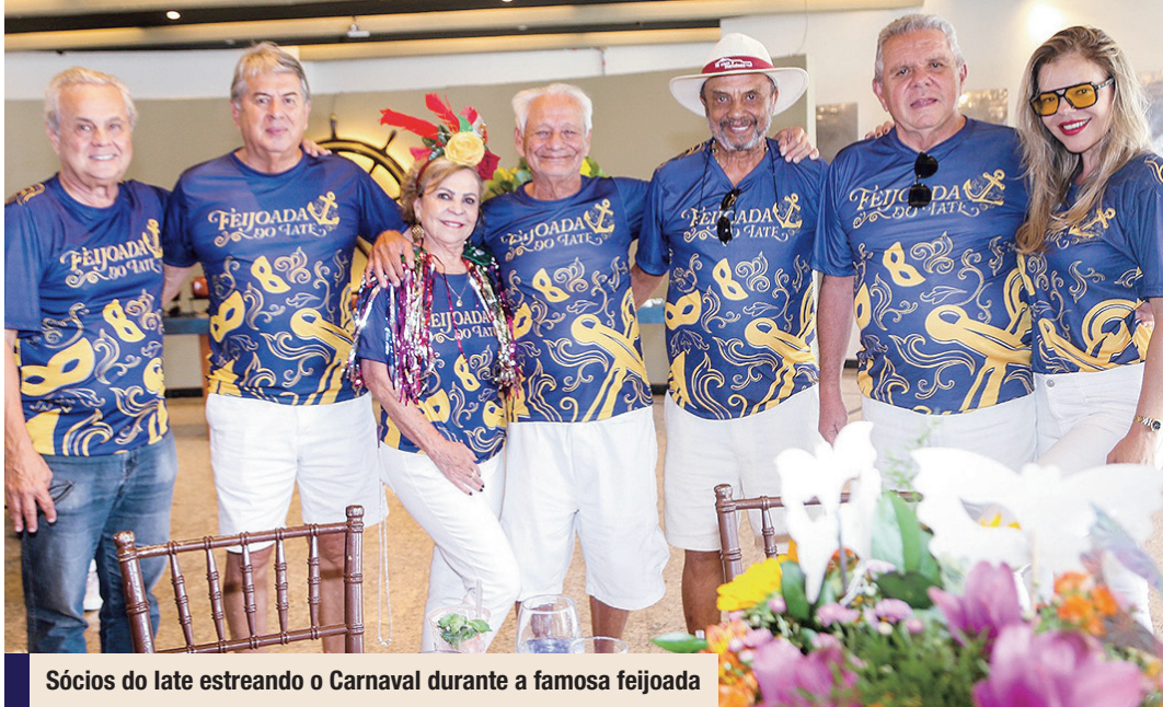
Sócios do Iate estreando o Carnaval durante a famosa feijoada