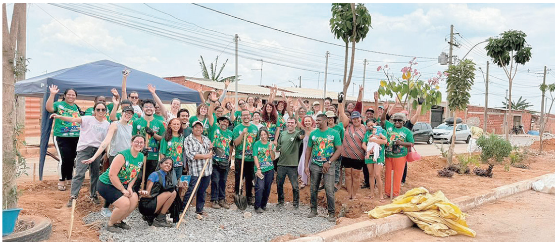
Iniciativa utiliza soluções naturais para fortalecer a adaptação climática em território periférico do Distrito Federal