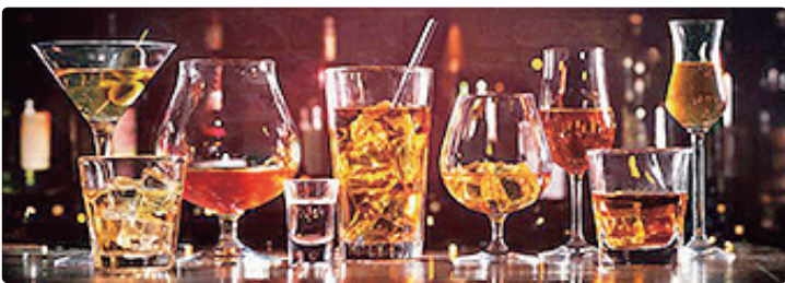
Segundo especialistas, não existe quantidade segura para injeção de álcool

Outro ponto de atenção é a associação entre transtornos psiquiátricos, compulsão alimentar e consumo de álcool, especialmente após cirurgia bariátrica. “Se a compulsão não for tratada, o paciente pode substituir a comida pelo álcool após a cirurgia. Isso