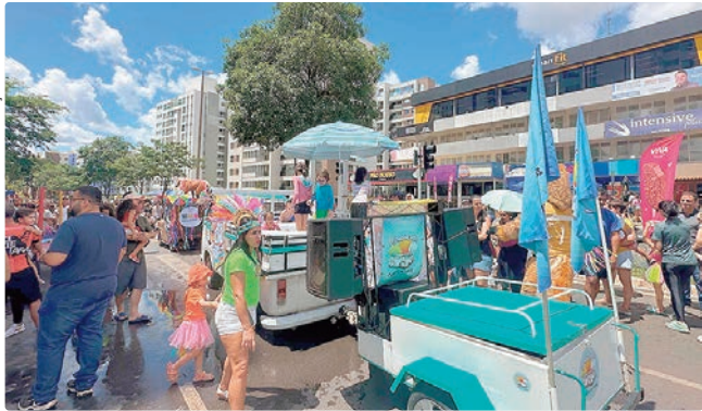
Evento terá programação diversificada e totalmente gratuita

Entre as atrações culturais confirmadas estão o Carnalobo e o Bloquinho do Lobinho, que levarão música ao vivo e atividades voltadas para diferentes faixas etárias. Criado no próprio Guará, o Carnalobo retorna com repertório que valoriza ritmos tradicionais do carnaval brasileiro. Já o Bloquinho do Lobinho oferece programação dedicada às crianças, com apresentações culturais e atividades lúdicas.