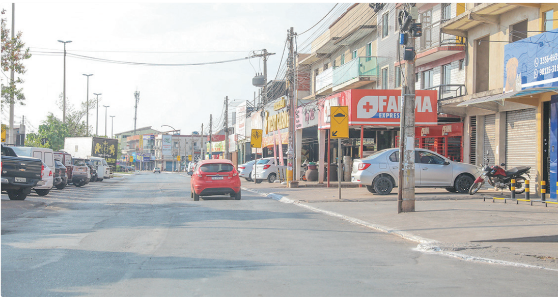
A medida do GDF leva em consideração o perfil socioeconômico dos moradores e a metragem de interesse social

O governador Ibaneis Rocha destacou que o edital publicado para aquisição dos terrenos em Arniqueira foi amplamente construído em diálogo com a administração regional e lideranças locais. Segundo ele, o documento prevê condições facilitadas para os moradores, com redução de preços ao máximo possível, ampliação do prazo de parcelamento e diminuição das taxas de juros. “O objetivo é facilitar a vida de quem deseja regularizar sua área de moradia