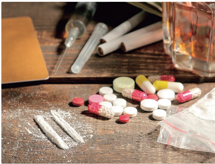
Álcool, drogas e opioides viciam porque atuam diretamente no sistema nervoso

Segundo o médico, além dos prejuízos diretos ao organismo, o álcool também aumenta o risco de comportamentos perigosos. “Em estado de alteração, a pessoa pode ficar mais agressiva,