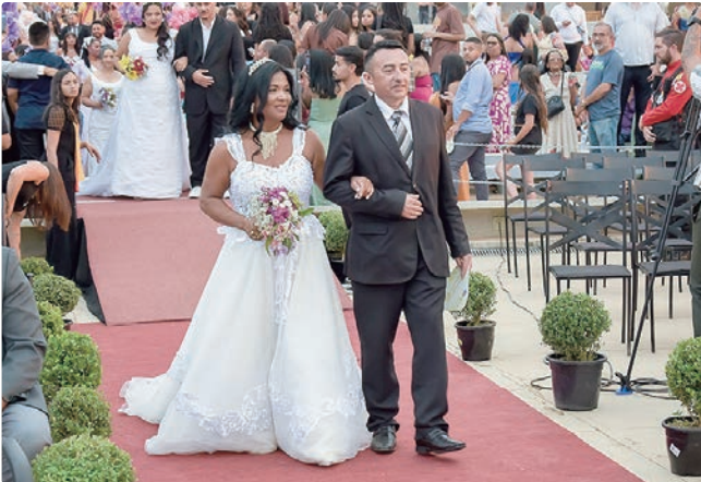
Evento é promovido pela Secretaria de Justiça e Cidadania do DF

Os casais interessados ainda podem participar desta primeira edição de 2026. As inscrições podem ser feitas presencialmente nas Praças dos Direitos da Ceilândia (QNN 13) e do Itapoã (Quadra 203, Del Lago II), além da Estação Cidadania do Recanto das Emas (Quadra 113, Lote 09). Também é possível se inscrever durante as edições do programa GDF Mais Perto do Cidadão, realizadas quinzenalmente em diferentes regiões administrativas.