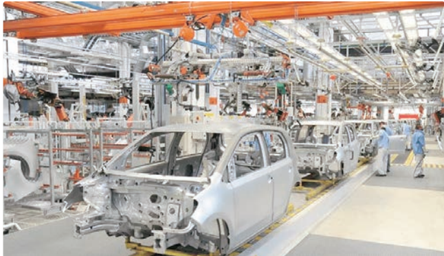
Financiamento de modelos novos em janeiro somou 204 mil unidades

Segundo a B3, a redução dos preços dos veículos novos perdeu força em janeiro, o que mostra um início de ano mais estável para o setor.