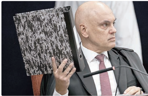
Votaram pelo recebimento da denúncia os ministros Alexandre de Moraes (foto), Flávio Dino, Cristiano Zanin e Cármen Lúcia

Com a formalização da ação penal, Eduardo Bolsonaro passa a responder formalmente perante o STF. A decisão final dependerá da instrução do processo e do julgamento da 1ª Turma, etapa que poderá definir não apenas sua situação criminal, mas também seu futuro político. Eduardo teve o mandato cassado pela Câmara em dezembro por ter acumulado mais de um terço de faltas sem justificativa ao longo do ano.