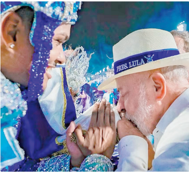
Enredo: “Do alto do mulungu surge a esperança: Lula, o operário do Brasil”

Em 12 de fevereiro, o TSE rejeitou as duas primeiras liminares considerando que não era possível deferir o pedido antes dos fatos acontecerem. Mas, ponderou que isso não significa que, no futuro, a Corte não possa vir a analisar a conduta dos citados. Ainda não há um prazo para jul-