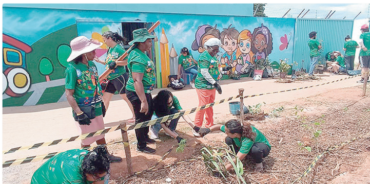
Projeto da UnB beneficiou cerca de 5 mil pessoas, direta e indiretamente

A formação foi um eixo central da iniciativa. Moradores, lideranças comunitárias e estudantes participaram do processo, com certificação institucional, ampliando as capacidades locais para manutenção e monitoramento das soluções implantadas. Entre os principais resultados alcançados estão: