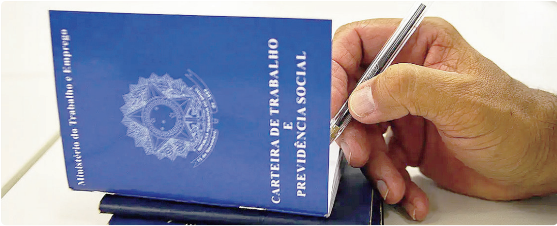
Maiores índices de desocupação estão em Pernambuco (8,8%), Amapá (8,4%), Alagoas, Bahia e Piauí – todos com 8%

MÍNIMAS HISTÓRICAS As unidades da federação (UF) que alcançaram a taxa