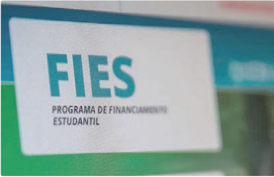
Consulta deve ser feita no Portal Único de Acesso ao Ensino Superior

Em 2026, o total de vagas do Fies a serem ofertadas é 112.168. As demais vagas e aquelas eventualmente não ocupadas nesta edição serão ofertadas na edição do segundo semestre.