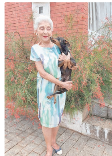
Com seu cachorrinho Dino