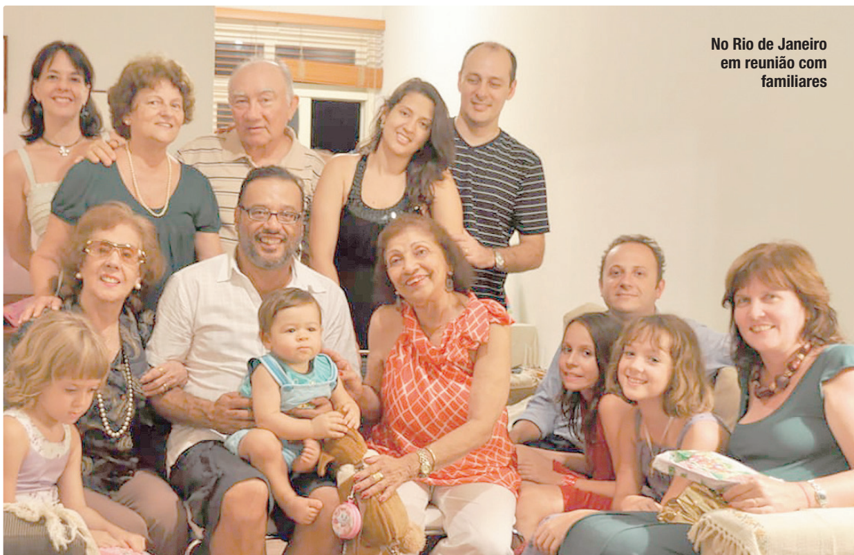
No Rio de Janeiro em reunião com familiares