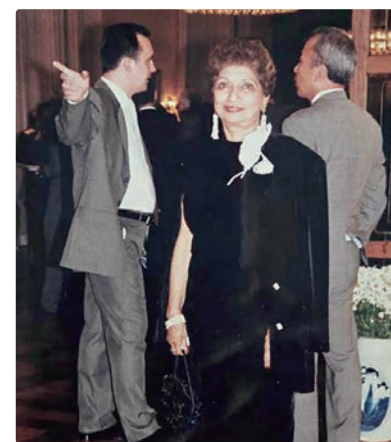
Elegante para sua posse na presidência do CIB