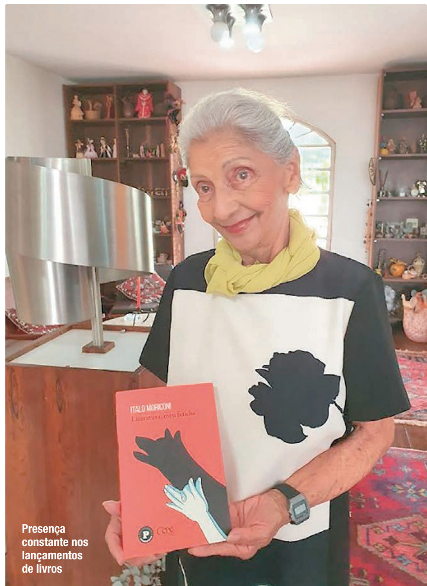
Presença constante nos lançamentos de livros