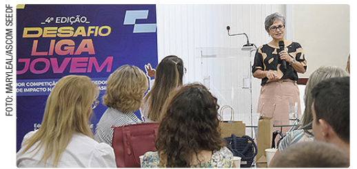
Competição incentiva alunos da rede pública a desenvolver soluções e premia com viagem internacional

A equipe vencedora ganhará uma viagem internacional, prevista para o 1º semestre de 2027. O 2º será contemplado com um notebook, e o 3º, com um celular.