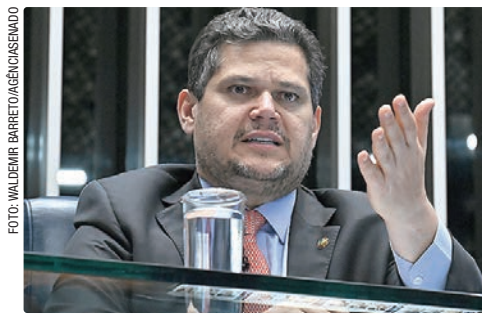
Davi Alcolumbre, presidente do Congresso Nacional, confirmou a data em nota divulgada na noite de quinta (9)

Além de Bolsonaro, tais mudanças poderão beneficiar réus como os militares Almir Garnier, ex-comandante da Marinha; Paulo Sérgio Nogueira, ex-ministro da Defesa; Walter Braga Netto, ex-ministro da Casa Civil; e Augusto Heleno, ex-chefe do Gabinete de Segurança Institucional (GSI). O projeto de lei também reduziria o tempo de progressão de pena para alguns criminosos comuns.