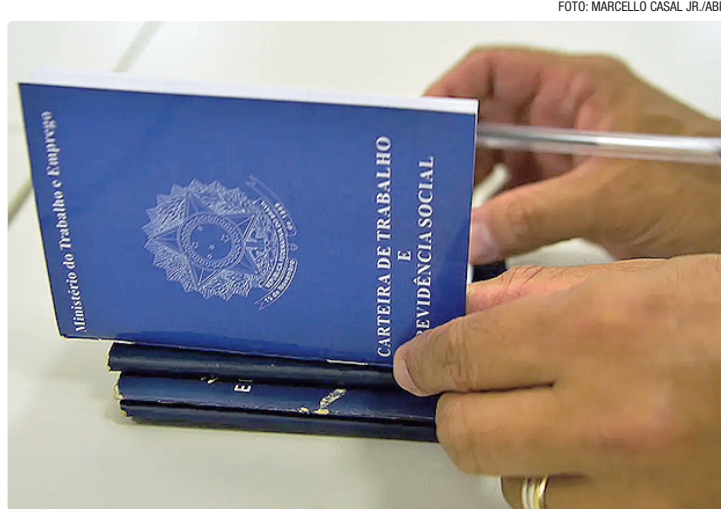
Pesquisa da CNI mostra que CLT lidera entre jovens, com 41,4% da preferência

De acordo com o estudo, o acesso a direitos trabalhistas e à Previdência Social continua