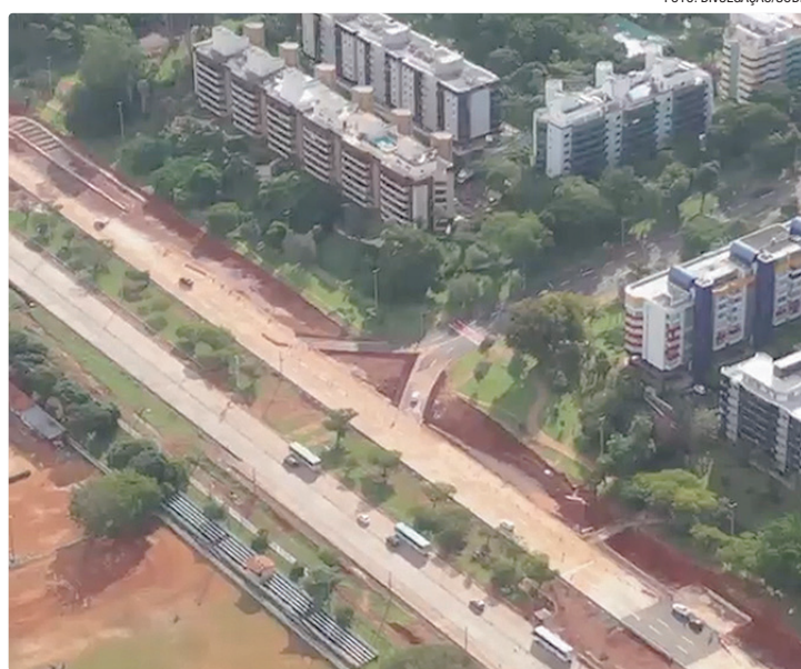
Enquanto as etapas da obra são concluídas, os trechos vão sendo abertos

No trecho 4, ao longo da faixa reversa, haverá uma alça que permite o acesso ao Sudoeste pela 4ª Avenida. A faixa reversa atualmente em operação seguirá funcionando da mesma forma, sem alterações significativas neste momento.