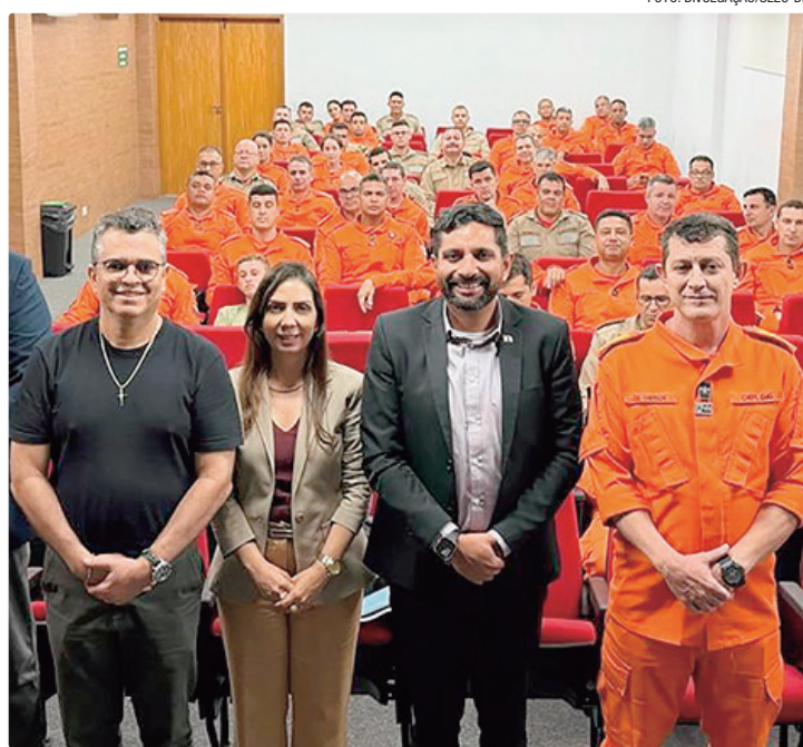
Programa foi lançado em Goiânia, como promoção da saúde física e mental

O lançamento da política ocorreu durante seminário realizado em Goiânia (GO) nos dias 7 e 8 deste mês. Pelo menos 100 bombeiros militares participaram dos encontros que resultaram em um importante avanço institucional na promoção do bem-estar e na