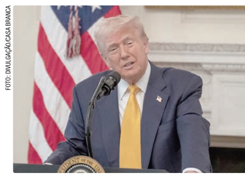
Para diversos estados e pequenas empresas, a medida de Trump contorna uma decisão da Suprema Corte americana

Na decisão, o tribunal concluiu que a Lei de Poderes Econômicos de Emergência Internacional não concede ao presidente a autoridade que ele alegava ter.