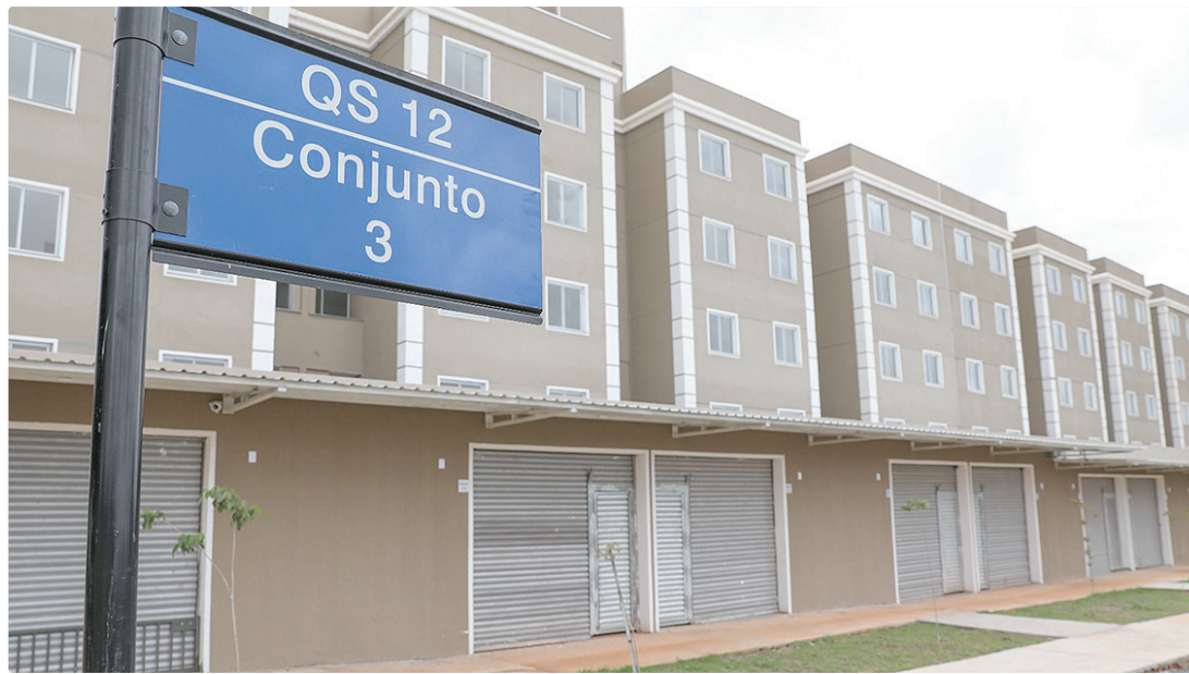
Previsão da Codhab é de que 100 mil moradores do DF estarão com suas casas próprias nos próximos cinco anos

O condomínio para onde ele vai se mudar dispõe de 96 apartamentos, e cada unidade abriga, em média, de três a quatro pessoas. Os últimos ajustes dependem da ligação do gás e da energia elétrica, mas a mudança está prevista para a próxima semana. Agora, ele e a família planejam cada detalhe do novo lar. “A gente