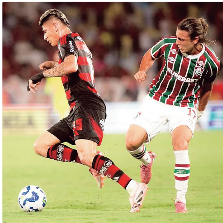
Jogo, previsto anteriormente para sábado (11), será domingo (12) às 18h30

Em nota, o Fluminense afirmou que foi consultado sobre a mudança de horário e que isso também beneficiará seu elenco.