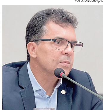
Para Vale, a administração pública deve estar alinhada com valores de respeito

Os condenados por racismo poderão ser proibidos de assumir cargos públicos no Distrito Federal. A medida está prevista no projeto de lei 886/2024, do