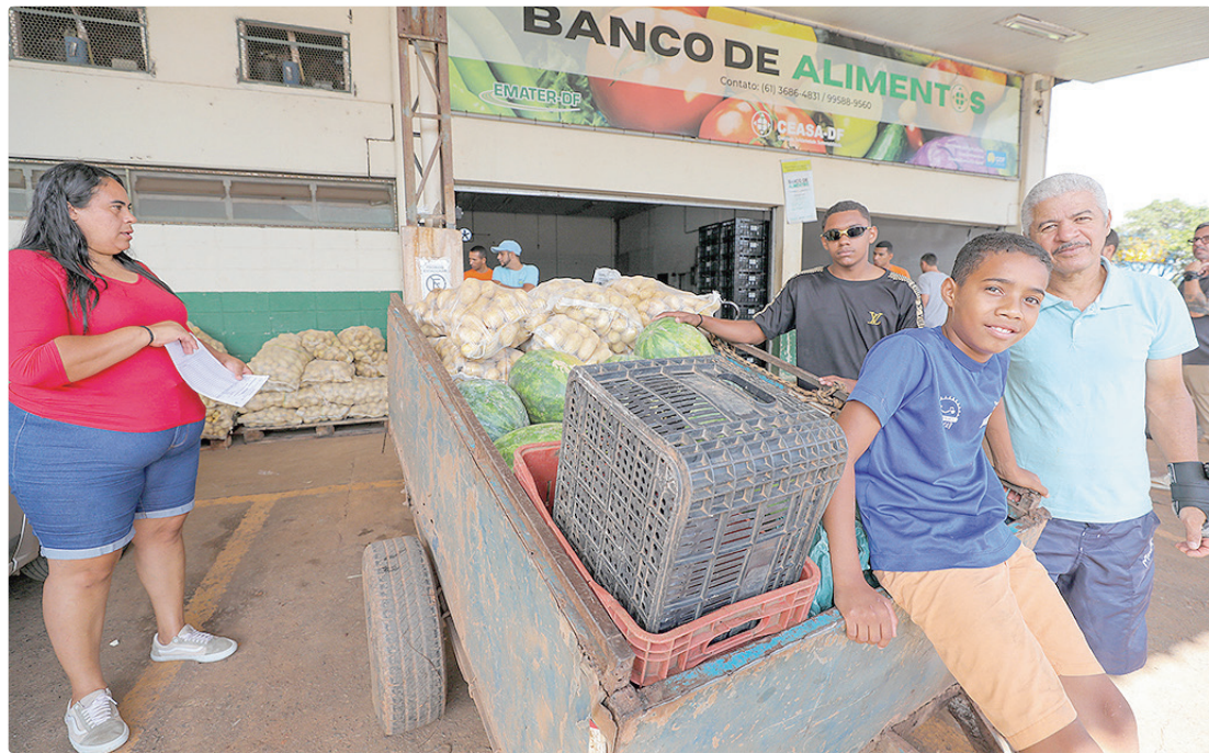
Os alimentos coletados no programa são vendidos ou distribuídos a famílias em situação de vulnerabilidade