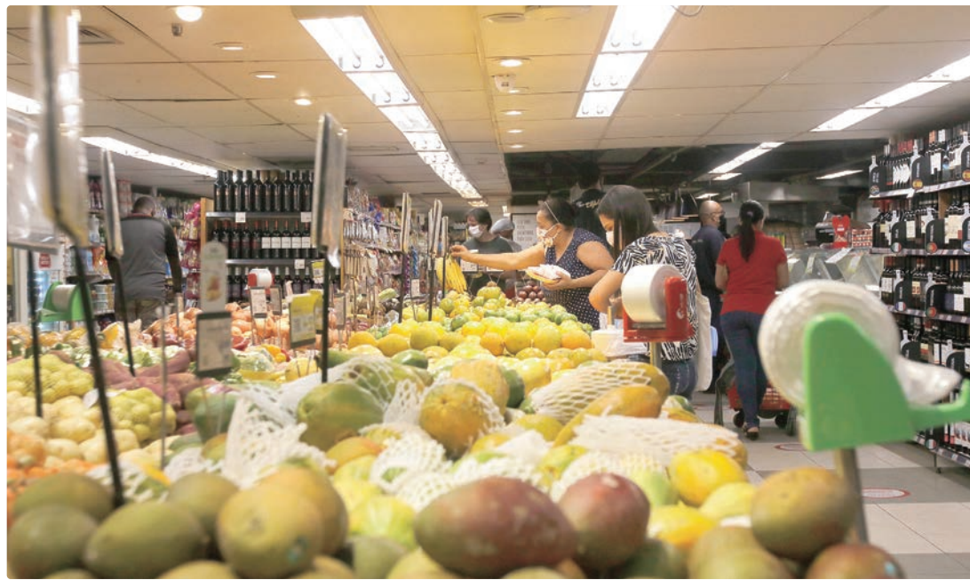
Transportes, com 1,64%, e alimentação e bebida, com 1,56%, foram os principais itens que contribuíram para a alta

As maiores altas em alimentação e bebidas, ficaram com os subitens Leite longa vida (11,74%) e Tomate (20,31%), que representam respectivamente impactos de