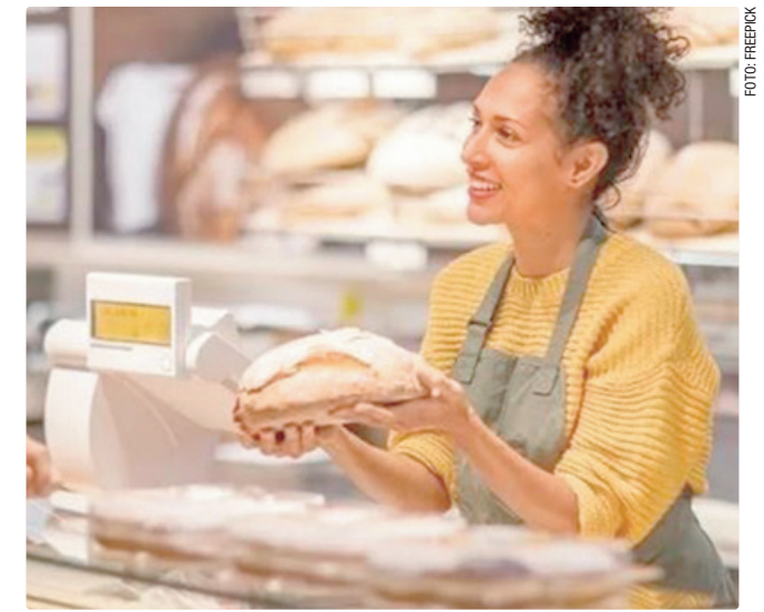
Existem 40 vagas para atendente de padaria, sem local fixo no DF

Empregadores e empreendedores que desejam ofertar vagas ou utilizar o espaço das Agências do Trabalhador para as entrevistas podem se cadastrar pessoalmente nas unidades ou pelo e-mail gcv@sedet.df.gov.br . Pode ser utilizado, ainda, o Canal do Empregador, no site da Secretaria de Desenvolvimento Econômico, Trabalho e Renda (Sedet-DF).