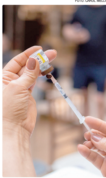
Ação faz parte da parceria entre a Secretaria de Saúde e o Boulevard

A iniciativa visa ampliar a cobertura vacinal no Distrito Federal e reforçar a importância da imunização para a proteção da saúde coletiva. "Ações