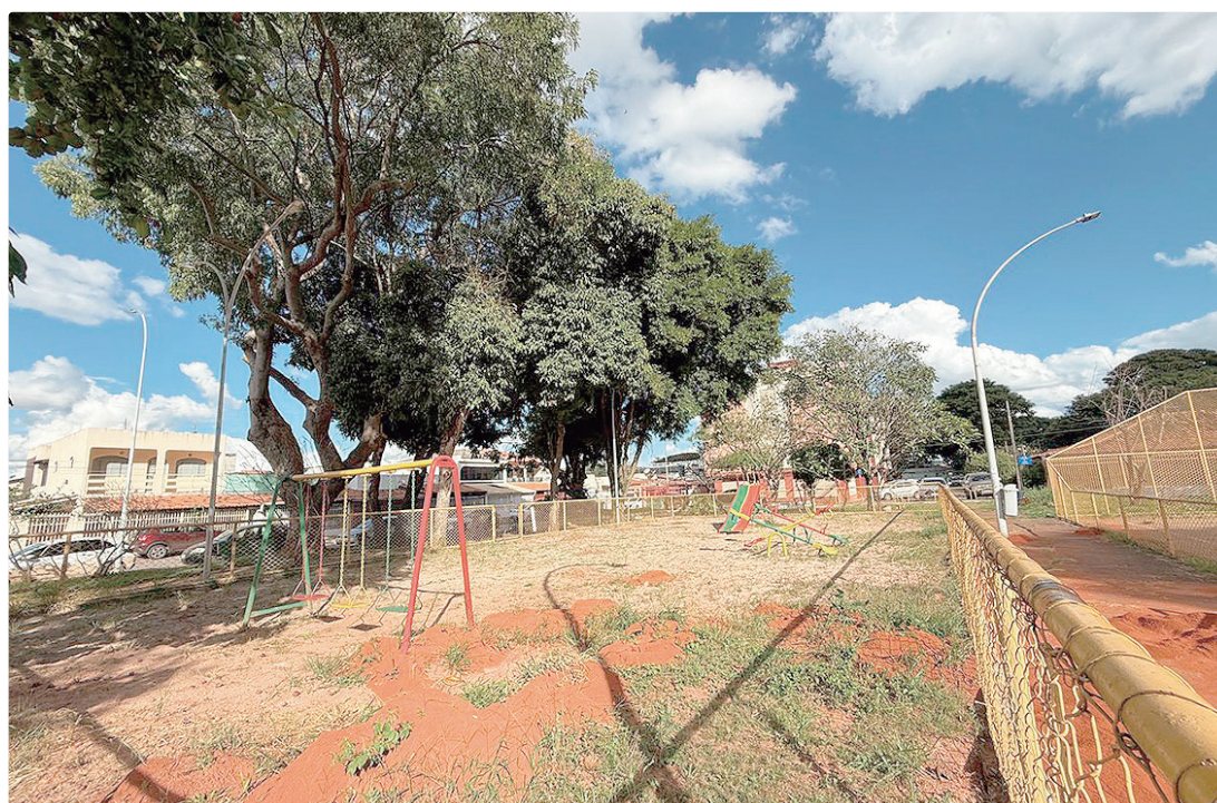
O investimento será de R$ 1,2 milhão e visa garantir melhores condições de uso para crianças, jovens e famílias

Na Arena Guará, o investimento será destinado à requalificação do espaço, que se