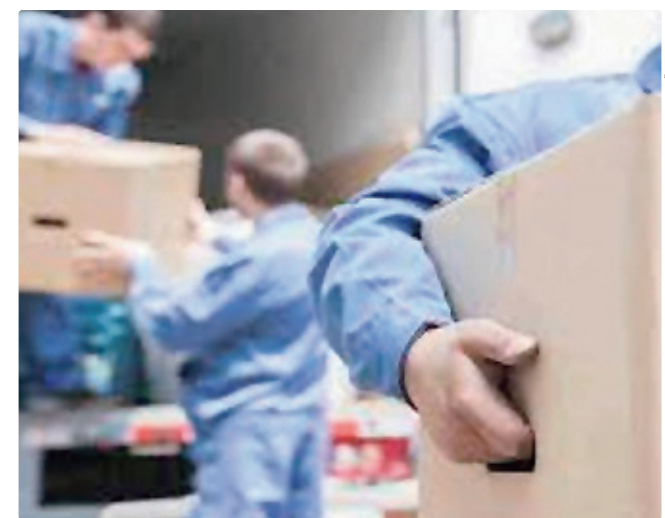
Há 12 vagas para PcDs trabalharem com carga e descarga

Empregadores e empreendedores que desejem ofertar vagas ou utilizar o espaço das agências do trabalhador para as entrevistas podem se cadastrar pessoalmente nas unidades ou pelo e-mail gcv@sedet.df.gov.br. Pode ser utilizado, ainda, o Canal do Empregador, no site da Secretaria de Desenvolvimento Econômico, Trabalho e Renda (Sedet-DF).