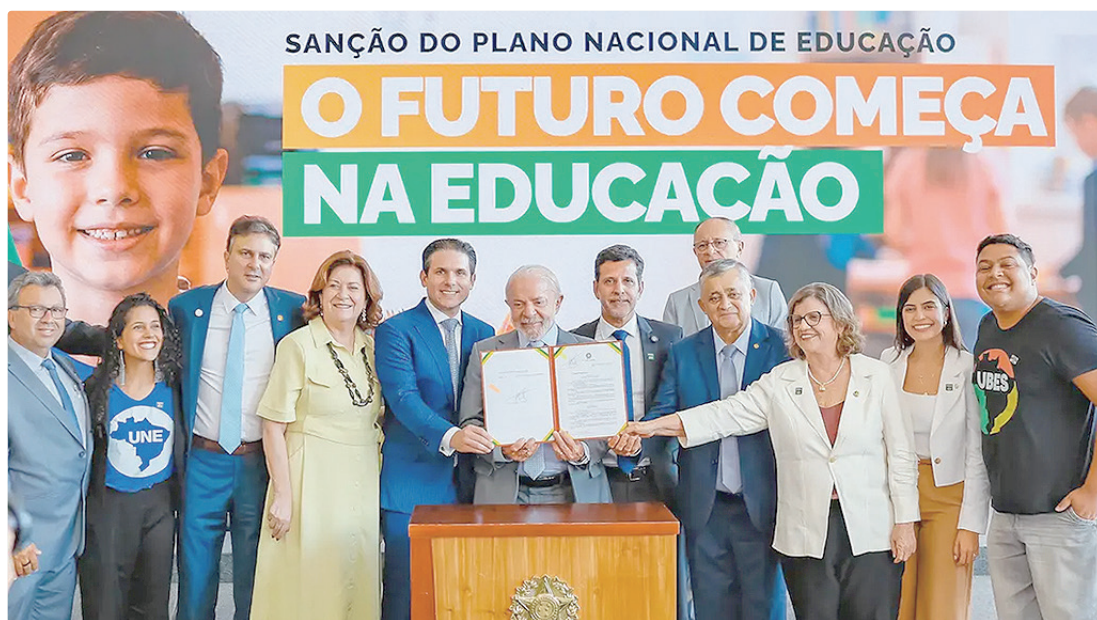
Novo Plano Nacional de Educação foi sancionado por Lula, nesta terça (14), em cerimônia no Palácio do Planalto

De acordo com o gerente de Articulação, Advocacy, Monitoramento e Avaliação do Itaú Educação e Trabalho, Diogo Jamra, o novo plano consolida