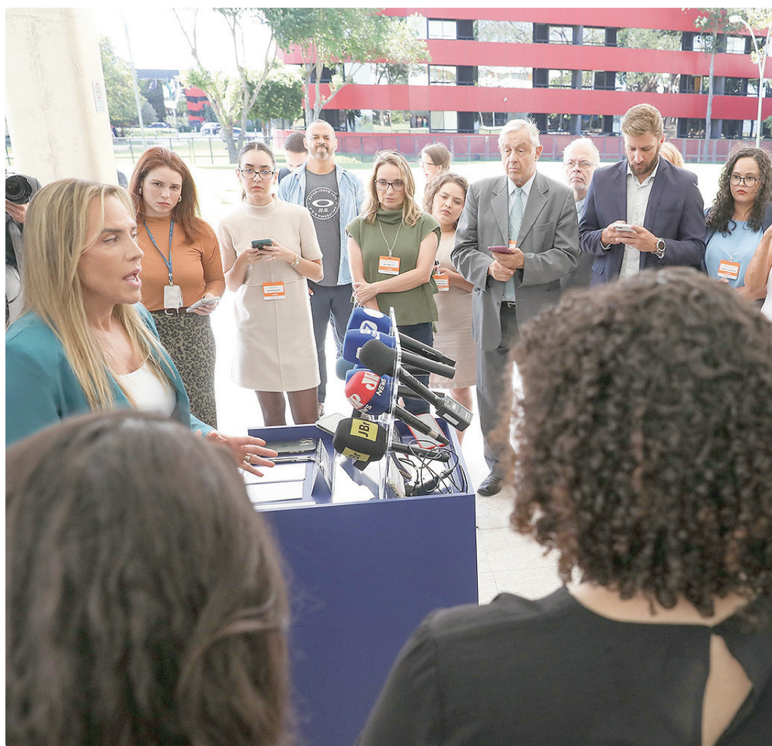
A governadora disse que a eficiência, eficácia, experiência e preparo devem estar no centro da administração