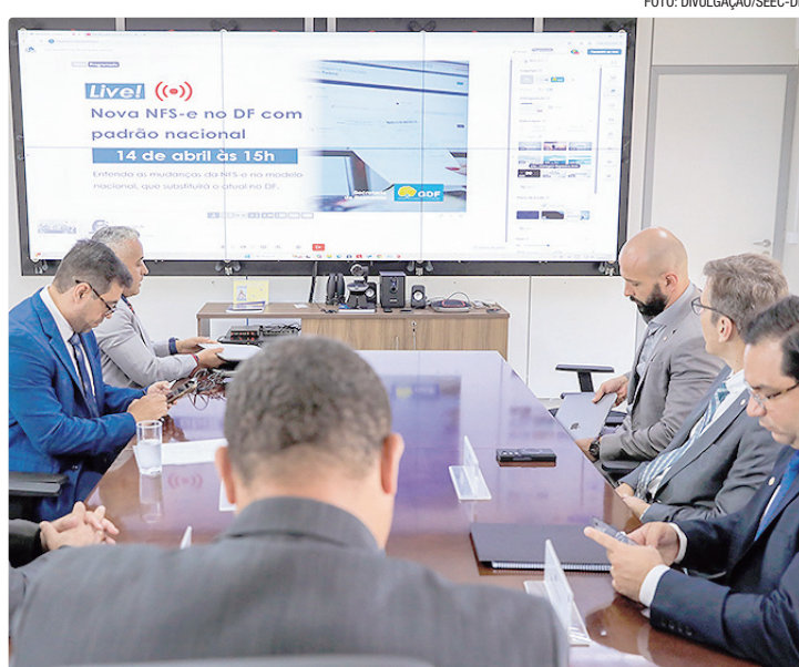
GDF montou várias estratégias para adequar o serviço que começa dia 30