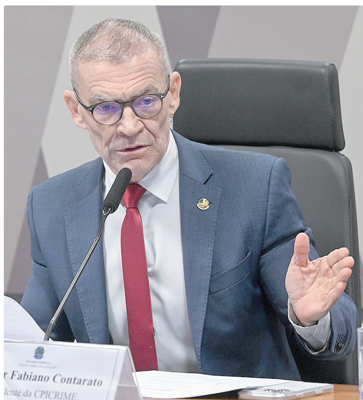
Contarato criticou decisões do STF, mas defendeu as instituições e a democracia

Contarato também criticou o STF por, segundo ele, ter dificultado a oitiva de depoentes,