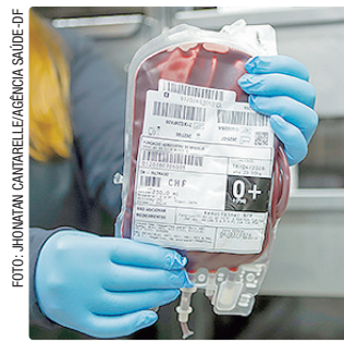
Média diária caiu para 100 doadores; meta é de 180 por dia

Para doar sangue é preciso ter entre 16 e 69 anos, pesar