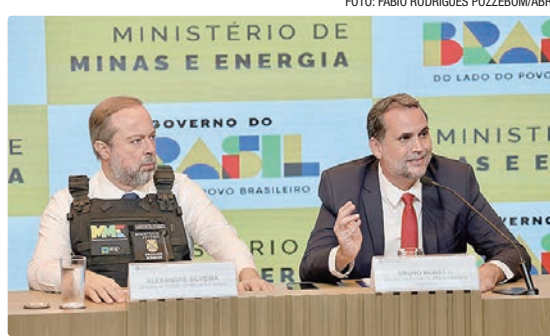
Anúncio foi feito pelo ministro de Minas e Energia, Alexandre Silveira (E), e Bruno Moretti, ministro do Planejamento

Durante pronunciamento, Silveira destacou que as ações do governo estão tendo sucesso, com os preços mantendo-se estáveis, especialmente por meio dos programas sociais lançados para minimizar o impacto nas famílias