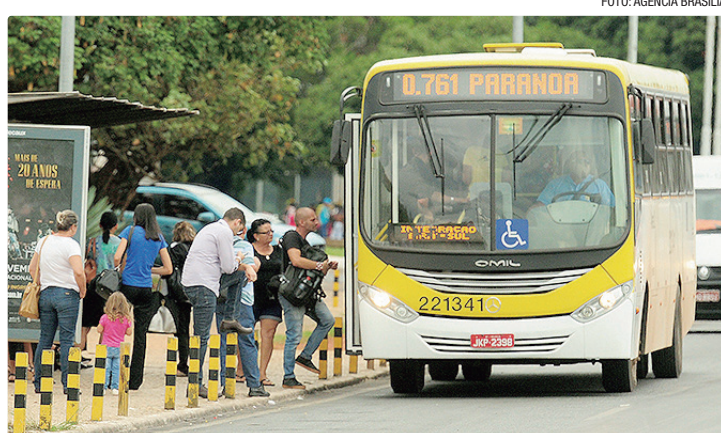
Linha 0.761 (Paranoá/Rodoviária do Plano) vai reforçar a linha 764.2

Já a linha 761.2, cujo trajeto vai do Paranoá Parque até