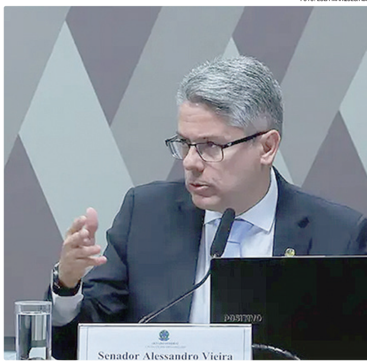
Após 120 dias de trabalho da CPI, Vieira apresentou relatório de 220 páginas

“A decisão dos colegas pela não aprovação, após uma intervenção direta do Palácio do Pla-