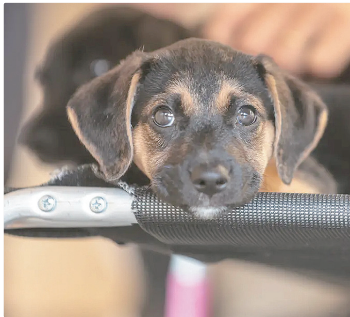
A comprovação de bioequivalência será feita por laboratório reconhecido

Denominação Comum Brasileira (DCB), de cada princípio ativo. É expressamente proibido o uso de nome comercial.