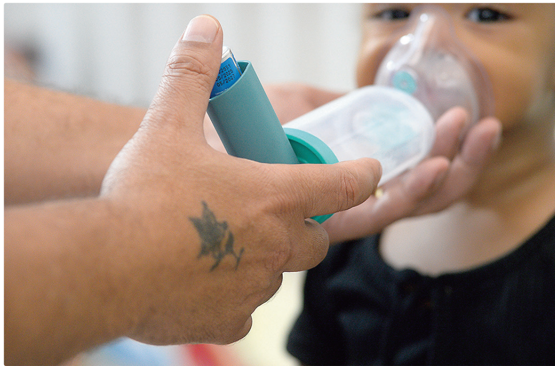
Crianças menores de 5 anos e idosos são os mais suscetíveis à evolução para formas graves de infecções respiratórias

Nos casos mais graves, pode haver a evolução para a Síndrome Respiratória Aguda Grave (SRAG), que ocorre quando o paciente hospitalizado com SG apresenta agravamento, como dispnéia (dificuldade de respirar), taquipnéia (respiração rápida) e baixa saturação de oxigênio.