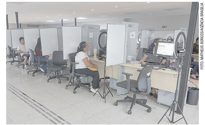
O atendimento presencial pode ser feito de segunda a sexta-feira

Para emitir o título, é preciso apresentar documento oficial com foto que comprove a nacionalidade brasileira, comprovante de residência recente e, no caso de homens que completam 19 anos no ano do alistamento, comprovante de quitação do serviço militar. Também está disponível o atendimento para pessoas surdas, com QR Codes espalhados nas unidades do TRE-DF que direcionam para o aplicativo do DF Libras. A ferramenta do GDF dispõe de tradutores que auxiliam em tempo real a comunicação por videochamada, sem custos ao usuário.