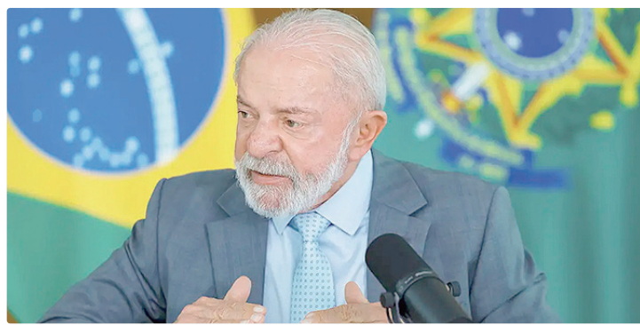
Em viagem pela Europa, Lula concedeu entrevista ao jornal espanhol El País

Para Lula, está faltando no mundo lideranças políticas que assumam a responsabilidade de que o planeta não é de um país só. “Por mais importante que seja esse país, é importante que os maiores tenham mais responsabilidade de manter a paz no mundo”, completou.