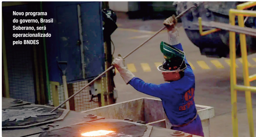
Novo programa do governo, Brasil Soberano, será operacionalizado pelo BNDES

As tarifas de 50% impostas pelo presidente dos EUA, Donald Trump, acabaram sendo derrubadas por uma decisão da Suprema Corte do país, em outubro do ano passado. Elas acabaram sendo fixadas em