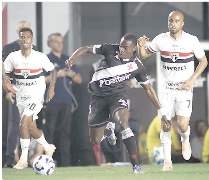
Vasco soma três vitórias, quatro empates e quatro derrotas no Brasileirão

O Tricolor vive momento bem diferente. A vitória por 2 a 0 sobre o O'Higgins pela Sul-Americana na última terça-feira deu sequência a uma campanha sólida no torneio continental, com 100% de aproveitamento em dois jogos. No Brasileirão, o time de Roger Machado está em 3º lugar