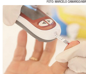
Expectativa é que, ao ano, mais de 860 mil pessoas serão beneficiadas

No caso do pé diabético, por exemplo, a tecnologia possibilita uma cicatrização até duas vezes mais rápida das feridas quando comparada aos curativos padrão. No SUS, ela já é utilizada no tratamento de queimaduras extensas desde 2025.