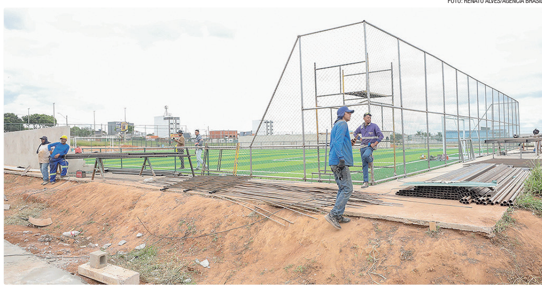
O Centro Olímpico e Paralímpico do Paranoá terá pista de atletismo, campo sintético, quadras de tênis e espaço multiuso

O Centro Olímpico do Paranoá terá pista de atletismo,