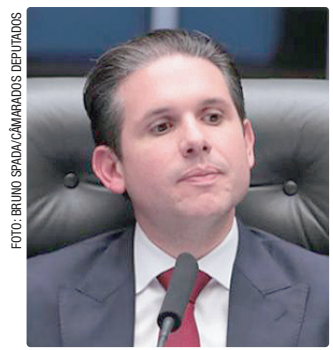
Para Motta, as penas que foram aplicadas são exageradas

O Supremo Tribunal Federal (STF) é que fará essa calibragem das punições. Também pode viabilizar punições mais brandas para os condenados por participação na organização criminosa que tramou o golpe de Estado em 2022 – entre eles, o ex-presidente Jair Bolsonaro, condenado há 27 anos de prisão.