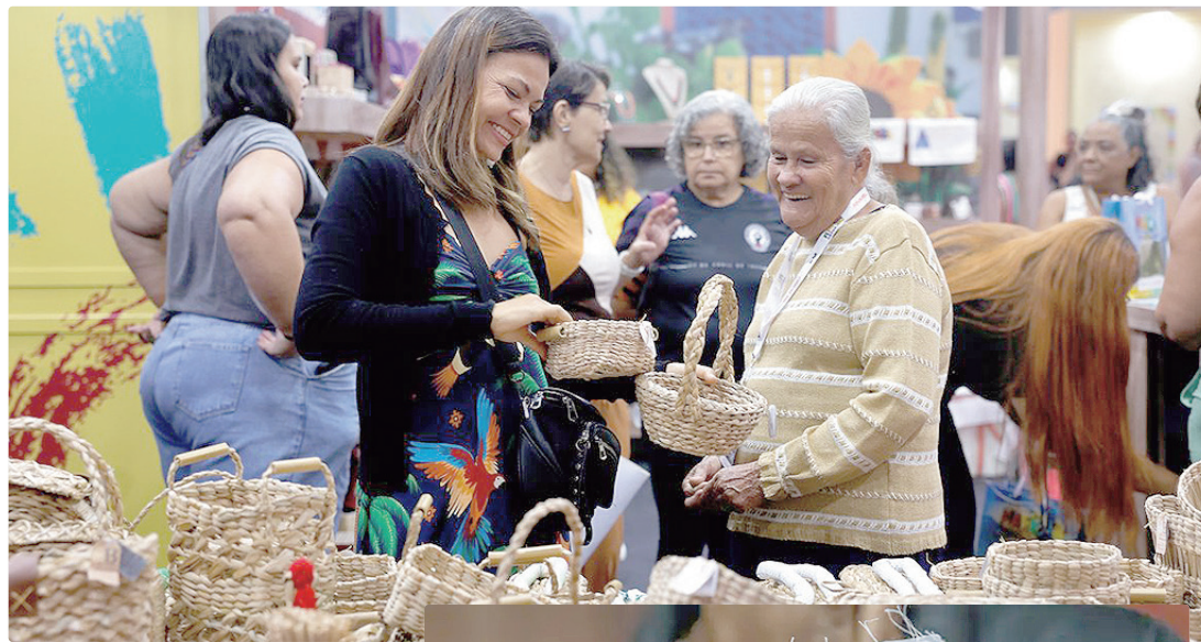
Turismo, comércio e serviços se destacam entre o público 60+