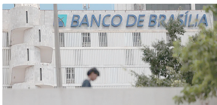
O Banco de Brasília (BRB) vai criar fundo de investimento com Quadra Capital

Segundo o BRB, a operação será composta por uma parcela