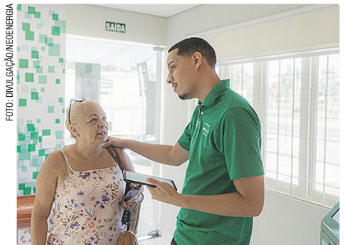
Parcelamento de débitos e troca de titularidade da conta de energia são alguns dos serviços oferecidos

Durante todos os dias de atendimento, a distribuidora disponibilizará uma série de serviços técnicos e comerciais diretamente ao público, como parcelamento de débitos, solicitação de reparo por danos elétricos, troca de titularidade, pedidos de ligação nova e demais atendimentos relacionados à rede elétrica. Também serão oferecidas orientações sobre segurança, consumo consciente e regularização do fornecimento de energia.