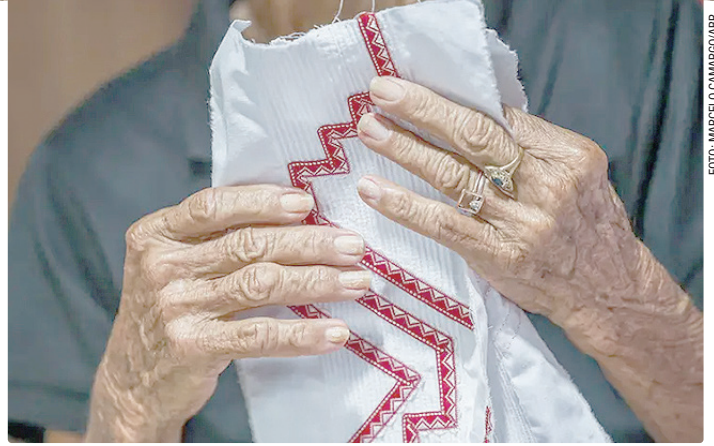
Bordadeira no Pará empreende no trabalho com a moda marajoara

Dentre os setores que este público mais se interessa em empreender destacam-se turismo, comércio e serviços. O Sebrae oferece aos empreendedores mentorias e consultorias, tanto para orientar quem quer