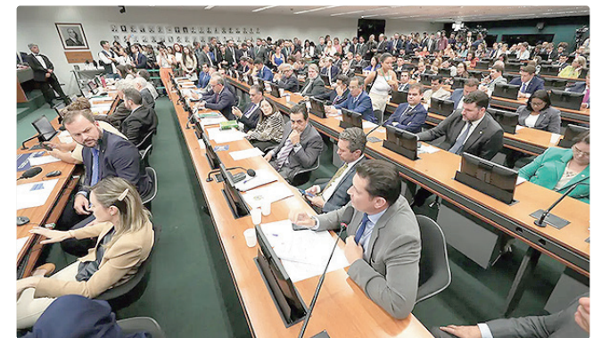
PL e PSDB pediram vista de proposta que reduz jornada de trabalho

“Se a PEC for aprovada nesse prazo, evidentemente que o PL está prejudicado, não há mais necessidade. Mas o rito da PEC é mais demorado do que o PL. O PL vai avançar e pode ser que entre em vigor a redução de jornada de trabalho e depois se consolide por PEC para impedir eventuais aventureiros do futuro quererem aumentar a jornada como aconteceu na Argentina”, explicou Marinho.