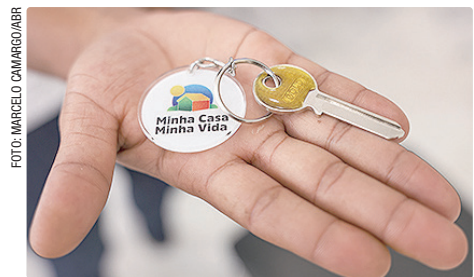
Mudanças nas faixas do programa favorecem principalmente a classe média e facilitam o acesso à casa própria

• Exemplo 2: Quem tinha renda entre R$ 8.600,01 e R$ 9.600 e se enquadrava na faixa 4 passa agora para a faixa 3. Esse grupo tinha acesso a juros de cerca de 10% ao ano. Agora, passa a ter taxas de até 8,16% ao ano.