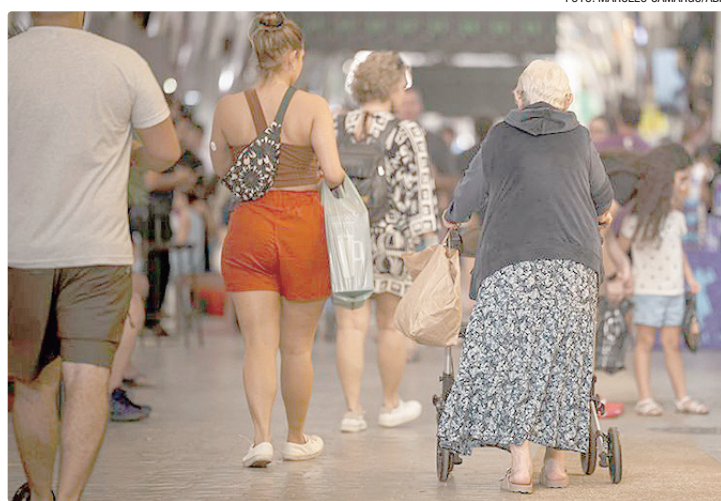
Etarismo é um dos grandes empecilhos à manutenção dos 60+ na atividade

As maiores proporções de idosos na População em Idade Ativa (PIA) em 2024 estavam nos estados do Rio de Janeiro (24,1%), Rio Grande do Sul (23,7%) e São Paulo (21,7%). As menores proporções foram