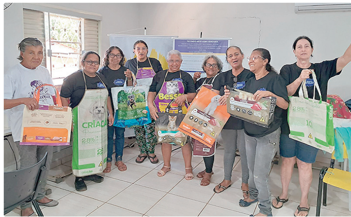
A 3ª edição iniciou em dezembro e transformou a vida dos participantes

A programação do encerramento inclui ainda uma feira com exposição dos trabalhos realizados nas oficinas – corte