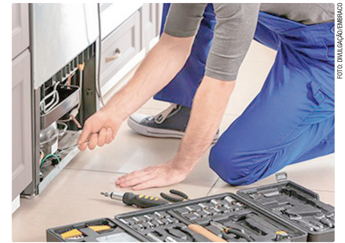
Maior salário é para duas vagas de técnico em refrigeração

Empregadores e empreendedores que desejem ofertar vagas ou utilizar o espaço das agências do trabalhador para as entrevistas podem se cadastrar pessoalmente nas unidades ou pelo e-mail gcv@sedet.df.gov.br . Pode ser utilizado, ainda, o Canal do Empregador, no site da Secretaria de Desenvolvimento Econômico, Trabalho e Renda (Sedet).