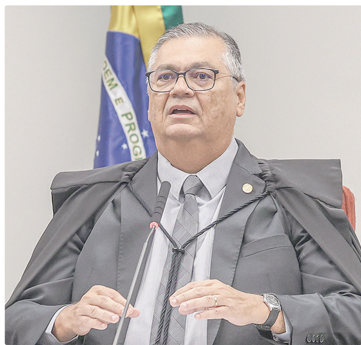
Flávio Dino defende que a reforma não deve servir a “impulsos punitivistas”

A manifestação ganhou peso político adicional porque recebeu elogio público imediato do presidente do STF, ministro Edson Fachin. Em nota, Fachin afirmou que a perspectiva apresentada por Dino “merece aplauso e apoio” e classificou o texto como uma reflexão “oportuna e bem estruturada” sobre a necessi-