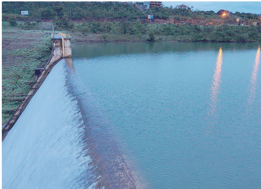
Descoberto está com 100% de sua capacidade hídrica e Santa Maria alcançou 99% depois das chuvas

DF, com seca bem definida, continua sendo uma realidade, mas hoje a gestão trabalha preparada em articulação com os produtores rurais por meio de marcos regulatórios para a garantia da manutenção das atividades agrícolas.