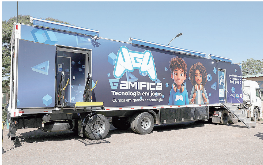
As carretas seguirão o itinerário do programa GDF na sua Porta, que leva um gabinete móvel para as regiões