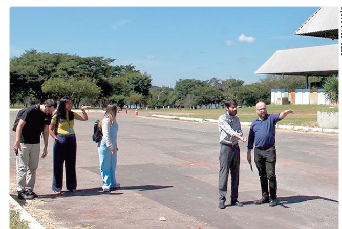
A vistoria contribui para verificar se os estudos estão alinhados

A partir da vistoria, a CGDF fará a elaboração do relatório de auditoria, com previsão de conclusão até o dia 30 de abril. O documento deve consolidar a análise técnica sobre os estudos apresentados.