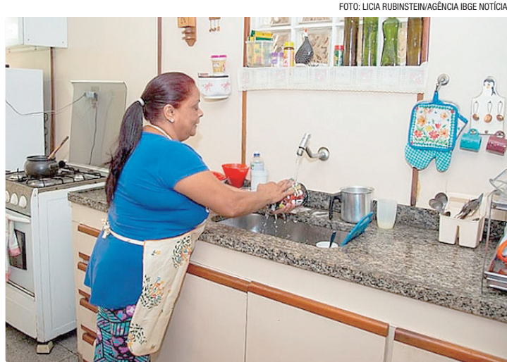
Índice aponta um salário médio de R$ 1.587 em 2024, elevação foi de 3,1%

Além do aumento no rendimento mensal, o estudo