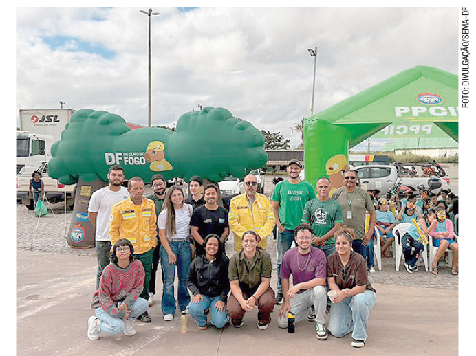
Representantes de diferentes órgãos do GDF estão na mobilização

O Ppcif reúne mais de 20 instituições, incluindo Instituto Brasília Ambiental, Defesa Civil, PMDF, Novacap, Marinha, Aeronáutica, Emater, Secretaria de Agricultura, Jardim Botânico de Brasília e Instituto Nacional de Meteorologia (Inmet).