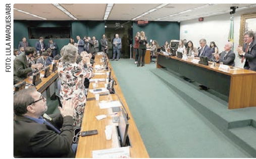
As duas PECs serão analisadas por comissão especial e pelo plenário da Câmara

Quando a PEC for a plenário, será exigido um quórum de três quintos dos votos dos deputados, o que corresponde a 308 parlamentares, em dois turnos de votação.