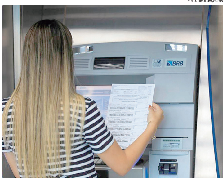
Nota obtida pelo GDF foi de 0,89 à frente de todos os estados do país

O resultado coloca o DF à frente de unidades federativas como Pernambuco, Espírito Santo e Minas Gerais, que também aparecem entre os mais bem avaliados. O levan-