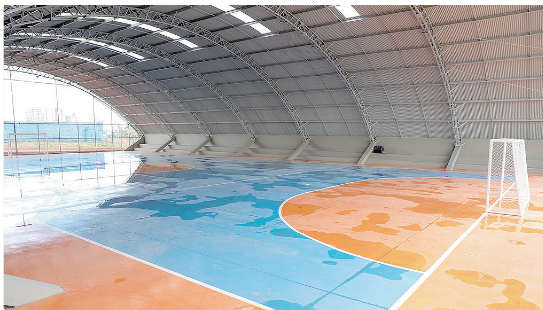
Com investimento de R$ 1,2 milhão, o Ginásio de Esportes de Samambaia volta a funcionar após 6 anos desativado

A chefe do Executivo destacou que o ginásio amplia o acesso da população ao esporte e reforça o uso comunitário do espaço. “Eu sempre falei isso: só acredito no esporte quando ele acontece na porta da casa do cidadão. Locais como esse servem não só para a prática esportiva, mas também viram espaço de convivência da comunidade, onde a gente consegue atender a terceira idade, desenvolver atividades e realizar eventos. É por isso que seguimos investindo para que as vilas olímpicas e os equipamentos esportivos estejam preparados para receber as pessoas em cada cidade”, afirmou Celina Leão. “É esse modelo