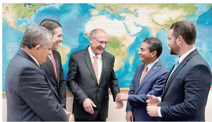
Alckmin acredita que a indústria deverá ter um ganho de 26% com o acordo

De acordo com o vice-presidente -- que participou das negociações como ministro do Desenvolvimento, Indústria e