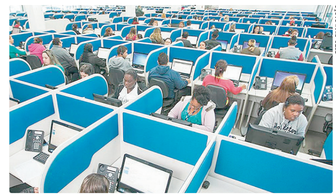
PcDs têm 20 vagas para operador de telemarketing (R$ 1.621)

Empregadores e empreendedores que desejem ofertar vagas ou utilizar o espaço das agências do trabalhador para as entrevistas podem se cadastrar pessoalmente nas unidades ou pelo e-mail gcv@sedet.df.gov.br . Pode ser utilizado, ainda, o Canal do Empregador, no site da Secretaria de Trabalho e Renda (Sedet-DF).