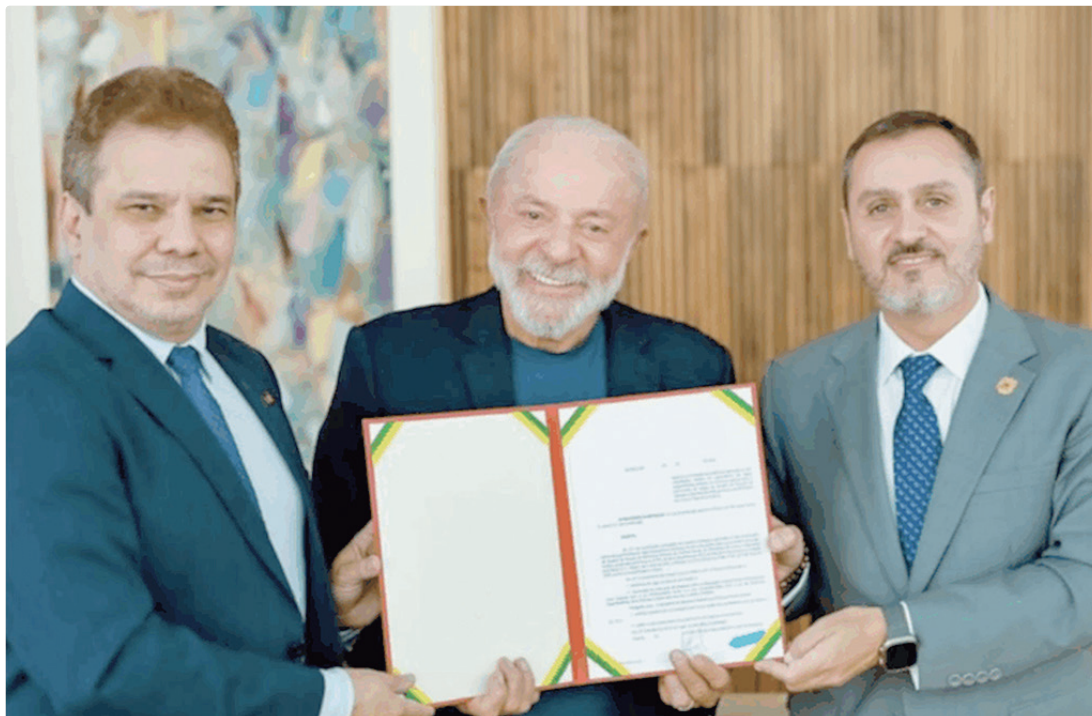
Lula afirma que serão nomeados 640 agentes, 160 escrivães, 120 delegados, 69 peritos e 21 papiloscopistas