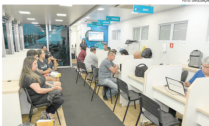
A carreta estará estacionada em frente ao Shopping Pátio dos Ipês

Entre os serviços disponíveis estarão a emissão de 1ª e 2ª vias do Cartão Mobilidade, pelo BRB Mobilidade; atendimen-