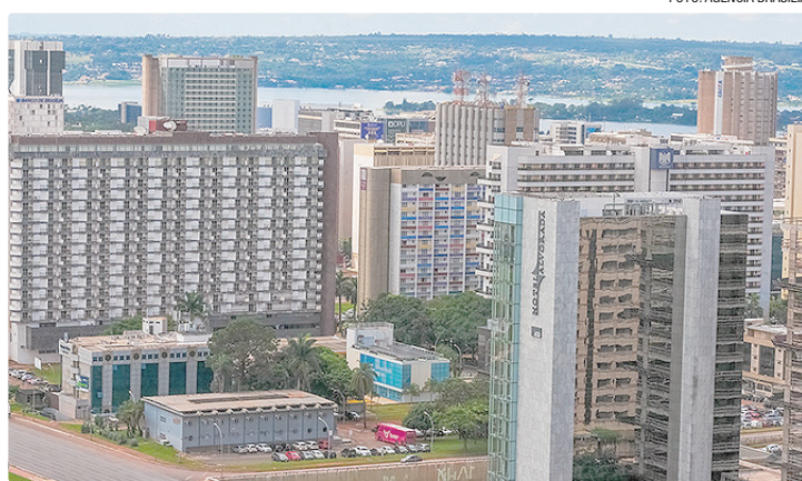
Estabelecimentos formais do DF inscritos no Cadastur já usavam Ficha Digital

A transição é respaldada pela Lei Geral do Turismo e