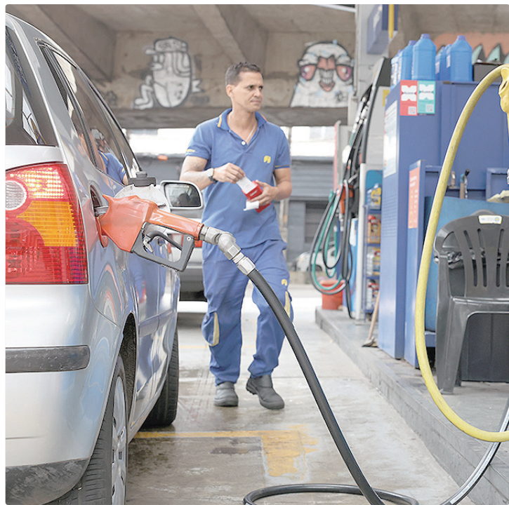
Expectativa do governo é reduzir o preço nas bombas em até R$ 0,64 por litro

A proposta inicial prevê duração do regime enquanto durar a guerra no Oriente Médio. Assim que for constatado aumento de receitas, o presidente da República poderá editar um decreto com desonerações de combustíveis. As