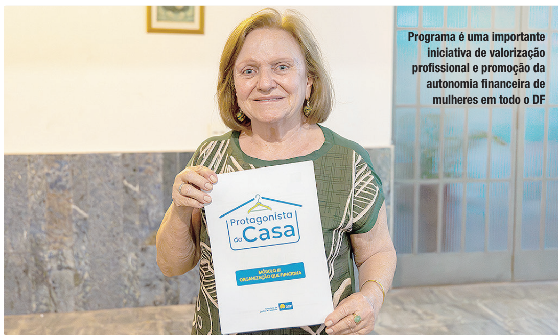
Programa é uma importante iniciativa de valorização profissional e promoção da autonomia financeira de mulheres em todo o DF

Nesta semana, mais 50 mulheres participam das aulas, que seguem levando conhecimento prático e oportunidades de geração de renda. As atividades desta quinta-feira (23), no Santuário Dom Bosco, na Asa Sul, foram dedicadas ao módulo III, que aborda a organização funcional — etapa que já está em execução há quatro meses. Antes disso, as participantes passam pelo módulo I, com orientações sobre organização básica do lar e rotinas domésticas; e pelo módulo II, que traz noções de planejamento doméstico e educação financeira.