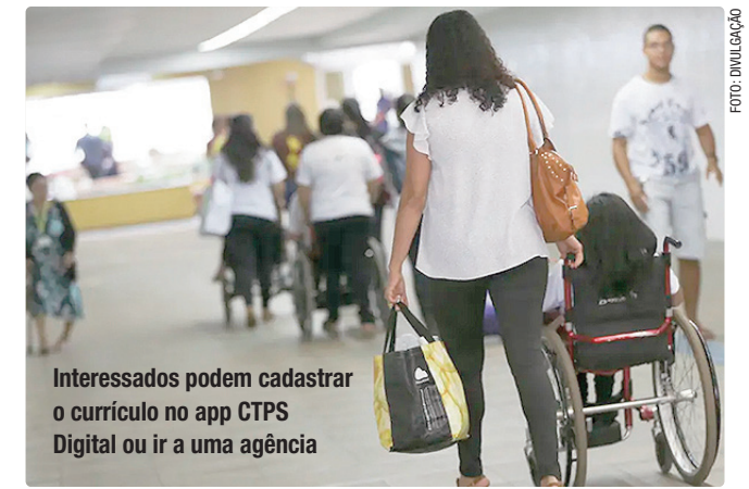
Interessados podem cadastrar o currículo no app CTPS Digital ou ir a uma agência

Empregadores e empreendedores que desejem ofertar vagas ou utilizar o espaço das agências do trabalhador para as entrevistas podem se cadastrar pessoalmente nas unidades ou pelo e-mail gcv@sedet.df.gov.br . Pode ser utilizado, ainda, o Canal do Empregador, no site da Secretaria de Desenvolvimento Econômico, Trabalho e Renda (Sedet-DF).