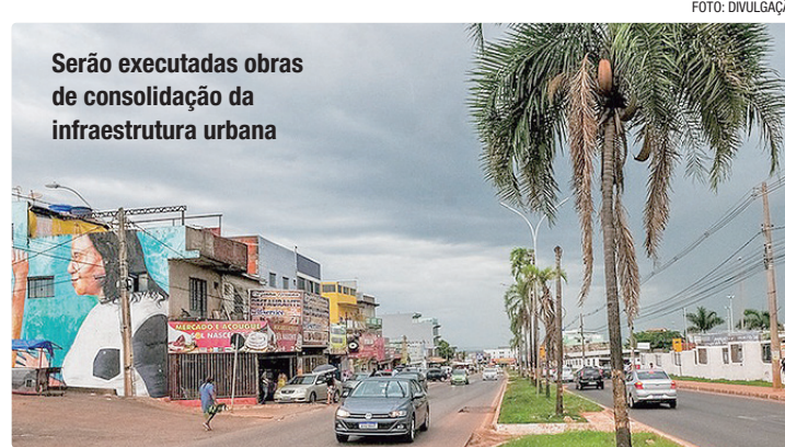
Serão executadas obras de consolidação da infraestrutura urbana