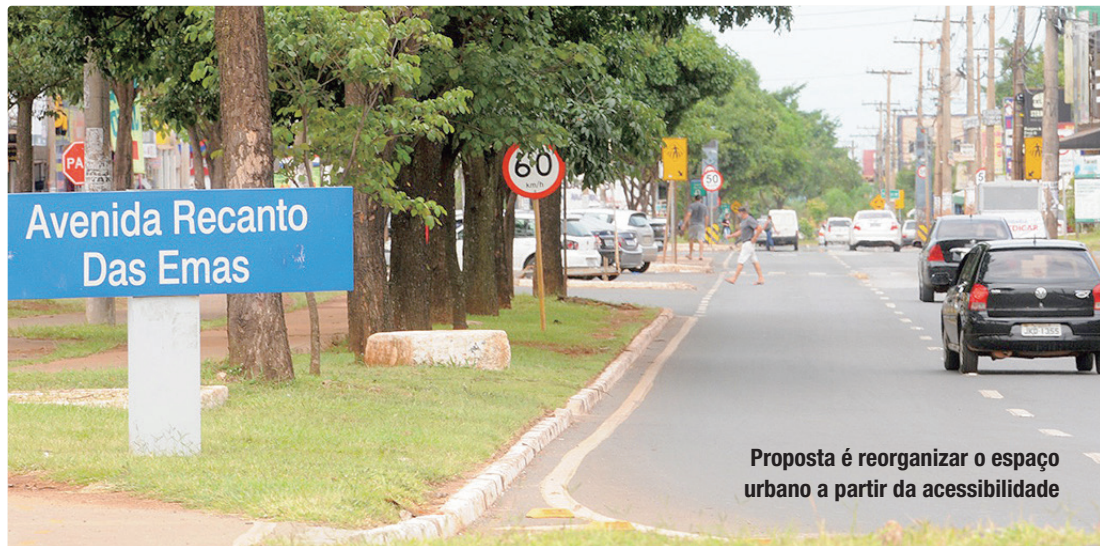
Proposta é reorganizar o espaço urbano a partir da acessibilidade

Entre as principais mudanças está a criação de rotas acessíveis e a adequação de calçadas, garantindo o deslocamento seguro de pedestres, incluindo pessoas com deficiência ou mobilidade reduzida. A proposta segue princípios do desenho universal e dialoga com políticas públicas voltadas para a inclu-