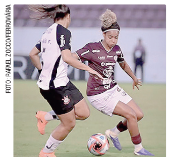
Corinthians vem de vitória contra o Juventude, fora de casa