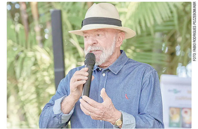
Segundo a médica, lesão retirada de Lula vem da exposição solar

O doutor disse também que o tratamento não vai interferir na campanha presidencial: “vai atrapalhar a campanha? A resposta é não. O máximo que vai acontecer é ele aparecer de chapéu, como aconteceu outras vezes”. O presidente chegou ao hospital por volta das 7h da manhã e a mini-wc- rurgia estava programada, não foi emergencial. Lula esteve acompanhado da primeira-dama Janja da Silva.