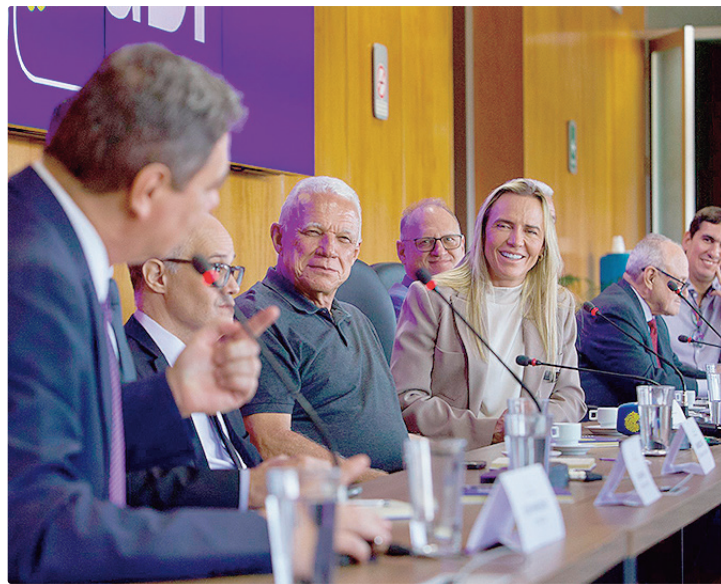
Representantes do setor, em reunião com a governadora do DF, Celina Leão

A ideia ganhou força após visita da governadora à Feira da Goiaba, em Brazlândia, onde produtores relataram a necessidade de mais apoio para comercializar seus produtos no próprio Distrito Federal, sem depender do envio para outros estados. “A gente pode lançar esse programa aqui no GDF. Eu posso fazer um decreto sobre isso para a gente colocar produtos daqui, feitos aqui. Tenho certeza que a população do DF compraria se