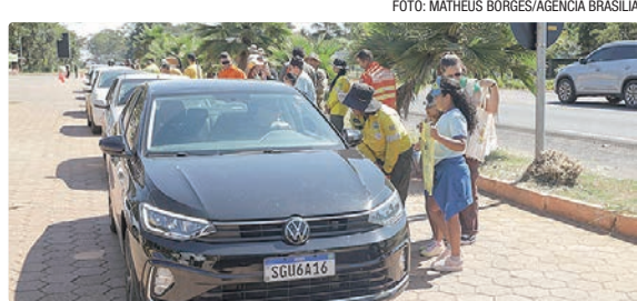
A ação reuniu diversos órgãos do GDF para abordar motoristas e pedestre

A manhã desta sexta-feira (24) foi marcada por uma mobilização educativa na feirinha da Quadra 14 do Park Way, de olho na redução de focos de incêndio e na proteção da Área de Proteção Ambiental (APA) Gama e Cabeça de Veado. A ação, coordenada pela Secretaria do Meio Ambiente (Sema-DF), faz parte do Plano de Prevenção e Combate aos Incêndios Florestais (PPCIF) e reuniu diversos órgãos do GDF para abordar motoris-