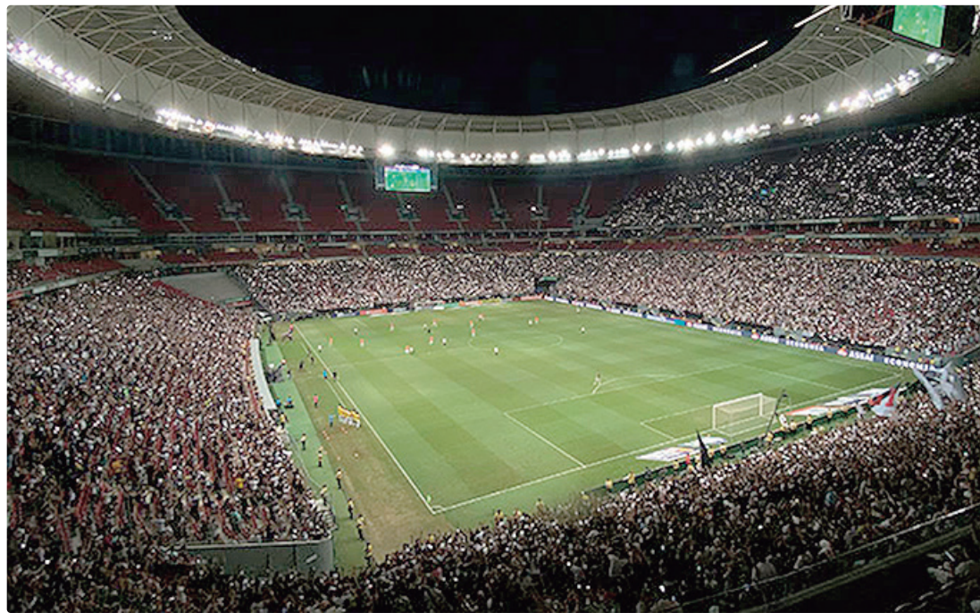
Botafogo, mandante no jogo, ocupa a 9ª posição, com 16 pontos, enquanto o Inter, com 13 pontos, está em 14º lugar

Por sua vez, o Colorado, mais uma vez, faz campanha ruim. Após perder por 2 a 1 para o então lanterna Mirassol, em pleno Beira-Rio, estacionou nos 13 pontos, aparecendo em 14º lugar. No entanto, depois da