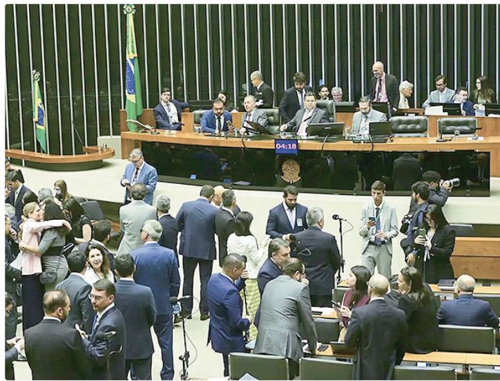
Governo trata a manutenção do veto ao PL da Dosimetria como prioridade

No Senado, o principal destaque da semana será a sabatina do advogado-geral da União,