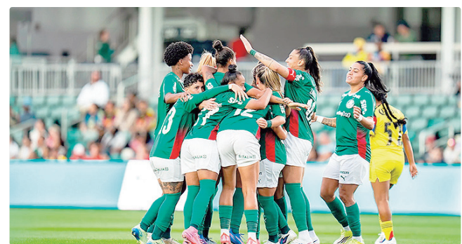
Se vencer com diferença de quatro gols, Palmeiras assume liderança