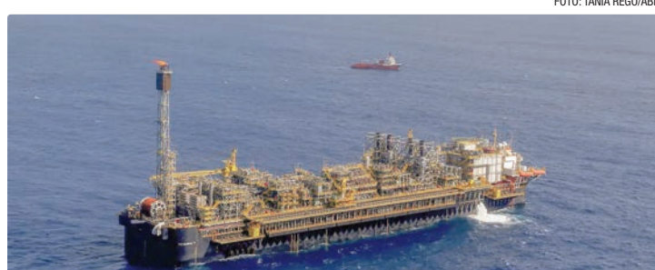
Chamada de Sul de Sapinhoá, área tem cerca de 460 quilômetros quadrados

Os estudos fazem parte do Calendário Estratégico de Avaliações Geológica e Econômica relativo ao biênio 2026/2027. Os documentos serão encaminhados ao Ministério de Minas e Energia (MME) para avaliação sobre a possibilidade de inclusão da área, de cerca de 460 quilômetros quadrados (km²), em futuras rodadas de licitações.