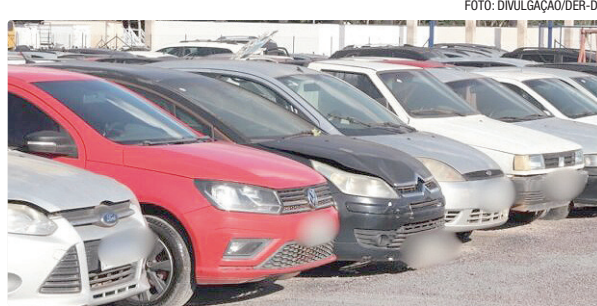
Veículos que não forem retirados seguirão para leilão

A convocação vale para todos os bens listados no