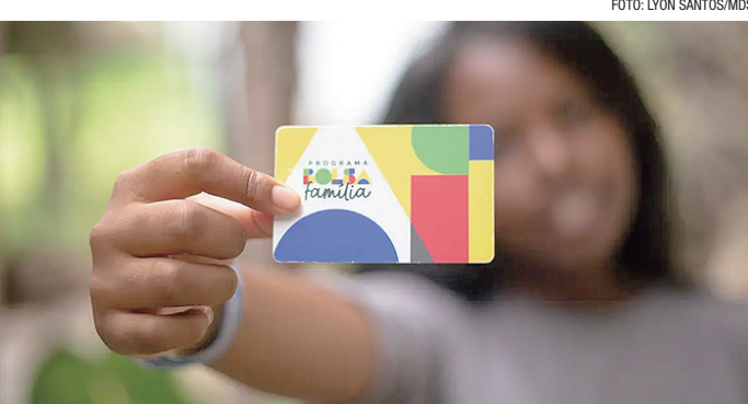
Com adicionais, valor médio do benefício está em R$ 678,22 atualmente

Além do benefício mínimo, há o pagamento de três adicionais. O Benefício Variável Familiar Nutriz paga seis parcelas de R$ 50 a mães de bebês de até seis meses de idade, para garantir a alimentação da criança. O Bolsa Família também paga um acréscimo de R$ 50 a gestantes e nutrizas (mães que amamentam),