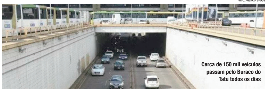
Cerca de 150 mil veículos passam pelo Buraco do Tatu todos os dias

O Buraco do Tatu é monitorado por seis câmeras. A intervenção desta semana visa garantir o bom funcionamento dos equipamentos e, no decorrer dos trabalhos, o fluxo viário será interrompido.