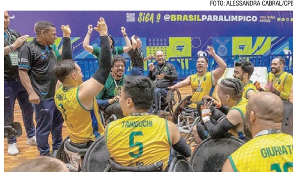
Em fevereiro deste ano, o Brail foi campeão da Musholm Cup, na Dinamarca

“Foi um torneio incrível para nós. Os atletas jogaram as cinco partidas da competição como se fossem cinco finais. Acredito que merecíamos terminar este torneio assim [com o primeiro lugar]. Com certeza, voltaremos no ano que vem para defender o título”, afirmou o técnico da