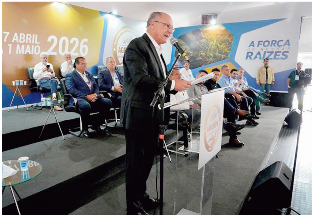
Segundo Geraldo Alckmin, os recursos serão disponibilizados no prazo de três semanas, com juros bem mais baixos

O vice-presidente afirmou ainda que o governo prepara um programa de renegociação de dívidas rurais, medida que,