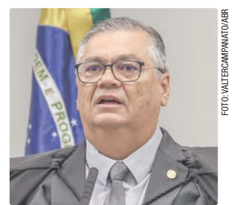
Dino propõe a perda de cargos de juizes e integrantes do MP

Dino também é autor de uma proposta de emenda à Constituição sobre o mesmo assunto que tramita no Senado Federal. O texto foi aprovado na Comissão de Constituição e