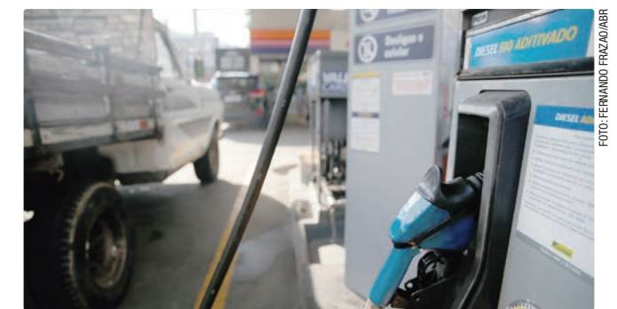
Nova previsão de alta da inflação se deve à guerra no Oriente Médio

Mesmo com aumento da projeção de inflação neste ano e nos próximos, o mercado continuou projetando queda dos juros.