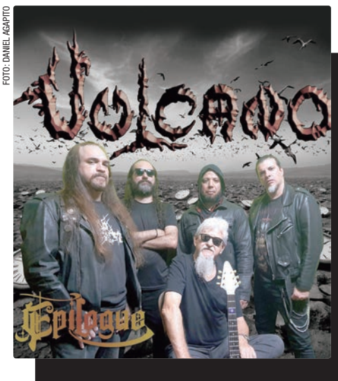
Vazio, Vulcano, Banda DFC, The News, Face do Caos, Mofo, Death Slam, Trash Town e Axion animam o Festival Lokapalooza, dia 9 de maio, a partir das 16h