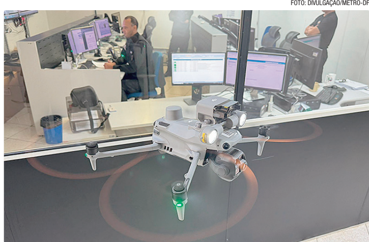
Equipamento ajuda a intensificar a fiscalização preventiva nas estações

O aparelho, adquirido por meio de emenda parlamentar do deputado Max Maciel, chega ao Metrô-DF em um momento estratégico para fortalecer as ações de segurança da companhia, ampliando a capacidade de monitoramento e contribuindo para a otimização das atividades dos empregados do Corpo de Segurança Operacional (CSO). A tecnologia será usada para inten-