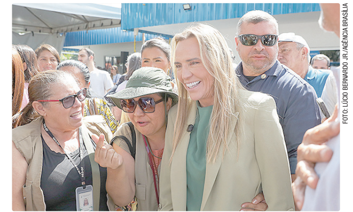
Celina: “É preciso dar condições às pessoas que vêm a esse Cras”

O Cras da Candangolândia mantém como principal serviço o acompanhamento pelo Serviço de Proteção e Atendimento Integral à Família (Paif), que oferece atendimentos individualizados, visitas domiciliares, orientação sobre. Desde 2023, mais de 50 Cras foram reformados no DF, com investimentos que ultrapassam R$ 97 milhões.