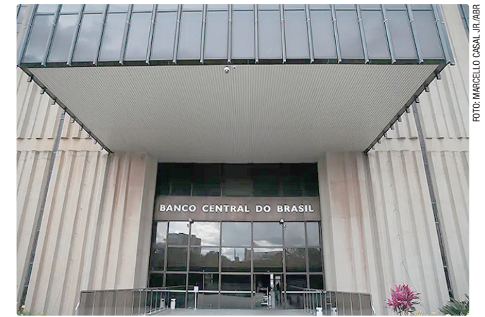
Analistas acreditam que o Copom vai reduzir pela 2ª vez a Selic

Segundo o último boletim Focus, a estimativa de inflação para 2026 subiu para 4,86% por causa do conflito no Oriente Médio. Isso representa inflação acima do teto da meta contínua estabelecida pelo Conselho Monetário Nacional (CMN). Oficialmente, a meta está em 3%, podendo chegar a 4,5% por causa do intervalo de tolerância de 1,5 ponto.