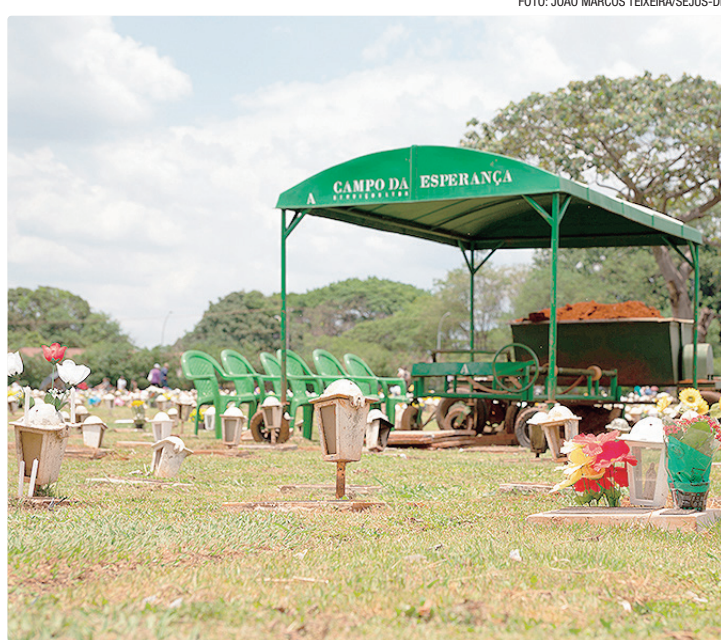
Novas tarifas seguem variação entre março de 2025 e fevereiro de 2026

A Portaria nº 369, de 24 de abril de 2026, estabelece o reajuste das tarifas dos serviços cemiteriais e de cremação com base na variação acumulada do Índice Nacional de Preços ao Consumidor Amplo (IPCA) entre março de 2025 e fevereiro de 2026. O percentual aplicado foi de 3,812500%, conforme previsto no contrato de concessão firmado entre o Governo do Distrito Federal e a empresa Campo da Esperança