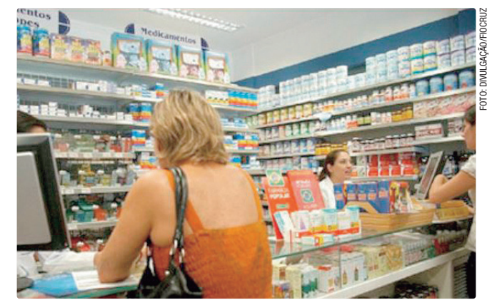
Maior salário está em três vagas para farmacêutico, em Ceilândia

Empregadores e empreendedores que desejem ofertar vagas ou utilizar o espaço das agências do trabalhador para as entrevistas podem se cadastrar pessoalmente nas unidades ou pelo e-mail gcv@sedet.df.gov.br. Pode ser utilizado, ainda, o Canal do Empregador, no site da Secretaria de Desenvolvimento Econômico, Trabalho e Renda (Sedet).