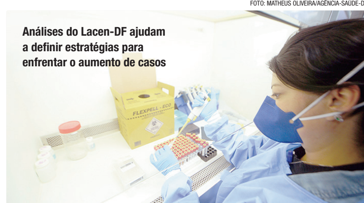
Análises do Lacen-DF ajudam a definir estratégias para enfrentar o aumento de casos

“A celeridade é necessária, inclusive, para qualificar a assistência dada aos pacientes: dependendo do resultado, pode-se indicar a internação ou, se for o caso, a alta”,