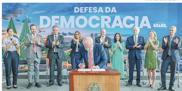
Lula vetou o projeto durante cerimônia que marcou os três anos dos ataques

projeto em 8 de janeiro, durante cerimônia que marcou os três anos dos ataques às sedes dos Três Poderes.