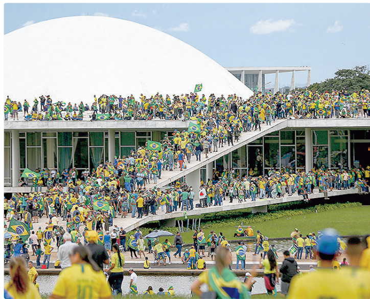
PL beneficia Bolsonaro e todos os condenados pelos atos de 8 de janeiro

No PL da Dosimetria, uma mudança do regime fechado para o semiaberto é facilitada. Isso contradiz a Lei Antifacção, Marco Legal do Combate ao Crime Organizado no Brasil.