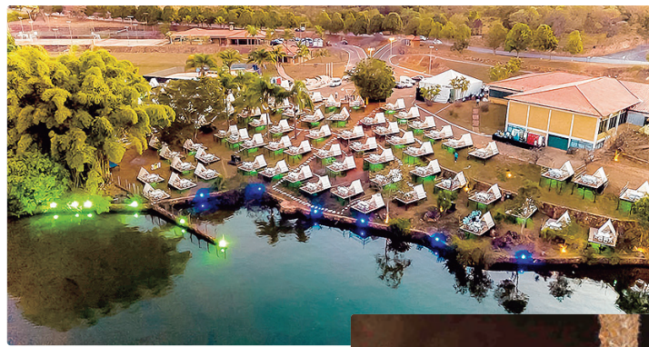
O Trust Love oferece 100 cabanas para grupos de 2 a 6 pessoas

A estrutura ganha ainda mais protagonismo, com 100 cabanas para grupos de 2 a 6 pessoas, além de três espaços exclusivos com capacidade para até 10 pessoas, pensados para confrater-