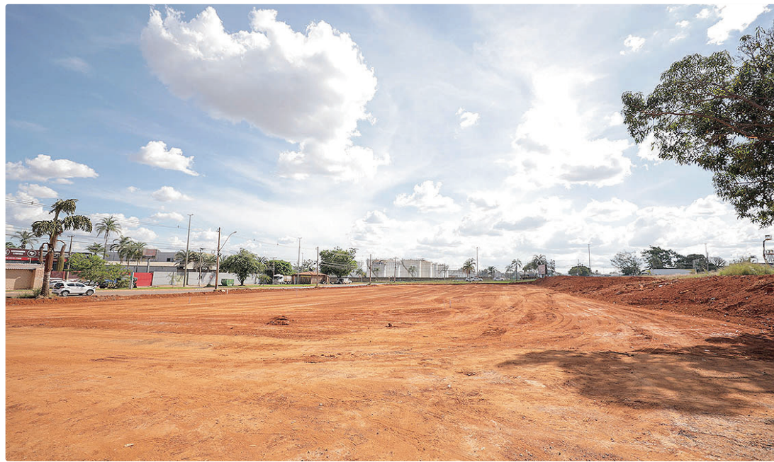
Obra está em andamento desde o início de abril e já passou por limpeza, nivelamento e retirada de vegetação