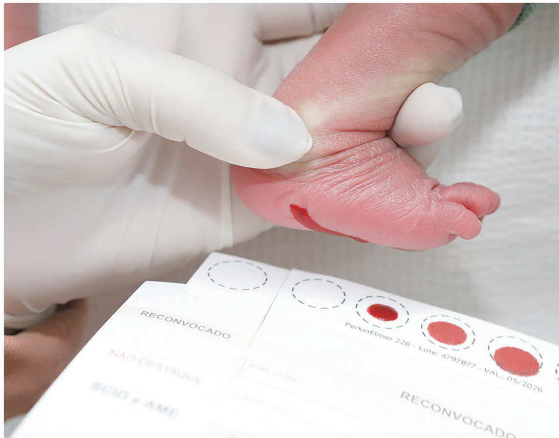
Saúde do Distrito Federal é destaque ao incluir o rastreamento da Doença de Fabry no Teste do Pezinho Ampliado

O Distrito Federal destaca-se no cenário nacional ao incluir o rastreamento da doença de Fabry no Teste do Pezinho Ampliado, oferecido na rede pública. Graças a essa iniciativa, bebês já foram diagnosticados precocemente no DF, permitindo um monitoramento