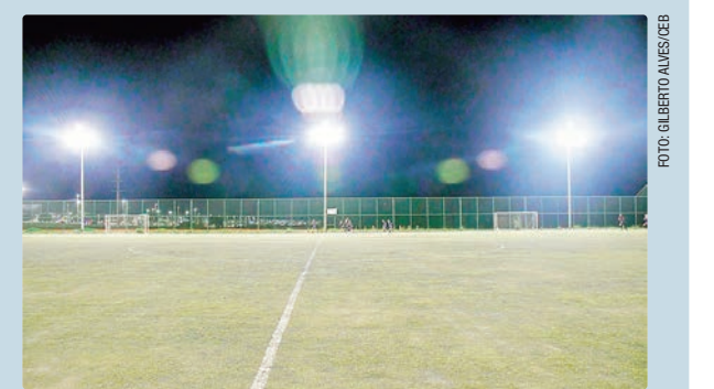
Campo sintético do Paranoá Parque ganhou iluminação em LED

Quando a iluminação é boa, os meninos até melhoram o desempenho. A gente enxerga a bola mais rápido e não enfrenta a mesma dificuldade de antes, com as lâmpadas antigas. Ficou show de bola, só tenho a agradecer”, afirmou. Além de contribuir para a qualidade de vida, a medida também impacta a sensação de segurança, ao aumentar a presença de pessoas nos locais e melhorar a visibilidade das áreas.