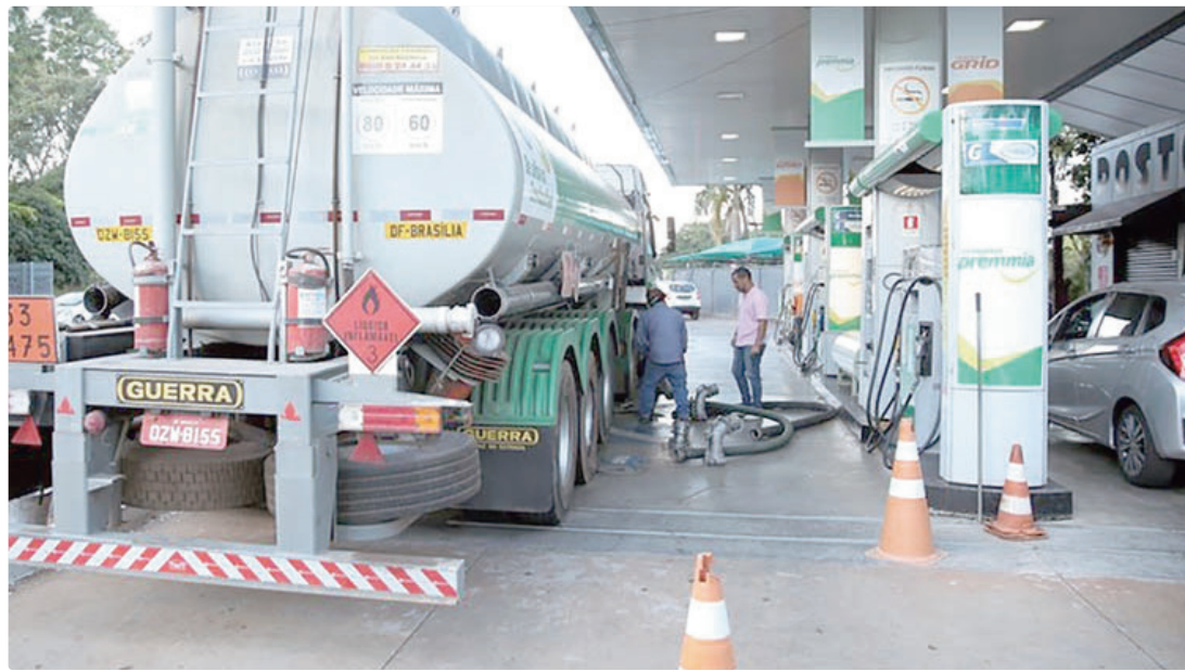
A iniciativa tem como objetivo assegurar a oferta de diesel no mercado e evitar oscilações bruscas de preço

Distrito Federal vai contribuir com R$ 0,60 por litro de diesel, valor que será complementado pela União no mesmo montante, totalizando um subsídio de R$ 1,20 por litro.