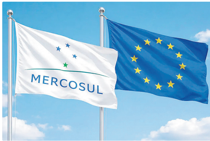
Segundo a CNI, já de início, mais de 5 mil produtos brasileiros terão tarifa zero

Hoje, muitos produtos exportados pelo Brasil enfrentam tarifas ao entrar no mercado europeu, o que encarece