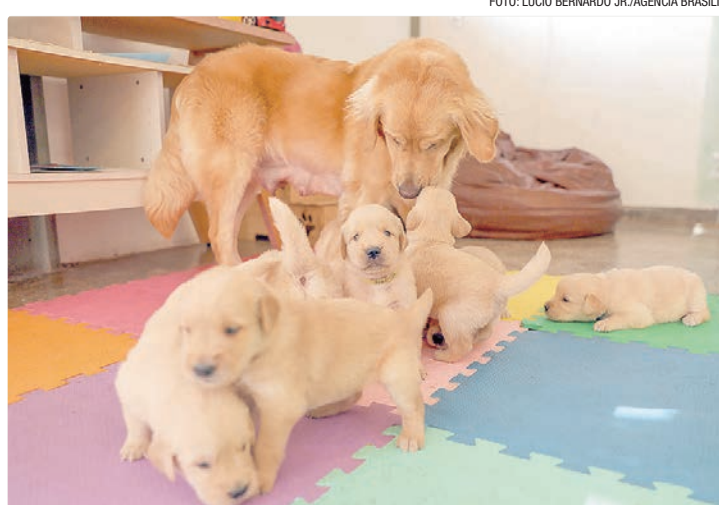
A “Ninhada D” nasceu no Centro de Treinamento de Cães do CBMDF

A “ ninhada D” nasceu no Centro de Treinamento de Cães do CBMDF, a partir de um cruzamento entre cães com familiaridade para o trabalho. Os nomes seguem uma logística de controle: como é a quarta ninhada, todos começam com a quarta letra do alfabeto. São quatro fêmeas e quatro machos, filhos da cadela Águila e do cão Fred. Nos próximos meses, eles serão encaminhados para famílias socia-