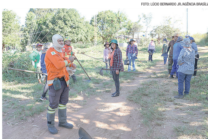
De maio a outubro de 2025, o DF registrou 24% menos incêndios florestais

A atividade combinou orientações teóricas e práticas em campo, com foco em quem vive ou trabalha em regiões mais vulneráveis ao fogo. Durante a tarde, após as aulas teóricas que alertaram sobre o perigo das quei-