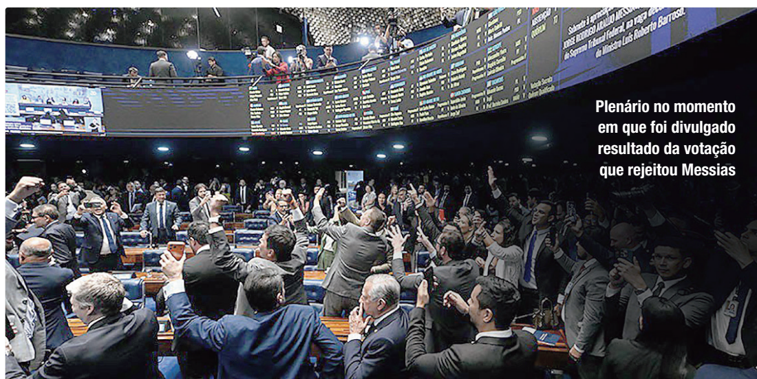
Plenário no momento em que foi divulgado resultado da votação que rejeitou Messias

Para derrubada do veto, serão necessários 257 votos de deputados e mais 41 votos de senadores. A tendência é que a oposição ao governo Lula atinja o número suficiente para tornar lei a redução das penas. Pois, na