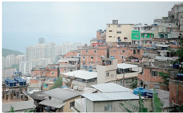
Coleta de preços pela FGV foi realizada entre 21 de março e 20 de abril

“Nos preços ao produtor, o grupo de matérias-primas brutas avançou quase 6%, em decorrência do choque provocado pela guerra. Além disso, observam-se repasses mais relevantes em produtos da cadeia petroquímica, como sacos ou sacolas plásticas