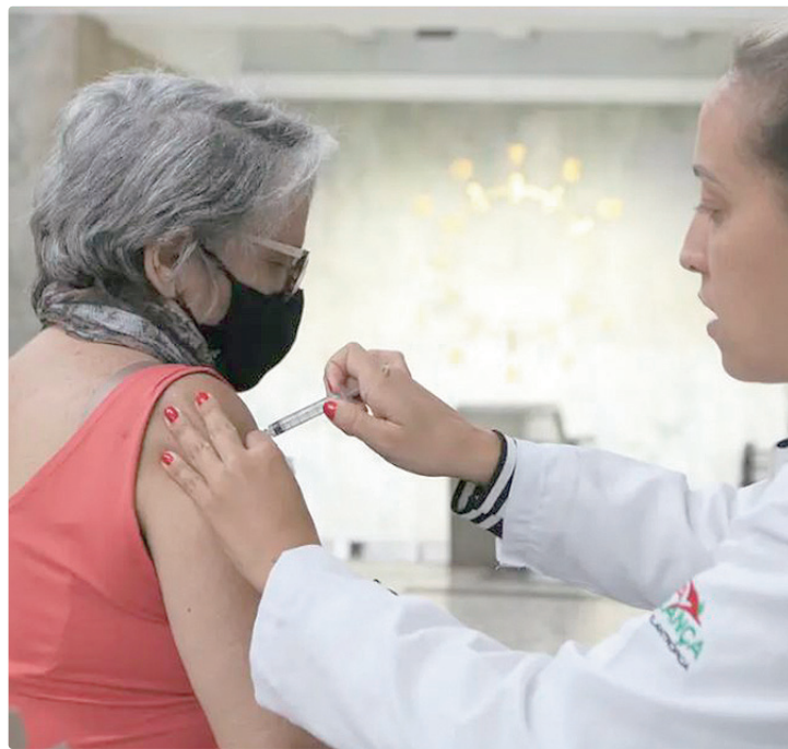
Vírus simultâneos podem levar ao esgotamento do sistema de saúde

“A atividade da Influenza permanece baixa, com sinais iniciais de aumento em alguns países, predominando o vírus A(H3N2)”, informa a organização. Mas, considerando o que ocorreu durante o inverno nos países da parte norte do globo, a Opas alerta que as nações do Hemisfério Sul