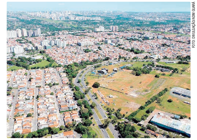
Guará visto do alto: destaque da celebração ocorre na terça-feira

A atualização da programação pode ser conferida no Instagram @adm.guara, onde também são divulgados detalhes dos 30 eventos oficiais.