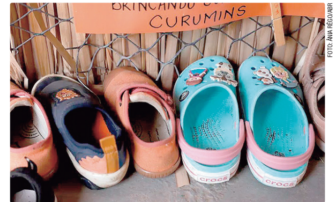
Apenas 12% das escolas conseguem assegurar todos os itens

Na outra ponta, a alimentação é item atendido em todas as escolas de educação infantil no país. Também são analisados elementos de infraestrutura específicos: banheiro infantil, jogos e brinquedos pedagógicos, materiais artísticos, parque infantil e área verde. Considerados esses itens, apenas 12% das unidades públicas de educação infantil do país conseguem assegurar todos eles. Menos da metade das escolas conta com parque infantil (45%) ou com área verde (36%). Jogos e brinquedos pedagógicos – importantes para as atividades educacionais nessa etapa – estão presentes em 83% das unidades. Os dados foram divulgados nesta quarta-feira (29), quando a plataforma QEd passa a contar com dados referentes à educação infantil.