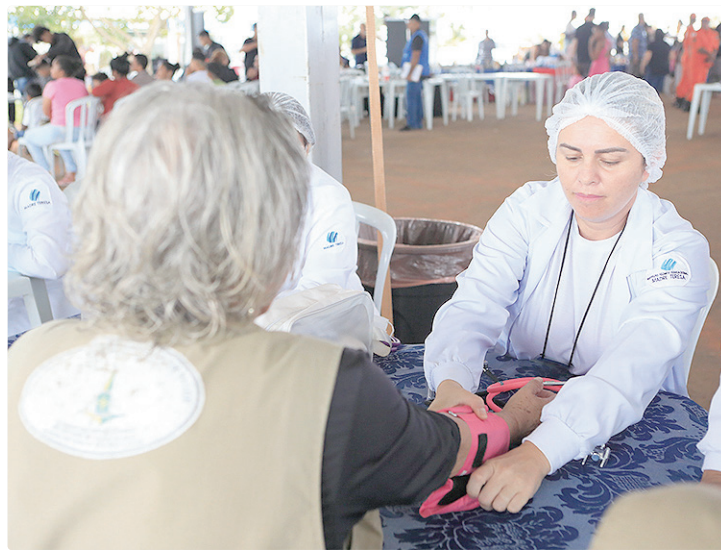
Iniciativa vai beneficiar pacientes de várias especialidades médicas

Segundo as projeções, a iniciativa deve alcançar 208.592 pacientes, com a oferta de 786.589 consultas, exames e procedimentos. Os serviços incluem consultas especializadas, exames de imagem e laboratoriais, ultrassonografia, tomografia computadorizada, ressonância magnética, teleconsultas, atividades físicas orientadas, fornecimento de óculos e procedimentos odontológicos.