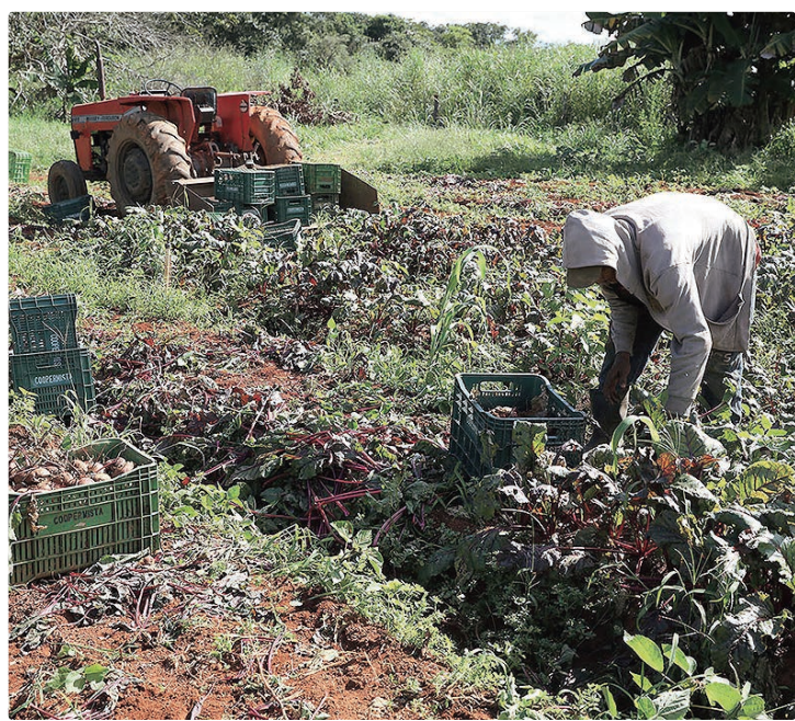
Além de hortifrúti, compras públicas incluem itens com maior valor

Embora seja uma política federal, o Pnae no Distrito Federal tem forte complementação de recursos locais. Em 2025, por exemplo, o repasse da União foi de R$ 32,4 milhões, enquanto o GDF investiu R$ 189,1 milhões. Em 2024, a lógica se repetiu: R$ 62,7 milhões vieram do