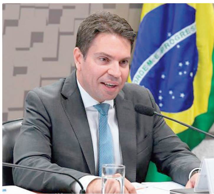
Ramagem está em Orlando (Flórida), onde se escondeu após condenação

“A prisão é fruto da cooperação internacional Brasil-Estados Unidos no combate ao crime organizado. Ramagem é um cidadão foragido da Justiça brasileira e, segundo autoridades norte-americanas, está em situação migratória irregular”, afirmou o diretor-geral da PF, Andrei