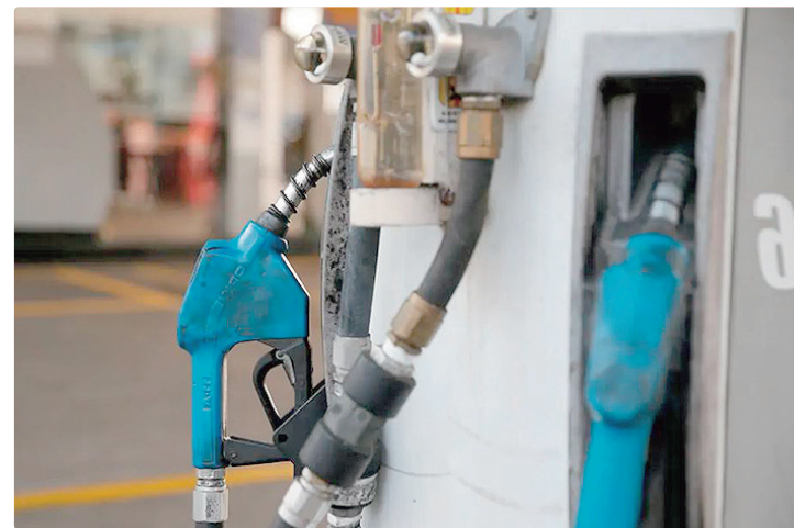
Na semana passada, o preço cobrado nas bombas caiu dois centavos

Na segunda-feira (6), o governo federal anunciou um pacote de medidas para reduzir os impactos da alta dos combustíveis provocada pela guerra no Oriente Médio. Entre as principais medidas está a criação de uma subvenção de R$ 1,20 por litro para a importação de diesel , com divisão igual de custos entre União e estados. Também foi anunciada uma subvenção extra de R$ 0,80 por litro para o diesel produzido no Brasil .