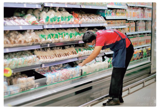
Para repositor de mercadorias são 145 vagas disponíveis hoje

Empregadores e empreendedores que desejem ofertar vagas ou utilizar o espaço das agências do trabalhador para as entrevistas podem se cadastrar pessoalmente nas unidades ou pelo e-mail gcv@sedet.df.gov.br. Pode ser utilizado, ainda, o Canal do Empregador, no site da Secretaria de Desenvolvimento Econômico, Trabalho e Renda (Sedet-DF).