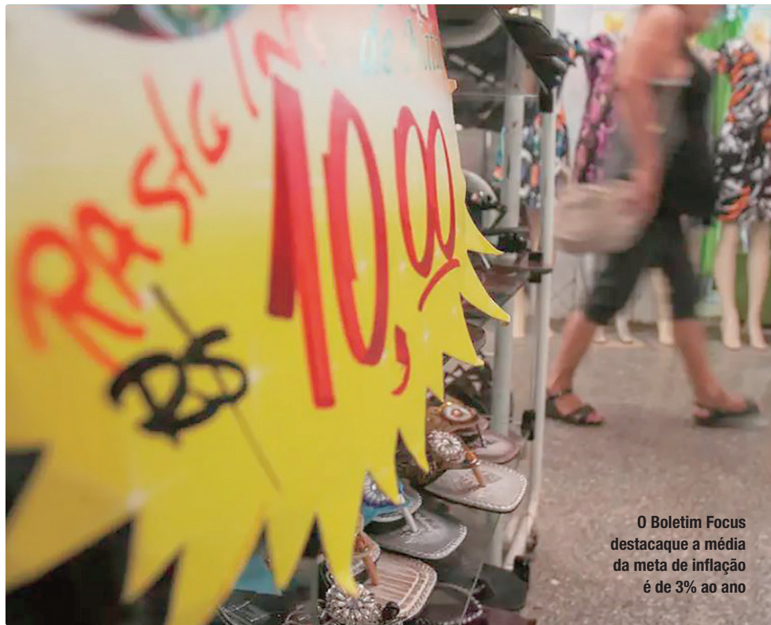
O Boletim Focus destaca a média da meta de inflação é de 3% ao ano

Nesta edição do Focus, a estimativa dos analistas de mercado para a taxa básica até o fim de 2026 permaneceu em 12,5% ao ano. Para 2027 e 2028, a previsão é que a Selic seja reduzida para 10,5% ao ano e 10% ao ano, respectivamente. Em 2029, a taxa deve chegar a 9,75% ao ano.