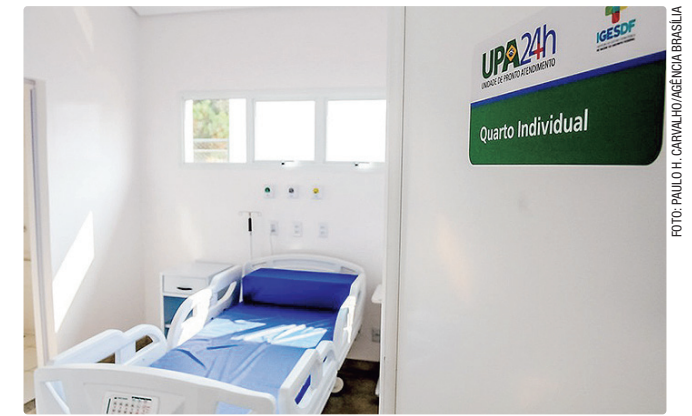
A UPA do Arapoanga dependia da regularização para sair do papel