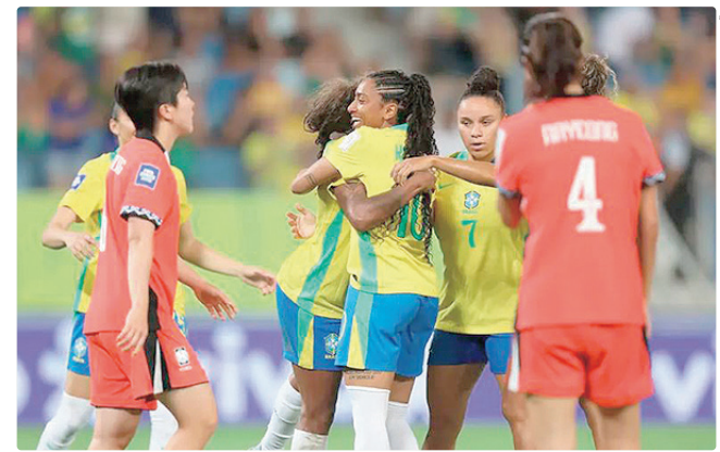
Brasil goleou a Coreia por 5 x 0 na Arena Pantanal, em Cuiabá

Para enfrentar a Coreia do Sul, o técnico Arthur Elias mandou a campo o Brasil com a goleira Lele; as zagueiras Thaís Ferreira, Lauren e Isa Haas; as volantes Duda Sampaio e Ary Borges; a lateral-esquerda Yasmin e quatro atacantes: Dudinha pela esquerda, Gio Garbelini centralizada e Ludmila e Aline Gomes à direita, com esta última um pouco mais atrás.