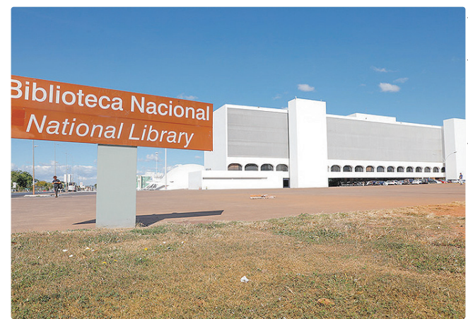
Serviços contemplam pessoas do DF, Minas Gerais e Goiás

A biblioteca reúne atualmente mais de 67,3 mil exemplares, distribuídos em mais 45,7 títulos, e conta com 19 mil leitores cadastrados no serviço de empréstimo. O público é diversificado, com maior concentração entre pessoas de 26 a 50 anos, que somam 11.178 usuários, seguido por leitores de até 25 anos, com 5.613, de 51 a 76 anos, com 1.792.