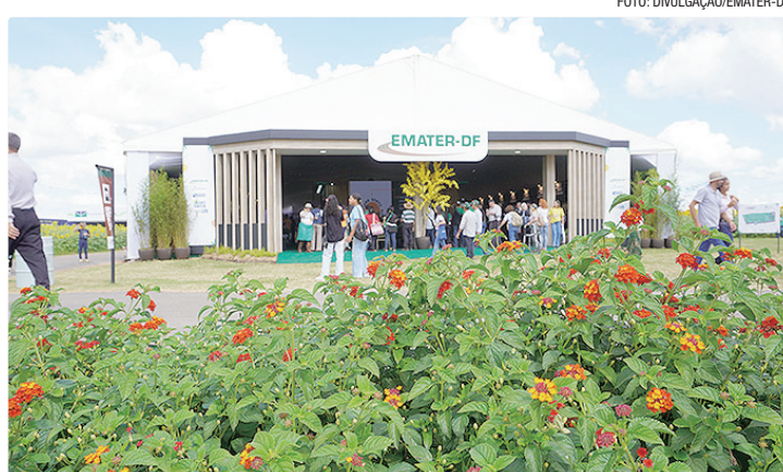
Emater-DF levará soluções de inovação e produtividade para o meio rural

Entre os dias 19 e 23 de maio, no Parque Tecnológico Ivaldo Cenci, no PAD-DF, a programação inclui circuitos de transferência de tecnologia e um pavilhão institucional com comercialização de produtos da agroindústria