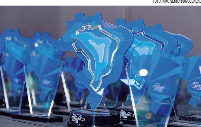
Prêmio reconhece destinos que contribuem para o turismo no Brasil

Brasília também teve destaque indireto na categoria Aeroporto, com o Aeroporto Internacional JK figurando como o melhor do país, refor-