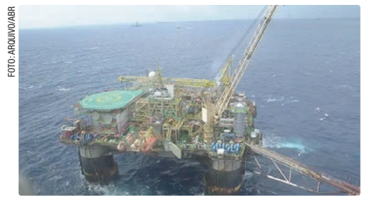
No mês de março, país produziu 5,531 milhões de barris de óleo e gás por dia

Os campos operados pela Petrobras, seja sozinho ou em consórcio, produziram 88,23% de tudo o que foi extraído no mês passado no país. A plataforma da Petrobras Almirante Tamandaré, em Búzios, foi a estrutura que mais ajudou na extração, com 186 mil barris de petróleo por dia.