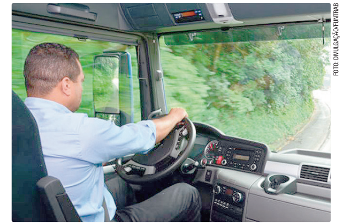
Vaga para motorista carreteiro, em Planaltina, paga R$ 4 mil

Empregadores e empreendedores que desejem ofertar vagas ou utilizar o espaço das agências do trabalhador para as entrevistas podem se cadastrar pessoalmente nas unidades ou pelo e-mail gcv@sedet.df.gov.br . Pode ser utilizado, ainda, o Canal do Empregador, no site da Secretaria de Desenvolvimento Econômico, Trabalho e Renda (Sedet).