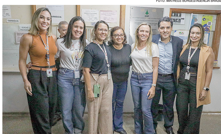
A governadora do DF, Celina Leão, visitou a UBS 1, no Riacho Fundo II

Durante a visita, a governadora autorizou o reforço de 164 profissionais para a rede pública de saúde: 114 médicos da família e comunidade por