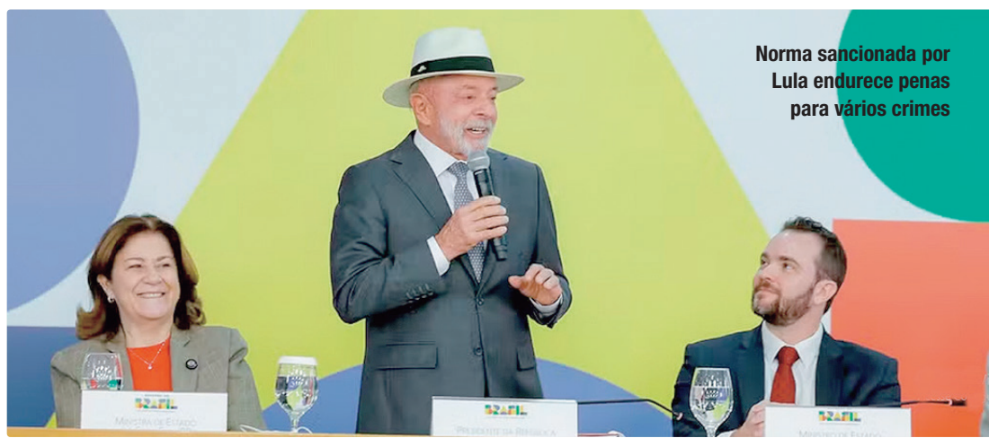
Norma sancionada por Lula endurece penas para vários crimes

Publicada no Diário Oficial da União desta segunda-feira (4), a Lei 15.397, de 2026, tem origem no PL 3.780/2023, do deputado Kim Kataguiri (Missão-SP). O projeto foi aprovado em março no Plenário do Senado, com relatoria do senador Efraim Filho (União-PB), e retornou à