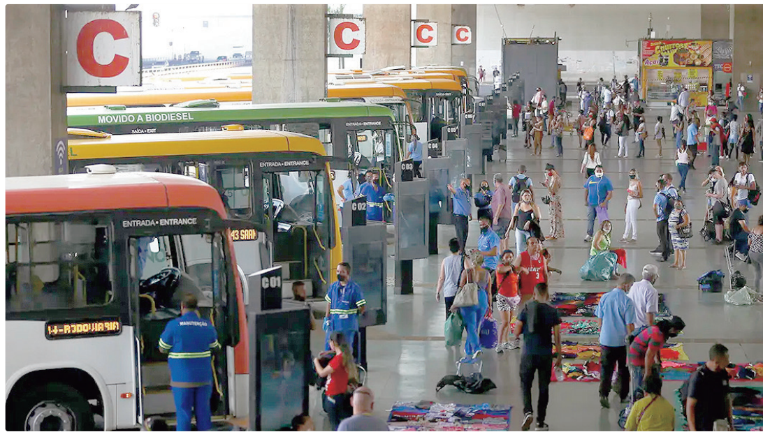
Pesquisadores utilizam dados da Pesquisa Nacional de Mobilidade de 2024 e de indicadores das operadoras de ônibus

Essa gratuidade estaria relacionada ao transporte metropolitano de ônibus e trilhos. Os pesquisadores utilizaram dados da Pesquisa Nacional de Mobilidade, de 2024, e de indicadores das operadoras de ônibus e sistemas metroferroviários.