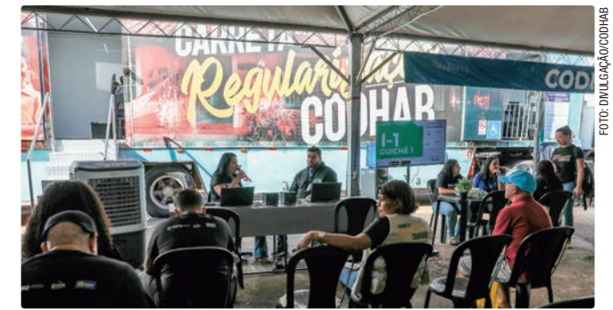
Durante o atendimento, os moradores podem entregar documentos

Mais informações podem ser obtidas pelos telefones (61) 3214-1874 e (61) 3214-1858, além do site oficial https://www.codhab.df.gov.br/ .