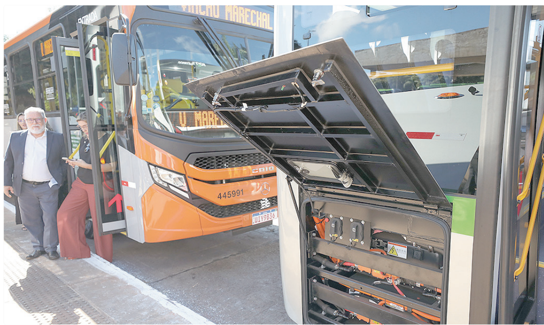
ônibus elétricos da Piracicabana vão atender 67 mil pessoas por dia; DF já tem a maior frota elétrica das capitais

Os veículos serão incorporados à frota da empresa Urbi, que atua na área 3 do sistema e atende Samambaia, Recanto, Riacho Fundo I e II, Núcleo Bandeirante e Água Quente. Já a empresa Marechal vai operar os novos ônibus nas regiões de Águas Claras, Arniqueira, Ceilândia (P Sul), Guará, Park Way e Taguatinga Sul.