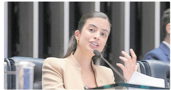
Deputada Tábata Amaral (PSB-SP) será a relatora do PL da Misoginia

“Já demonstramos essa prioridade com um grande volume de projetos aprovados, como o que coloca tornezeleira eletrônica em agressor de mulher, os que endureceram as penas contra quem comete violência contra a mulher, e propostas que previnam a violência”, afirmou. Recentemente, o Congresso aprovou outras pautas de enfrentamento à violência e de proteção às mulheres.