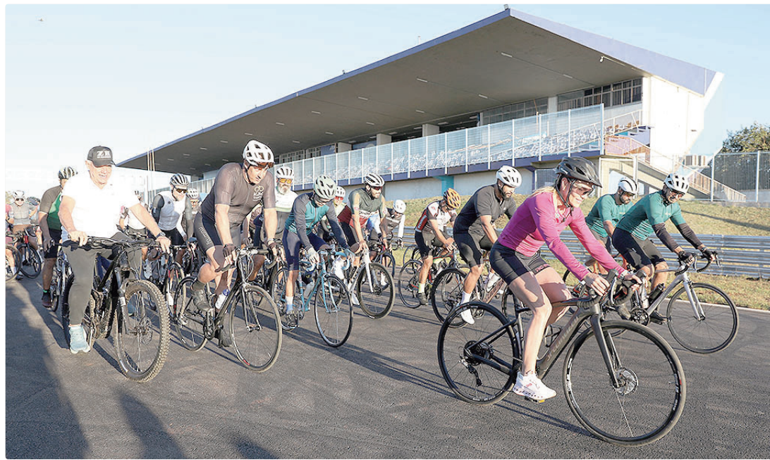
Celina Leão participou da liberação da pista; o espaço estará aberto às terças, quartas e quintas, das 5h às 9h

defendeu o investimento no esporte como política de saúde pública. “Trinta por cento dos atendimentos nas UPAs [unidades de pronto atendimento] no ano passado foram para cuidar de saúde mental. A resposta mais clara para mim é o esporte”, afirmou.