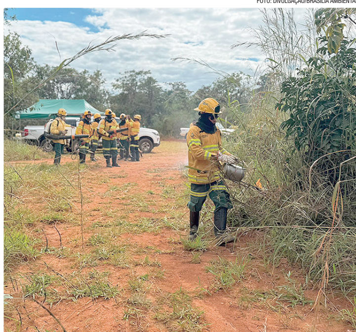
Ideia é reduzir a biomassa acumulada para minimizar riscos de incêndio

A iniciativa faz parte do Plano Estratégico de Preven-