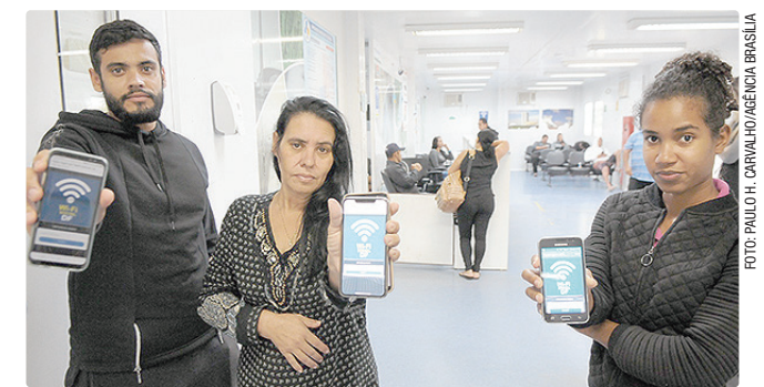
Qualquer pessoa em local onde há o serviço pode acessar a rede

“Todos sabemos que internet virou necessidade básica, que ela democratizou o conhecimento e trouxe mais cidadania a todos. Então, quando entregamos o Wi-Fi Sedes em nossas unidades, além de desburocratizar o acesso aos serviços públicos, também estamos incluindo digitalmente muitas famílias vulneráveis que não contam com internet em suas casas ou aparelhos”, destaca.