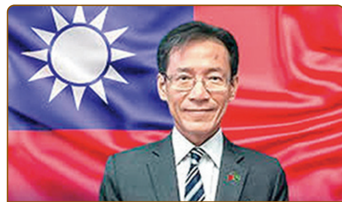
A CASA POLÍTICA e o Monitor da Democracia, hoje de manhã, receberam, no Rubaiyat Brasília, para um café da manhã com lançamento do estudo estratégico sobre a relação Brasil-Taiwan, de autoria do pesquisador Mário Machado. O evento contou com a participação especial do embaixador Benito Liao (foto), representante do governo de Taipé, e do analista da CNN Brasil, Caio Junqueira.