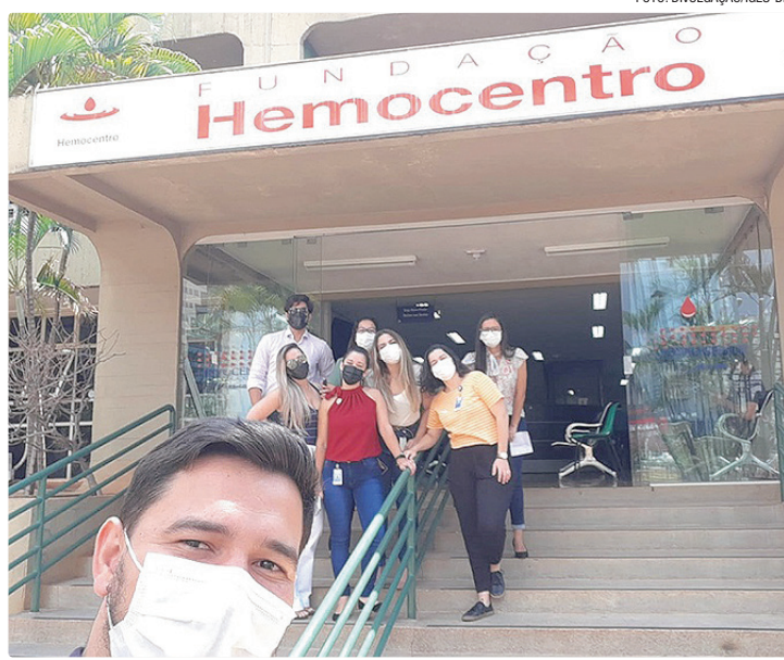
Quem quiser doar pode fazer agendamento prévio ou ir direto ao MTE

A ação facilita o gesto de doar para quem nunca esteve em um hemocentro. O agendamento prévio pelo site AgendaDF é recomendado, mas doadores sem agendamento