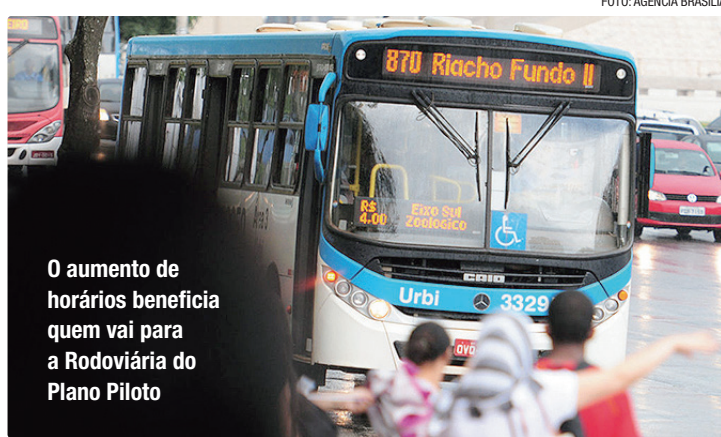
O aumento de horários beneficia quem vai para a Rodoviária do Plano Piloto

Na linha 806.3, que faz o percurso circular Riacho Fundo II/Parque do Riacho (Condomínio 42), serão criadas