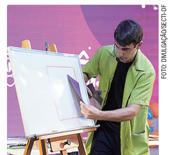
O evento visa o conhecimento em todas as faixas etárias

A estrutura contará com diversas estações temáticas que convidam o público à interação. Entre elas, o espaço Einstein Júnior, dedicado a experimentos e oficinas práticas, além do ônibus Viagem Insólita, que simula uma experiência espacial por meio de realidade virtual. A programação inclui ainda o Domo Planetário, o Desafio Espacial e a Arena Gamer.