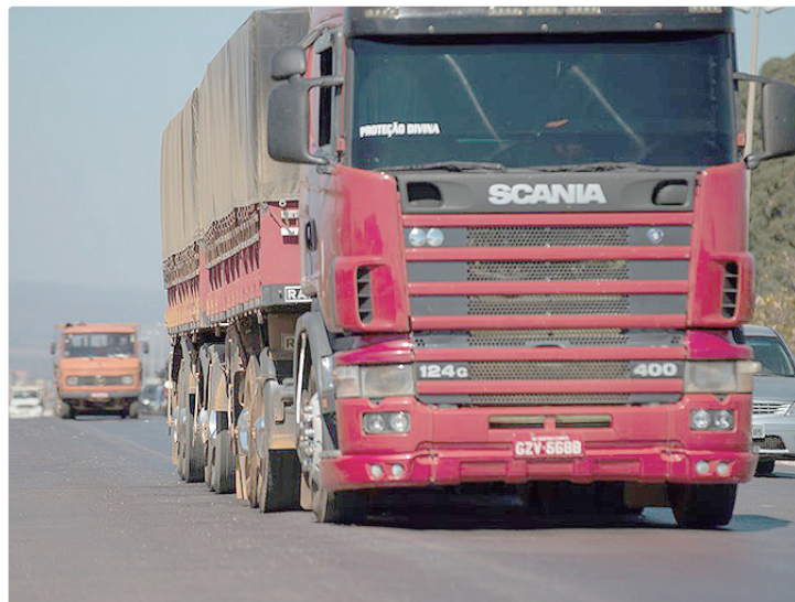
Veículos financiados devem seguir padrões ambientais definidos pelo Proconve

O financiamento será oferecido por bancos e instituições financeiras autorizadas pelo Banco Nacional de Desenvolvimento Econômico e Social