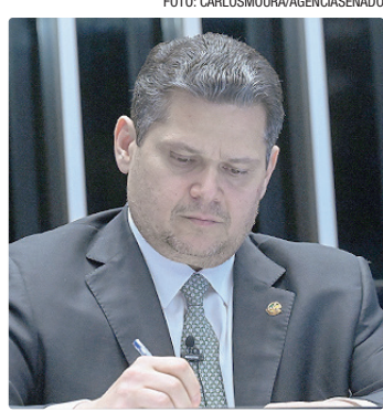
Governistas atribuem a Alcolumbre parte das derrotas do governo

Apesar da articulação, a avaliação dentro do Planalto é a de