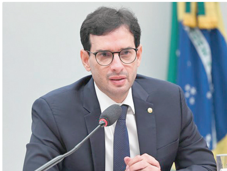
Pelo cronograma de Prates, primeiro debate será com o ministro do Trabalho

“A minha luta vai ser sempre a de construir consensos, com cronograma ágil para atender a votação esperada por essa Casa e pelo Brasil no dia 27 de maio.”