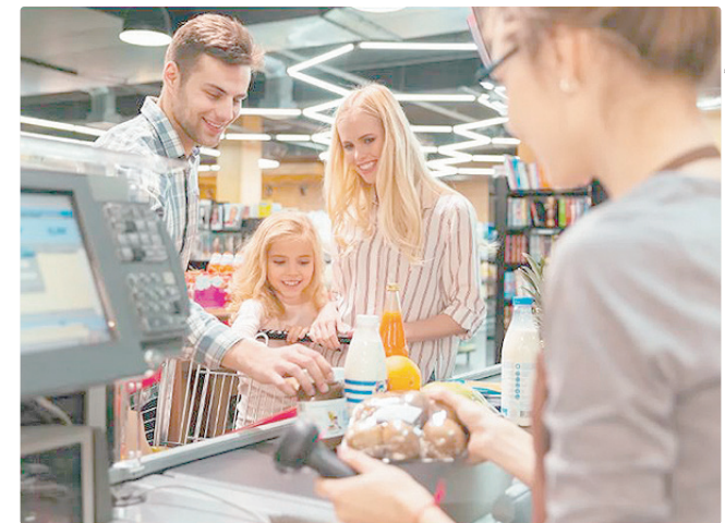
Estão disponíveis 30 vagas para operador de caixa, por R$ 1.621

Empregadores e empreendedores que desejem ofertar vagas ou utilizar o espaço das agências do trabalhador para as entrevistas podem se cadastrar pessoalmente nas unidades ou pelo e-mail gcv@sedet.df.gov.br . Pode ser utilizado, ainda, o Canal do Empregador, no site da Secretaria de Desenvolvimento Econômico, Trabalho e Renda (Sedet).