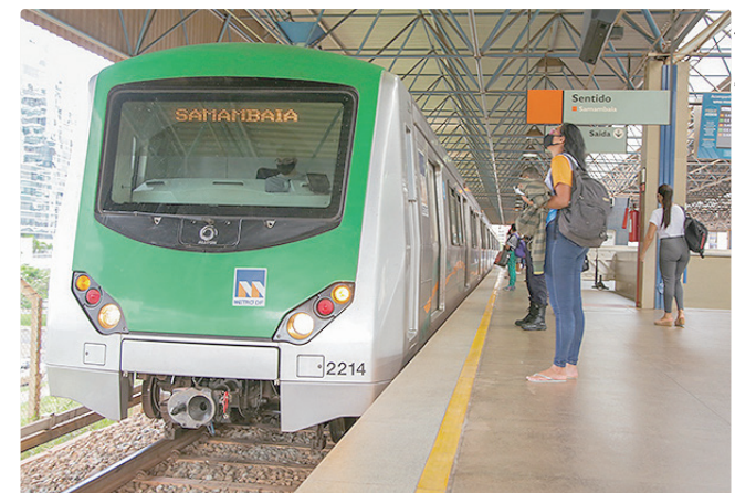
As duas estações recebem a média de 345 mil pessoas por mês