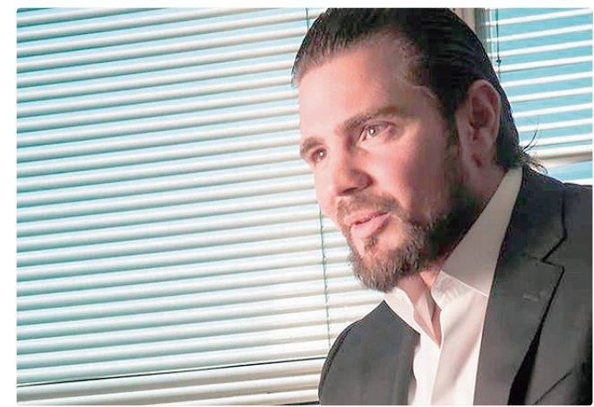
Proposta de delação é separada por anexos divididos em personagens

Após a entrega da proposta, a equipe de investigação faz análise para saber se tem valor probatório e começa a marcar datas de depoimentos antes de enviar o documento ao STF (Supremo Tribunal Federal).