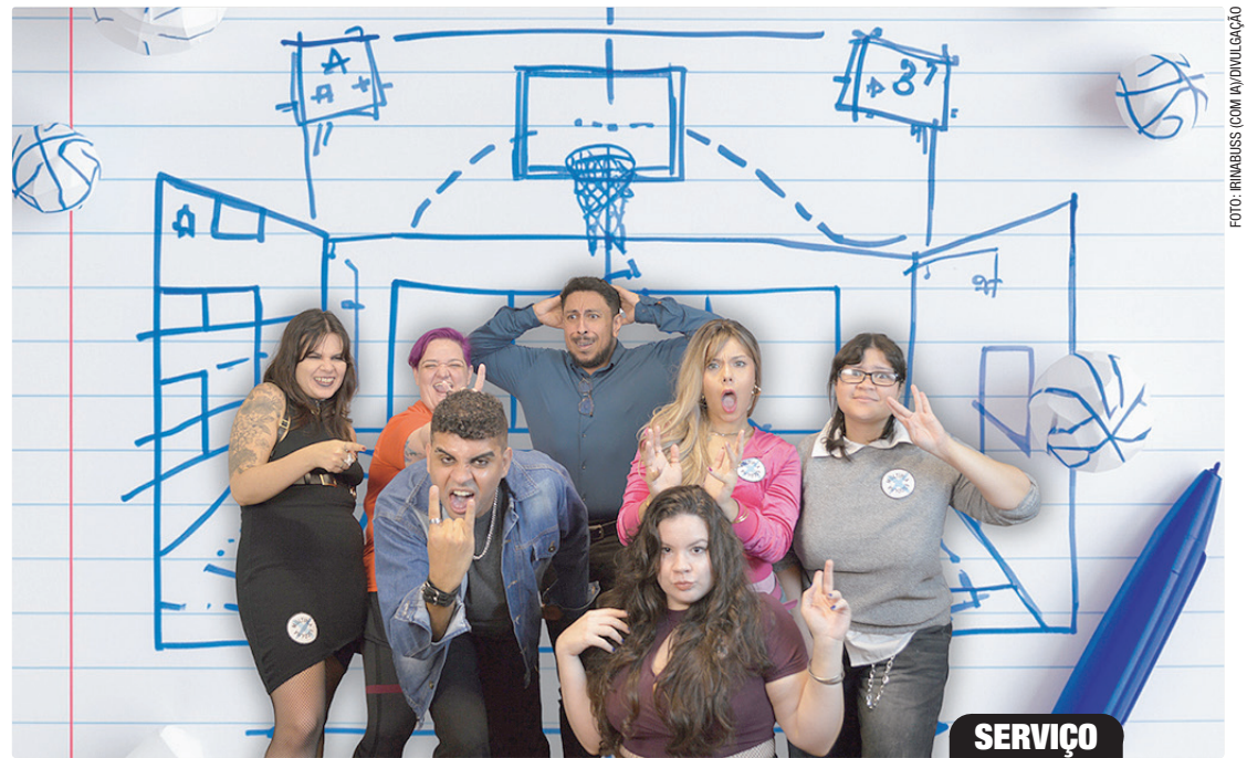
Estreia acontece na próxima quinta-feira (7), na Casa dos Quatro (708 Norte)